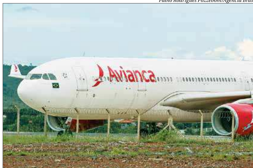
A Avianca Brasil foi uma das empresas a entrar com pedido de recuperação judicial

As empresas também vão ter direito a negociar diretamente