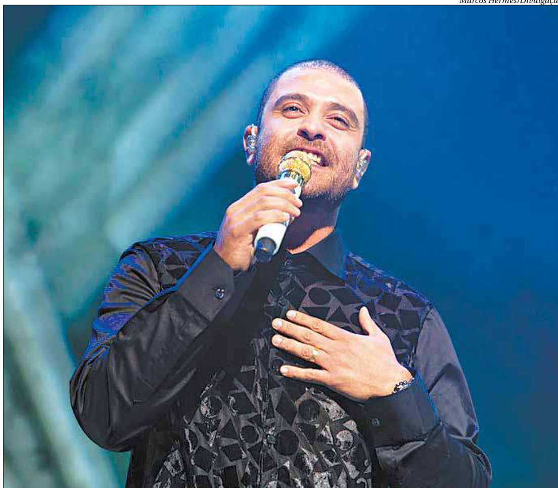
Diogo Nogueira interpretará seus maiores sucessos, clássicos do samba e da MPB, em dois shows no Vivo Rio

Diogo mostrará músicas que estão em seu último álbum, “Munduê”, como a canção “Coragem” e “Tempos Difíceis”, e alguns de seus maiores sucessos, como “Alma Boêmia”, “Clareou” e o grande hit “Pé na Areia”, que atualmente tem mais de 40 milhões de visualizações no YouTube. “Munduê” é um álbum totalmente autoral, que celebrou os seus dez anos de carreira, e é um