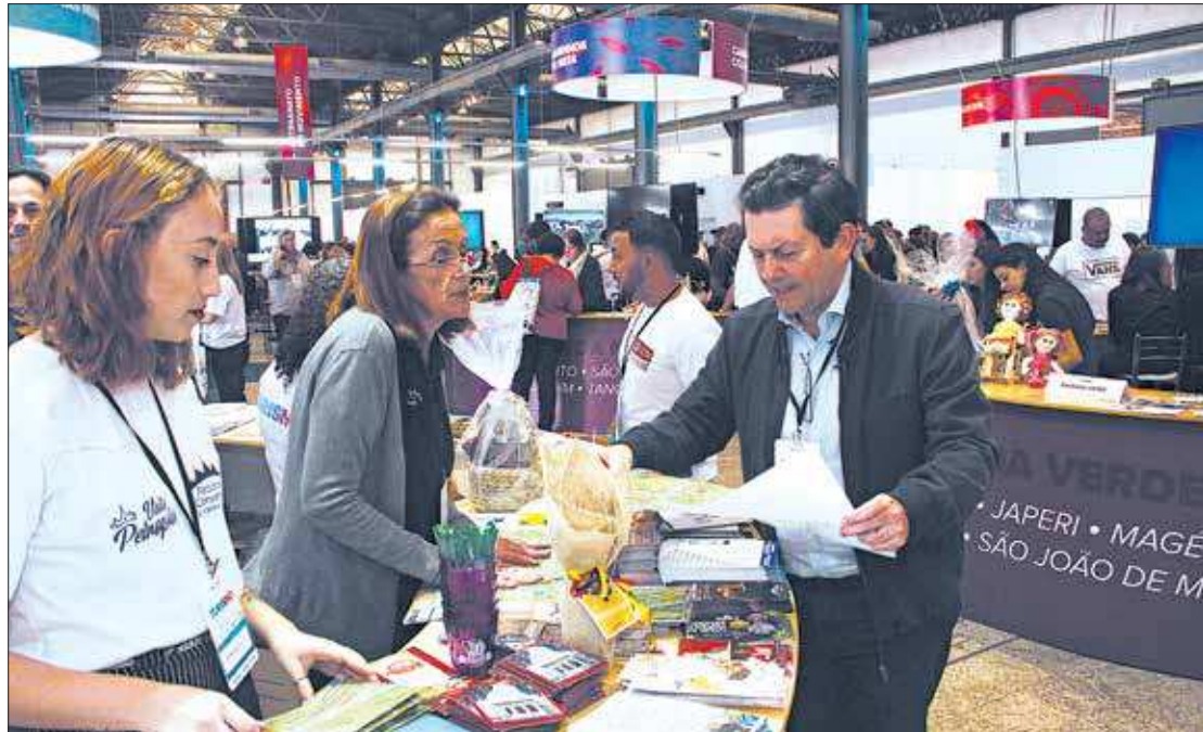
Otávio Leite, secretário estadual de Turismo, conversa com expositores durante o Salão Estadual de Turismo, na Zona Portuária

"Em termos de público, fomos surpreendidos. Para se ter uma ideia, no segundo dia, no início do evento, já estava cheio. Esta é a constatação de que o projeto é vitorioso. O interior do estado está tendo a oportunidade de ser visualizado em uma dimensão grande,