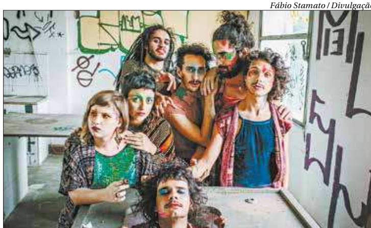
Os grupos possuem características marcantes, mesclando sons pop e regionais

O grupo Lamparina e a Primavera mistura o toque dos tambores e arranjos bem trabalhados, revelando o en-