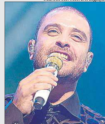
Diogo Nogueira: álbum "Mundê"