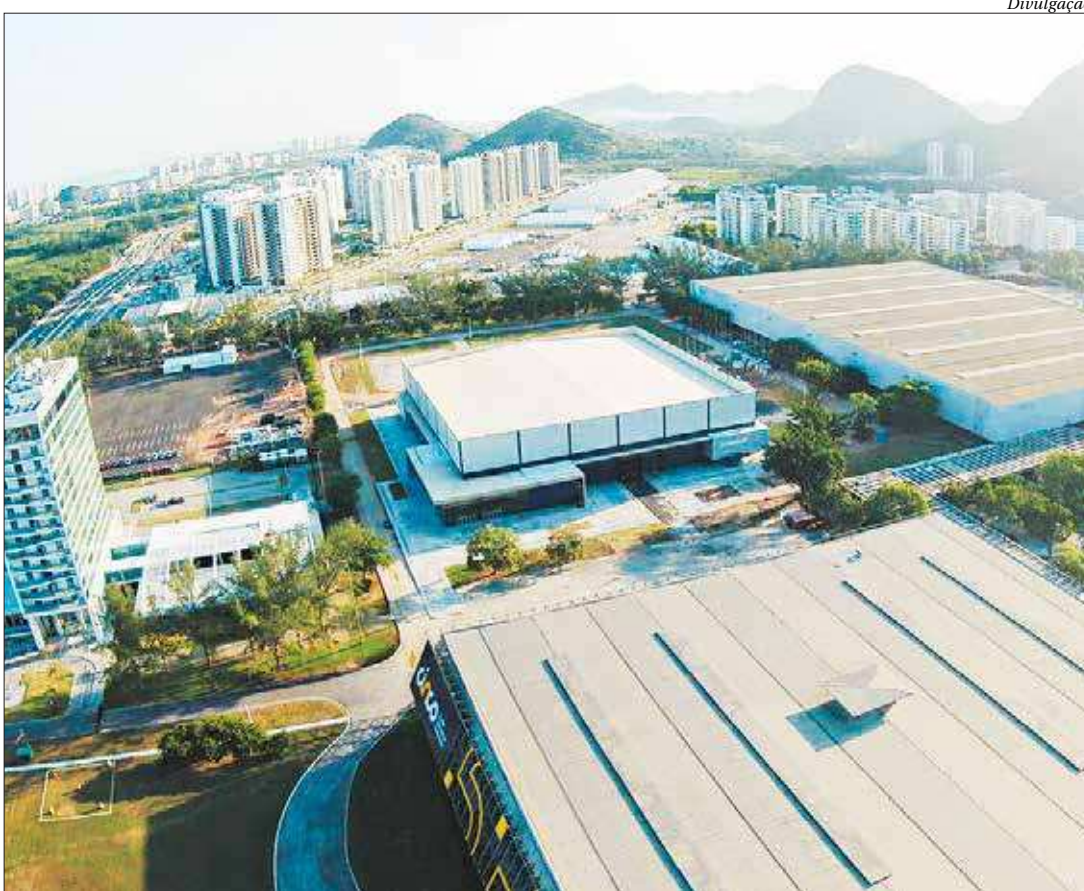
Espaço para percorrer e programação não vão faltar na Bienal, que terá área cenográfica de 500 m² para a garotada

“Estamos aqui para promover a reflexão, estimular o hábito da leitura e transformar o país. Temos como prioridade que a Bienal do Livro Rio é um “evento para todos os públicos”: crianças, adolescentes, adultos, pessoas que gostam de ler, as que ainda não têm o hábito de leitura ou que têm contato com a leitura de forma individual, associada a um tema do seu interesse, como games e histórias policiais. Nesta edição, optamos por trabalhar com categorias bem segmentadas, para reforçar a lógica de criar uma bienal para cada público. Desta forma, consolidamos o posicionamento de que a