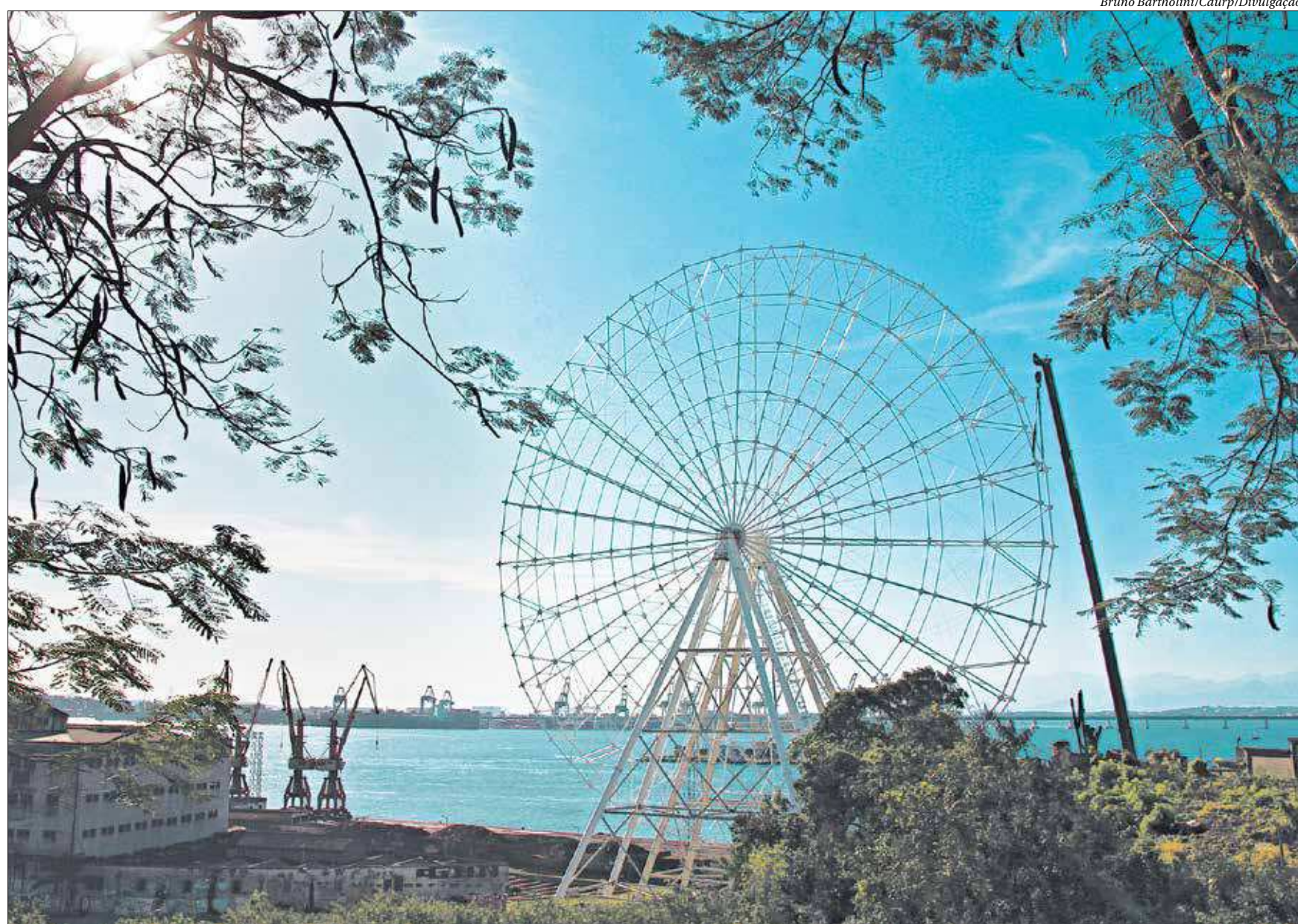
Roda-gigante da Zona Portuária terá vista panorâmica para pontos turísticos do Rio e promete ser mais um grande atrativo na região central da capital, já recheada de programas culturais