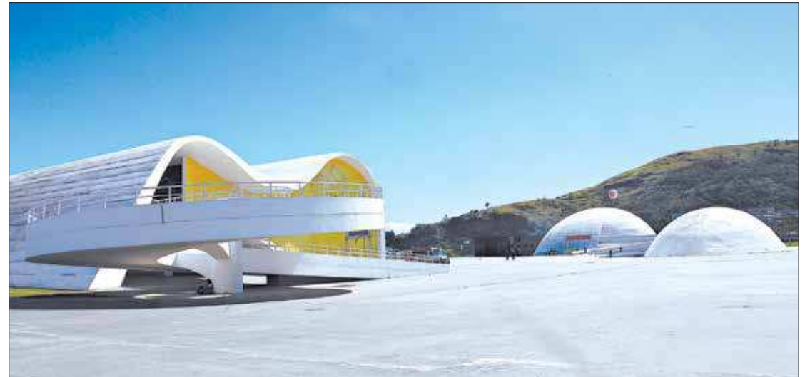
Contrato prevê manutenção das redes elétrica, hidráulica e de esgoto, além de limpeza geral e pintura

Também serão feitas trocas de lâmpadas externa e interna, troca do alambrado, reparos nos equipamentos de ar condicionado e manutenção do jardim. Aproximadamente 20 funcionários