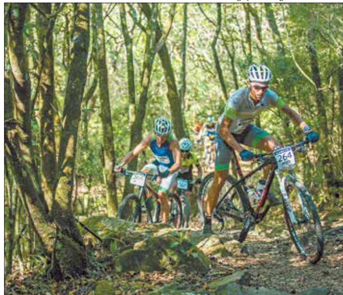
Ao todo, são 1.200 atletas inscritos na competição na Região Serrana

A atração musical fica no comando do músico Rodrigo Santos, ex-integrante do Barão Vermelho. O artista vai se apresentar às 14h, neste domingo. No repertório, os maiores sucessos do cantor e baixista, como “Exagerado”, “Pro Dia Nascer Feliz” e “Bete Balanço”, além de suas canções autorais. A atração é gratuita.