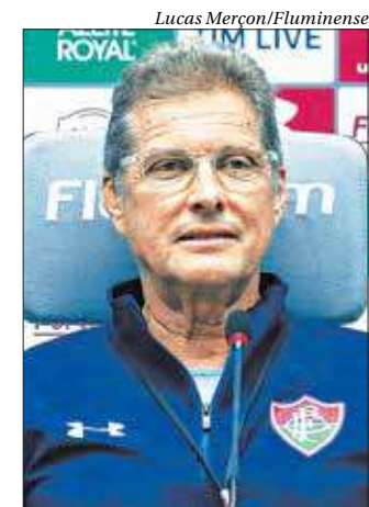
Treinador iniciou os trabalhos ontem no comando tricolor

Jorge Jesus deve comandar dois treinos antes da decisão, e vai aproveitar para testar todas as possibilidades de armar uma