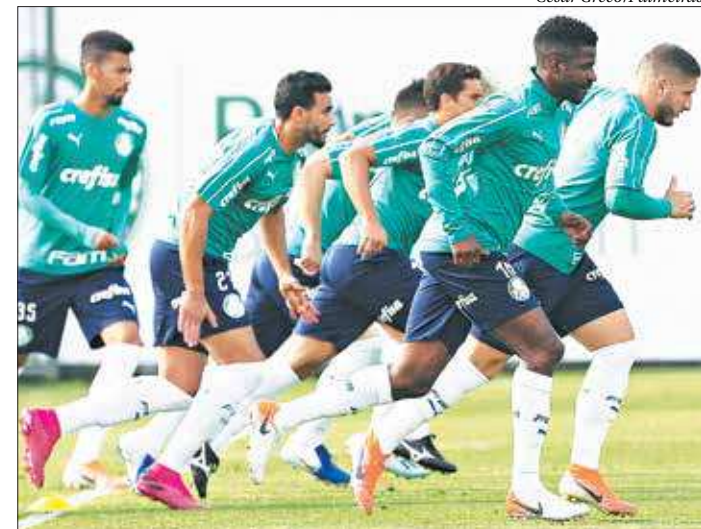
O Palmeiras venceu a partida de ida por 1 a 0, na casa do Grêmio

“O Grêmio é sempre ofensivo, joga se movimentando, gosta de jogar com a bola. A