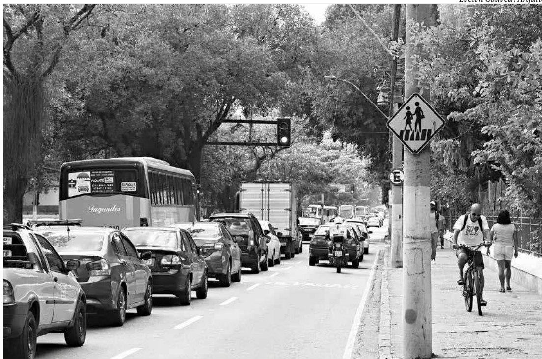
Evelen Gouvêa / Arquivo

Os motoristas também devem ficar atentos às mudanças nos retornos. Quem sai da Rua Evilásio Silva em direção à São