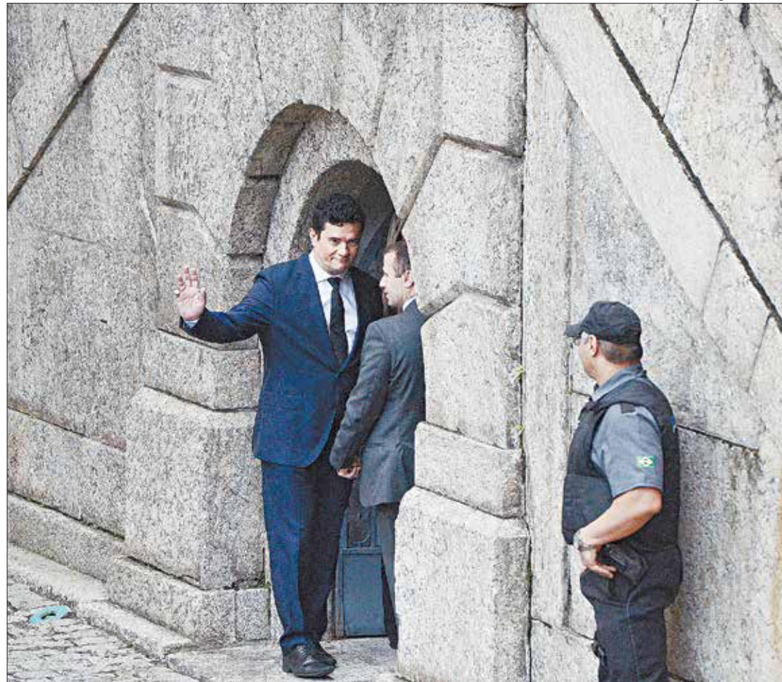
O ministro da Justiça, Sergio Moro, visita o Arquivo Nacional, na região central do Rio, antes de ir à sede da Polícia Federal

Nos últimos dias, o comando da PF no Estado do Rio tem sido alvo de polêmicas envolvendo o ministro e o presidente Jair Bolsonaro, que fez questão de interferir diretamente nas indicações para a chefia. O ministro Sérgio Moro também chegou e saiu da PF sem falar com os jornalistas que acompanhavam sua visita ao Rio.