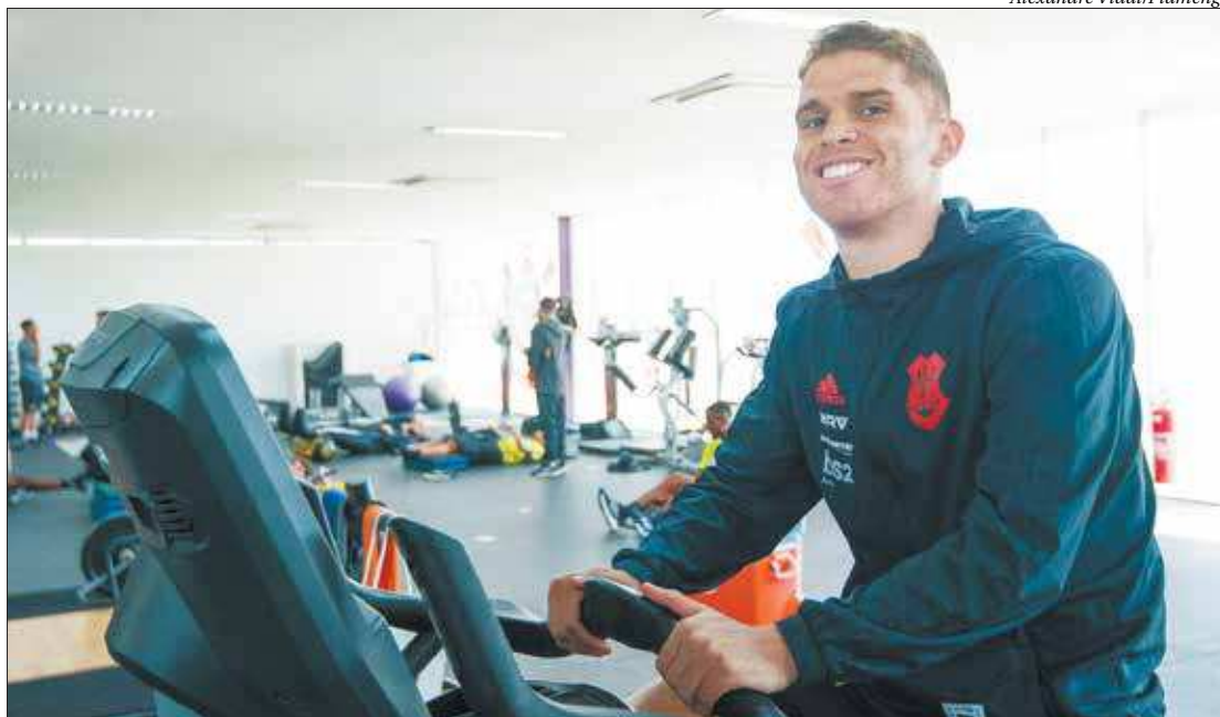
Volante embarcou para Porto Alegre para se juntar ao elenco rubro-negro e se tornou mais uma opção de Jorge Jesus

Toda a confusão começou por causa do desejo de Cuéllar de deixar o futebol brasileiro. O problema é que a negociação entre Flamengo e Al-Hilal, da