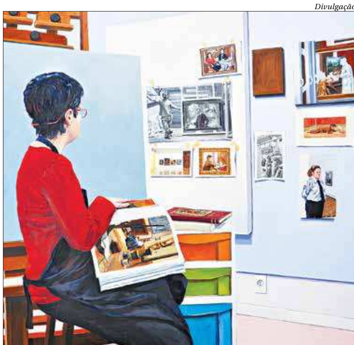
Mostra conta com instalações temáticas, como "História da Arte" e "Iniciação"