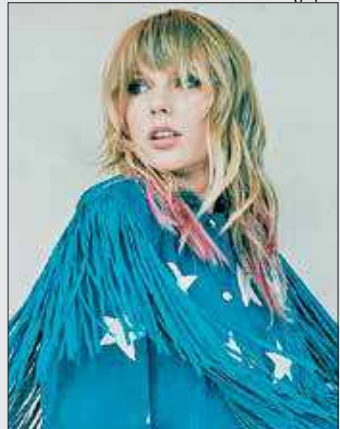
Artista aborda o amor nas relações