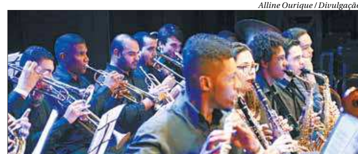
A Orquestra Aprendiz associa sua força sonora ao gingado brasileiro