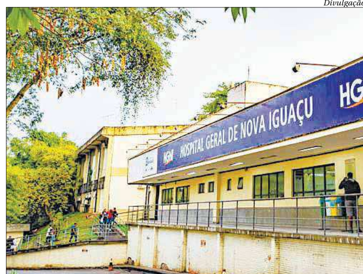
Investimentos são destinados para seis áreas de atuação da saúde estadual

"O Estado está novamente assumindo seu papel de levar a saúde para próximo do cidadão, influenciando, através de políticas tecnicamente corretas, que os municípios