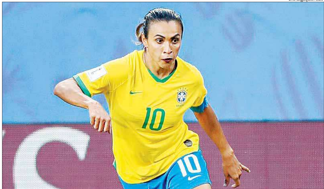
Exames do Orlando Pride constataram lesão muscular do biceps femoral de grau 2, na coxa esquerda da atleta brasileira

A treinadora do Brasil recebeu das mãos do diretor de futebol são-paulino uma camisa personalizada do clube, com direito a seu nome e o número 10, e o momento foi registrado pelas redes sociais do Tricolor. ■