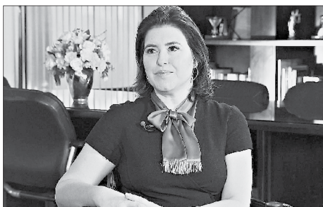
Senadora Simone Tebet defende uma grande coalizão de centro

A presidente da Comissão de Constituição e Justiça (CCJ) do Senado, Simone Tebet (MDB-MS), defendeu a formação de uma grande coalizão de centro para ajudar o país a sair dos extremismos de esquerda e direita. Para ela, o MDB é o partido capaz de unir forças e conversar com todas as correntes ideológicas. "Muito em breve, o MDB vai ser chamado novamente a fazer parte da história. Quando as democracias no mundo se enfraquecem, é necessário um grande partido de centro para chamar à razão", afirma. A senadora admite, porém, que o MDB precisa fazer um mea-culpa.