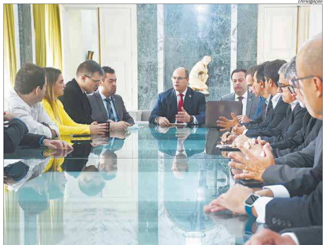
O governador Wilson Witzel em reunião com deputados federais no Palácio Guanabara. Destaque foi a segurança

"O Segurança Presente tem ajudado muito o comércio no combate aos pequenos furtos, roubos de rua e realiza prisões de algumas pessoas que estão com mandado de prisão em aberto. O programa também ajuda a população em situação de rua com as assistentes sociais, tornando as ações muito mais acolhedoras", falou Witzel, que lembrou que a iniciativa chegará, até dezembro deste