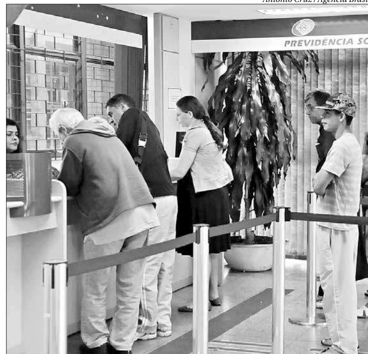
Pagamento da 1ª parcela será depositado junto com a folha mensal de agosto

"É o cronograma normal de pagamento. Você recebe sua aposentadoria, ou sua pensão, acrescido dos 50% [do décimo terceiro]", disse o secretário especial de Previdência e Trabalho do Ministério da Economia, Rogério Marinho, ao anunciar a medida no último dia 5 de agosto, em entrevista à imprensa.