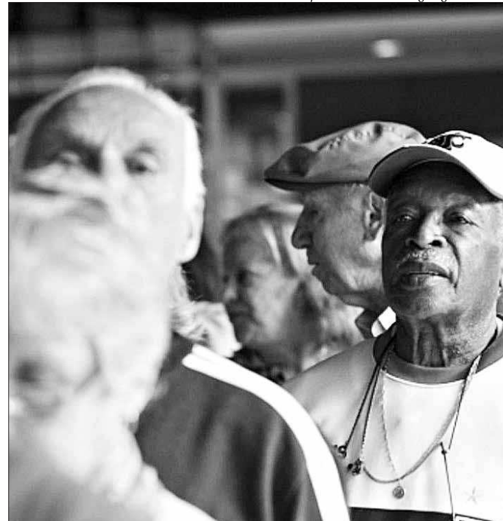
Caixa começou nesta segunda (26) a pagar PIS para cotistas a partir de 60 anos

Segundo a Medida Provisória (MP) 889/2019, os