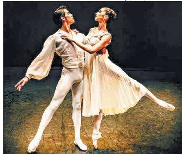
O balé clássico está entre as modalidades do festival da Região dos Lagos

As inscrições seguem até o dia 31 de agosto no site www.festivalonline.com.br .