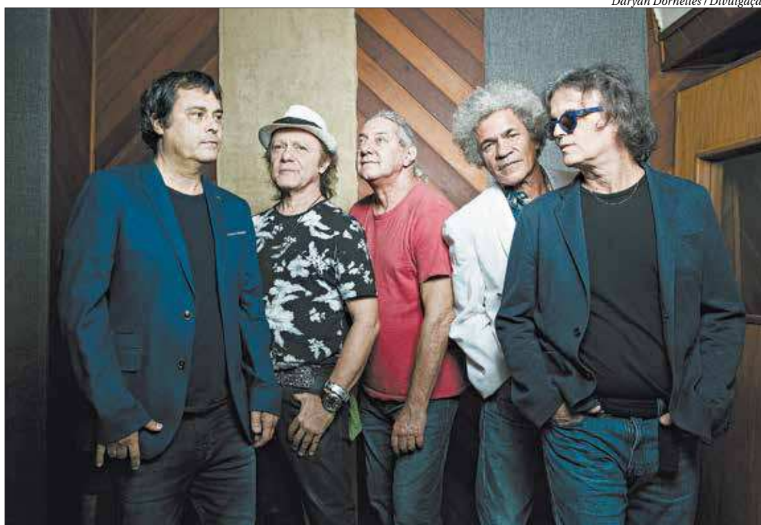
Nascida de dissidência dos Novos Baianos, a banda A Cor do Som coleciona vários sucessos em 40 anos de carreira

"Os nossos 40 anos são uma coisa espetacular, acredito que somos uma das poucas bandas no mundo que ainda estão juntas, apesar de um hiato aqui e acolá, mas estamos juntos sempre tocando num astral maravilhoso. A nossa sintonia, o nosso astral em tocar juntos, por isso que estamos até hoje. Isso é maravilhoso, a gente poder estar vivo, junto, com saúde, tocando bem, a mesma harmonia, a mesma empatia de nós todos, a amizade, é isso que traz a longevidade, acho que conseguimos coisas maravilhosas que pouca gente tem nesse mundo", expôs o baterista.