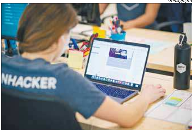
Jovens contarão com condições especiais para cursos na área de tecnologia

De 12 a 14 de setembro, a instituição promove a 13ª Expo Franchising ABF Rio, no Centro de Convenções Sulamérica, no Centro da capital, que reunirá empreendedores de todo o país. O evento irá disponibilizar as diversas opções de como se inserir neste mercado, tanto no Rio como em outras regiões. ■