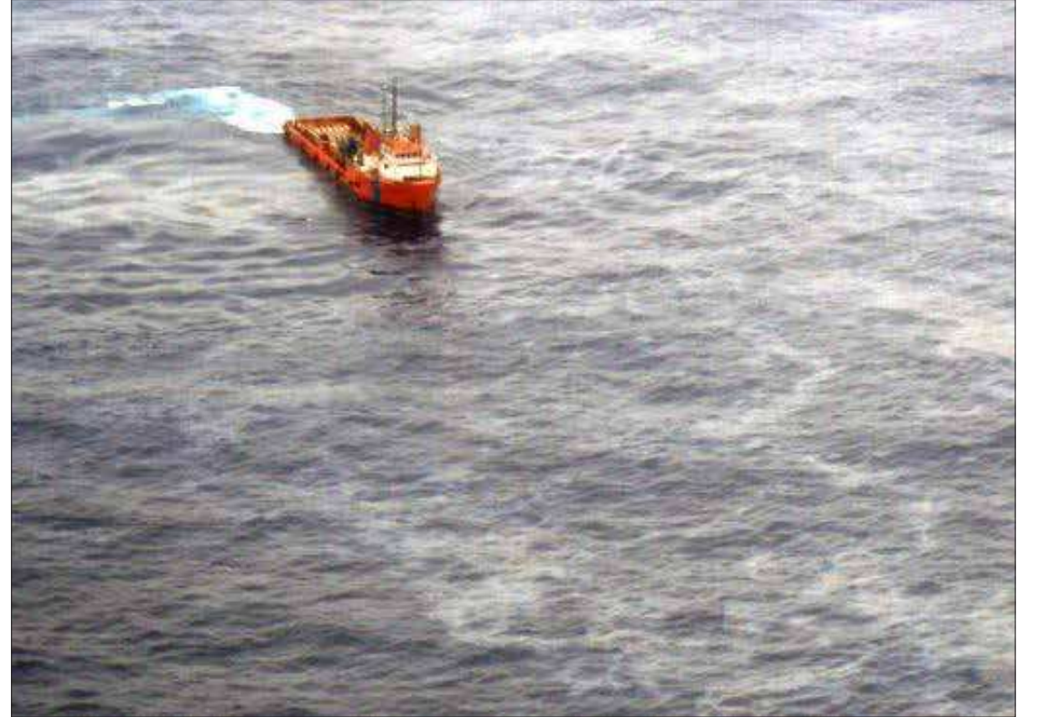
Petrobras confirma novo vazamento de óleo na Bacia de Campos na região Norte do Estado do Rio de Janeiro

Fora de operação – Segundo a petroleira, a FPSO Cidade do Rio de Janeiro está fora de operação desde o ano passado e em processo de