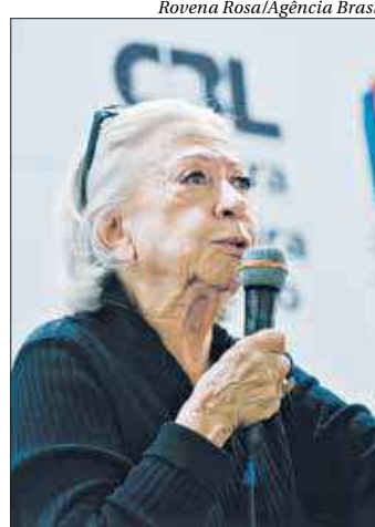
Fernanda Montenegro está no elenco vivendo o papel de Eurídice