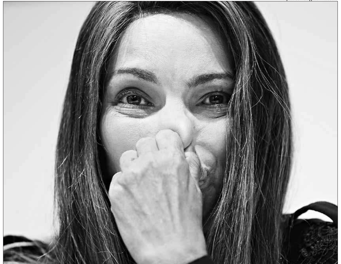
Segundo a polícia, Flordelis “apresentou versões contraditórias” e “omitiu informações relevantes”

não foram encontrados. A polícia suspeita que eles tenham sido jogados no mar de Piratininga por uma das netas do casal.