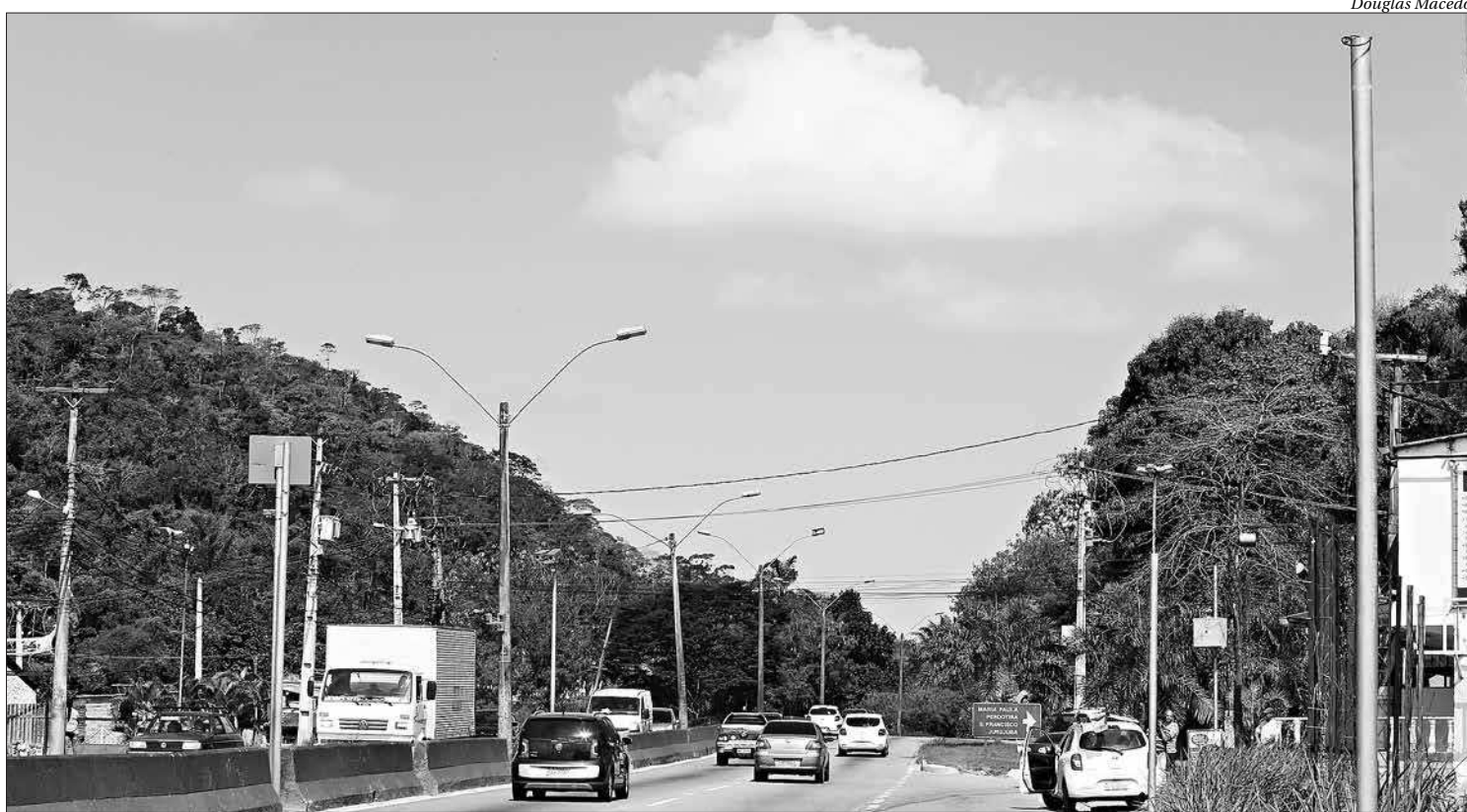
Radar da entrada do Rio do Ouro na RJ-106, sentido Maricá, foi retirado ontem. Moradores reclamam da dificuldade para atravessar a via que é muito movimentada

De acordo com um funcionário que presta serviço ao DER, o primeiro radar a ser removido foi o do quilômetro 6,7 da RJ-106, no Rio do Ouro, em direção a Maricá. No entanto, o ponto é considerado por moradores da região como um trecho perigoso para pedestres e motoristas devido ao intenso movimento no trânsito diariamente.