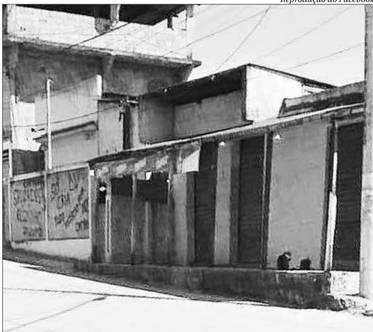
Comércio amanheceu de portas fechadas no bairro Engenho Pequeno