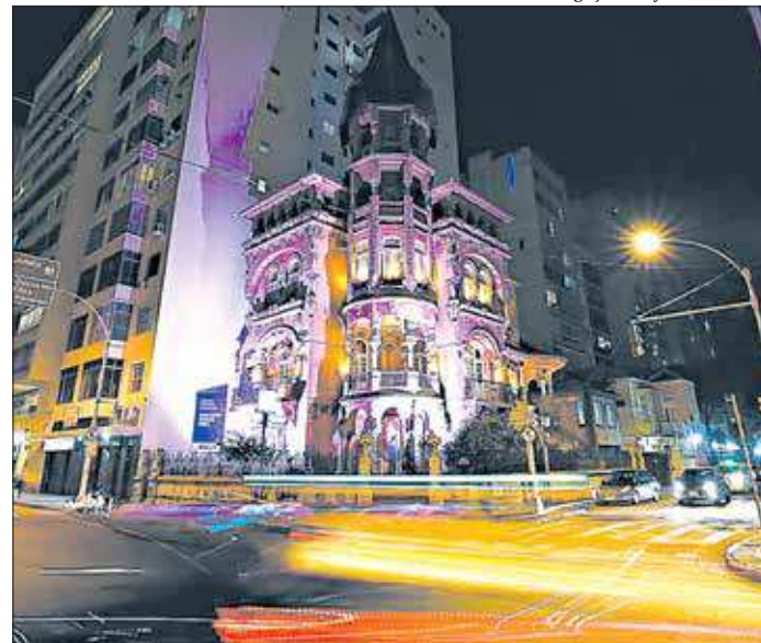
O espetáculo é apresentado no local de quinta a domingo, às 19h

O Castelinho fica na Praia do Flamengo. Ingressos a partir de R$ 20.