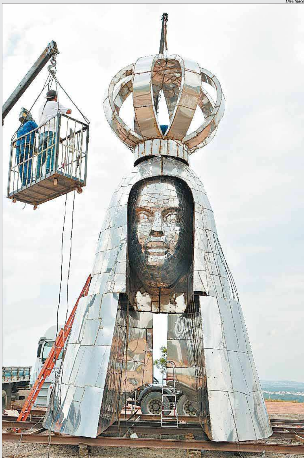
Escultura de Nossa Senhora Aparecida precisa de doação de material para ser inaugurada no dia 12 de outubro, em São Paulo