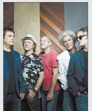
Amigos, músicos comemoram o fato de tocarem juntos por tanto tempo