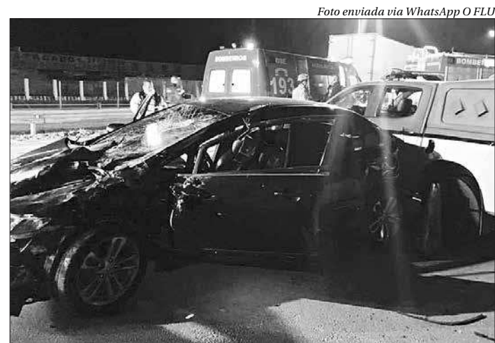
Acidente com vítimas ocorreu no trecho da rodovia em São Gonçalo

A investigação sobre o abandono do bebê será conduzida pela 73ª DP (Neves), que tentará localizar os pais da criança que, assim que identificados, responderão criminalmente. O aspirante Braga afirmou que buscas já foram feitas nas proximidades do local onde Pedro foi deixado, mas sem sucesso.