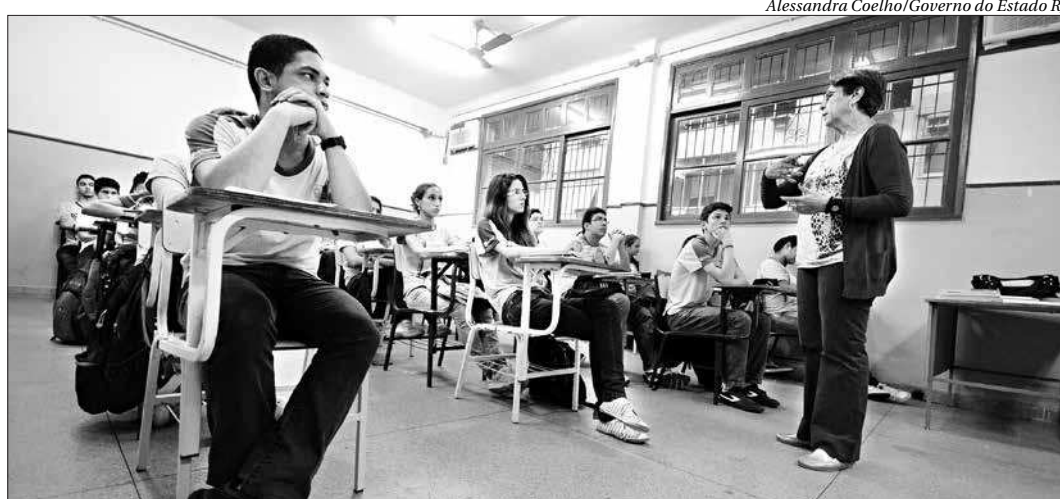
Mais de 75 mil alunos da rede estadual de ensino serão beneficiados com as unidades em horário integral

Para fazer essa ampliação, a secretaria lançou em julho o Programa Escola pra Vida, em parceria com a Fundação de Apoio à Escola Técnica (Faetec), o Instituto