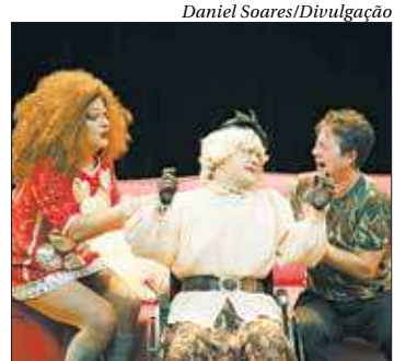
Idosa rica, prestes a morrer, quer reencontrar neto desaparecido