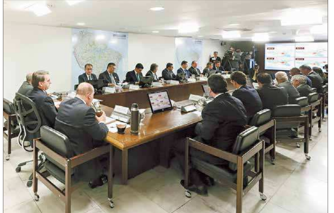
O presidente Jair Bolsonaro se reúne com os nove governadores dos estados que compõem a Amazônia Legal