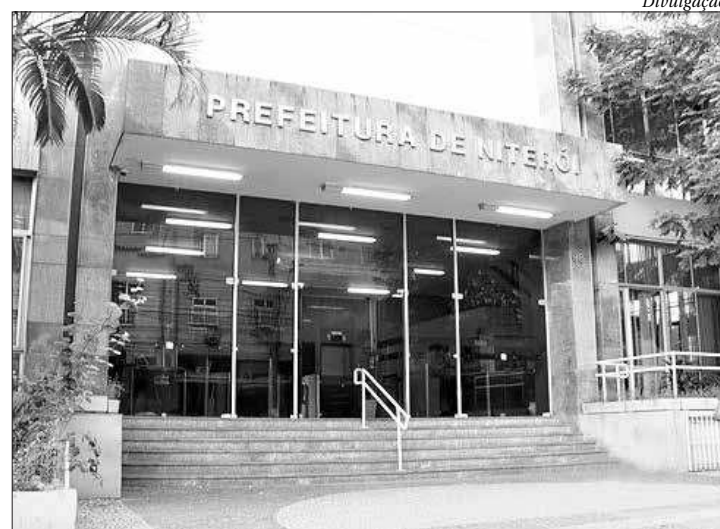
Contribuinte que desejar novo parcelamento precisa comparecer na prefeitura

Decorrido o prazo de 30 dias sem pagamento, a PGM ingressa na Justiça e o imóvel pode ser leiloado para quitar a dívida. Após marcada a data do leilão, o débito deve ser pago integralmente, não sendo mais permitido qualquer parcelamento.