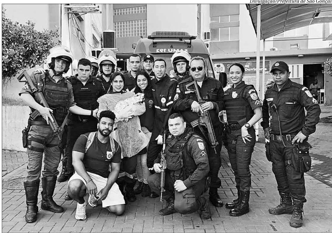
Agentes do Samu e policiais militares foram chamados por estudante universitário para socorrer o bebê abandonado

"Quando vi que era um bebê, corri, voltei em casa e peguei uma toalha para enrolar ele e vi que estava gelado. Estava com a placenta e o cordão umbilical ainda. Assim que encontrei, pedi para minha mãe me ajudar para que eu ligasse para a polícia. Minha mãe ficou muito emocionada. Fiquei muito nervoso quando o socorro demorou para atender, o bebê deve ter passado a noite toda ali", acredita.