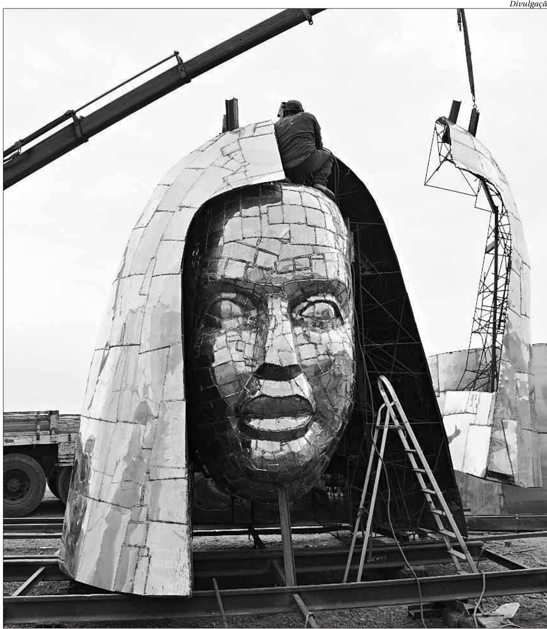
Imagem é maior do que o Cristo Redentor, que tem 38 metros de altura, e pode se tornar mais um ponto turístico em SP

Em 2017, toda a estrutura da escultura foi finalizada e levada para terrenos cedidos por devotos no bairro de Itaguaçu, em Aparecida, onde a imagem da Santa foi encontrada há 302 anos. Desde então, é preciso construir a etapa de fundação e levan-