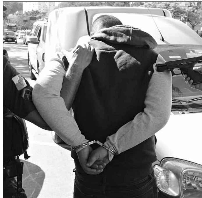
Acusado estava com uma pistola e acabou preso em flagrante pela PM

“Fui abordado perto do Plaza. Ele [o suspeito] apenas entrou no carro, armado, e mandou seguir, não falou muita coisa. Mas