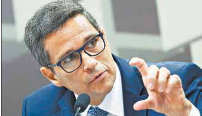
O presidente do Banco Central, Roberto Campos Neto, falou no Senado