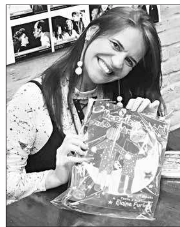
A autora de livros infantis Elaine Furlani fará contação de histórias