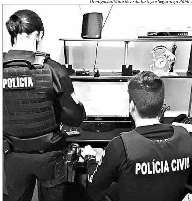
No total, foram expedidos mandados de busca e apreensão contra 105 alvos