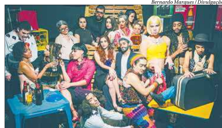
Em "ButéQosanto" personagens se encontram em vários momentos em um bar

No espetáculo, clientes entram e saem de um boteco do subúrbio do Rio. Os personagens se esbarram em momentos diferentes, deixando aparentar o que há de mais ridículo neles. Dividida em "noite", "madrugada" e