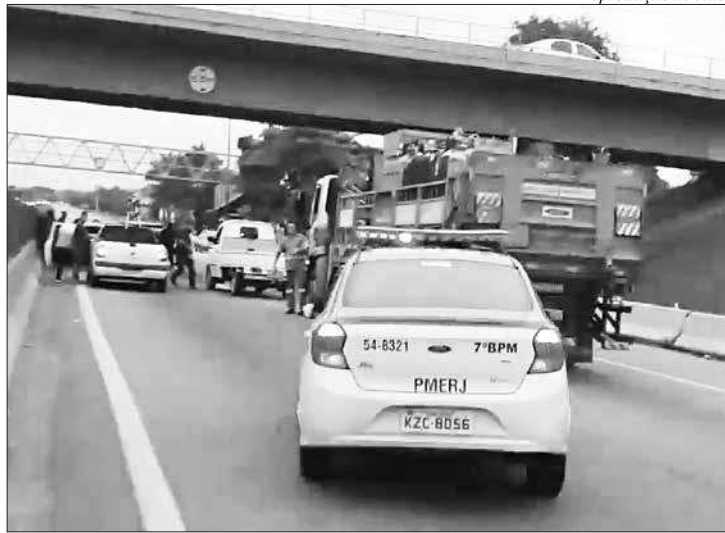
Motoristas ficaram no meio do fogo cruzado na BR-101, na altura do Boa Vista

De acordo com a PM, equipes do 7º BPM (São Gonçalo) receberam informações de que criminosos em dois veículos estavam realizando assaltos na Avenida Paiva, que dá acesso à rodovia, no