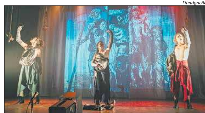
"Quanto mais eu vou, eu fico" está em cartaz no Teatro Gláucio Gill, no Rio