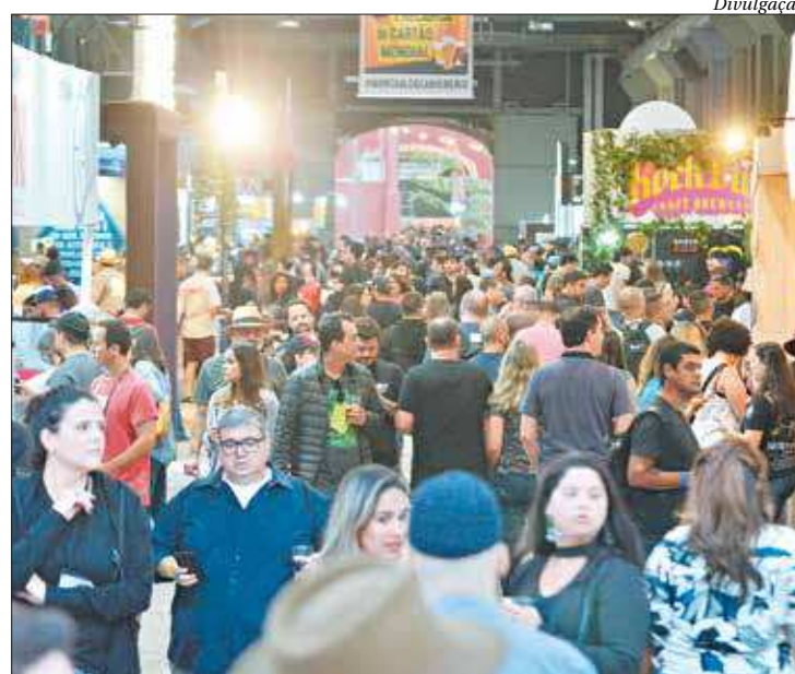
Festivais, como o mundial cervejas artesanais, atraem público para o Rio

Nesta quarta começa o Mundial de la Bière, no Pter Mauá, que chega à sexta edição na capital fluminense. Principal festival internacional de cervejas artesanais, o evento está presente em três países e vai até o dia 8. Já a 19ª edição da Bienal Internacional do Livro, que também vai até o dia 8, no Riocentro, espera receber cerca de 600