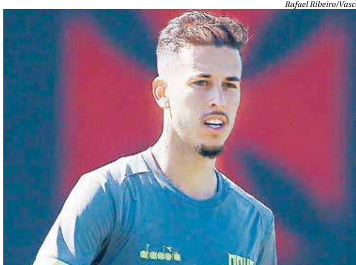
Marcos Jr exaltou a torcida do Vasco para o duelo pelo Campeonato Brasileiro

“Não tem jogo fácil. Todos nós sabemos que a equipe do Bahia é muito qualificada e que teremos um jogo muito difícil, mas também sabemos da nossa força dentro de São Januário e pedimos mais uma vez o apoio da nossa tor-