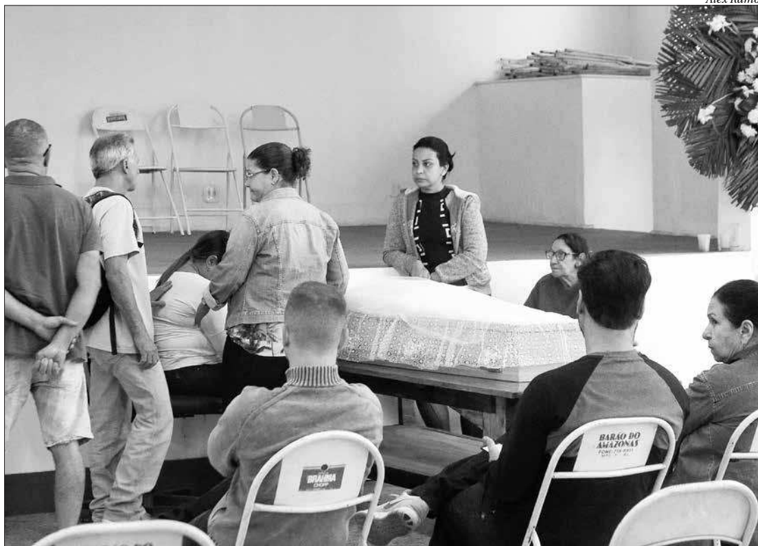
Dezenas de pessoas, entre amigos e familiares, compareceram ao velório no espaço Banda Portuguesa, na Ponta da Areia

Havia três pessoas no bar, a vítima, sua esposa e o proprietário do estabelecimento. Dois bandidos, a pé, anunciaram o assalto e após recolherem pertences da vítima, atiraram contra