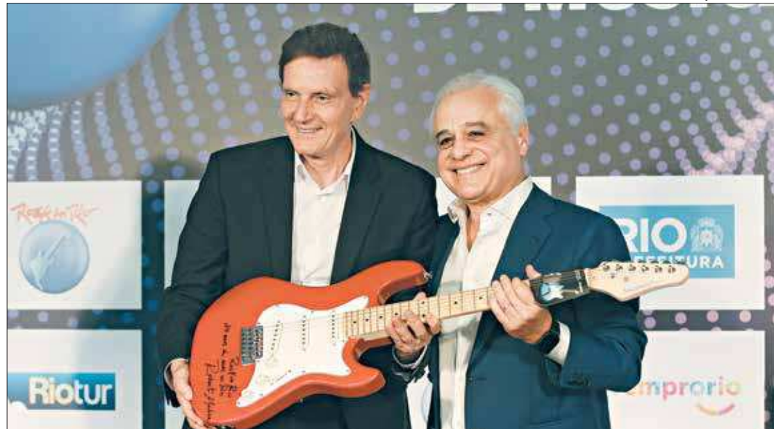
Marcelo Crivella, prefeito do Rio, recebe o símbolo do Rock in Rio, uma guitarra vermelha, de Roberto Medina, idealizador do festival

A oitava edição carioca do maior festival de música e entretenimento do mundo vai acontecer no Parque Olímpico, na Barra da Tijuca, entre os dias 27 e 29 de setembro e 3 e 6 de outubro. A expectativa é que o evento leve 700 mil pessoas ao Parque Olímpico para assistirem 250 shows em sete dias. Durante todo este tempo, segundo o Executivo