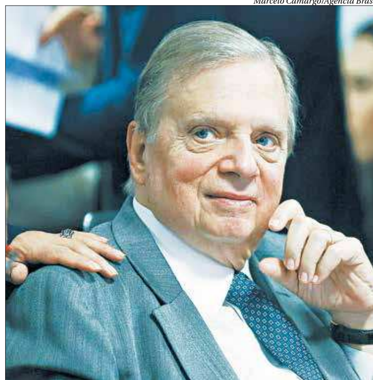
O relator da PEC da reforma da previdência, senador Tasso Jereissati

Além de excluir da proposta de emenda à Constituição (PEC) o critério previsto em lei para recebimento do benefício de prestação continuada (BPC), renda per capita de um quarto do salário mínimo, e de retirar do texto a elevação dos pontos (soma de idade mínima e tempo de contribuição) necessários em regra de transição para aposentadoria de profissionais hoje expostos a condições insalubres, Tasso retirou da proposta a parte que trata