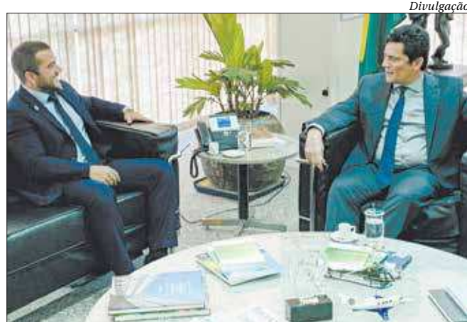
O deputado Carlos Jordy em encontro com o ministro Sérgio Moro

Em encontro com o ministro da Justiça Sérgio Moro, nesta quarta-feira (4), o deputado federal Carlos Jordy (PSL) pediu o aumento do efetivo da Polícia Rodoviária Federal (PRF) na BR-101, no trecho Niterói-Manilha. Segundo ele, o reforço se faz necessário por conta dos constantes assaltos a motoristas na rodovia. A reunião foi realizada com o ministro para tratar de assuntos relacionados à segurança no Rio de Janeiro. Segundo Jordy, "o ministro se comprometeu a olhar atentamente essas demandas e dar um retorno em breve. Segurança é uma das maiores prioridades do meu mandato", disse o deputado.