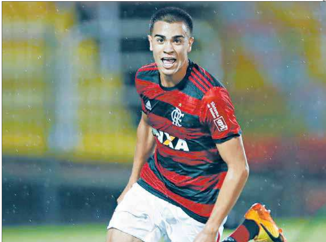
Reinier é esperado pelo técnico Jorge Jesus para duelo contra o Avai, que será disputado neste sábado em Brasília

O Flamengo está apostando no bom relacionamento com a CBF e no bom senso da entidade. Isso porque, além do atacante Bruno Henrique, convocado para Seleção prin-