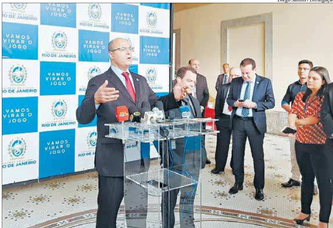
O governador Wilson Witzel agradeceu as articulações necessárias para as mudanças nos valores arrecadados

“O Senado da República aprovou uma emenda do senador Flávio Bolsonaro que