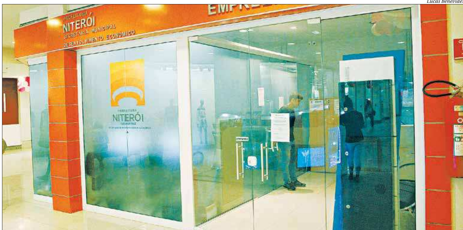
Casa do Empreendedor, no centro da cidade, tem tido um papel importante no desempenho dos microempreendedores individuais em Niterói

Cadastros - O Sebrae oferece palestra sobre como se tornar um microempreendedor individual e cursos para a capacitação, gestão das finanças e dos negócios. A partir desse desenvolvimento, empreendedores podem evoluir de MEI - faturamento até 81 mil/ano, aproximadamente, 6,7 mil/mês - para Microempresa, categoria que permite faturamento até R$ 360 mil/ano. ■