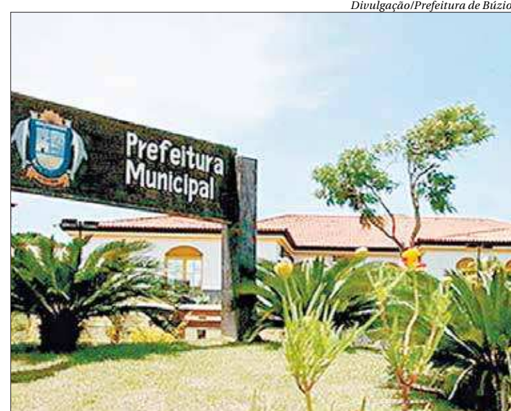
No município, ninguém se arrisca a dizer quem terminará o ano como prefeito

“O cidadão estava muito mal assistido no governo André Granado, e a situação piorou muito no governo Henrique Gomes. A saúde está um caos. O número de mortes no Hospital Municipal só cresce. Os bairros da cidade estão completamente abandonados. O esgoto corre a céu aberto e o lixo se acumula nas ruas. Nenhum dos dois tem condições morais de governar a cidade”, alega. “Um foi afastado por improbidade, o outro responde por formação de quadrilha. Búzios precisa de novas eleições. O povo não quer nenhum dos dois, mas eles não desapegam, são os reis das liminares. O problema é que, infelizmente, o povo buziano está pagando muito caro por essa briga por poder”, completa.