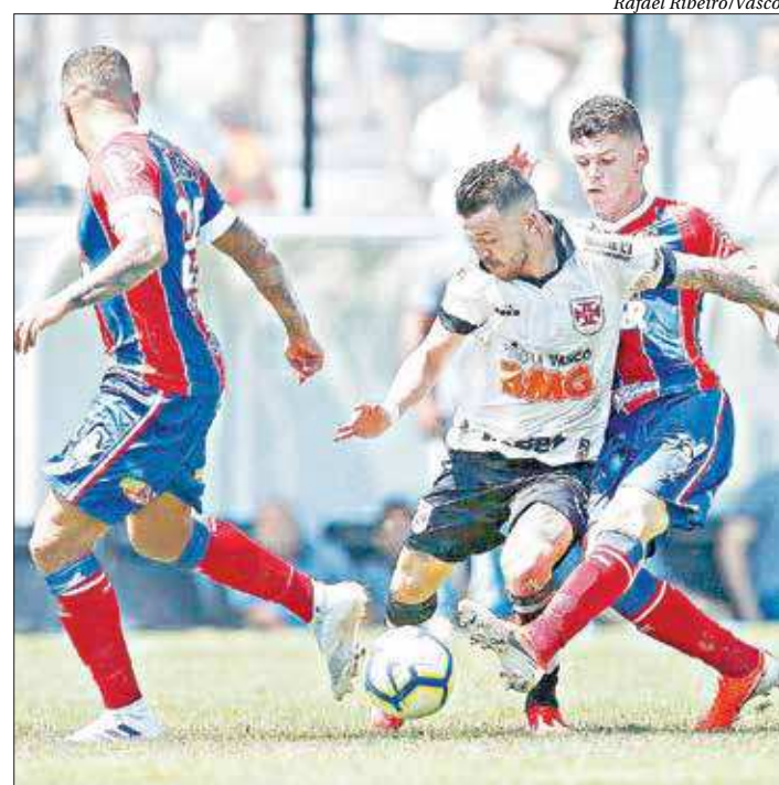
Diante da sua torcida, o Vasco computou mais uma derrota no Brasileiro

O Vasco sentiu o golpe e passou a buscar a reação de forma desorganizada, mas não conseguiu diminuir para decepção da torcida que marcou presença em São Januário. ■