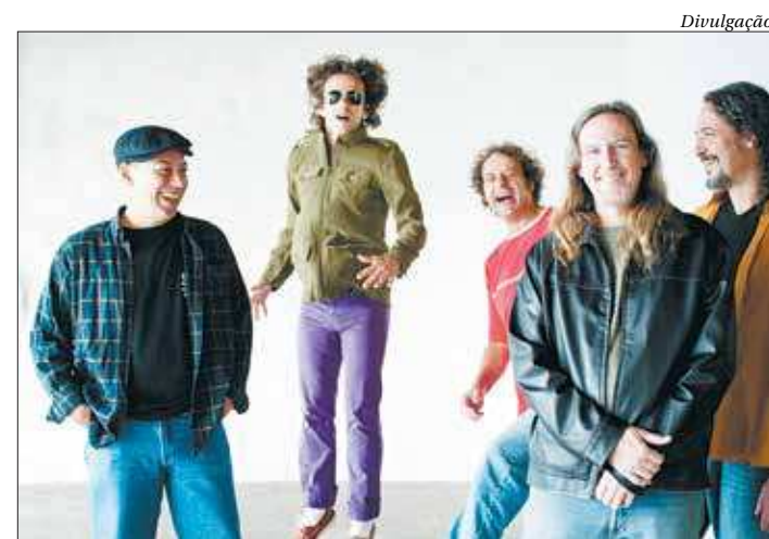
A banda Blues Etlícos integra o time de atrações, e se apresenta às 19h30