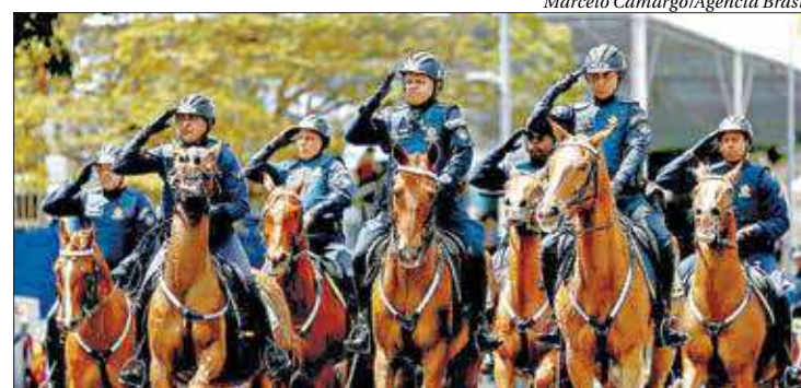
Esquadrões de Polícia Montada durante o desfile militar em Brasília

pelo público. Agora estou prestigiando vários amigos da ativa. Sempre que posso venho ao desfile”, afirmou.