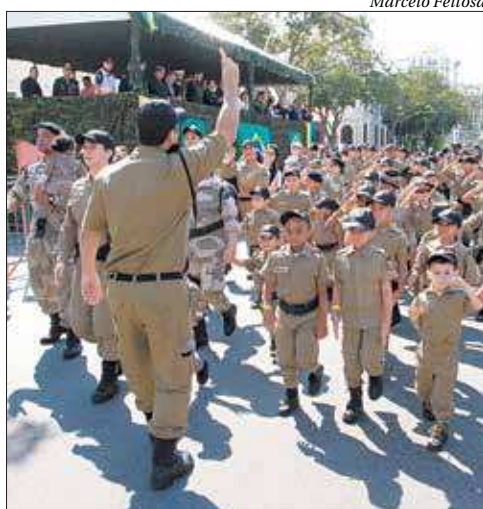
A Tropa Mirim participou mais uma vez da festa