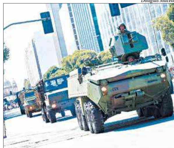
O desfile na Avenida Presidente Vargas atraiu milhares de pessoas