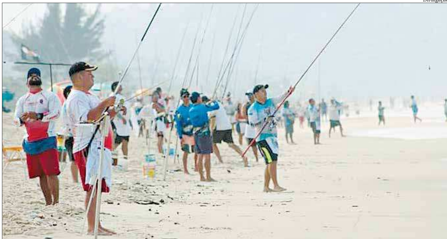
Pescadores de diversas partes do estado estarão reunidos na Região Oceânica. Além do desafio da pesca, eles terão que superar quatro horas de paciência

estarão dispostos em cerca de 1km de faixa de areia, disputarão a competição em duplas e os atletas serão divididos em quatro categorias: masculino (adulto e federado), Master (acima de 55 anos), feminino e juvenil (menores de 18 anos). As provas terão a duração de quatro horas e, após o 'apito final', começará o julgamento dos pescados. De acordo com a organização, todo o alimento será doado para o Lar Bela Vista, juntamente com as duas toneladas de alimentos que serão doados pelos competidores.