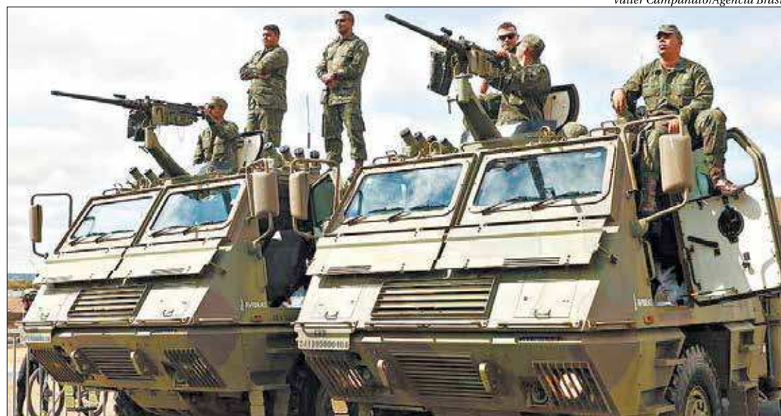
Carros blindados foram um show à parte durante os festejos do 7 de setembro na capital federal