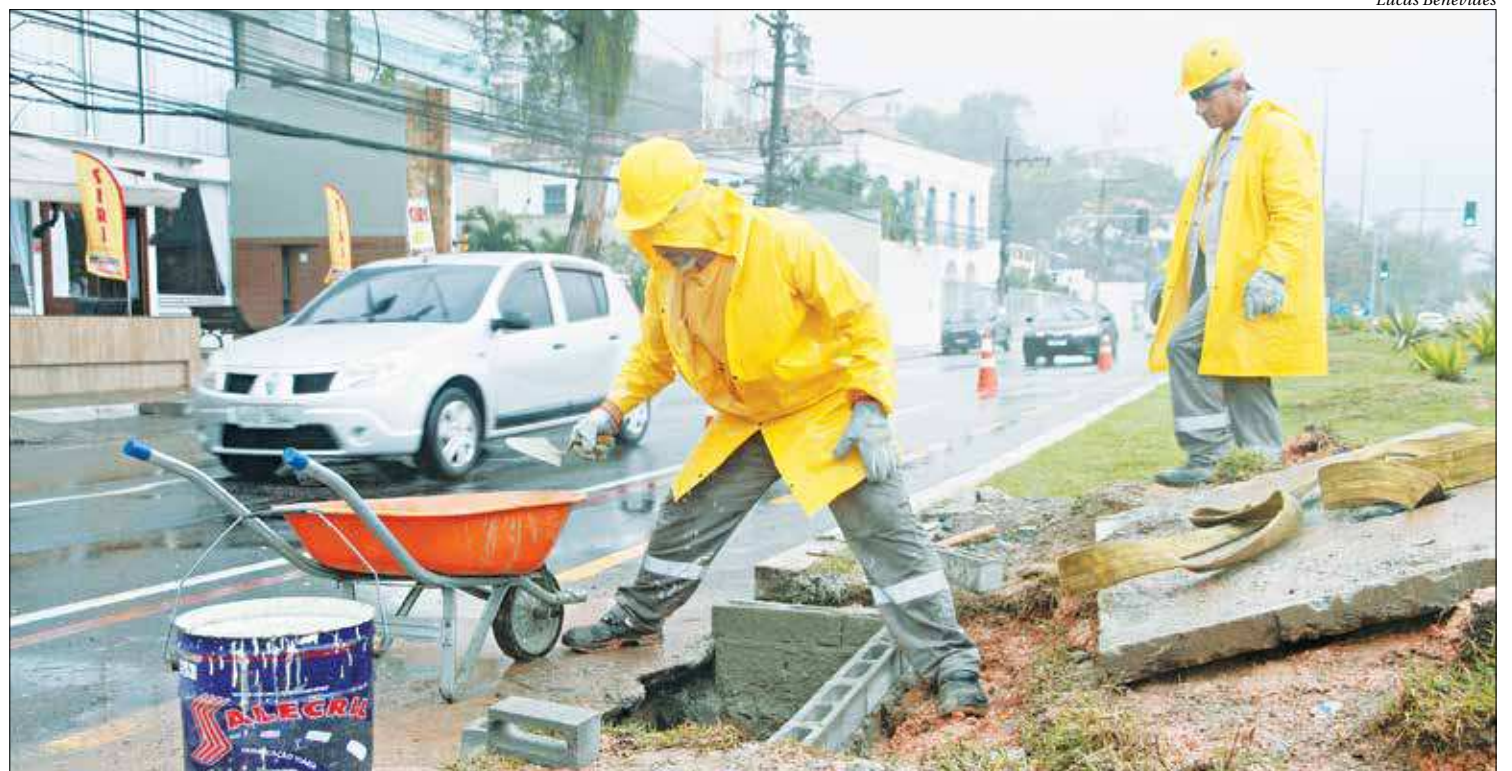
Na Avenida Sylvio Picanço, em Charitas, que passará por obras de macrodrenagem no ano que vem, trabalhadores desobstruem bueiros e galerias para evitar alagamentos

De acordo com Bittencourt, foram identificados 26 pontos críticos de enchentes na cidade. Todos os trechos passarão por desobstrução de bueiros e galerias. Na última semana, equipes da prefeitura atuaram na Avenida Prefeito Sylvio Picanço, em Charitas, porém já passaram por ruas de Icaraí, Santa Rosa, Centro, Barreto e Fonseca, além dos canais do Viradouro, Martins Torres e Cubango, que desembocam