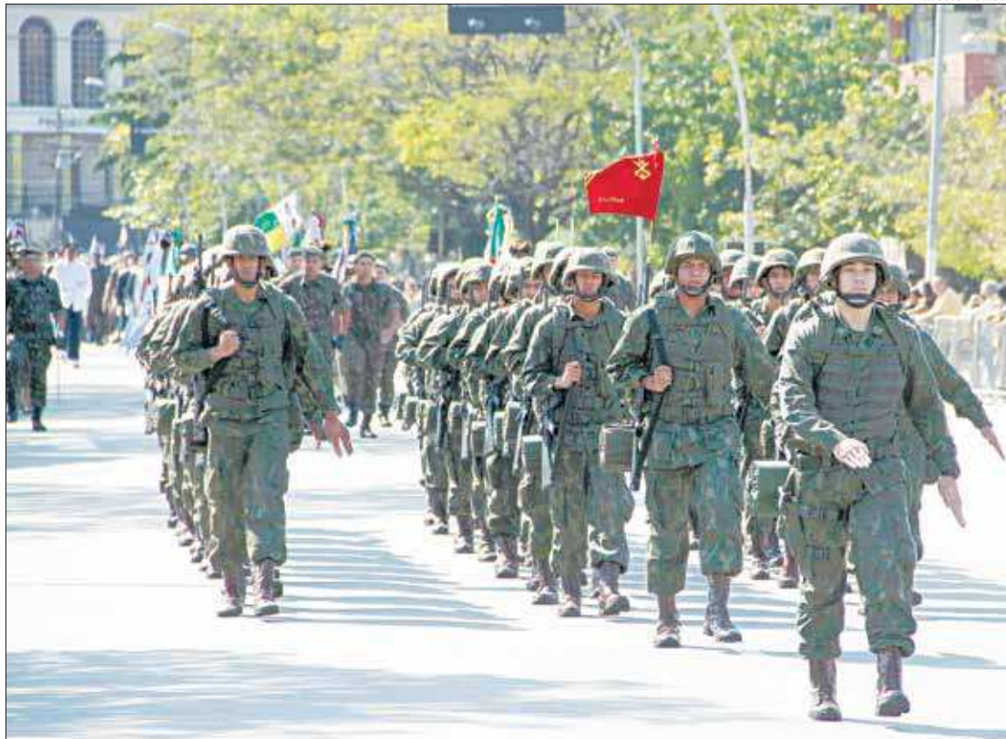
Desfile de 7 de setembro no Centro de Niterói reuniu centenas de famílias da cidade e municípios vizinhos neste sábado

Começando às 9h e com um sol moderado, o público, majoritariamente formado