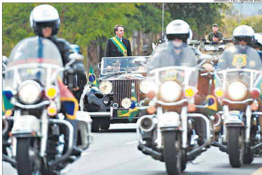
No seu primeiro desfile como presidente, Jair Bolsonaro interagiu com o público e ficou à vontade na festa da Independência