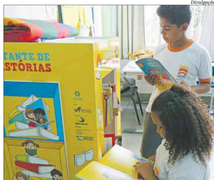
Os livros são entregues em estantes personalizadas que estimulam a leitura

Além da entrega de todo esse material, o projeto oferece a visita de um contador