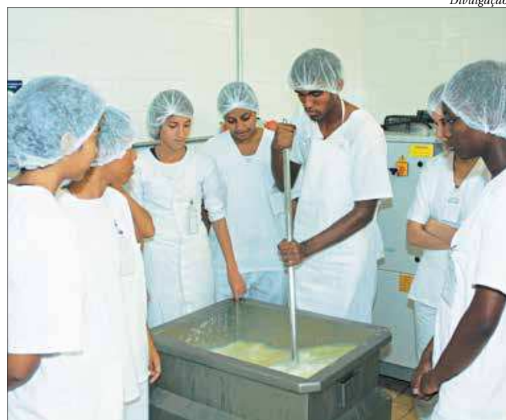
Assim como o Estado, Niterói e SG também tiveram menor abertura

Região - Niterói registrou menos 723 oportunidades em