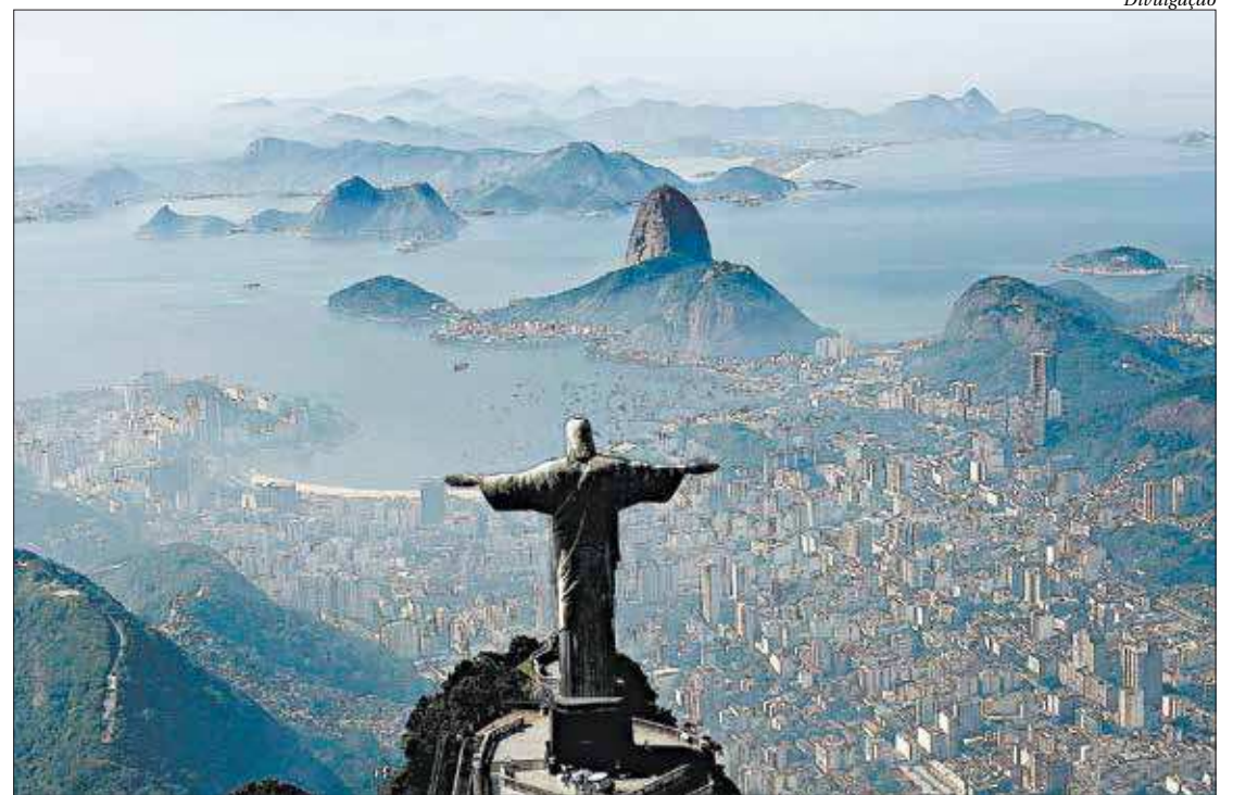
Capital do Estado, o município do Rio de Janeiro entra na categoria A, por inúmeros atrativos para o turista

Entre os benefícios do Mapa do Turismo estão a categorização dos municípios turísticos, que vai de "A" a "E". Essa classificação é um instrumento de acompanhamento do desempenho das economias turísticas locais. Além disso, ele subsidia a priorização de investimentos