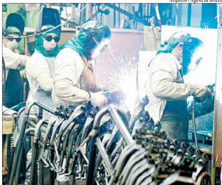
No país, o saldo de julho foi de 1.331.189 admissões contra 1.287.369 desligamentos

Apesar disso, no Estado do Rio, em julho deste ano,