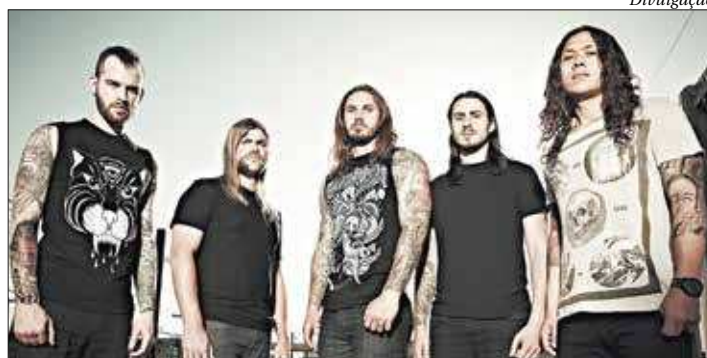
Banda de metal acaba de lançar os singles ‘My Own Grave’ e ‘Redefined’

Formada em 2000, em San Diego, na Califórnia, Estados Unidos, a banda As I Lay Dying ganhou popularidade quando assinou contrato com a Metal Blade Records. Seu quarto álbum, “An Ocean Between Us”, lançado em 2007, fez a banda estourar com direito a uma música indicada ao Grammy, “Nothin’g Left”. A partir daí, fez turnês e participou de grandes festivais como Ozzfest, Wacken Open