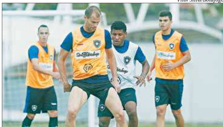
Alvinegro quer espantar a má fase em campo e superar os problemas internos

No Botafogo, o clima ficou ruim após o jogadores reclamarem publicamente do atraso de salários. Já é a terceira vez que o elenco demonstra insatisfação sobre o assunto na temporada. No entanto, o