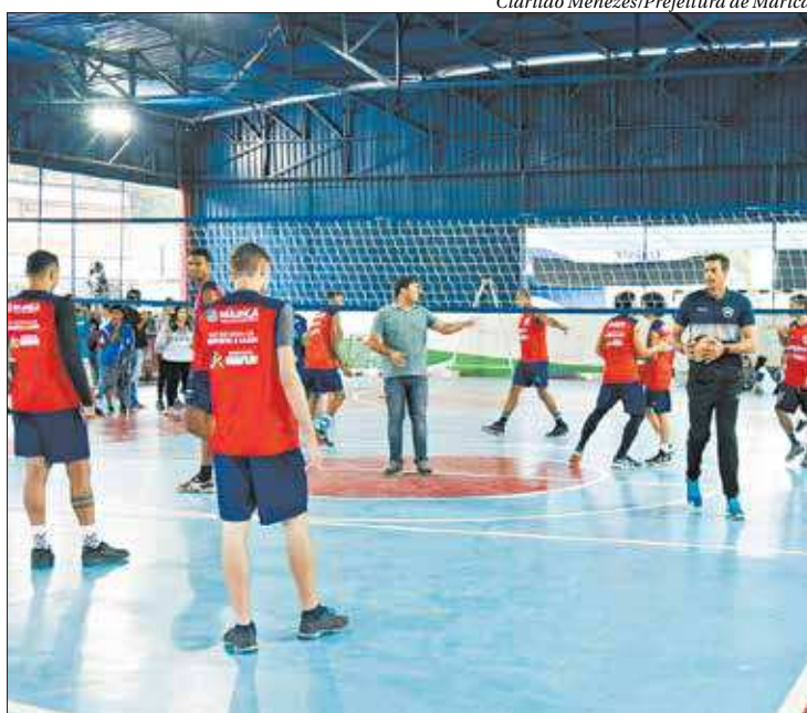
Jogadores aprenderam técnicas de vôlei com o maior pontuador da Superliga