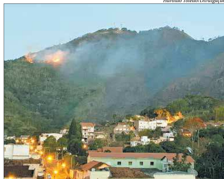
O projeto terá continuidade no dia 21, com ação de plantio de mudas

A programação começará às 8h, com concentração na Praça dos Ferroviários, ao lado da Rodoviária Princesa da Serra, no Centro. A seguir, acontecerá a Caminhada rumo à Serra dos Mascates. Chegando ao local, acontecerá o Abraço Simbólico à Serra dos Mascates, que contará com plantação de mudas. O SOS: Salve a Serra dos Mascates foi criado em virtude dos vários incêndios florestais que ocorreram no mês de agosto deste ano e que devastaram a Serra, destruindo