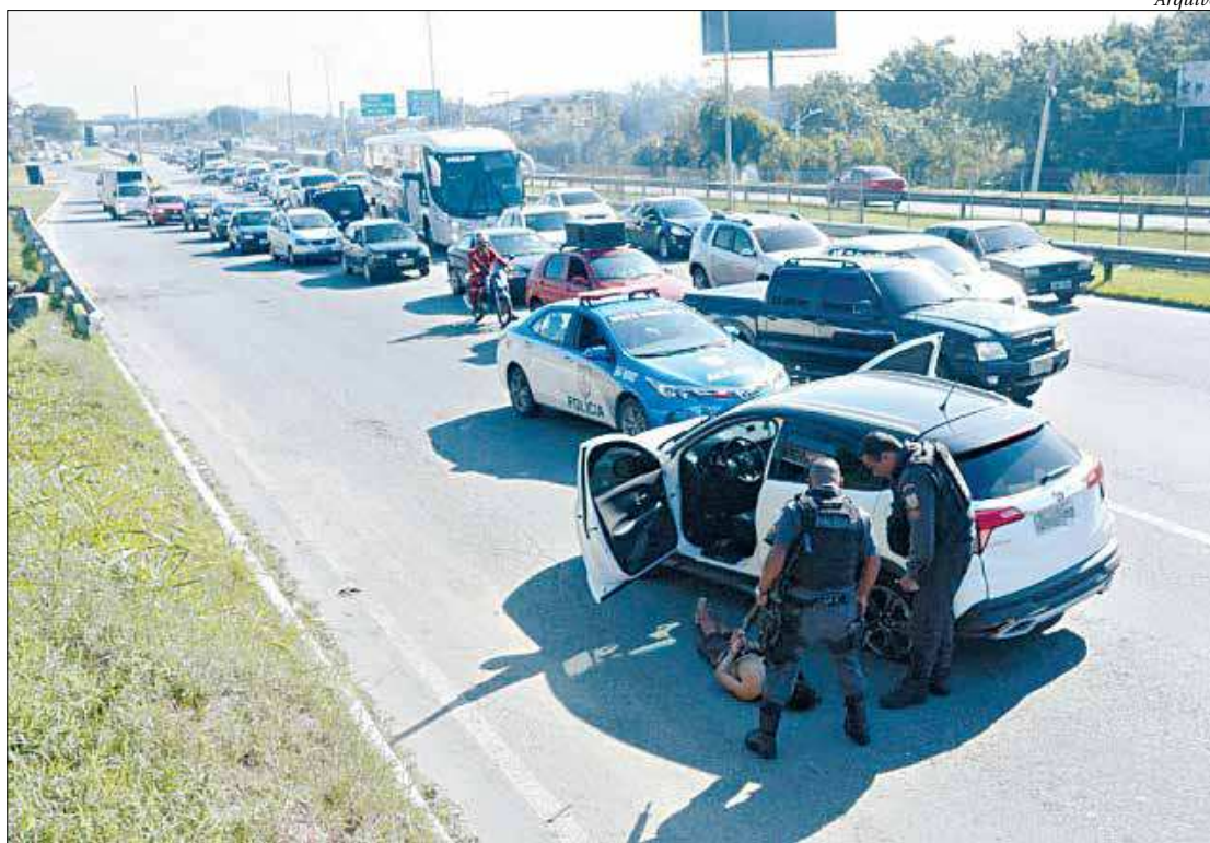
Trecho Niterói-Manilha da Rodovia BR-101 é conhecido pelos frequentes arrastões e roubos de carga

Já no bairro do Boaçu, a Rua Carlos Santos (KM 310) e a Rua Alberto Santos Lima (KM 311), que