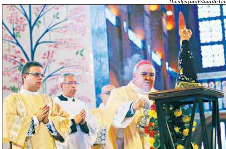
Cardeal Orani Tempesta celebrou missa durante romaria deste ano