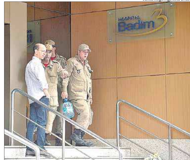
Peritos da Polícia Civil e bombeiros trabalham no Hospital Badim, na Tijuca

Ainda será necessário retirar uma peça específica, que está dentro do gerador, mas para isso será necessário o auxílio da empresa que