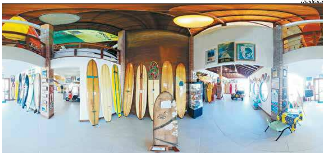
O Espaço Cultural do Surf será o primeiro atrativo turístico de Cabo Frio a entrar no projeto

Para um único cenário, é necessário capturar 26 fotos. No total, estão previstos cerca de 30 cenários, com 780 fotos capturadas a cada 5 metros, para que o internauta conheça todo o acervo composto por pranchas, ska-