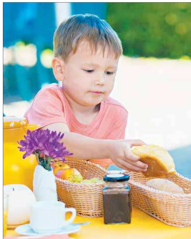
As refeições devem acontecer em ambientes agradáveis para a criança

Cuidado médico – Por fim, naturalmente, considerar que toda criança inapetente, ou cujo padrão de apetite mudou de forma persistente, deve passar por metódico exame médico para detectar alguma intercorrência que possa contribuir para a situação.