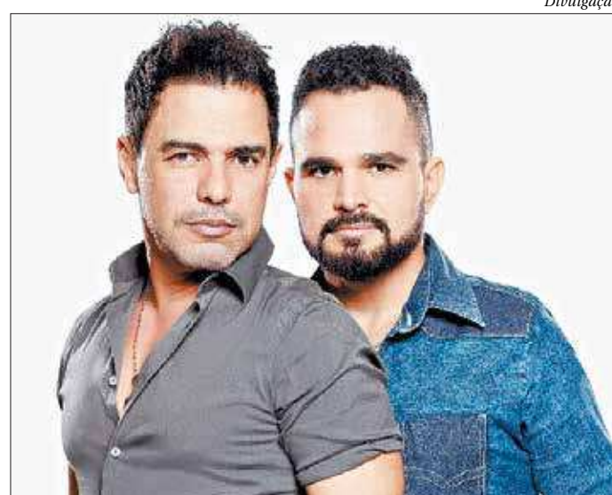
Zezé Di Camargo e Luciano se apresentam na EXPO Casimiro 2019

O Parque de Exposições recebe, a partir das 20h, o público vai assistir o show do cantor Cesário Ramos. Logo após, a dupla sertaneja Zezé Di Camargo e Luciano encerra as comemorações. ■