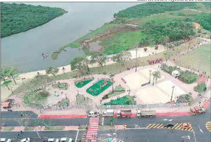
Equipamento urbano tem 19 mil metros quadrados e atende todas as idades