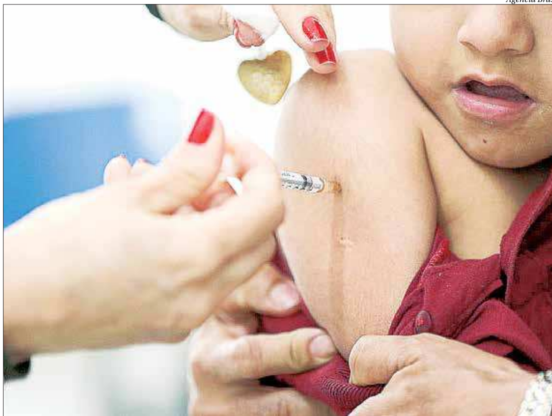
Casos de sarampo e caxumba levaram Ministério da Saúde a intensificar o alerta para vacinação nos municípios

A Subsecretaria de Vigilância em Saúde (SVS) não divulga o número de suspeitas. As notificações ocorreram nas cidades de Paraty (12), Rio de Janeiro (6), Duque de Caxias (5), Nilópolis (2) e São João de Meriti (1). Em todo 2018, foram 20 registros.