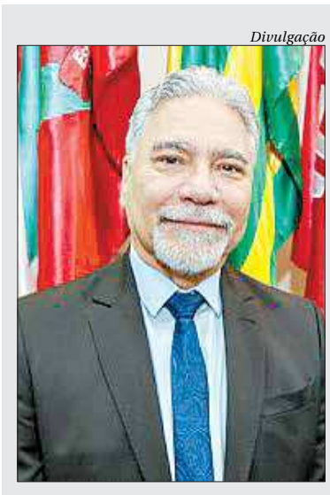
Gen. Marco Aurélio Costa Vieira

O Colégio Militar do Brasil teve origem no Exército por decreto do Imperador D. Pedro II, em 1889, no Rio de Janeiro, com o nome de Imperial Collegio Militar da Corte. Destinava-se originalmente aos filhos órfãos de militares mortos na Guerra do Paraguai, mas, desde a sua criação, já admitia alunos de pais não militares, bastando para tanto que fossem admitidos em concurso. No Século XX, o modelo foi replicado e já existem 13 Colégios Militares em diferentes cidades do Brasil, com o objetivo principal de atender à família militar.