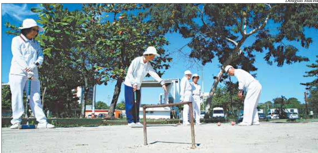
Esporte, com mais de 10 mil praticantes em todo o Brasil, já conta com 10 adeptos na Concha Acústica de Niterói

O esporte de origem japonesa, que surgiu no ano de 1947, conta com taco e bola para sua prática. Atualmente, estima-se que existam 10 mil praticantes somente no Brasil. A modalidade ainda é pouco conhecida na cidade de Niterói, mas já faz parte da realidade de dez atletas na fai-