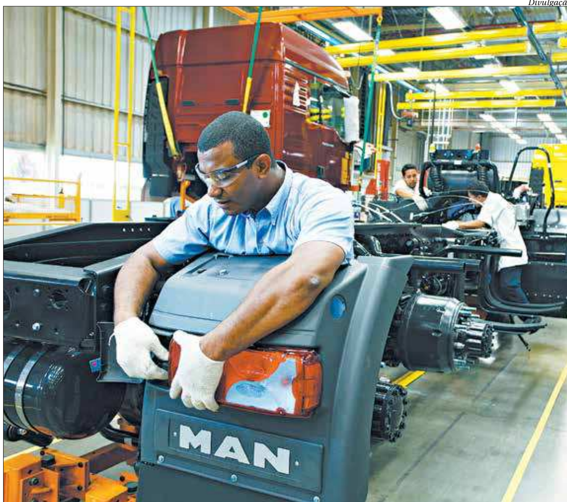
A indústria segue sendo uma das áreas que promete alavancar a economia e oferecer maior volume de empregos