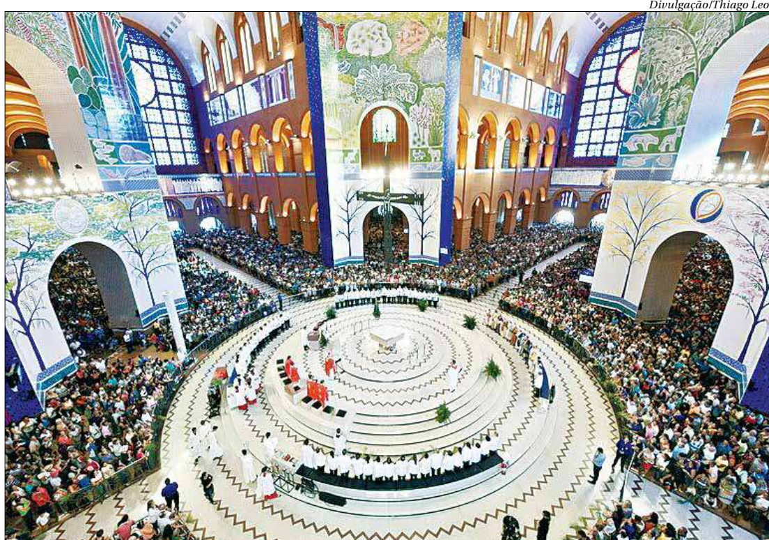
Na cidade de Aparecida, em São Paulo, Altar Central do Santuário tem capacidade para 30 mil devotos

Mais de 12 mil romeiros da Arquidiocese de Niterói