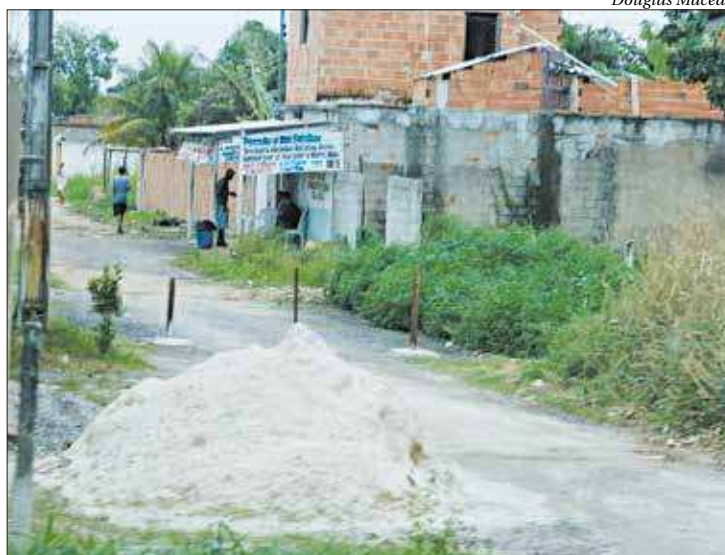
Obstáculos nas ruas de acesso também impedem a circulação de moradores

já são estreitas, criminosos não tiveram muito trabalho para fazer o bloqueio, utilizando apenas algumas barras de ferro.