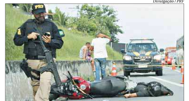
Agentes da PRF têm atuado em conjunto com a PM no patrulhamento

O planejamento foi elaborado com base na análise da mancha criminal em toda extensão da rodovia e bairros limítrofes. Cada unidade envolvida passou a responder pelo policiamento de cinco trechos da rodovia. ■