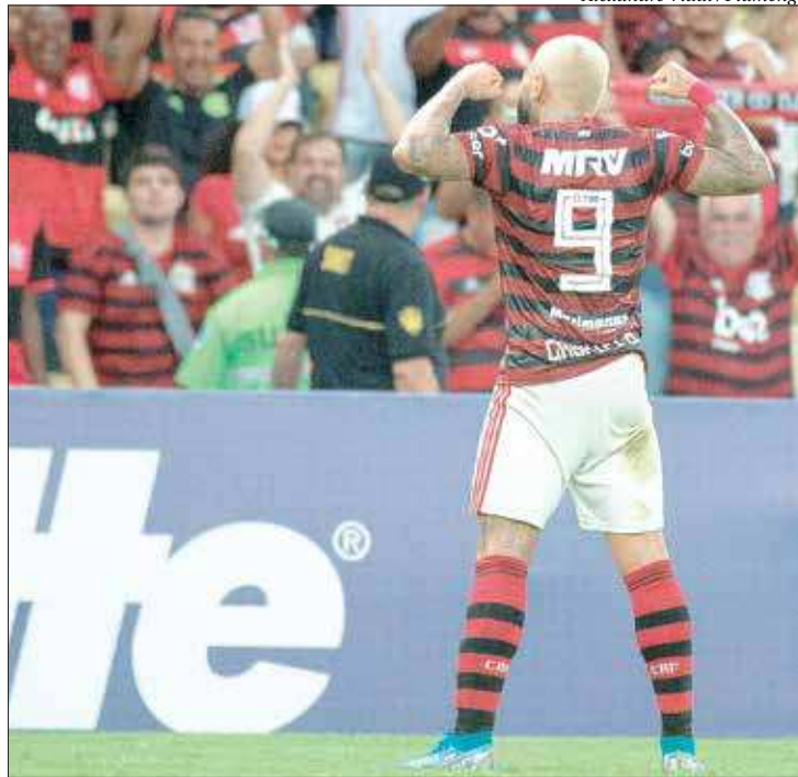
Gabigol comemora com a torcida que lotou o Maracanã no jogo deste sábado

“É uma vergonha tomar um gol desse. A gente tem que ter mais atenção no jogo”, cobrou o lateral Jorge, logo após acusar seu xará, técnico do Flamengo de lhe ter dado tapas no rosto. O princípio de confusão foi resolvido na sequência, com Jorge Jesus se desculpando e