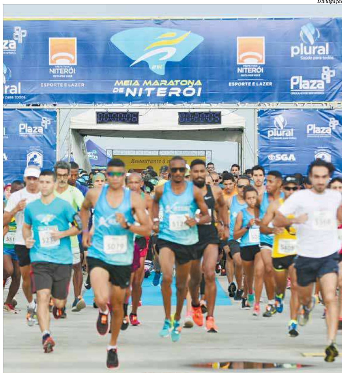
Cerca de duas mil pessoas disputarão as provas de 5km e 21km, a partir das 7h deste domingo, em Niterói

O trajeto foi dividido da seguinte forma: todos os participantes sairão do mesmo lugar, no Caminho Nie-