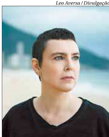
Show de Adriana Calcanhotto será atração na abertura do espaço

“Margem”, lançado este ano. A banda que a acompanha é formada pelos mesmos músicos que tocaram e coproduziram com ela o trabalho. O repertório, além do novo álbum, resgata músicas de “Maritmo” e “Maré”, os outros dois discos da trilogia