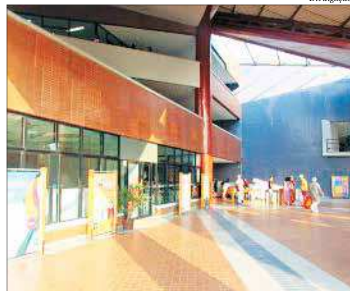
As produções poderão ser vistas no Sesc São Gonçalo, na Estrela do Norte

Entre as novidades da edição 2019, já na abertura do evento, o público terá a oportunidade de assistir ao documentário “A Pedra”, dirigido por Davidson Davis Cândanda, e participar de um bate-papo sobre a produção do filme logo após a exibição da obra. ■