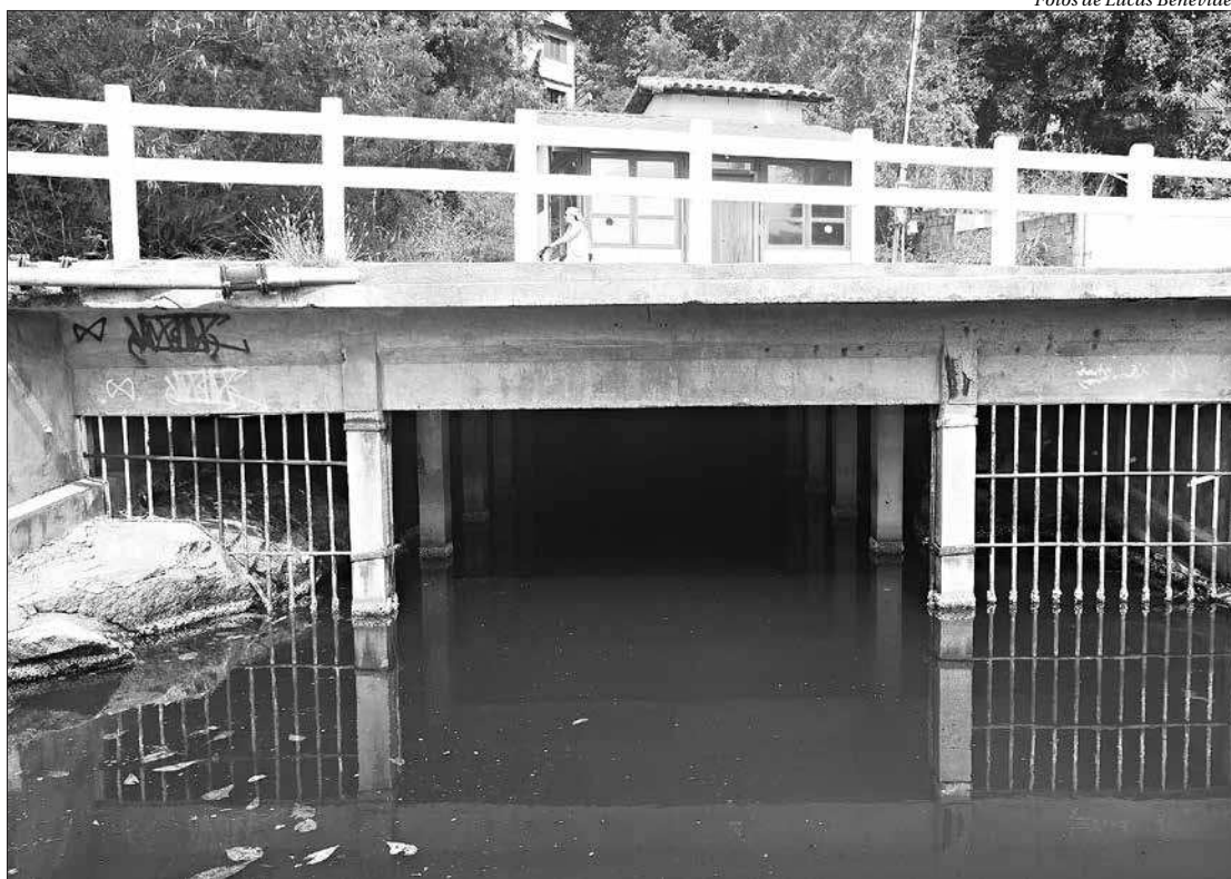
O Canal do Tibau, que liga a Lagoa ao mar, está obstruído, atrapalhando a renovação da água da Lagoa de Piratininga

Moradores apontam que o túnel subterrâneo já era estreito para o tamanho da lagoa