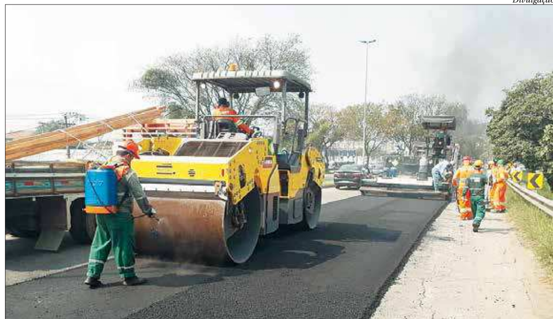
Intervenções na rodovia que liga Niterói a São Gonçalo são realizadas sempre em horário comercial, de segunda a sexta

"Essa obra vai gerar desenvolvimento, geração de emprego e renda, além de