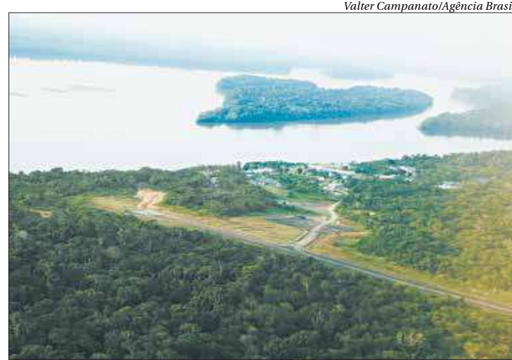
Com a prorrogação, os trabalhos seguem agora até o dia 24 de outubro

Na operação, foram encontradas 16 balanças com alteração, algumas com mais de 1kg acima da pesagem correta nos guichês das companhias aéreas. Os agentes do IPem e do PROCON paralisaram as operações das balanças e a concessionária RIOGaleão, responsável por fornecê-las às companhias, foi autuada. Já durante a fiscalização nos táxis, foram encontrados seis com lacres rompidos e um com taxímetro adulterado. O condutor deste último veículo foi encaminhado à delegacia. Brinquedos sem o selo do INMETRO e produtos têxteis também foram recolhidos nas lojas fiscalizadas. ■