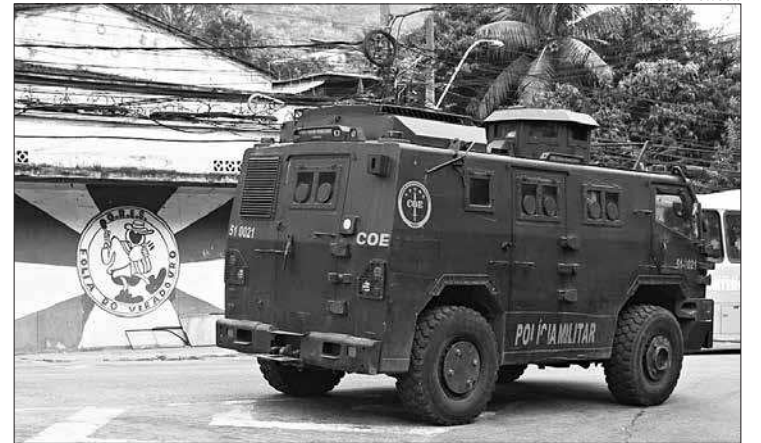
Ação da PM foi realizada em diferentes comunidades de Niterói

apoio de veículos blindados além de um helicóptero. Pelas redes sociais, moradores relataram ter visto movimentação desde o final da noite de quinta-feira.