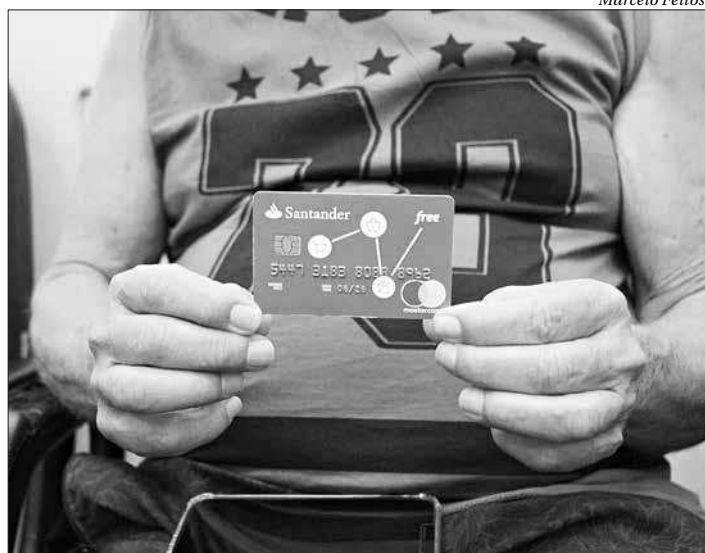
Uma das vítimas teve cartão bancário trocado por outro, sem que percebesse