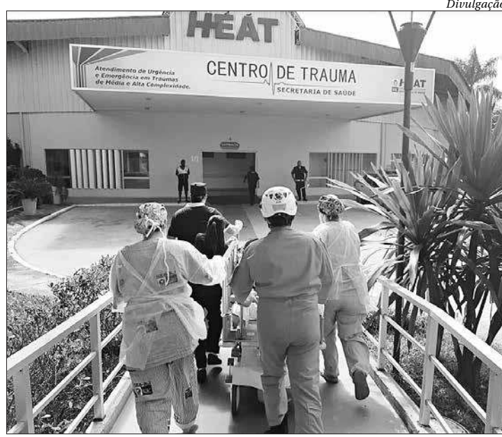
O principal objetivo é conscientizar a população sobre a importância do ato

Nesta sexta-feira (20), a equipe do CIHDOTT faz a abertura da exposição fotográfica "Plante Essa Ideia. Transplante Vida", com imagens feitas no Jardim do Doador pela fotógrafa Tayrine Miranda e também pelos parentes dos doadores