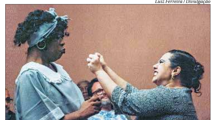
Trama se passa em um casarão, como o próprio Solar do Jambreiro

Com texto e direção de Anselmo Fernandes, a peça traz os conflitos e contradições típicas do dia a dia de uma família de classe média, que depois de uma reviravolta financeira se vê obrigada a comprar, com o dinheiro que lhe restou, um lindo, porém estranho, casarão. Trabalhado com humor sutil, o enredo trata de valores morais, funcionando como peça-chave para as cenas de maior diversão. ■