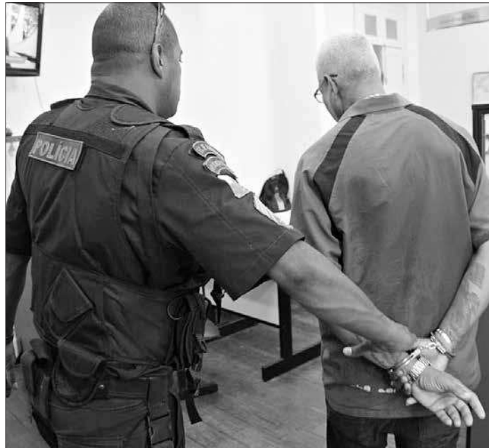
Acusado foi preso pela PM quando deixava agência bancária

A polícia foi informada que o suposto estelionatário já teria causado prejuízo de cerca de R$ 8 mil. Quando ele tentava deixar a agência, foi abordado por policiais militares do 12º BPM (Niterói) e preso em flagrante portando identidade e comprovante de residência falsos, em nome de uma ter-