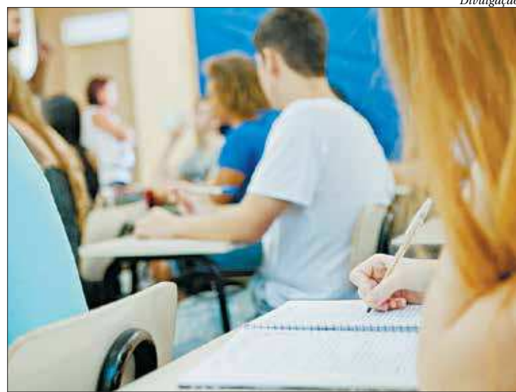
Quem vem se preparando nos cursos para concursos tem nova oportunidade

O edital do concurso ainda não foi divulgado, mas tem a possibilidade de ser publicado ainda no fim deste mês, após a definição da banca organizadora.