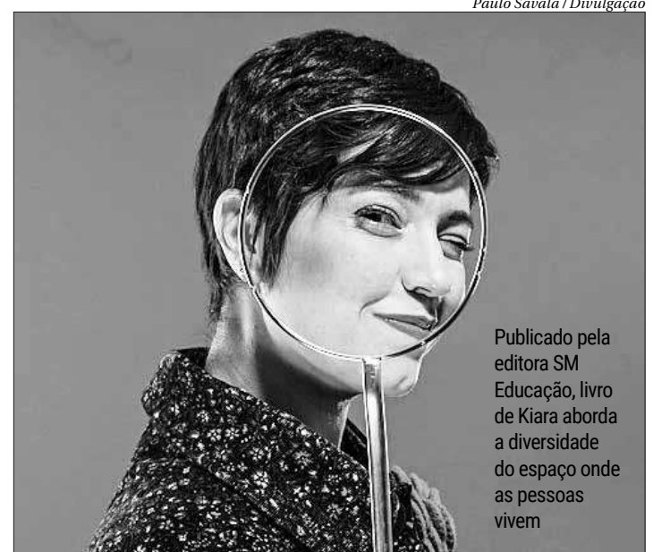
Publicado pela editora SM Educação, livro de Kiara aborda a diversidade do espaço onde as pessoas vivem

"A mobilidade é um tema instigante. Mover-se é estar no mundo e em de-