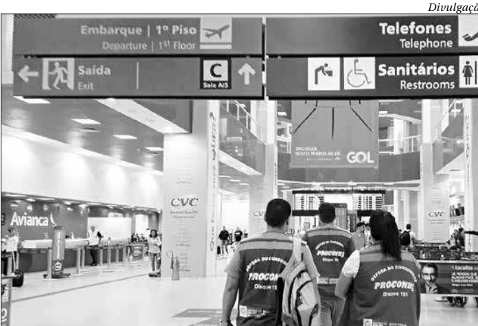
Fiscais do Procon checaram o funcionamento das companhias aéreas

Durante as obras, a maioria dos voos do Santos Dumont foi transferida para o Aeroporto Tom Jobim, no Galeão, Ilha do Governador. Neste período, o ProconTur, grupo de trabalho do Procon Estadual especializado no atendimento ao turista e grandes eventos, esteve de plantão por telefone, aplicativo e e-mail para procurar solucionar os problemas que os consumidores pudessem vir a ter.