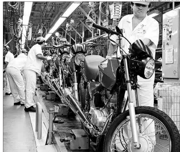
Normas tratam de condições de higiene, conforto, fiscalização e até interdição

A revisão de três normas foi publicada nesta terça (24) no Diário Oficial da União pela Secretaria Especial de Previdência e Trabalho, do Ministério da Economia. Estão com nova redação a Norma Regulamentadora NR-3, sobre embargo e interdição; a NR-24, que trata das condições de higiene e conforto nos locais de trabalho; e a NR-28, de fiscalização e penalidades. Com isso, chega a seis o número de normas que já passaram por revisão este ano.