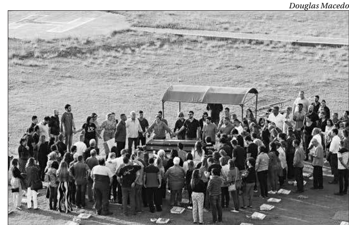
Centenas de pessoas acompanharam o enterro do ciclista em S. Gonçalo

Catumbi – Uma crianças de 11 anos e uma mulher foram baleadas no Morro da Mineira, no Catumbi, na zona central do Rio, na tarde de ontem. Segundo a Polícia Militar, não houve nenhuma operação da PM na região.■