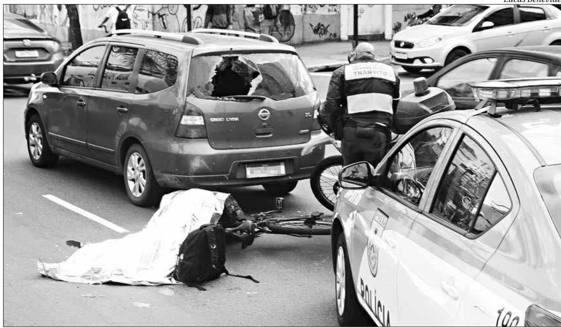
Ciclista bateu na traseira de um carro de passeio, caiu na pista e foi atropelado por um caminhão-pipa

do Paraná é uma das mais temidas pelos ciclistas que andam por Niterói, já que não há ciclovia no trecho. A malha cicloviária da cidade se estende pela Zona Sul até a Avenida Roberto Silveira, e pelo Centro na Av. Amaral Peixoto. Para fazer a travessia entre os pontos, ciclistas se aventuram no meio da calçada ou pela rua, já sendo registrado diversos acidentes.