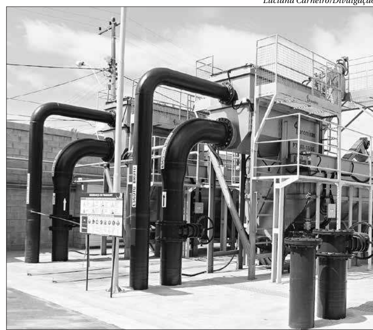
Foram investidos R$ 20 milhões na nova estação de tratamento de esgoto

Niterói saltou da 19ª para 10ª posição em saneamento entre as 100 maiores cidades