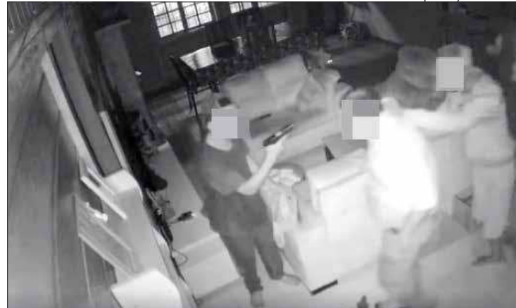
Câmeras de segurança registraram desespero do casal nas mãos dos ladrões

Um casal viveu momentos de terror após ser rendido, amarrado e amordaçado dentro de casa por três bandidos armados na Vila Progresso, em Pendotiba, Niterói, na última sexta (20), por volta de 22h30. Os bandidos estavam escondidos atrás do muro de um vizinho e surpreenderam os moradores quando chegavam da igreja. Eles foram ameaçados de morte e os bandidos fizeram a limpeza na casa, fugindo no carro da família. Câmeras de segurança registraram a ação. (Matheus Falcão)