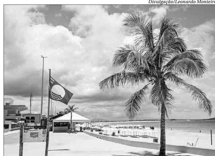
A cerimônia de hasteamento está prevista para o dia 13 de novembro

“Uma grande vitória, do Perú e de Cabo Frio. Fizemos o dever de casa. Garantimos a certificação até novembro DE