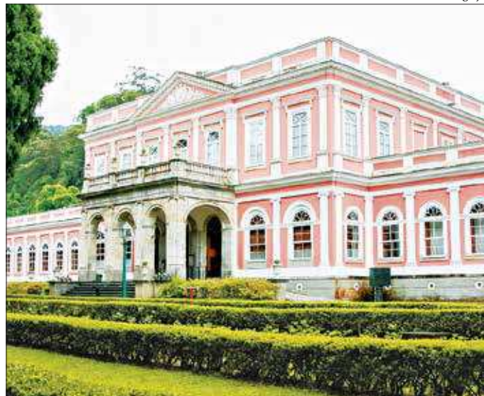
O Museu Imperial, em Petrópolis, recebe atrações da 13ª Primavera dos Museus

Entre os dias 26 e 28 de setembro, acontece no Cinetatro do Museu a dramatização "Um Sarau Imperial", às 18h30. Um pouco mais tarde, às 20h, os jardins do Museu Imperial recebem o "Espetáculo Som e Luz". ■