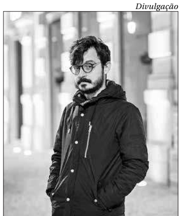
Cantor mostra repertório do álbum "Selvagem", seu terceiro trabalho

A visitação funciona de terça a sábado, das 10h às 18h, e aos domingos, das 14h às 21h. ■