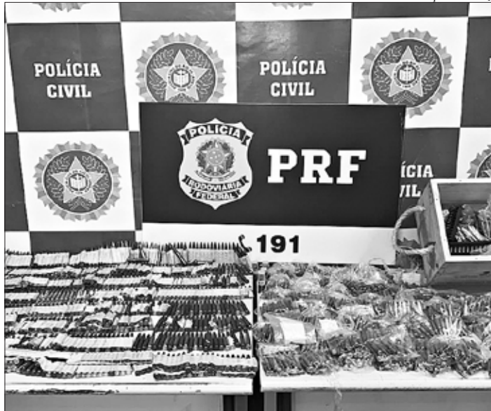
Delegacia da Penha e PRF apreendem 3,5 mil munições de fuzil