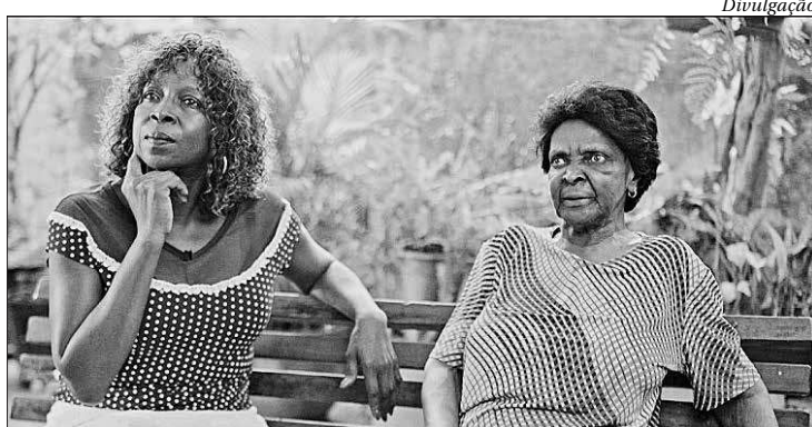
"As Pastoras - Vozes Femininas" é uma das obras selecionadas para o festival