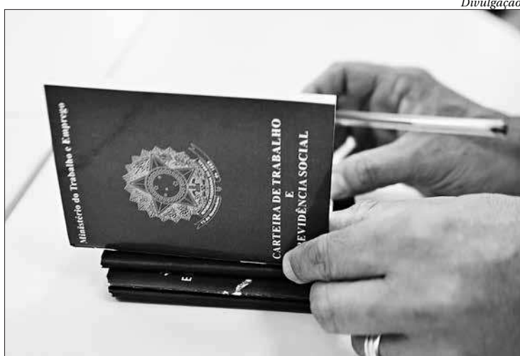
Um dos piores resultados ficou com a cidade de Nova Iguaçu

No ranking das cidades que mais geraram vagas de emprego no estado do Rio, a capital fica em primeiro lugar, com 59.145 admissões