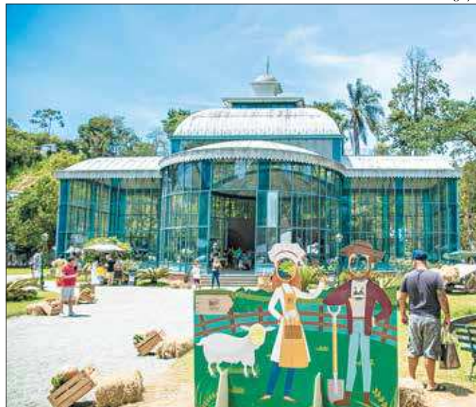
O Festival AgroSerra começa na próxima semana com muitas atrações

Todas as atividades oferecidas durante o festival serão gratuitas, sendo somente necessária a inscrição prévia, no próprio local do evento, para a participação nas oficinas e workshops. ■