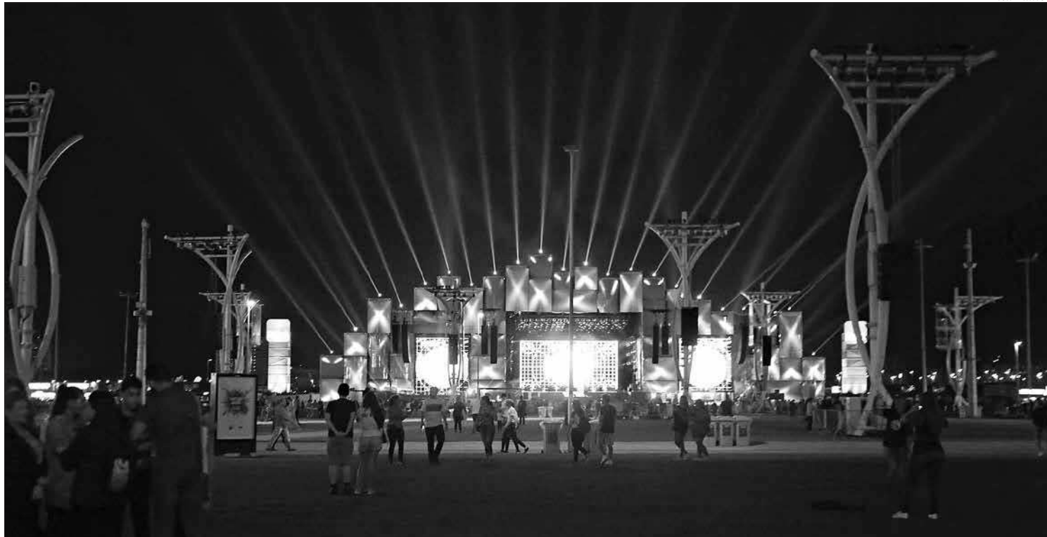
Milhares de pessoas de diferentes tribos e de todas as idades irão invadir a Cidade do Rock para mais um festival que promete agitar o Rio de Janeiro

“Isso acontece em todas as edições do Rock in Rio. Lembro que em Lisboa falaram que a Ariana Grande estava doente. Ligamos para o artístico e o agente dela, e negaram. Quando, na véspera, ligamos para o manager dela, ele confirmou que ela estava doente e tivemos que cancelar. No caso do Drake, assim que surgiram os boatos, ligamos diretamente para o manager, que é a pessoa que fechamos o contrato, e ele falou que estava tudo certo, tanto que minutos depois ele colocou na home do site que o Drake estava confirmado no Rock in Rio”, revela.