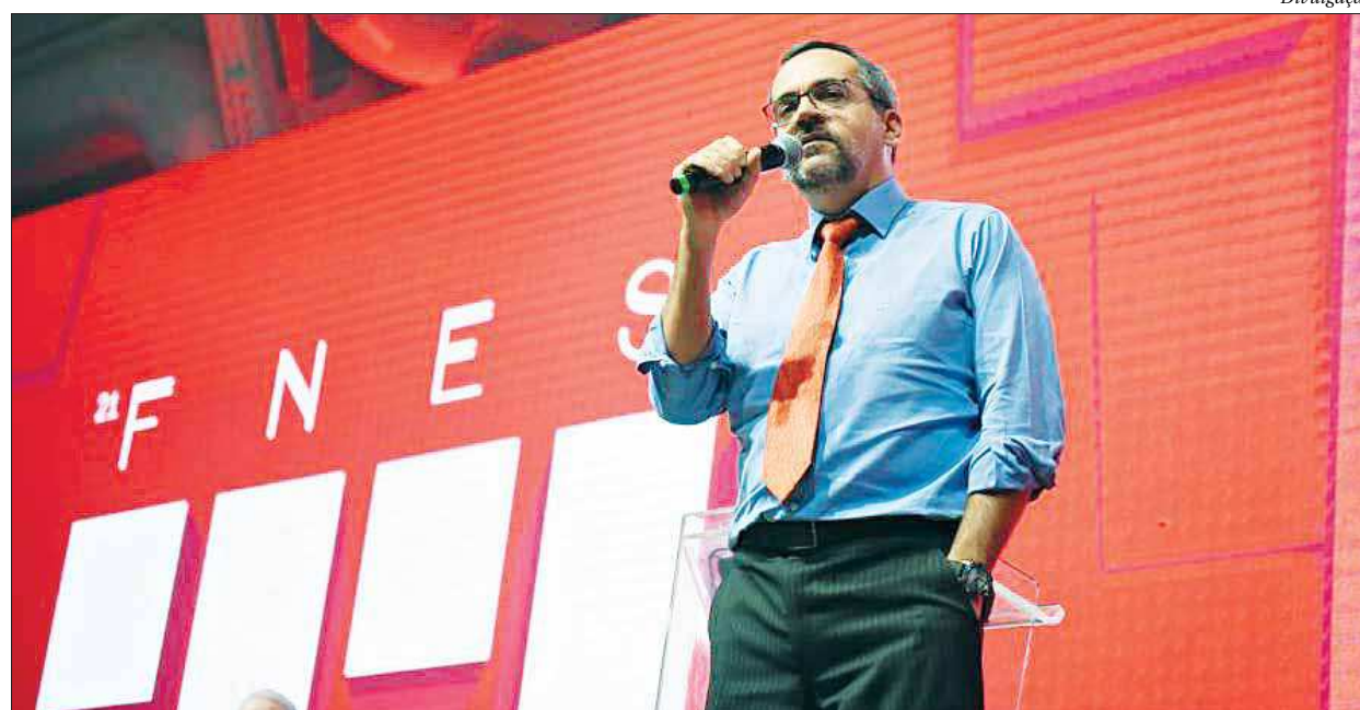
O ministro da Educação participou de evento em São Paulo e defendeu que nos temas delicados deve haver mais controle do governo

Weintraub questiona salários de professores universitários e defende autorregulação das universidades privadas