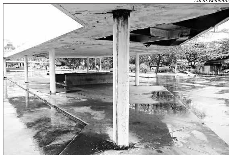
Local que abriga pessoas em situação de rua sofre com a falta de manutenção

A estrutura da praça conta com um caminho coberto por forros que, pela ação do tempo e da maresia, estão soltos e caindo aos poucos. Além disso, pessoas em situação de rua utilizam o espaço coberto para se abrigar e dormir. Constantemente, equipes da Guarda Municipal