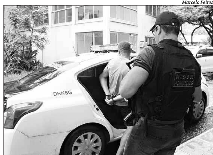
Comerciante foi preso por policiais da DH de Niterói, que investigou o caso