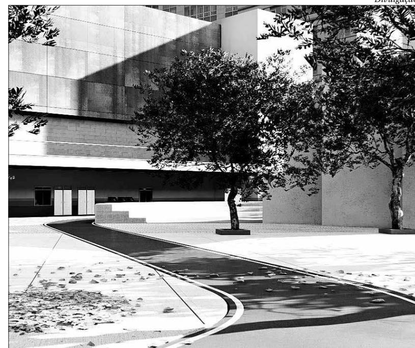
A Concha Acústica de Niterói será transformada no Parque Olímpico Municipal, que foi projetado para sediar grandes eventos esportivos na cidade e oferecer espaço para iniciação esportiva para cerca de 4 mil crianças. O local terá um ginásio poliesportivo com capacidade para receber público de cerca de 2.300 pessoas

precisa de um espaço revitalizado que atenda aos esportistas e permita a realização de competições de grande porte. Será de extrema importância, também, para dar mais visibilidade para a cidade e continuar a tradição como celeiro de novos atletas”, frisa o secretário. ■