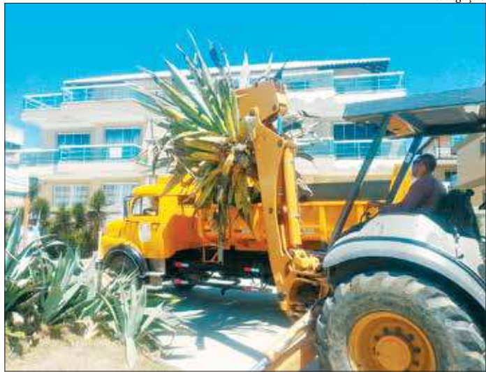
Intervenções seguem o cronograma da certificação Bandeira Azul