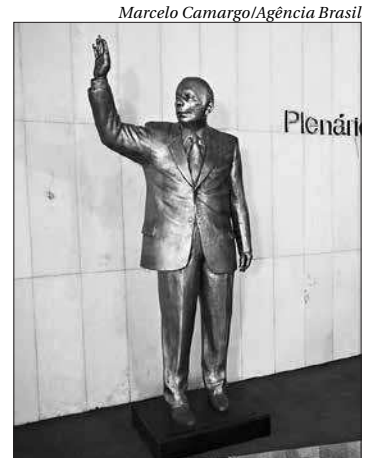
A Câmara dos Deputados inaugurou estátua de Ulysses Guimarães

Maia afirmou que Ulysses foi fundamental para a redemocratização do país e para a estabilização da democracia brasileira após o período do regime militar. "Nada mais do que justo que a gente possa fazer essa homenagem aqui hoje, junto com o MDB [partido de Ulysses], e que isso simbolize esse novo momento da política brasileira, o novo momento da democracia brasileira e que a Câmara se espelhe nesse espetacular exemplo do passado para que os parlamentares de hoje e do futuro tenham também o mesmo reconhecimento que o Parlamento teve no passado". ■