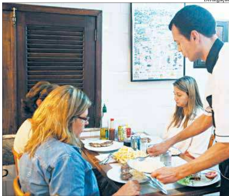
No Centro-Sul Fluminense, empregos estão na área de bares e restaurantes

No Centro-Sul Fluminense, as regiões com maior quantidade de vagas no painel desta semana são: Vasouras, com 100 vagas, sendo 50 para garçom e 50 para auxiliar de cozinha. Na Região