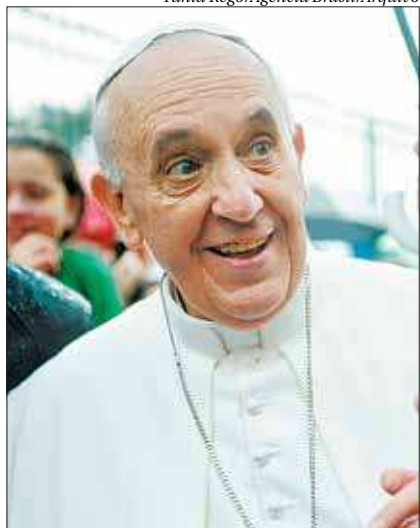
O Papa discursou no Sínodo da Amazônia