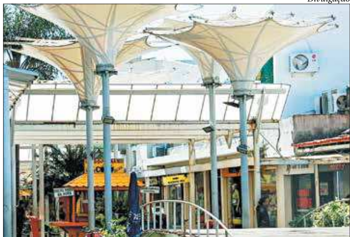
Área é uma das mais importantes comercialmente na cidade de Cabo Frio