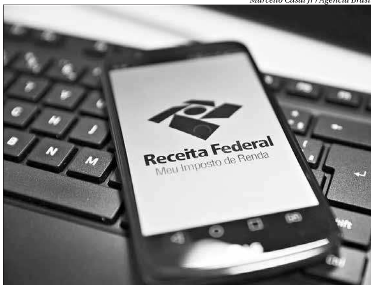
Receita libera consulta ao quinto lote de restituição do Imposto de Renda

Para saber se teve a restituição liberada, o contribuinte deverá acessar a página da Receita na internet, ou ligar para o Receitafone 146. Na consulta à página da Receita, serviço e-CAC, é possível acessar o extrato da declaração e ver se há inconsistências de dados identificadas