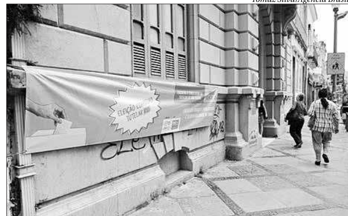
A eleição para o conselho tutelar ocorreu no sábado e domingo, no Rio

"Deve ser ressaltado que as denúncias recebidas darão ensejo à instauração de procedimentos administrativos do MP em todo o estado, nos quais serão colhidos depoimentos de testemunhas e analisadas as provas existentes, que poderão resultar na impugnação de novas candidaturas, por via administrativa ou judicial", disse o MP em nota.