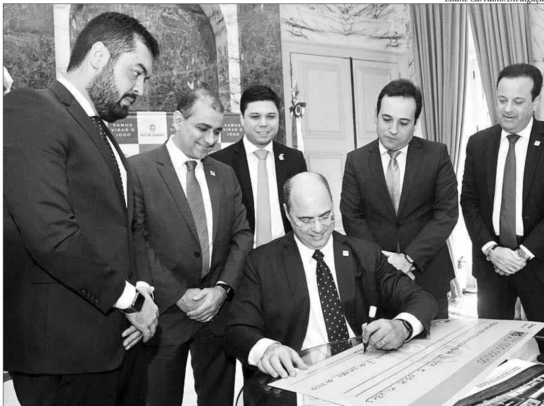
O governador Wilson Witzel assina o cheque que irá garantir mais saúde à população do município de Miguel Pereira

- Recentemente, anunciamos investimentos para