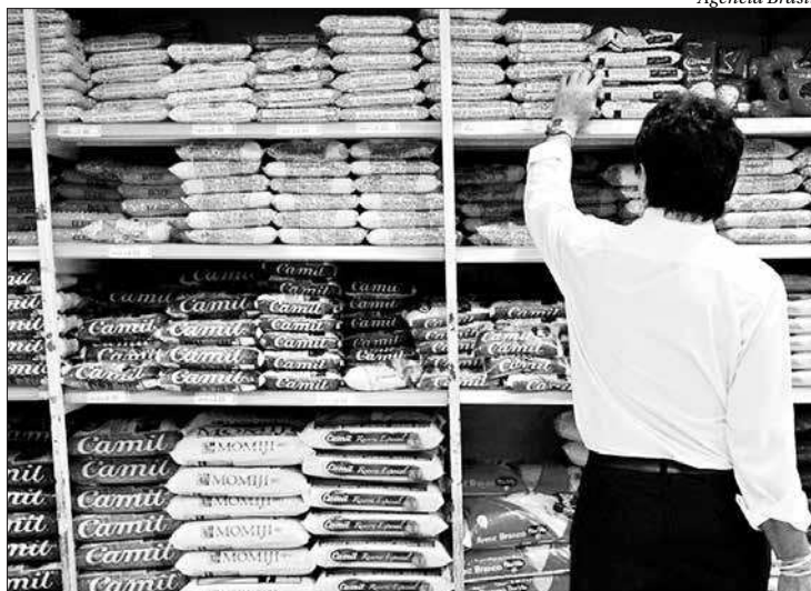
Fundação Getúlio Vargas registra deflação no preço da cesta de compras

A queda da taxa do IPC-C1 de agosto para setembro foi puxada pelos grupos de despesas habitação (cuja taxa caiu de 0,95% para 0,26%), alimentação (de -0,46% para -0,72%), transportes (de 0,05% para 0,03%) e comuni-