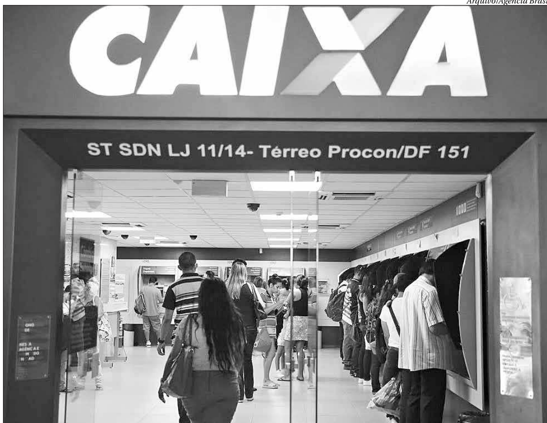
Até sexta-feira, cerca de 120 mil clientes da Caixa podem renegociar suas dívidas e limpar o nome na praça

Segundo a Caixa, a ação tem como objetivo encerrar processos judiciais de maneira conciliatória, extinguindo a ação e possibilitando o resgate do poder