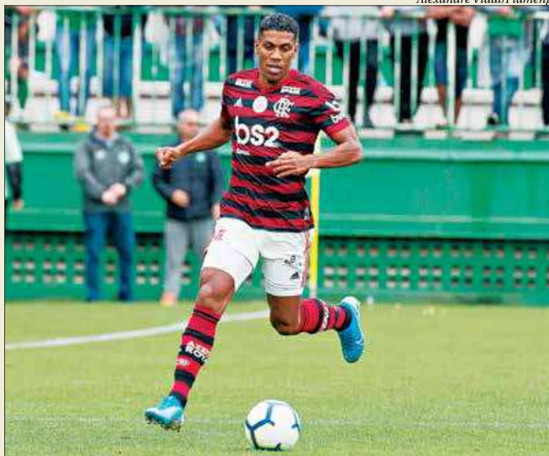
Berrío sofreu uma entorse no tornozelo e será reavaliado pelo departamento médico