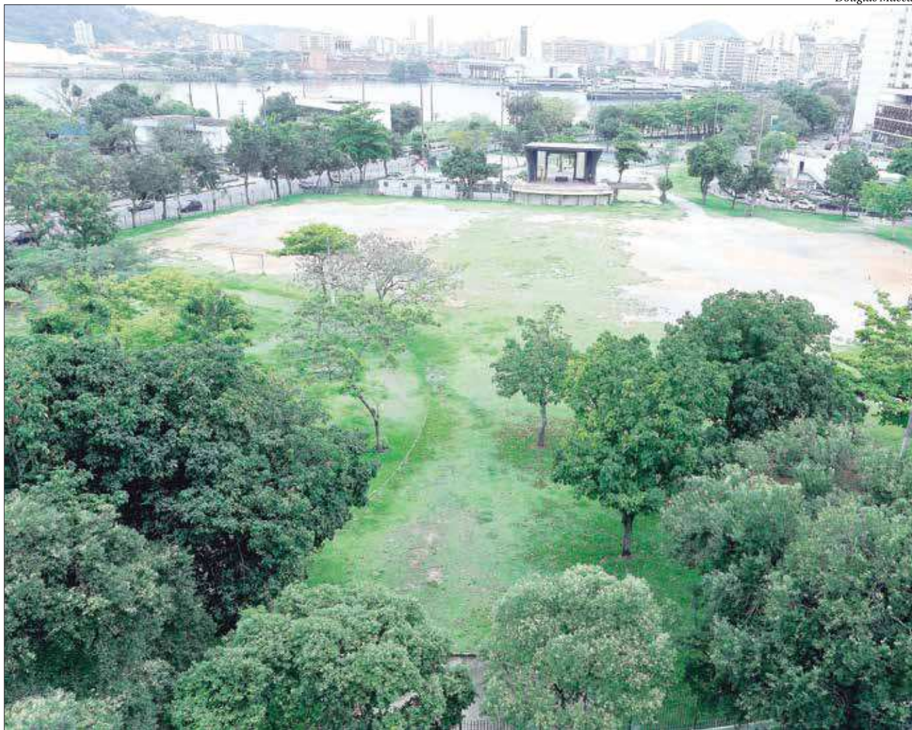
Toda a área da Concha Acústica, em São Domingos, será transformada no Parque Olímpico Municipal, com ginásio, quadras e área de lazer