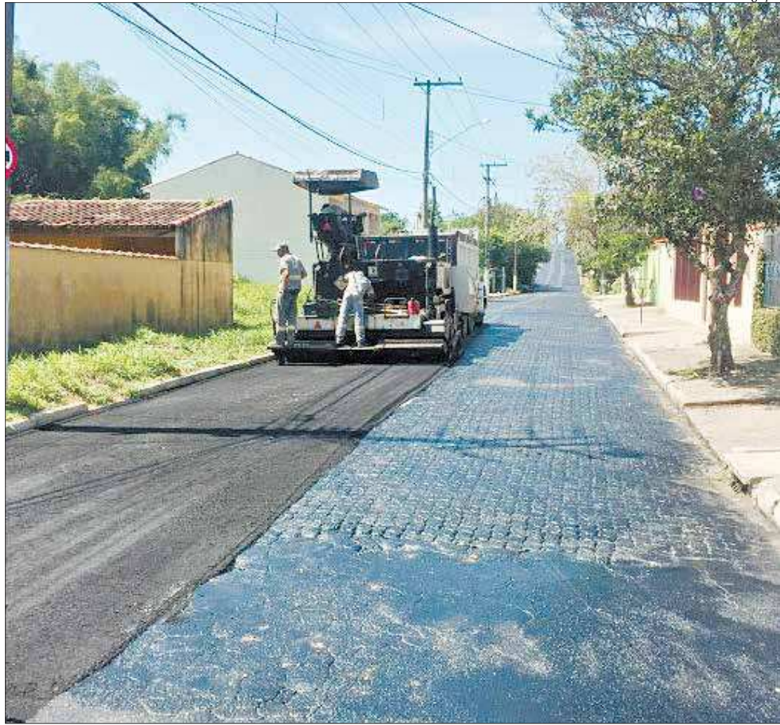
Trabalhos começaram no último dia 2 e devem se estender pelos próximos meses, segundo a Prefeitura de Resende

“Gosto de acompanhar de perto os trabalhos e obras da Prefeitura. A colocação de asfalto no bairro Ipiranga era um sonho não só dos moradores, mas meu também. Durante muitos anos, os moradores desse bairro se sentiram abandonados por terem ruas esburacadas, com lama e