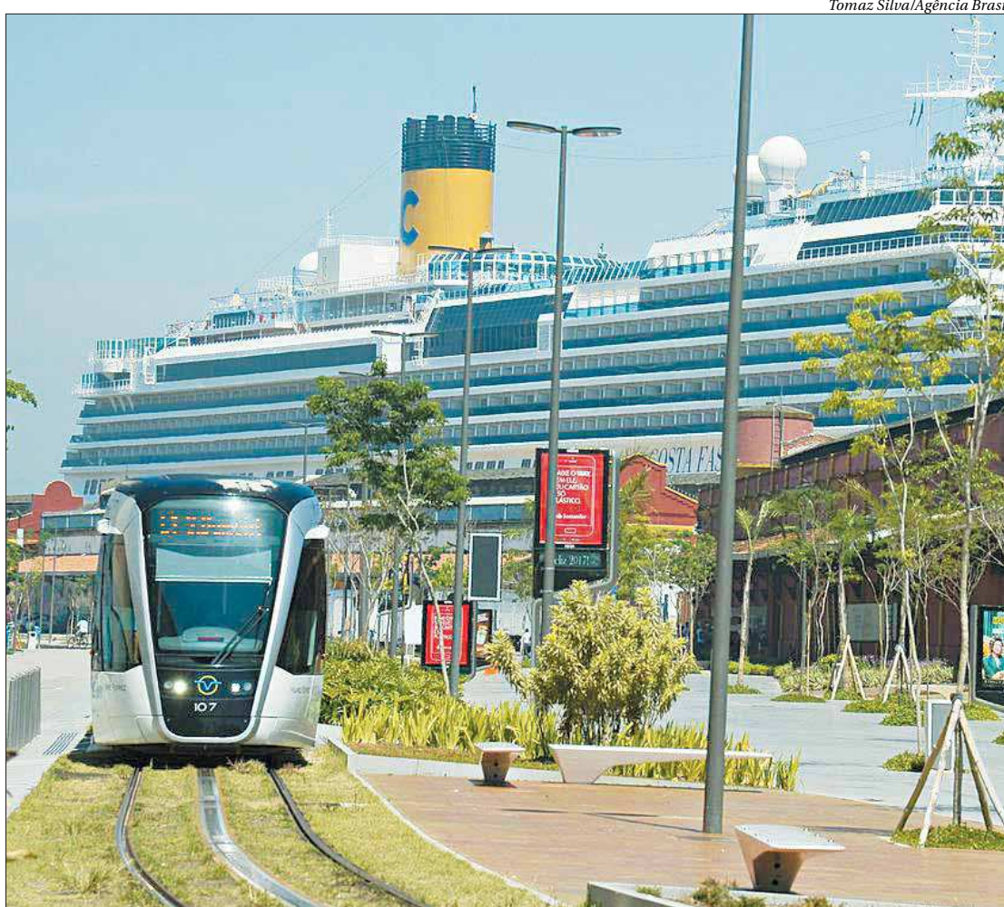
Este ano, a temporada 2019/2020 de cruzeiros receberá oito navios. O Rio é um dos destinos mais procurados

O Caribe é outro destino preferencial, com 64 mil brasileiros navegando para a região, entre janeiro e junho de 2019. A África e o Oriente Médio também são desta-