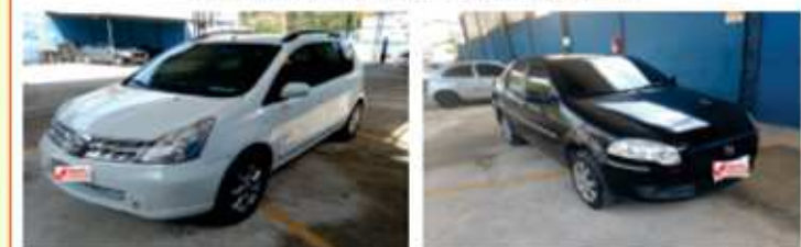
LIVINA S 2013 SIENA TETRAFUEL 2011