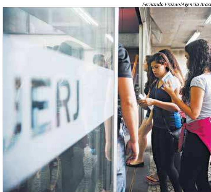
Uerj está com três editais abertos para oito vagas em níveis médio e superior

A Fundação de Apoio à Escola Técnica do Estado do Rio de Janeiro (Faetec), está com processo aberto até 8 de novembro para a