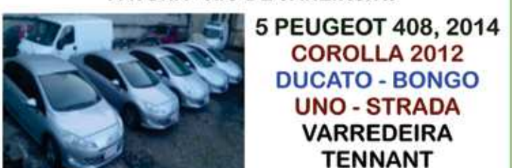
5 PEUGEOT 408, 2014 COROLLA 2012 DUCATO - BONGO UNO - STRADA VARREDEIRA TENNANT