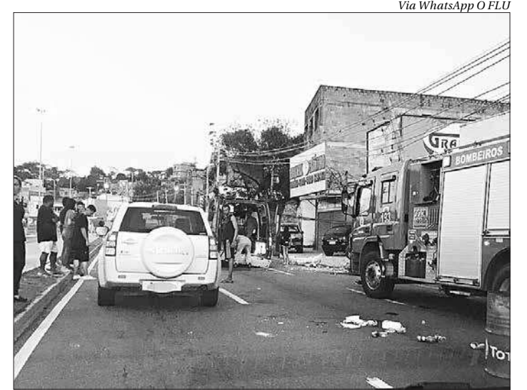
Carro colide contra poste, capota e deixa mortos e feridos em Niterói

"Costumo dizer que a união faz a força. O Legislativo e Executivo, pensando na melhoria das nossas estradas e na melhoria da qualidade de vida dos municípios, se uniram às prefeituras. Todos sairão ganhando com o desenvolvimento do nosso estado", disse Uruan. ■