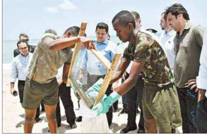
Alcolumbre acompanhou limpeza da praia da Barra de São Miguel, em Alagoas

O presidente em exercício, Davi Alcolumbre, disse na quinta (24) que vai editar uma Medida Provisória (MP) para liberar recursos emergenciais aos municípios nordestinos atingidos pela mancha de óleo. “[Uma MP] para que os recursos cheguem na ponta, para que os estados e municípios possam de fato promover um aporte num contingente de trabalhadores nessas regiões, que já tiraram mais de mil toneladas desse rejeito das praias do Nordeste”, disse, em entrevista coletiva em Alagoas.