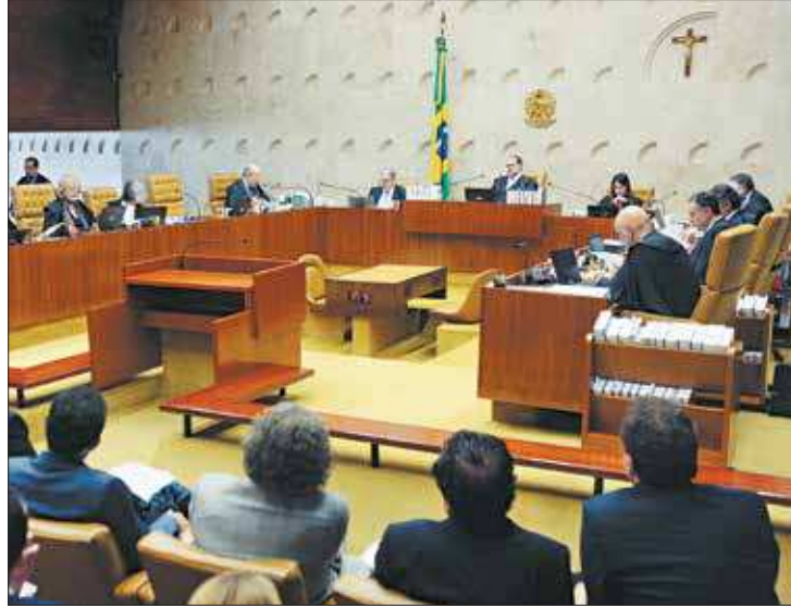
Na quinta-feira aconteceu a quarta sessão de julgamento das ADCs no Supremo

O ministro do Supremo Tribunal Federal (STF) Ricardo Lewandowski votou nesta quinta (24) contra a validade da execução provisória de condenações criminais, conhecida como prisão após segunda instância. Com o voto do ministro, após quatro sessões de julgamento, o placar está 4 votos a 3 a favor da medida. Após o voto do ministro, a sessão foi suspensa e deve ser retomada no dia 6 de novembro.