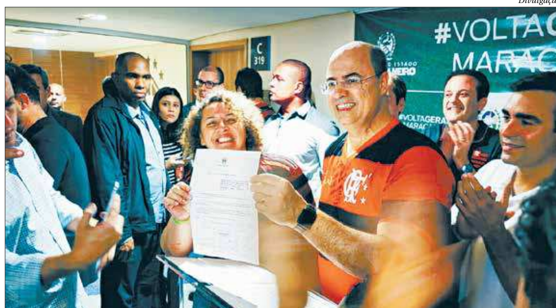
A deputada Zeidan e o governador Witzel, que sancionou a volta da geral no intervalo do jogo desta quarta-feira

A Lei 8.575/19 diz que o Poder Executivo está autorizado a criar estes espaços, foi publicada no Diário Oficial desta quinta (24) e é de autoria dos deputados estaduais Zeidan Lula (PT) e André Ceciliano (PT), que preside a Assembleia Legislativa do Estado do Rio de Janeiro (Alerj). A partir dela, o Governo do Rio está autorizado a retirar as cadeiras