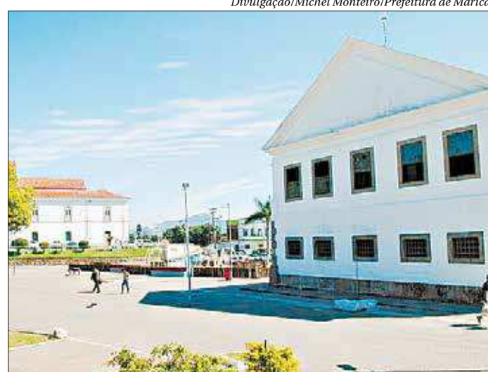
A Praça Orlando de Barros Pimentel será palco da Festa Literária

A Festa Literária também vai promover o Dia do Cosplay que pretende reunir fãs que se fantasiam como seus personagens de séries, filmes, games ou desenhos preferidos para um concurso. Os três primeiros colocados ganharão vale-livros nos valores de R$ 300 (1º lugar), R$ 150 (2º lugar) e R$ 100 (3º lugar). ■