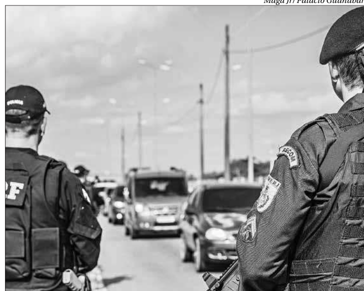
Parceria entre PRF e forças policiais contribuiu para queda na criminalidade

Por esta razão, a iniciativa chega, a partir deste mês de outubro, a mais três rodovias federais – Via Dutra e BR-040, na área da Baixada