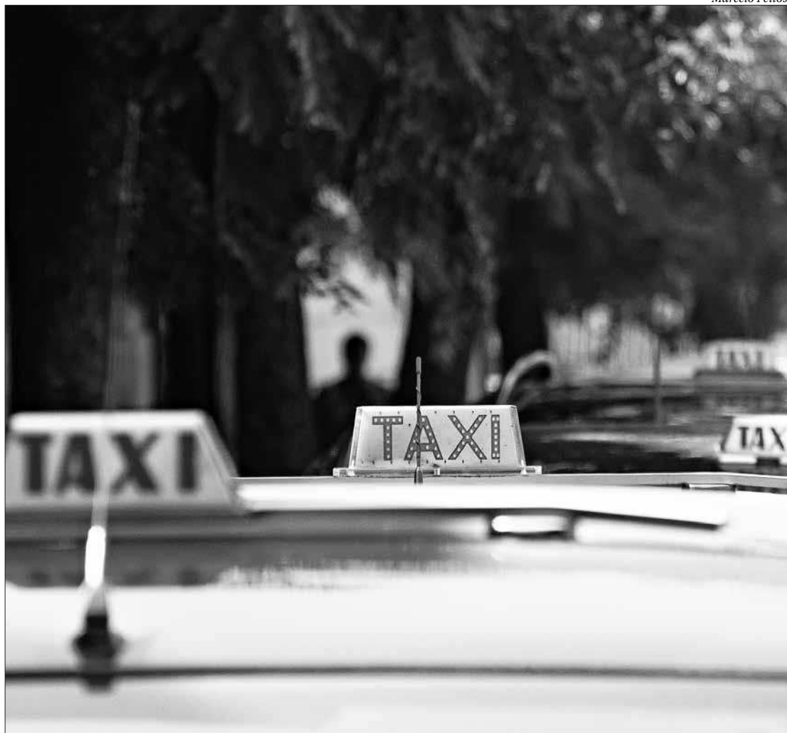
Taxistas defendem a criação de um aplicativo único para solicitação do transporte na cidade de Niterói