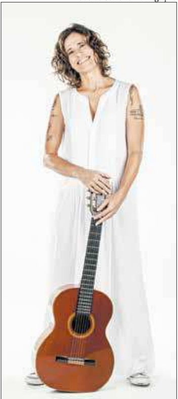
Cantora promete viagem pelo repertório de Milton Nascimento