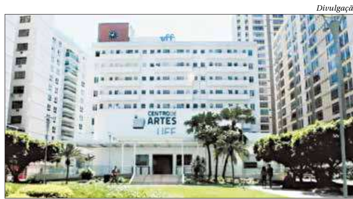
A Reitoria da UFF, em Icaraí, Niterói: universidade vai parar no final de ano

segundo carta divulgada pela instituição, porque um laudo técnico da Superintendência de Arquitetura, Enge-