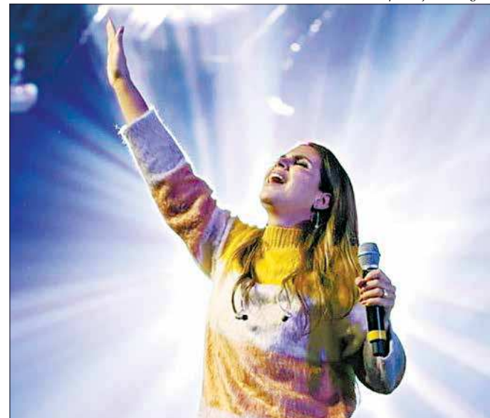
Aline Barros faz o show de abertura no Parque de Exposições

Para abrir a edição de 2019, a cantora gospel Aline Barros vai apresentar ao público seus maiores sucessos. Na sexta é a vez do pagodeiro Thiaguinho, no sábado a cantora Claudia Leite, e no domingo, a dupla Maiara e Maraisa. ■