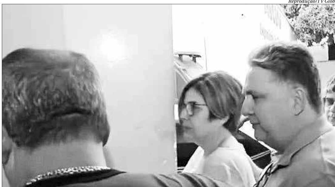
Decisão de prender os políticos foi tomada pela 2ª Câmara Criminal do Tribunal de Justiça do Rio de Janeiro

“Não tem como a população não perceber que isso é uma vingança pelas denúncias todas que eu fiz ao Ministério Público”.