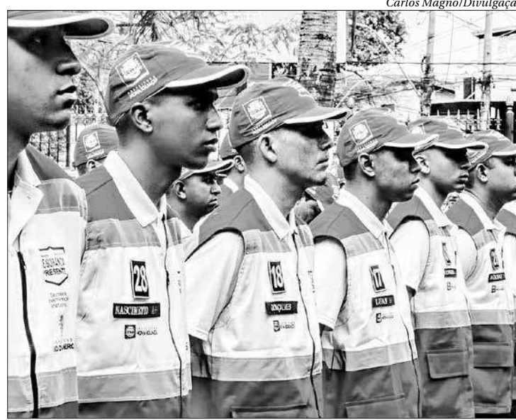
Unidade de polícia de proximidade foi instalada na praça do bairro iguaçuano

“Temos hoje aqui homens e mulheres comprometidos com o futuro do nosso estado. Vamos fazer o estado voltar a ser uma terra de esperança, o Rio de Janeiro já está neste caminho. O programa Segurança Presente é mais um exemplo de iniciativa que oferece dignidade ao povo”, afirmou o governador.