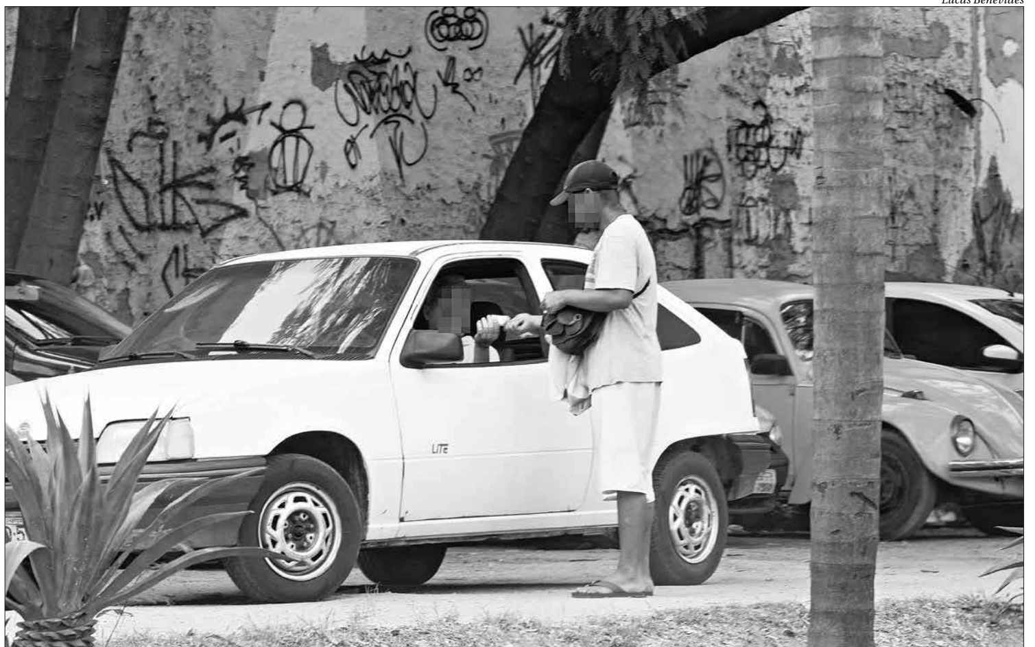
Sistema rotativo prevê cobrança de R$ 2 a R$ 2,50 pelo período, bem menos que os R$ 5 que os guardadores irregulares costumam cobrar dos motoristas