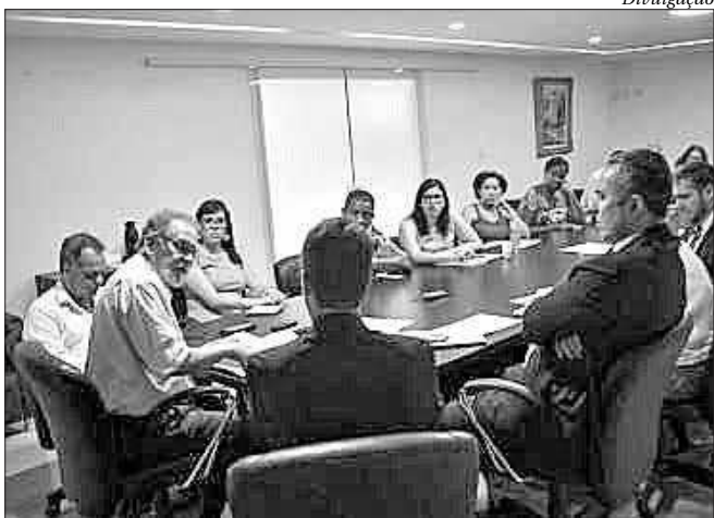
Reunião contou com líderes do governo, presidente da Casa e membros do MP

Um dossiê sobre a atuação da Fundação Municipal de Saúde (FMS) de Niterói será preparado pela Comissão de Saúde da Câmara, que acusa a prefeitura de evitar convocação de concurso público para a área da saúde nos últimos anos. O material será encaminhado à Promotoria de Tutela da Saúde, da Cidadania e ao Ministério Público Federal do Trabalho.