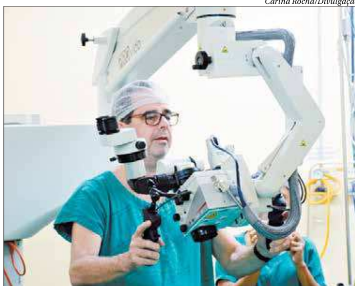
Novo equipamento já foi instalado e aguarda qualificação dos servidores

Entre os recursos presentes no novo equipamento, também será possível gravar e transmitir, através das câmeras do microscópio, os procedimentos cirúrgicos para monitores externos à