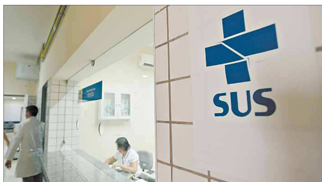
Por determinação legal, desde 1999 a rede do Sistema Único de Saúde oferece a cirurgia de reconstrução da mama

O evento comemorativo da RECONSTRUÇÃO MAMÁRIA: 25 ANOS: AVANÇOS E DESAFIOS, desse primeiro grande marco, será realizado este ano, em 13 de novembro 2019, promovido pela Academia de Medicina do Rio de Janeiro com participação da Sociedade Brasileira de Cirurgia Plástica – RJ, da Sociedade Brasileira de Mastologia – RJ, da Agência Nacional de Saúde – ANS e com representação da ABRAPAC- Associação Brasileira de apoio aos pacientes com câncer. ■