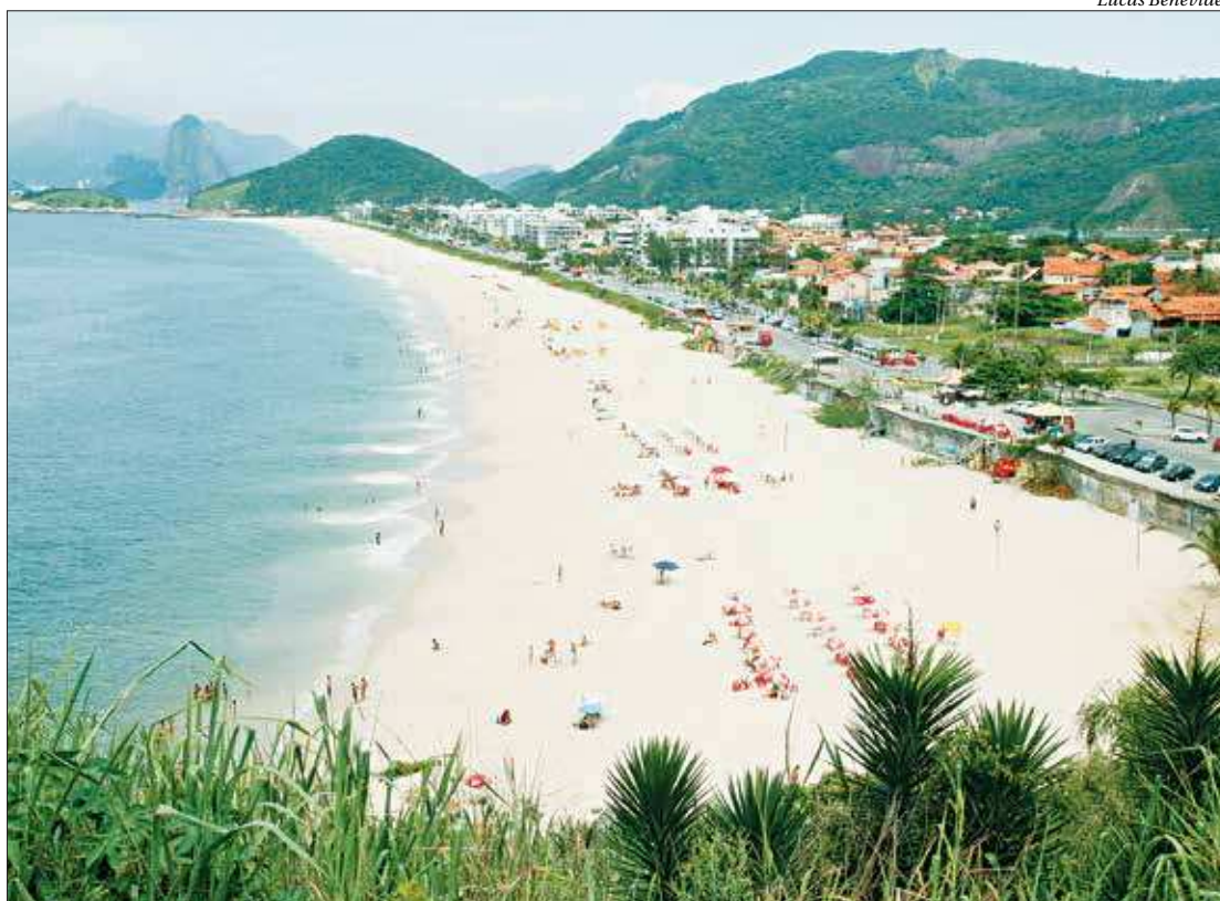
Piratininga está entre os bairros com maior valorização de apartamentos, segundo o Sindicato da Habitação (Secovi) Rio

A pesquisa Cenário do Mercado Imobiliário de Niterói 2019, que será lançada