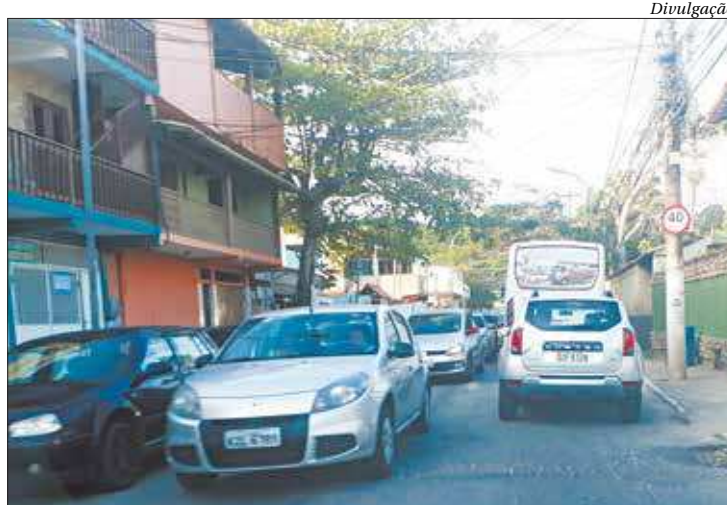
Na Rua dos Biquínis, trânsito fica bastante complicado durante o verão

O procedimento administrativo tem como objetivo minimizar os problemas enfrentados pelos moradores e turistas durante a temporada do verão, quando a Região dos Lagos recebe mais de um milhão de visitantes. Os cortes de luz costumam ocorrer com frequência, e muitos bairros, principalmente os que ficam nas chamadas pontas de linha, não recebem água, embora a Prolagos cobre tarifa mínima de dez mil litros por mês (mesmo sem consumo) para garantir o abastecimento no pico do abastecimento no verão. A cobrança está sendo