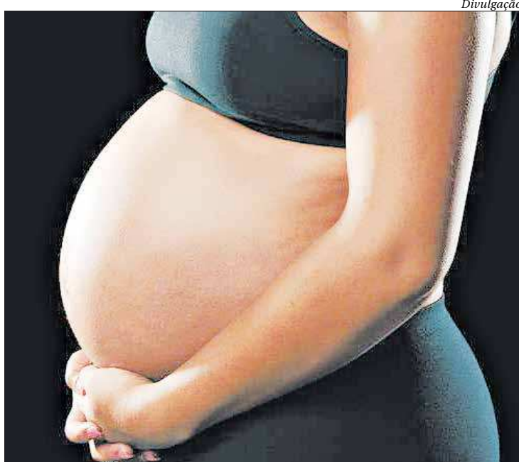
Grávidas terão orientação se desejarem entregar o filho para adoção