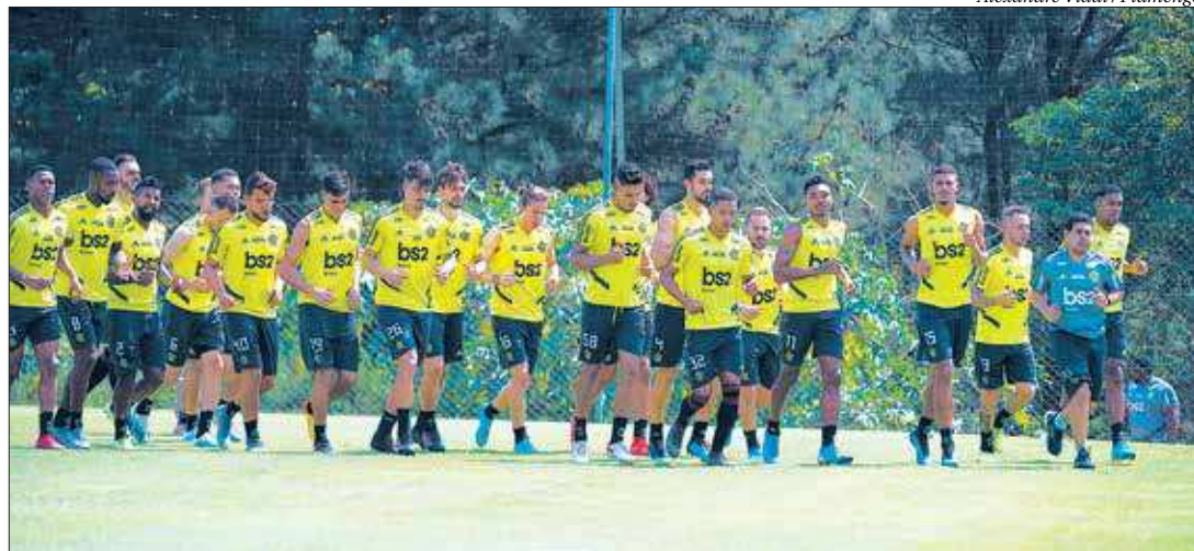
Elenco rubro-negro mira manter uma boa vantagem no Campeonato Brasileiro para o segundo colocado Palmeiras