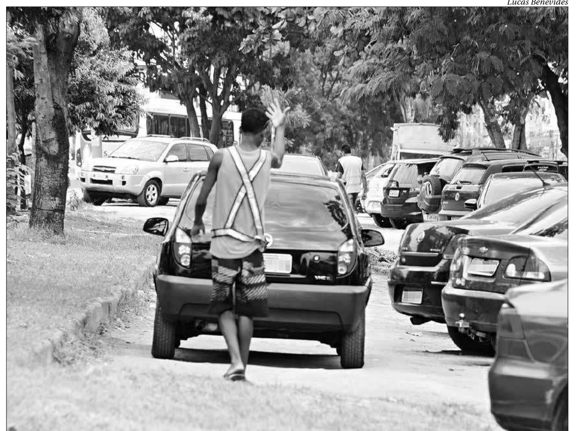
Muitos flanelinhas utilizam coletes para dar aparência de regularidade à ação ilegal nas ruas de São Gonçalo

A Guarda Municipal informou que a atuação do flanelinha deve ser investigada pela Polícia Civil, pois configura-se exercício ilegal de profissão. Em nota, a