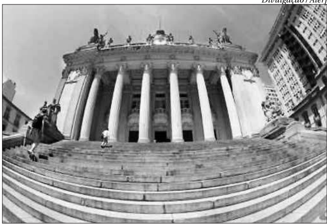
O Palácio Tiradentes, sede da Assembleia Legislativa do Estado do Rio