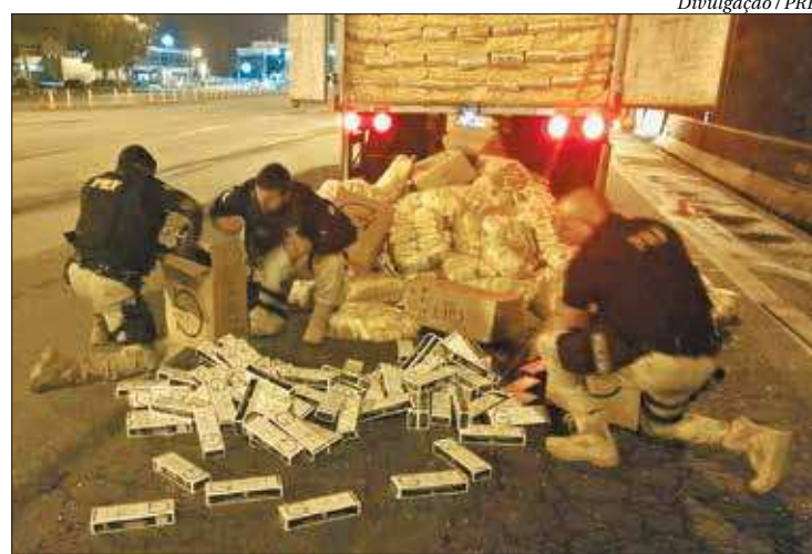
Para PRF, a venda do cigarro ilegal financia quadrilhas de milicianos e traficantes

Segundo a PRF, a venda do cigarro ilegal é responsável por financiar a compra de armas, drogas e outras atividades criminosas de quadrilhas de milicianos e traficantes. Estima-se que as organi-