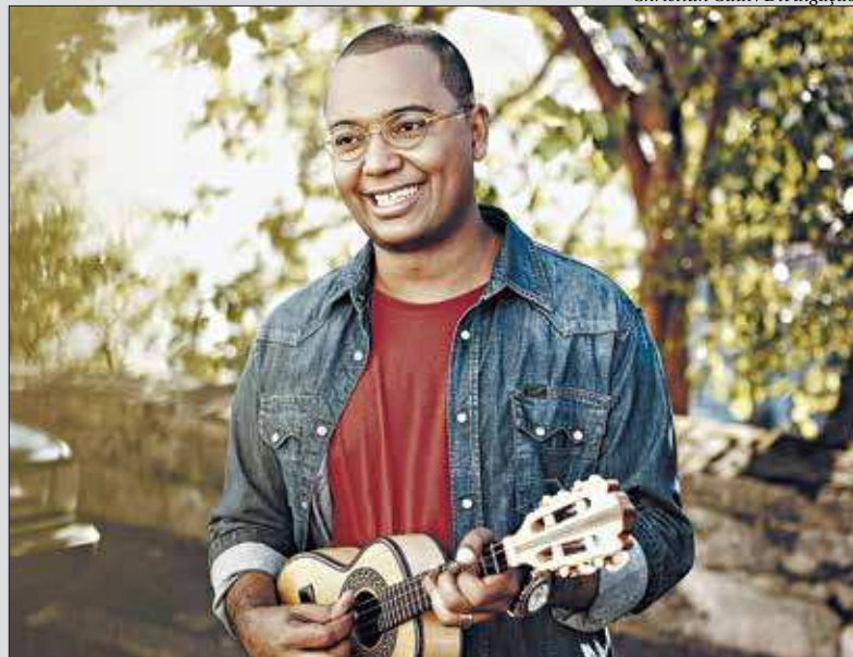
Dudu Nobre estará na quadra da escola tocando sucessos e clássicos do samba