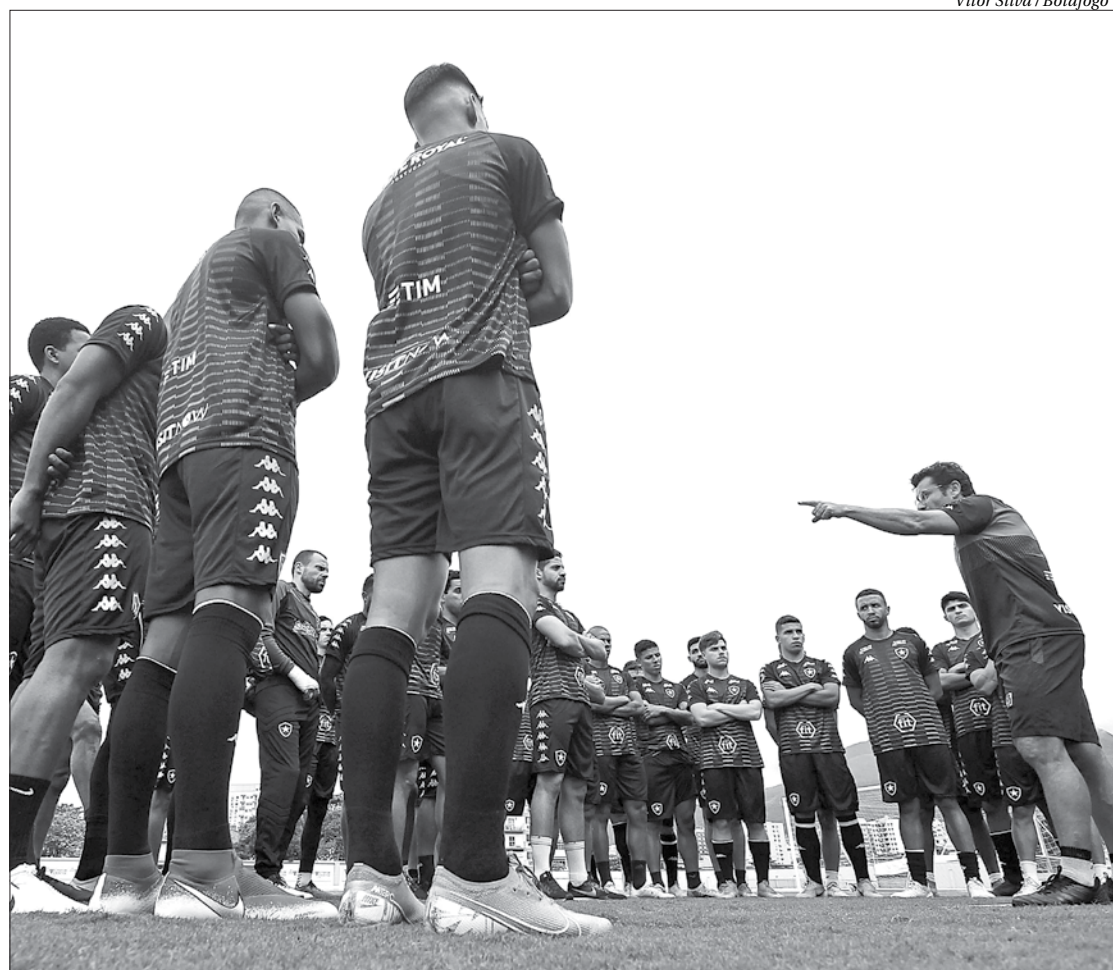
Vitor Silva / Botafogo

CSA Dom 10/11 - Rei Pelé Flamengo Qui 13/11 - Maracanã Goias Seg 18/11 - São Januário