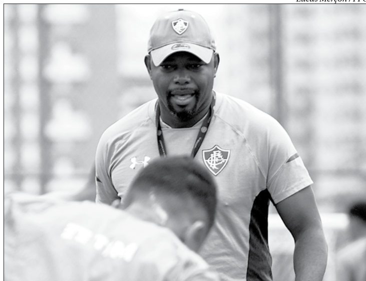
Lucas Merçon / FFC

O Fluminense, por sua vez, vai a campo no Morumbi pressionado pelos recentes resultados ruins e a entrada na zona de rebaixamento do Campeonato Brasileiro. Os cariocas não vencem há cinco jogos e buscam uma vitória para tentar se afastar do fantasma da Série B.