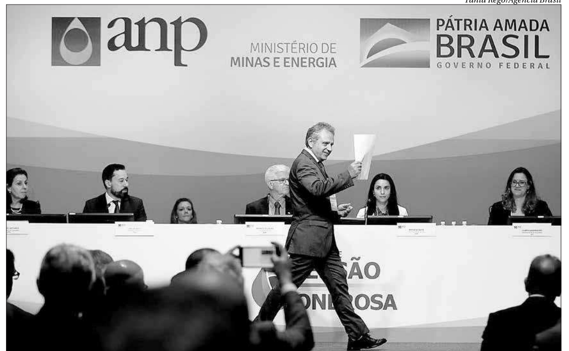
Leilão dos excedentes da Cessão Onerosa do pré-sal teve participação determinante da Petrobras

"Claramente, nosso viés é de descontingenciamento