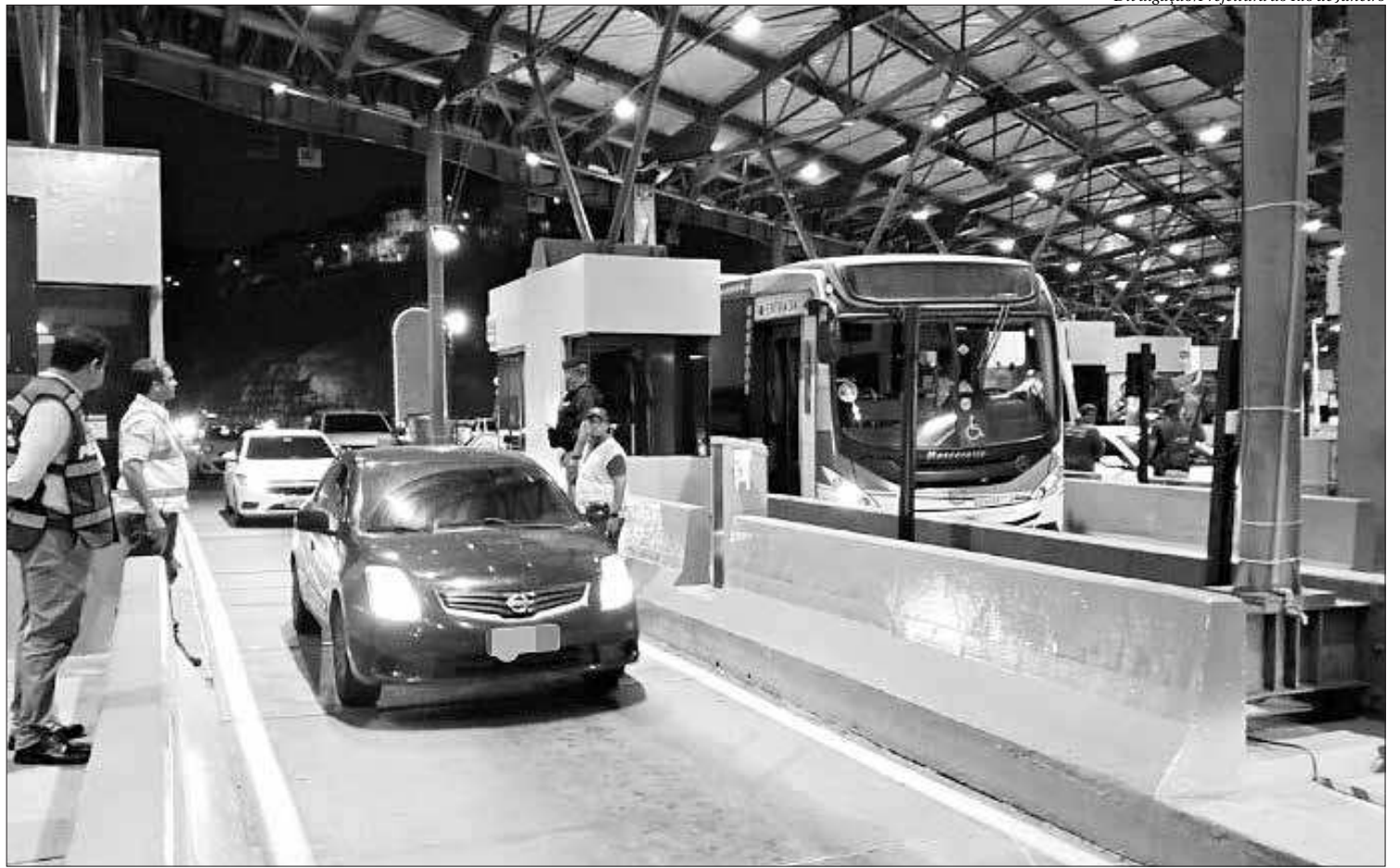
Prefeitura do Rio liberou o pedágio da Linha Amarela pela segunda vez em dez dias. Motoristas que utilizam a via diariamente aprovaram a medida

Com isso, a administração da via, de 17 km, ligando a Barra da Tijuca ao Centro da cidade e ao Aeroporto Internacional do Galeão, passa para a Prefeitura do Rio. A publicação também estabelece que, como medida preventiva a eventuais impugnações, a Prefeitura do Rio poderá instituir caução para prevenir a necessidade de indenização em favor da concessionária. ■