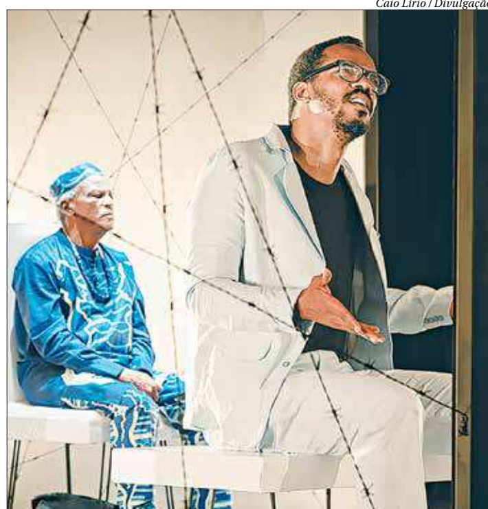
Primeiro encontro de pai e filho no palco trata da identidade africana

Personagens se encontram num aeroporto e estabelecem diálogo sobre a História