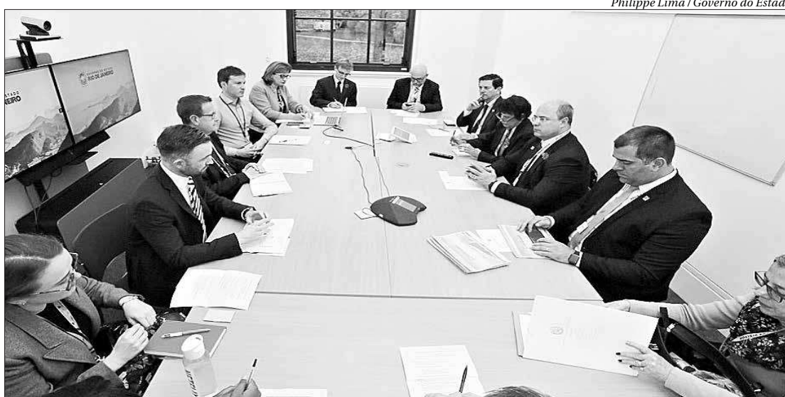
O governador destacou a importância do intercâmbio com países de primeiro mundo para o desenvolvimento do Rio

A Autoridade de Infraestrutura e Projetos trabalha em conjunto com o