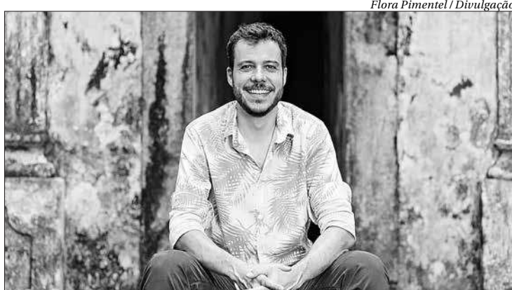
Cantor promete mostrar canções do repertório que apresentava na Lapa

No repertório da noite João também traz as canções que sempre cantou quando se apresentava na Lapa, como "Disritmia", de Martinho da Vila. ■