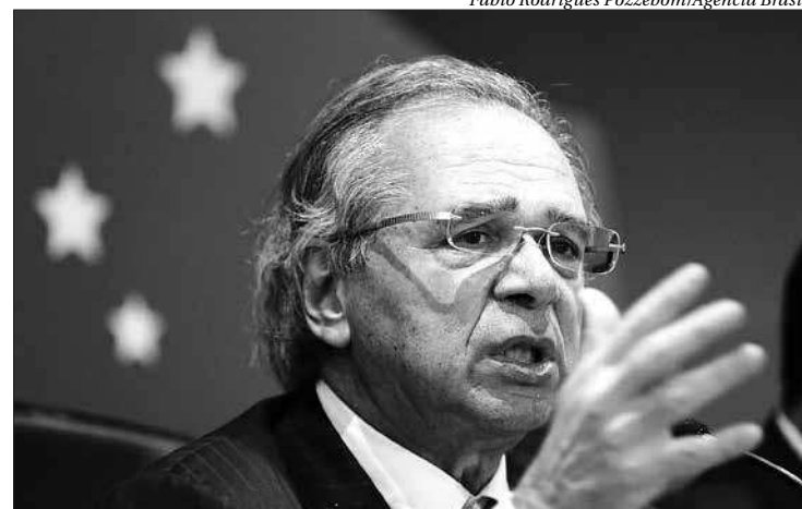
Paulo Guedes se reuniu nesta quarta com cerca de 40 senadores

O pacote contém três propostas de emenda à Constituição (PEC) que tratam de