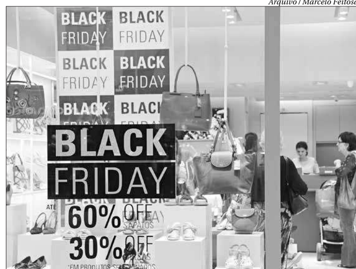
Levantamento revela que 63,4% dos consumidores quer aproveitar as ofertas

A pesquisa revelou que os consumidores pretendem gastar cerca de R$ 557,22, em média, nas promoções do dia 29, esse valor é três vezes maior que a quantia gasta no Dia dos Namorados, maior ticket médio dentre as datas comemorativas. O IFec RJ estima que a Black Friday movimentará cerca de R$ 4,5 bilhões na economia fluminense. Entre as opções preferidas estão: eletrônicos (58%),