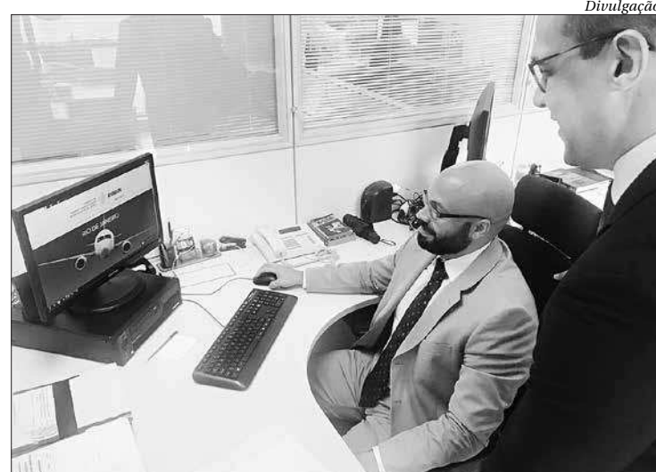
Empresários terão acesso a dados socioeconômicos por regiões e por setor

"Com a iniciativa, disponibilizaremos um conjunto de dados que tornará possível ao empresário realizar comparações de dezenas de indicadores socioeconômicos dos 92 municípios fluminenses. Com alguns "cliques", o futuro investidor poderá projetar, por exemplo, qual