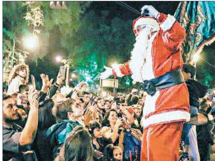
O clima natalino irá invadir a cidade serrana com uma iluminação especial