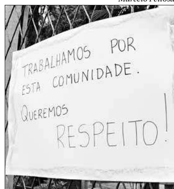
Na fachada da escola, cartazes afixados

Segundo responsáveis por alunos, a invasão aconteceu pouco antes de 5h. Os criminosos entraram pelo teto do