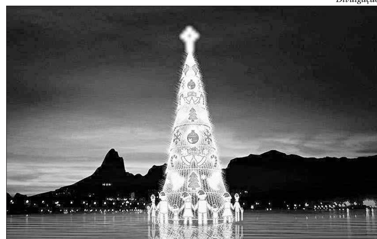
Árvore de Natal da Lagoa está garantida, através de parceria com a Light

Segundo o governador Wilson Witzel, a Árvore da Lagoa é importante para a economia da cidade e do estado e, por isso, todos os esforços foram feitos para que o empreendimento pudesse acontecer.