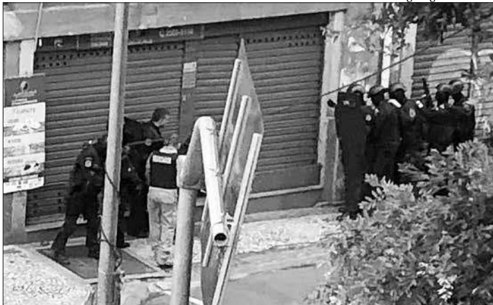
Multidão de curiosos acompanhou o trabalho da polícia para libertar os reféns

Até o fechamento desta edição, cinco pessoas haviam sido libertadas pelo criminoso, a última, uma mulher, foi solta por volta de 20h30. A polícia estimava que houvesse ainda uma ou duas vítimas com o sequestrador no inte-