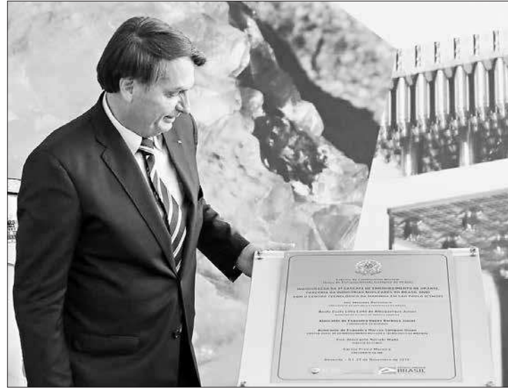
Bolsonaro descerrou placa comemorativa: investimento na produção de urânio

O presidente Jair Bolsonaro participou na sexta-feira (29) da inauguração da 8ª cascata de ultracentrífugas, na Fábrica de Combustível Nuclear (FCN), em Resende (RJ). A unidade pertence à estatal Indústrias Nucleares do Brasil (INB). Com a entrada em operação da cascata, a INB aumentará em 20% a produção de urânio enriquecido no país, sendo possível produzir 60% do necessário para abastecer a usina nuclear de Angra 1. O governo federal investiu, em 2019, um total de R$ 18 milhões no projeto.