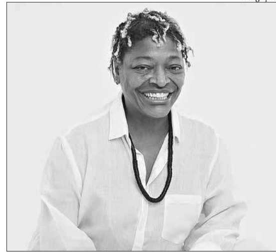
Mart'nália canta em São Domingos nesta segunda