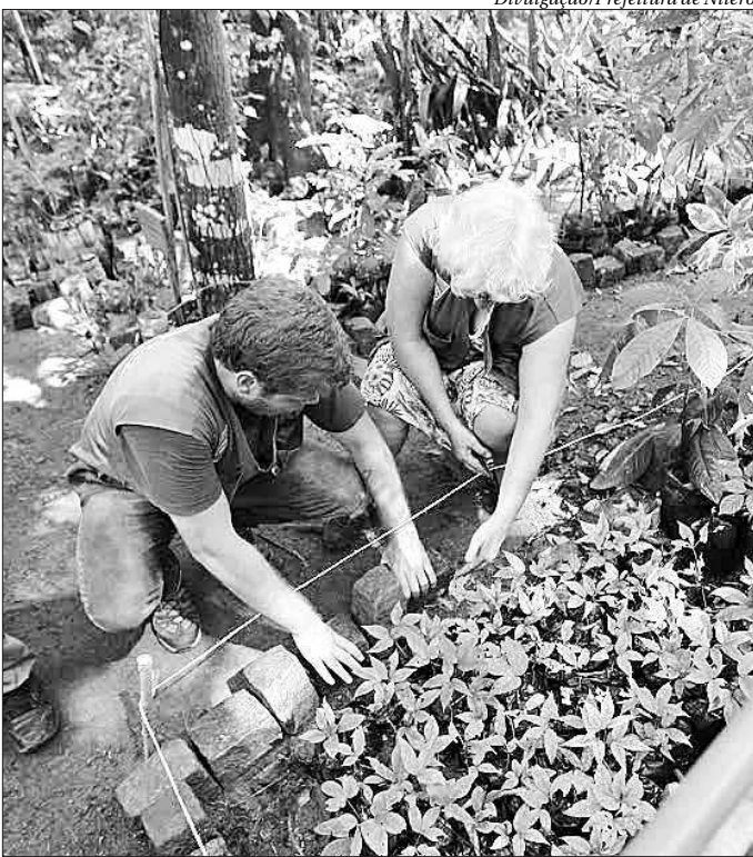
Voluntários poderão ajudar na atividade em área degradada do parque

coordenador do Parnit, explica a importância das ações como essa. "O reflorestamento em unidades de conservação é muito