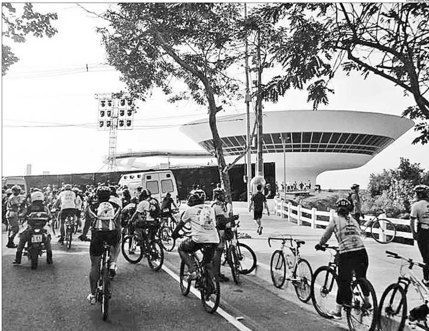
Amantes do esporte vão poder aproveitar o evento que vai movimentar as ruas da cidade de Niterói neste domingo. O Passeio terá início às 9h

“Pedalar sempre foi a minha vida, comecei a usar