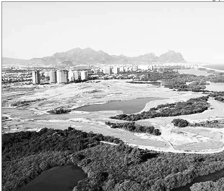
O Campo Olímpico de Golfe na Barra recebe competição neste fim de semana

O Campo Olímpico de Golfe, onde será realizado o torneio deste fim de semana, é com certeza um dos maiores legados das Olimpíadas e está em pleno fun-