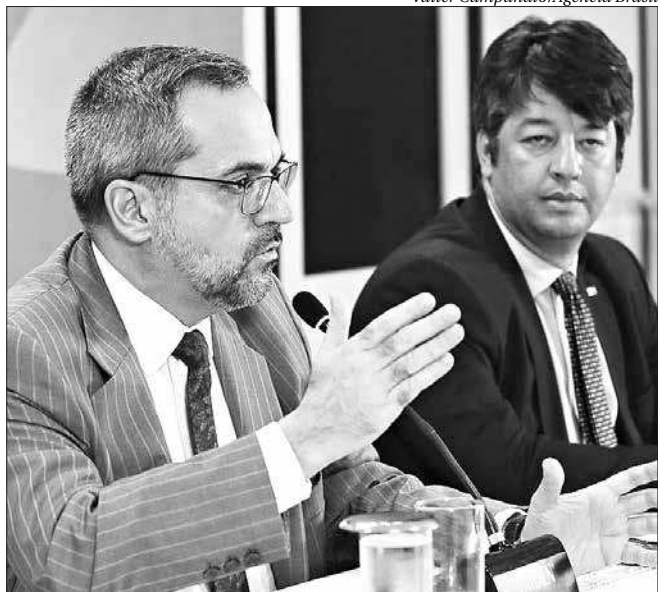
Abraham Weintraub e o secretário de Educação Superior, Arnaldo Lima