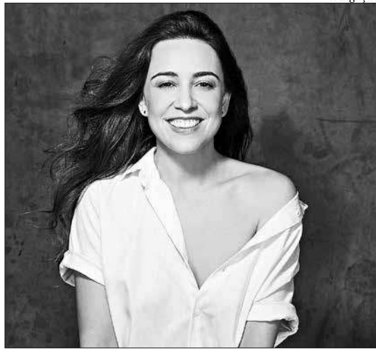
Roberta Sá faz uma participação especial no sábado