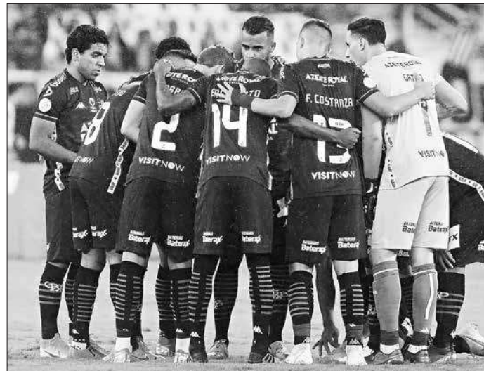
Atletas se unem nesta reta final com o objetivo de escapar da degola

“Nós precisamos dessa vitória de qualquer maneira para afastarmos de vez esta