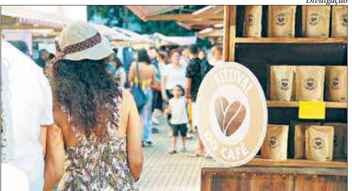
Vários produtos feitos à base de café também vão estar expostos

Produtos à base de café, como sabonetes e cremes,