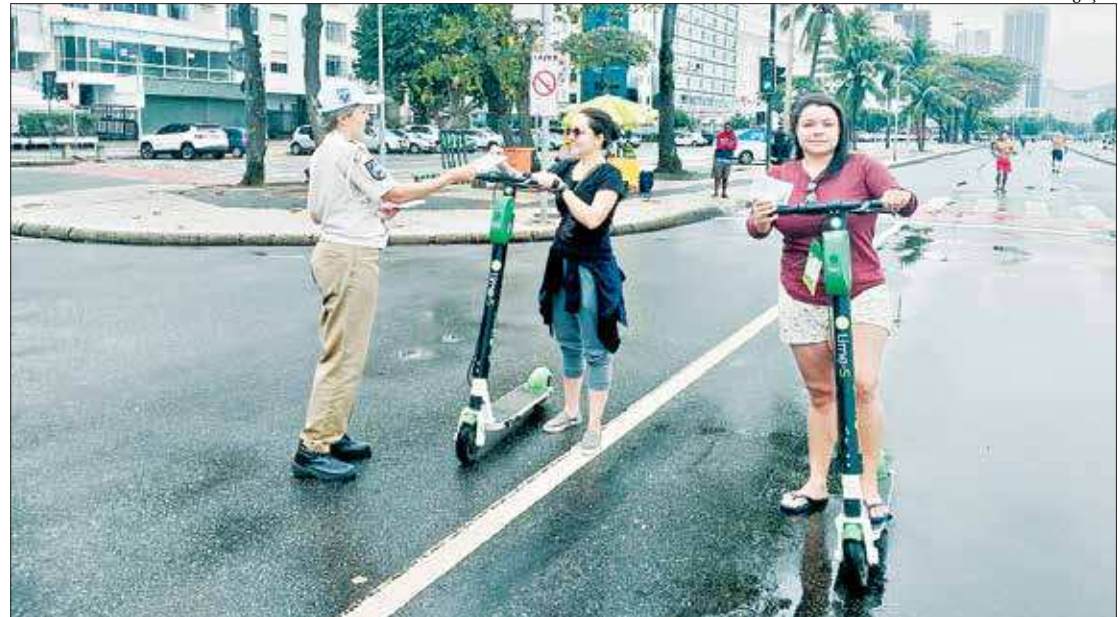
Guardas-municipais vão verificar, entre outros itens, uso por menores de 18 anos. Multas variam entre R$ 100 e R$ 200

"O trabalho de ordenamento, orientação e de fiscalização de diversas regras e normas, como no caso das