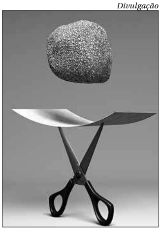
Fotografias utilizam o universo infantil para levantar questões

Na data dedicada ao gênero musical, Niterói preparou programação com estrelas do gênero