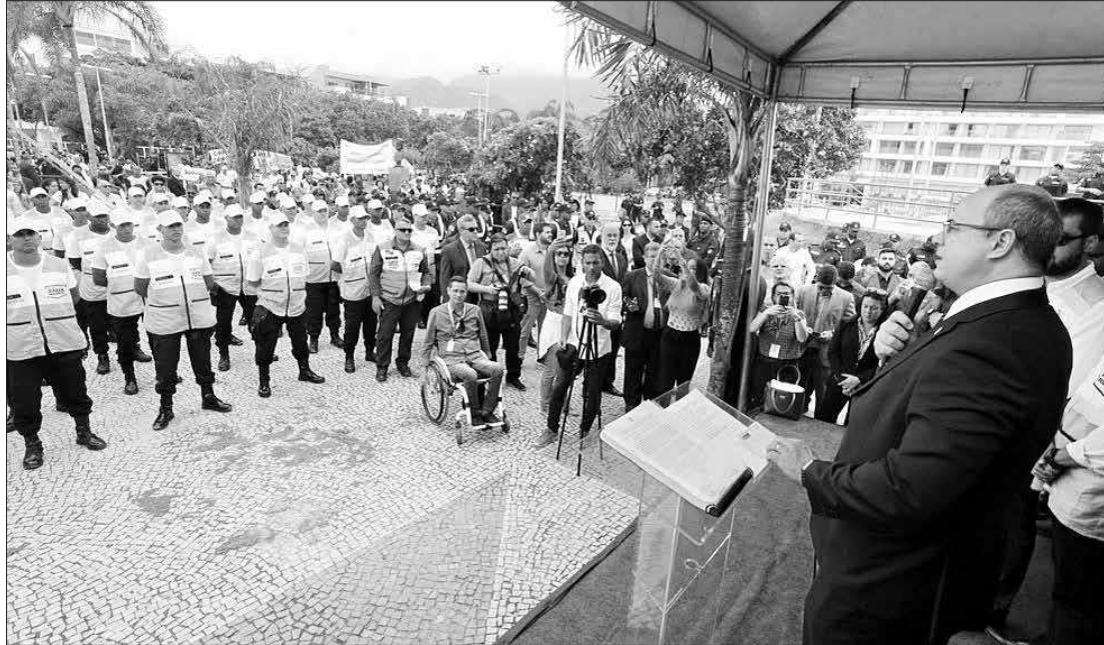
O governador Wilson Witzel participou nesta sexta-feira do lançamento do programa na Barra da Tijuca

Na ocasião, também foram apresentados os 25 novos policiais, selecionados do concurso público de 2014, que passaram a integrar o 31º Batalhão da