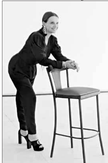
Juliette Binoche em São Domingos

O espaço exibiu os filmes "A Liberdade é Azul", do cineasta Krzysztof Kieślowski, com cópia remasterizada em 4k, no qual Juliette é a protagonista, e o filme "Feliz Aniversário", de Cédric Kahn, com a musa Catherine Deneuve. ■