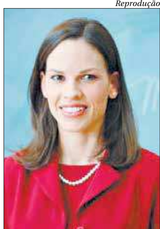
Hilary Swank é uma professora que precisa superar dificuldades

Aos poucos, os alunos vão retomando a confiança em si mesmos, aceitando mais o conhecimento, e reco-