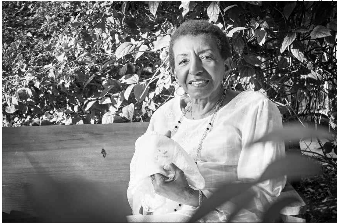
Leci Brandão encerra a noite de domingo (30) no show que reúne grandes nomes na Concha Acústica

No sábado, às 15h, as escolas de samba de Niterói sobem ao palco principal para apresentarem seus sambas-enredos de 2020 e, em