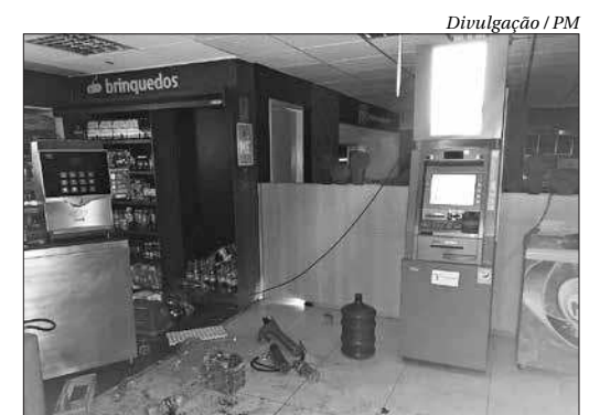
Segundo a polícia, apesar do estouro, os bandidos não conseguiram levar dinheiro

Até o fechamento desta edição não se sabia os motivos que levaram o sequestrador a cometer o ato. Entre os reféns estavam funcionários da Empresa Brasil de Comunicação (EBC). Em nota, a empresa informa que a direção e os gestores da Regional Rio de Janeiro da empresa estavam monitorando a situação de perto e prestando todo o apoio necessário, inclusive jurídico, aos empregados e seus familiares. ■