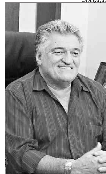
Nelson do Posto também foi prefeito de Magé e deputado estadual

Cavalgadas e festas populares marcaram o governo de Nelson do Posto, que também foi prefeito de Magé, entre 1996 e 2000, e o primeiro deputado estadual eleito por Guapimirim, entre os anos de 2002 e 2004, e reeleito prefeito de Guapimirim de 2005 a 2008. ■