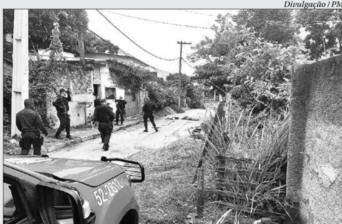
Suspeito foi baleado em confronto com policiais do 12º BPM

Vídeo mostra dois ladrões de moto assaltando ciclista na Rua Ulisses de Oliveira Madruga, no Maravista, em Itaipu, na última quinta-feira (28). ■