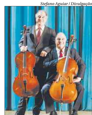
Dupla vai interpretar obras atuais e da origem da carreira

O Parque Lage fica na Rua Jardim Botânico, 414, Jardim Botânico, Rio de Janeiro. Sábado (30), das 9h às 20h. Entrada gratuita.