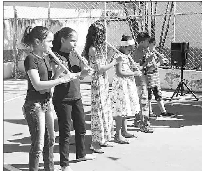
Estudantes vão tocar e cantar canções populares e uma africana

As coordenadoras acreditam, ainda, que o projeto auxilia ainda no trabalho de sala de aula, já que são trabalhadas a interpretação das letras e a leitura.