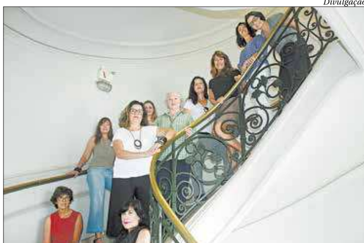
Artistas criaram trabalhos que dialogam com o espaço

"A exposição busca revolver, resgatar e desvelar as histórias submersas da cidade, a arquitetura e a paisagem negligenciadas