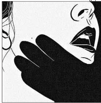
Artista retrata uma perspectiva egocêntrica em seus desenhos

fica no Campo de São Bento, em Icaraí. Até 6 de dezembro, seg a sex, das 10h às 17h; sáb, dom e feriados, das 10h às 15h. Entrada gratuita. Telefone: 2610-5748.