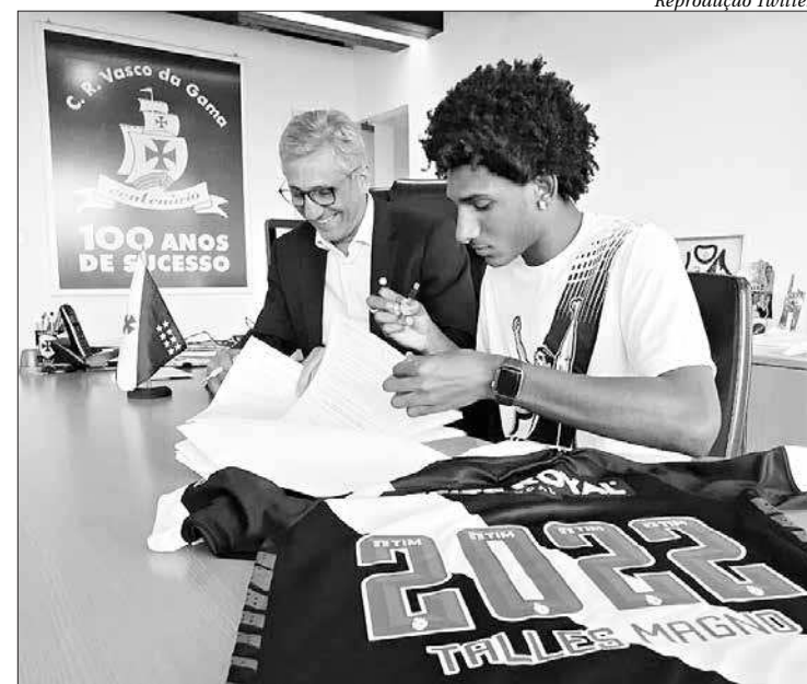
Atleta do Vasco prolongou seu vínculo com o clube carioca nesta sexta-feira

Mesmo após a derrota para o São Paulo na quinta, por 1 a 0, a Mega Loja de São Januário amanheceu mais uma vez com uma grande fila de torcedores com o objetivo de aderir ao projeto vascaíno. ■