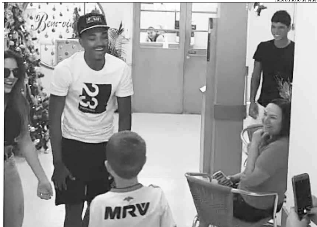
O jogador do Flamengo Vitinho fez a alegria de um jovem torcedor autista rubro-negro durante sua festa de aniversário

O pequeno flamenguista vem passando por momentos de dificuldades e os pais do garoto prepararam essa surpresa especial. A chegada do jogador comoveu ainda estudantes, profes-