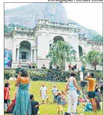
Programação voltada ao público jovem destaca as inovações

O festival traz cinema ao ar livre, caminhada ecológica, palestras, debates, atividades infantis, artísticas e culturais e feira gastronômica, com comidas que representam todas as regiões do Brasil. A programação também traz o Desafio Tack, onde alunos de escolas públicas do ensino médio de todo o Brasil disputam uma viagem para os Estados Unidos, com