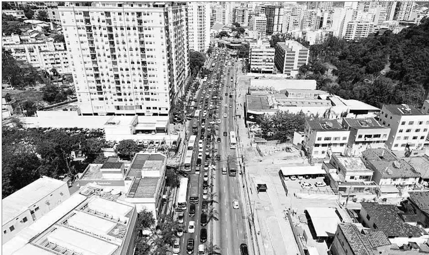
A cada dia, faixas serão fechadas ao trânsito entre 6h e meia-noite. Dois operadores de trânsito estarão trabalhando em cada ponto da interdição na via

No domingo, 1º de dezembro, duas faixas à direita (sentido Centro) na esquina da Marquês do Paraná com Amaral Peixoto e uma faixa à direita (sentido Centro) na esquina com a Rua Miguel de Frias serão fechadas para a conclusão das instalações dos dutos, concluindo as etapas três e quatro da obra.