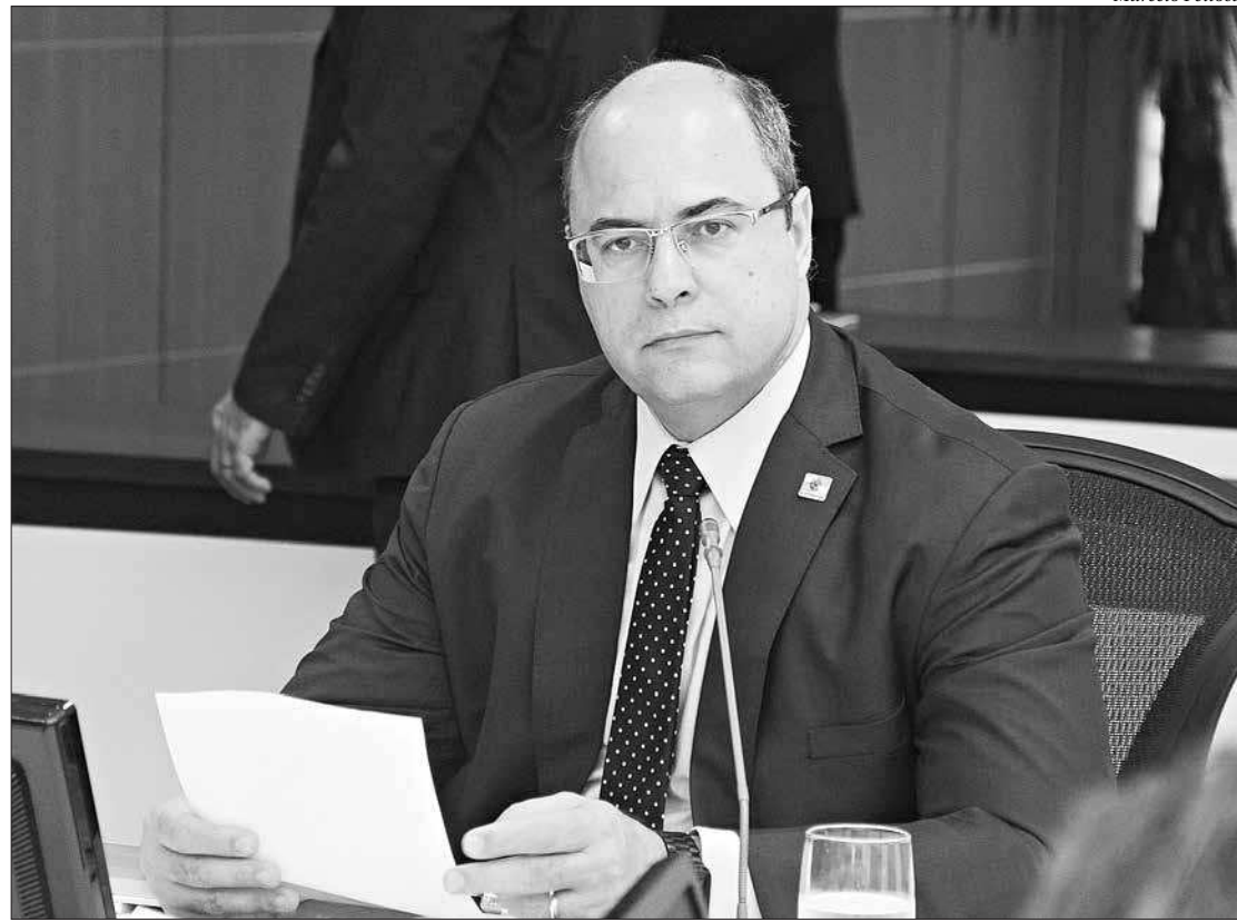
O governador Wilson Witzel apresentou ontem, no Palácio Guanabara, relatório de ações do primeiro ano de governo

Além da promoção internacional do turismo, existe a busca pelo fortalecimento interno