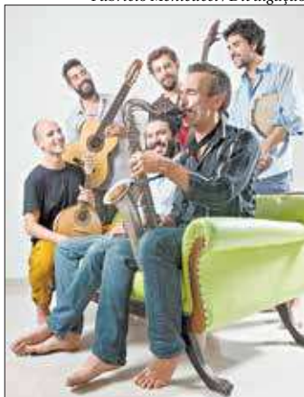
Sexteto Sucupira toca na Fundação