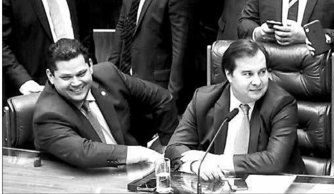
Aprovado - O presidente do Senado, Davi Alcolumbre, e o presidente da Câmara, Rodrigo Maia, após a aprovação do Orçamento de 2020 pelo Congresso. O novo salário mínimo será de R$ 1.031