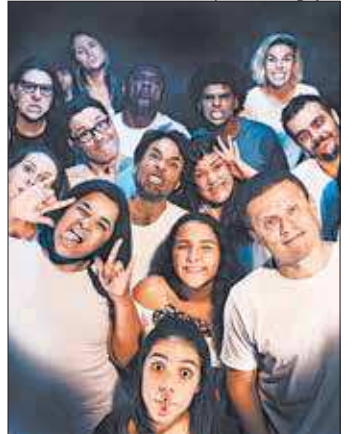
Espectáculo da OST relembra infância e discute a educação no Brasil

menagem à infância, "O Despertar da Minha Vida" também busca trazer uma discussão a respeito da educação no Brasil.