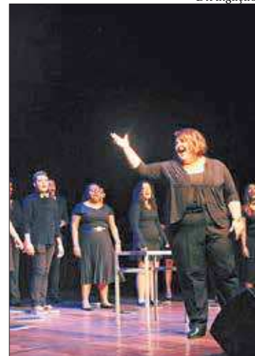
Escola Villa-Lobos levará centenas de vezes ao Palácio Tiradentes

O Palácio Tiradentes fica na Rua Primeiro de Março, s/n, Centro, Rio de Janeiro.