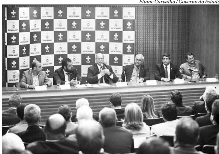
Com os termos, 79 cidades fluminenses serão beneficiadas no Estado

“Desde o início da gestão, procuramos conhecer os problemas, não só da saúde, mas também aqueles que são estruturais do estado. Buscamos todos os esforços para encontrar as soluções e resolvê-los. Estamos em vias de conquistar os 12% de investimento na saúde. Além deste convênio de hoje, alguns municípios estarão recebendo, ainda nesta semana, mais R$ 340 milhões para ajudar no custeio da saúde nas respectivas. Portanto, com este repasse, as fontes municipais ficam liberadas para encerrar o ano com o pagamento do 13º salário de seus