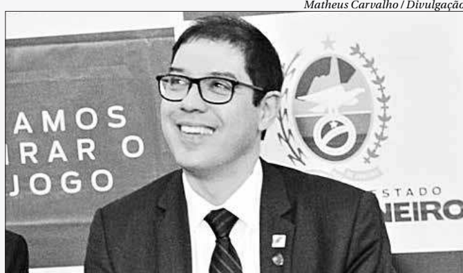
Altineu Côrtes é o novo secretário estadual de Meio Ambiente

O novo secretário de Ambiente e Sustentabilidade, Altineu Côrtes, ressaltou a missão de desburocratizar processos, mas sem deixar de lado a proteção do meio ambiente.