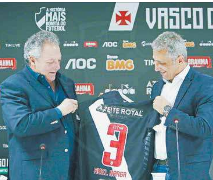
Novo comandante do Vasco, Abel Braga falou dos planos do clube para 2020

“Eu sei bem o que é essa camisa. Eu era reserva onde eu jogava quando cheguei nesse clube e, com seis meses, estava na Seleção. Depois de dois anos, fui para o PSG. A cultura que tenho de falar francês hoje, uma honra, foi o Vasco que me proporcionou. Quero ver chegar logo aos 200 mil sócios. Sei a filosofia do clube e o que o torcedor gosta de ver: boa exibição, jogada bonita, ousadia, mas, acima de tudo, quero ver coragem. O que caracteriza o Vasco é o cara, para evitar um gol, cabecear até a trave,