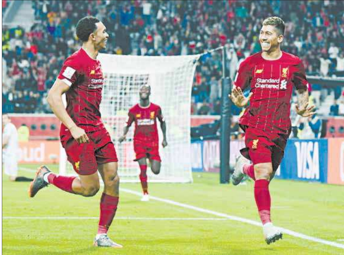
O atacante brasileiro Roberto Firmino desafogou o time inglês com um gol decisivo nos últimos minutos da partida

Já pensando na final histórica de sábado, o elenco rubro-negro volta aos treinos nesta