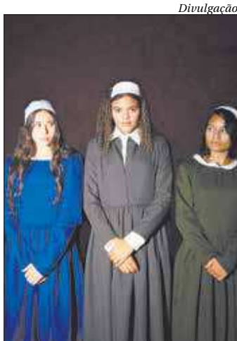
'Bruxas de Salém' é inspirada em julgamentos ocorridos no século 17

Segregação, censura, medo, imposição e religiosidade extrema, são sinônimos de toda essa tragédia ocorrida do 17, que ainda é atual. ■