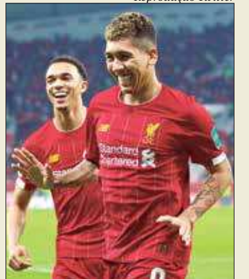
Firmino foi o autor do gol da vitória