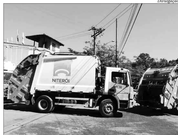
As alterações acontecem nos dias 24 e 31 de dezembro

Nos dias dos feriados de Natal, 25 de dezembro, e de Réveillon, dia 1º de janeiro, a coleta não sofrerá alteração. A Prefeitura de Niterói e a Clin alertam os moradores da cidade sobre o respeito aos horários do caminhão, a fim de manter a cidade limpa. ■