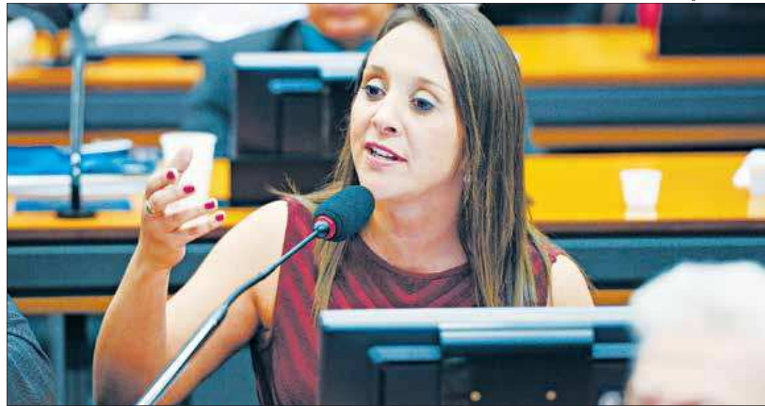
A deputada federal Renata Abreu (Podemos) propôs a criação da CPI do Femicídio, na Câmara dos Deputados, em Brasília

Segundo a proponente da indicação, a Comissão pretende investigar as razões do aumento da taxa de crimes de feminicídio e a aplicação da legislação de proteção a mulheres por parte do Estado brasileiro. O próximo passo, segundo a parlamentar, será procurar o presidente da Câmara, Rodrigo Maia (DEM-RJ), para estabelecer um cronograma para a instalação da CPI, que deve ocorrer no início do próximo ano.