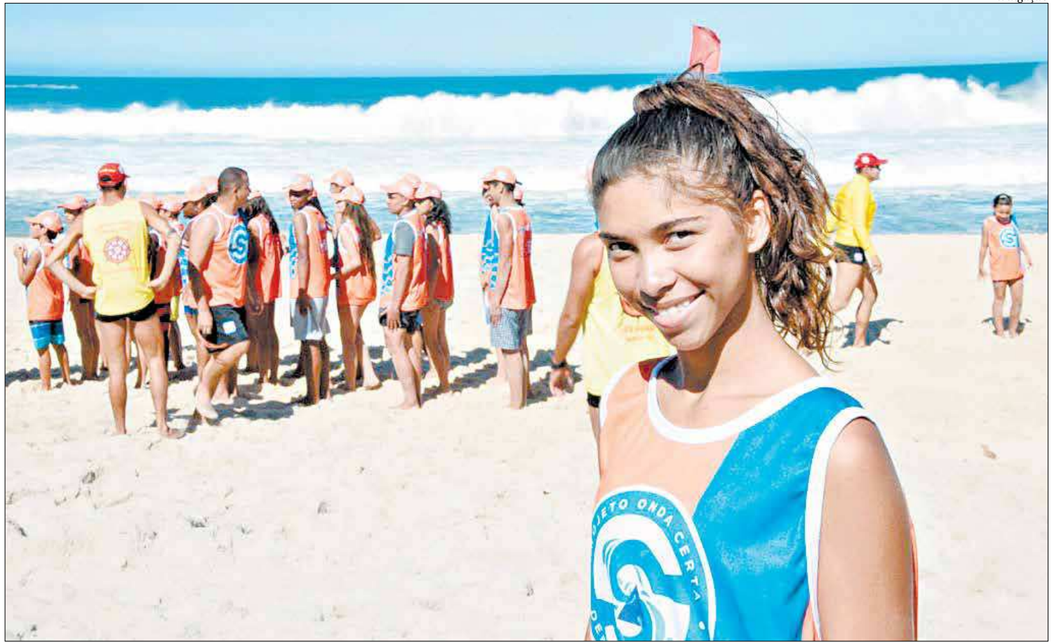
O Projeto Botinho acontecerá entre os dias 20 e 31 de janeiro, em mais de 20 praias do Estado do Rio de Janeiro. Inscrições acontecem nos dias 13 e 14

Cabo Frio - A Secretaria de Esporte e Lazer de Cabo Frio vai reabrir as inscrições para a Colônia de Férias de Verão no dia 7 de janeiro, e podem ser feitas na sala de projetos da SEMEL, que fica no primeiro andar do Ginásio Poliesportivo Alfredo Barreto. A Colônia de Férias de Verão vai de 7 a 31 de janeiro. As atividades estarão disponíveis para crianças e jovens