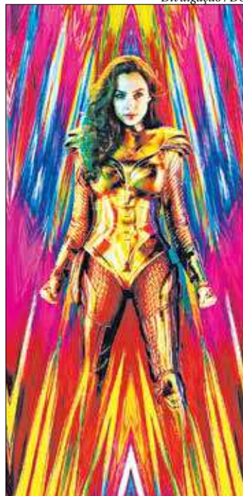
Sequência de Mulher-Maravilha será ambientada nos EUA nos anos 80

drama é baseado na história real da queda de Roger Ailes, ex-editor-chefe da Fox News, acusado de assédio sexual por ex-colegas de trabalho.