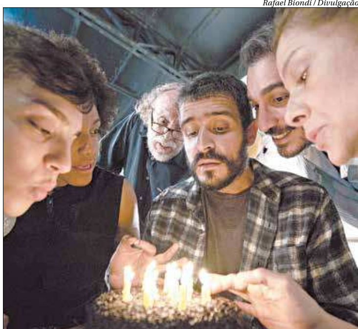
Peça investiga com ironia os rumos do teatro, da arte em geral e da cultura

O Teatro Poeira fica na Rua São João Batista, 104 – Botafogo. Até 16 de fevereiro, de quinta a sábado, às 21h, e domingo às 19h. Preço: R$ 60 (inteira). Classificação: 12 anos. Telefone: 2537-8053.