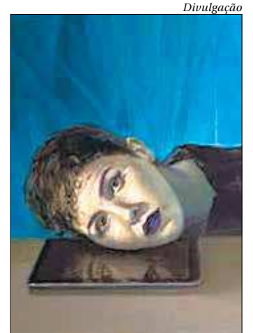
Mostra reúne série que utiliza anomia, trabalhada por Émile Durkheim

O Centro Cultural Correios Rio de Janeiro fica na Rua Visconde de Itaboraí, 20 - Centro do Rio. Até 26 de janeiro, de terça a domingo, das 12h às 19h. Telefone: 2253-1580.