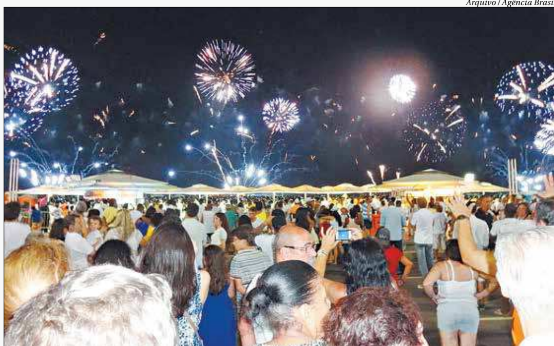
Milhares de pessoas irão ver a chegada de 2020 das areias da Praia de Copacabana, uma das mais disputadas do Brasil

Para celebrar a chegada de 2020, o Réveillon de Copacabana, a maior festa a céu aberto do mundo, faz uma reverência à beleza natural e arquitetônica do Rio de Janeiro e à diversidade das paisagens, comemorando a escolha da cidade como a primeira capital mundial da arquitetura. E para festejar, muita música! Esse ano, quatro palcos irão ocupar a orla de Copacabana, com atrações que vão do pop ao funk, do samba ao rock, e prometem agradar a todos os públicos. O palco principal "Amor a cada Vista" vai ter 20m de largura e 15m de altura, um enorme telão de LED e iluminação especial, para receber nomes como Diogo Nogueira, Ferrugem,