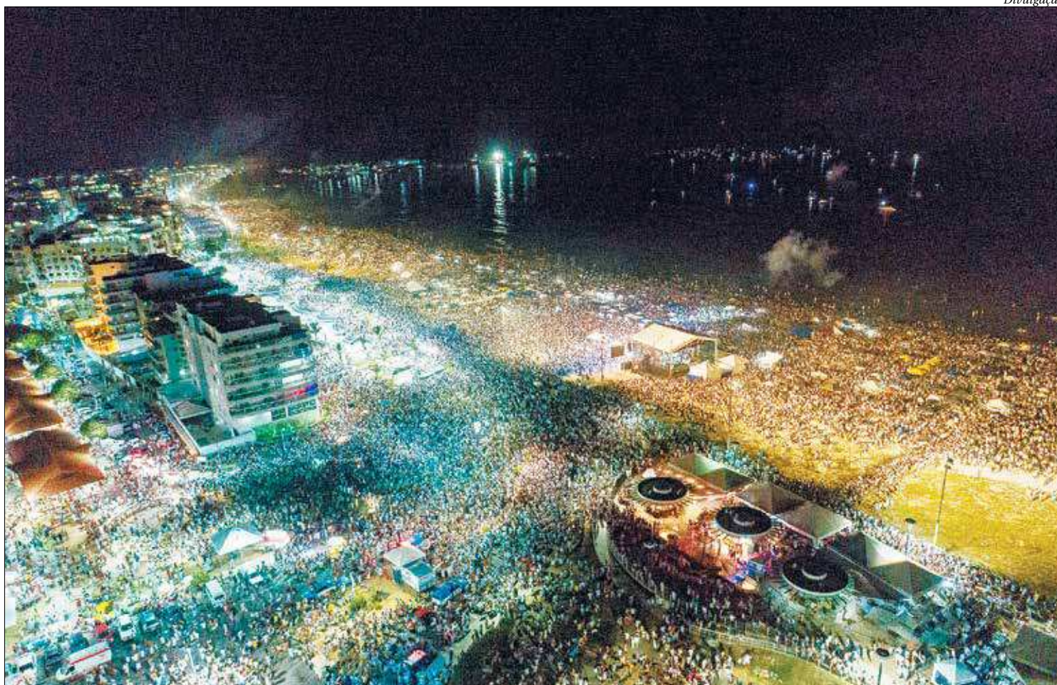
A Praia do Forte em Cabo Frio segue como o principal destino para a chegada do ano novo na Região dos Lagos. Serão 12 minutos de queima de fogos

A orla da Praia do Forte foi fechada ao trânsito no último dia 26 de dezembro. No dia 31, as ruas que dão acesso à orla serão fechadas a partir das 5h. São elas: Avenida Macário Pinto nas rotatórias ao lado das praças dos Quiosques, da Cidadania