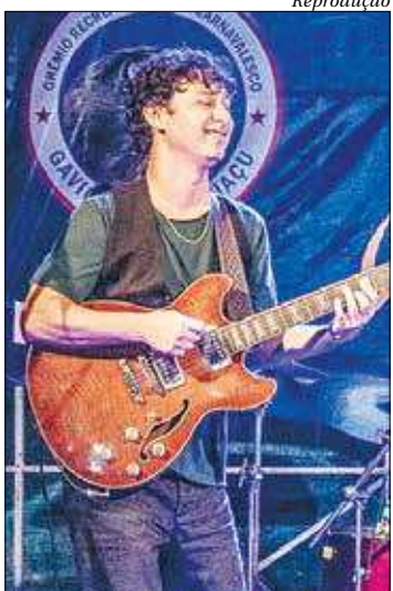
Sujazztivo está entre as atrações que abrem o evento no sábado (4)

A chinesa Liu Yifei dá vida à corajosa Mulan no novo live action da Disney