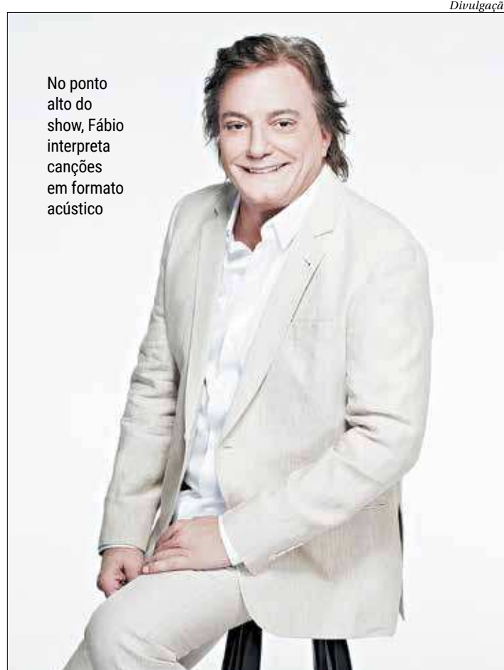
No ponto alto do show, Fábio interpreta canções em formato acústico

Esta turnê conta com um cenário que é composto por painéis de LED, colunas e elementos que valorizam a estética do show. O conceito da proposta permite que Fábio utilize a mesma cenografia em todos os shows, independente do tamanho, mantendo a dinâmica e beleza do espetáculo com o auxílio da iluminação