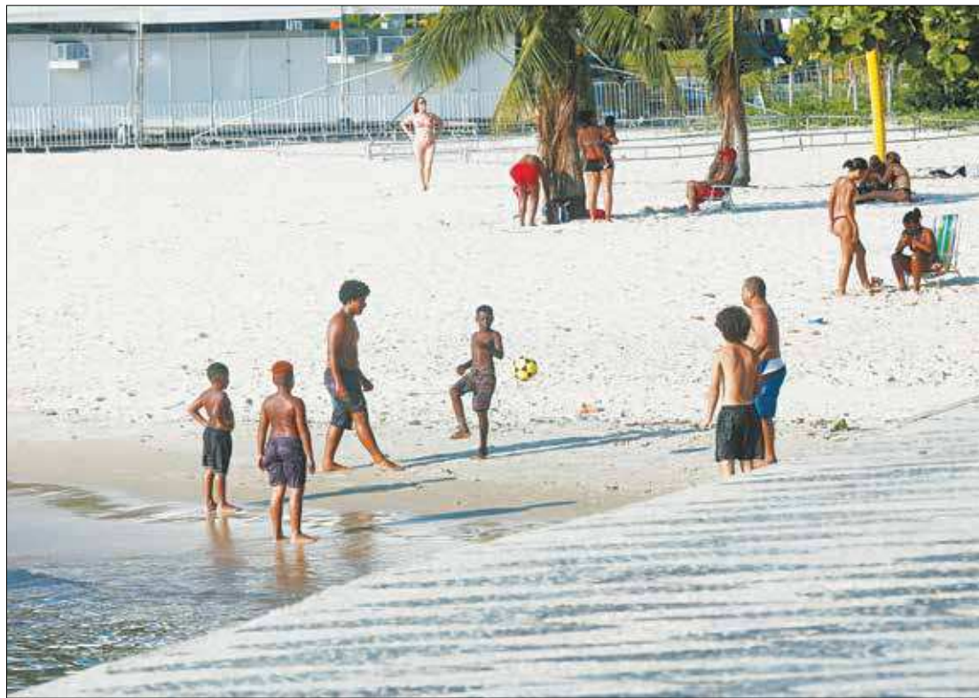
Atividades ao ar livre são fundamentais para o desenvolvimento dos jovens. Não faltam opções em diversas cidades do Rio

de 6 a 17 anos no Complexo Poliesportivo Aracy Machado, no Portinho. Haverá duas turmas, cada uma com 60 alunos. As aulas acontecerão em dois turnos, das 8h30 às 12h, e das 13h30 às 17h. As inscrições são gratuitas e os interessados em inscrever os filhos devem apresentar RG, CPF, comprovante de residência, além de certidão de nascimento ou RG do menor.