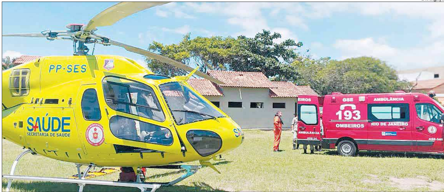
O objetivo é diminuir o tempo dos resgates não só no mar, mas também em terra, como em acidentes nas estradas que cortam o município