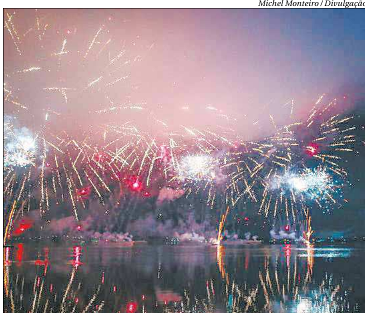
Em Maricá, a queima de fogos será na Lagoa de Araçatiba