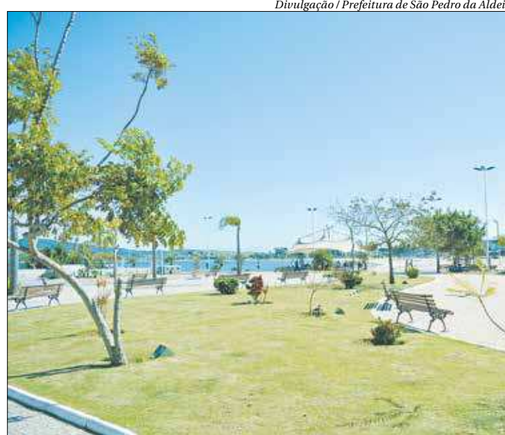
Em São Pedro da Aldeia, a festa acontece na Praia do Centro

e das Águas; Avenida Hilton Massa, no entroncamento com a Rua Antônio Feliciano de Almeida; Rua Almirante Barroso, no fechamento do acesso ao Canto do Forte; Avenida Nilo Peçanha com Rua Tamoios; Rua Francisco Mendes com Rua Tamoios e Rua Treze de Novembro com Av. Hilton Massa.