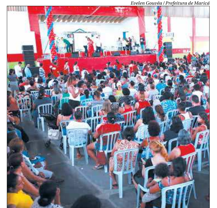
Na sexta-feira houve entrega de mais 6 mil novos cartões da Bolsa Mumbuca

“Hoje, uma mulher que tenha cinco crianças em casa terá R$ 780 por mês para sustentar seus filhos com dignidade. Muita gente está criando negócios e gerando empregos na cidade através do cartão Mumbuca. O que acontece em Maricá é uma revolução que chama a atenção do mundo, e oito revistas internacionais publicaram reportagens este ano sobre o programa. A cidade prova que o Brasil pode ser mais justo enquanto o restante do país perde direitos. A miséria acabou em Maricá”, sentenciou.