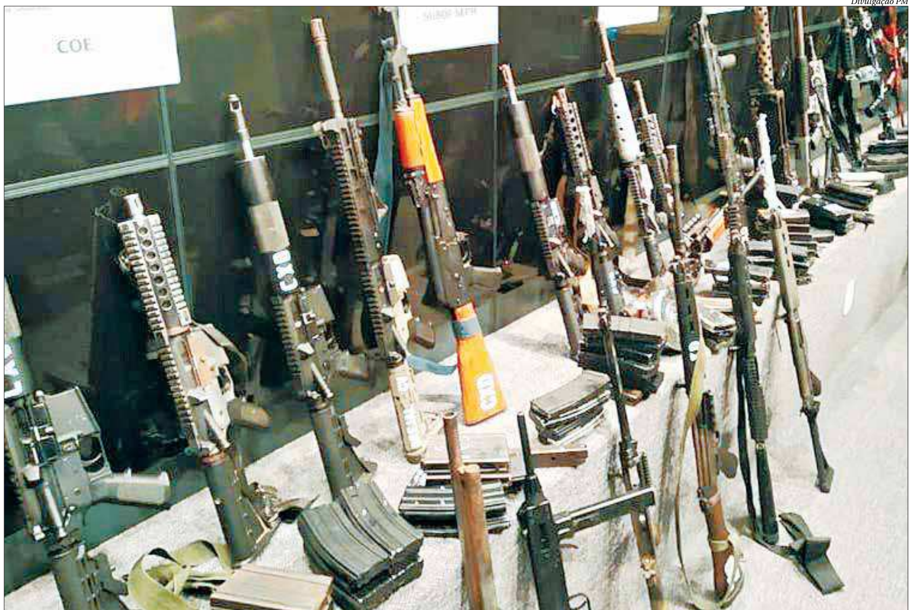
Em 2019, a Polícia Militar conseguiu bater recorde na apreensão de fuzis: foram 505 armamentos, contra 382 recolhidos em 2017 e 330 em 2018, durante operações contra o tráfico