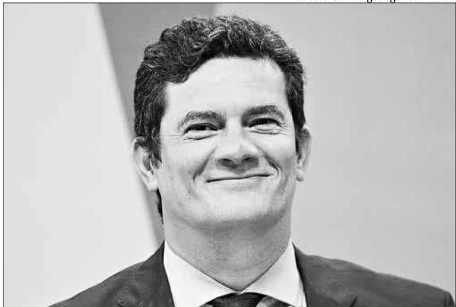
O ministro da Justiça e Segurança Pública, Sérgio Moro