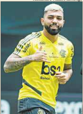
Atacante deve continuar no Rubro-Negro