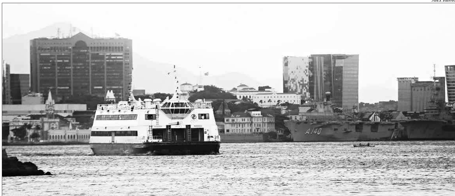
Alteração consiste no aumento do intervalo de 10 para 15 minutos na travessia Praça XV-Arariboia, nos horários de rush. Para Paquetá, o tempo de viagem pode aumentar em 1h

Inicialmente, as mudanças no intervalo entre as viagens iriam ocorrer no dia 30 de dezembro do ano passado para as linhas Paquetá e Cocotá, e dia 2 de janeiro para a linha Arariboia. No entanto, o anúncio das medidas - autorizadas pela 6ª vara da Fazenda Pública e confirmada pelo Tribunal de Justiça -, foi questionado por diversos órgãos e usuários, o