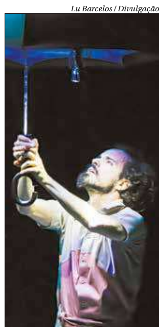
Ateliê do Gesto traz dois espetáculos para o Sesc Copacabana