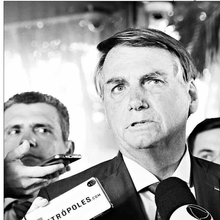
O presidente Jair Bolsonaro fala à imprensa no Ministério da Economia

No final do ano passado, o governo editou uma MP com um reajuste de 4,1% no mínimo, que passou de R$ 998 para R$ 1.039. O valor correspondia à estimativa do mercado financeiro para a inflação de 2019, segundo o Índice Nacional de Preços ao Consumidor (INPC), calculado pelo Instituto Brasileiro de Geografia e Estatística (IBGE). Porém, o valor do INPC acabou fechando o ano com uma alta superior, de 4,48%, anunciada na semana passada