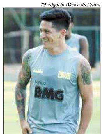
Atleta vem agradando nos treinos e disputa uma vaga no time titular

Com a ausência de Cano, o Vasco deve ir a campo com