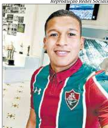
Jogador posou com a camisa do clube

Reforços fora da estreia - O Fluminense foi um dos clubes