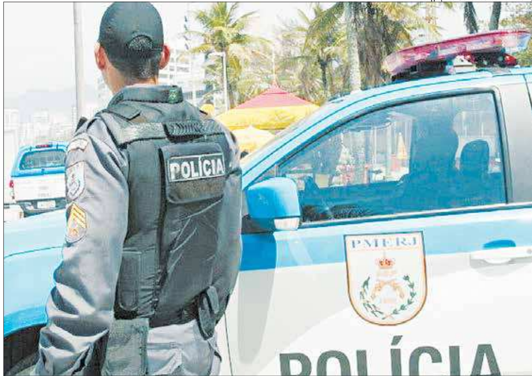
Embora o número de operações tenha sido superior aos dos anos anteriores, o percentual de vitimização de PMs caiu 38%

Planejadas sob a diretriz da área de Inteligência da Corporação e executadas com efetivo mais numeroso, mais bem treinado e equipado, 5.152 operações foram realizadas durante 2019. Embora o número de operações tenha sido superior aos dos anos anteriores, o percentual de vitimização de policiais militares sofreu uma redução de 38%.