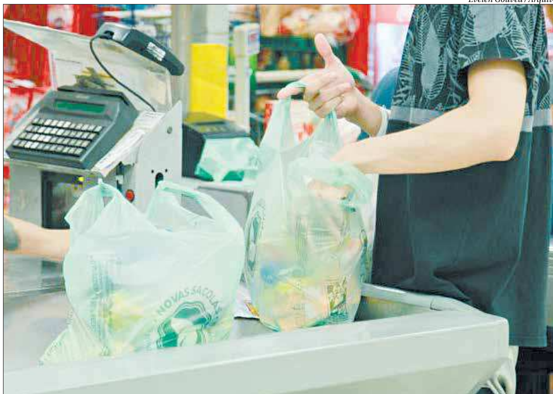
Evelen Gouvêa / Arquivo

“Essa é uma primeira medida em prol do meio ambiente. Nós, da ASSERJ, sempre acreditamos que o setor conseguiria mostrar sua preocupação com o meio ambiente. A campanha é apenas o reflexo de que