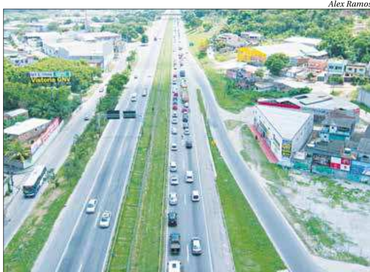
Vítima foi baleada na Rodovia BR-101 (Niterói-Manilha)

Rotina de crimes - Na madrugada de sexta-feira (10), um motorista de caminhão que transportava madeira foi ferido com um tiro de raspão na cabeça, durante outra tentativa de assalto também na BR-101, na altura do Complexo do Salgueiro. A vítima foi levada em estado de saúde estável ao Hospital Estadual Alberto Torres, onde permaneceu internada. ■