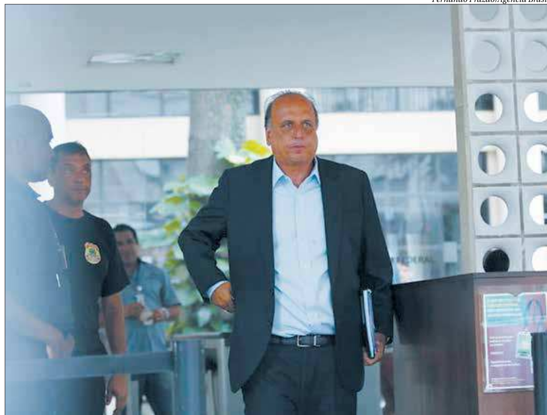
O ex-governador do Rio de Janeiro Luiz Fernando Pezão, ao deixar ontem a 7ª Vara Criminal, no Rio de Janeiro

O juiz considerou prudente dar tempo às defesas para analisar o depoimento