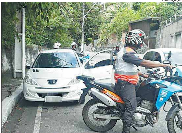
Veículo com suspeitos foi interceptado na Estrada Leopoldo Fróes