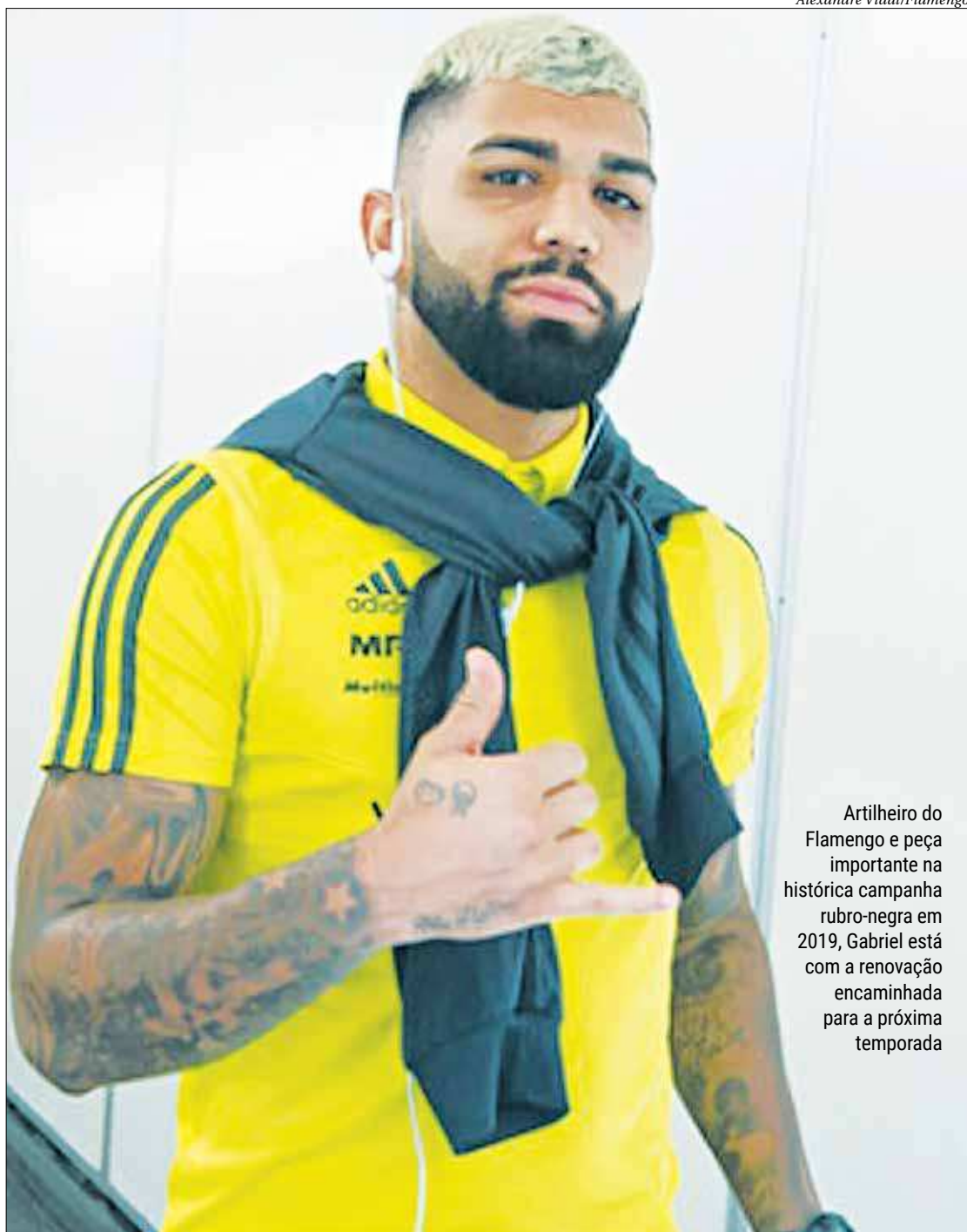
Artilheiro do Flamengo e peça importante na histórica campanha rubro-negra em 2019, Gabriel está com a renovação encaminhada para a próxima temporada

“Continua no início das negociações. A gente con-