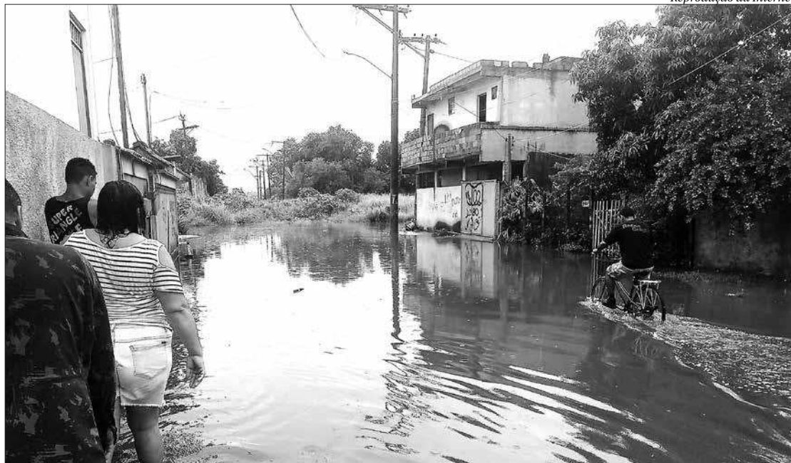
Moradores se uniram para arrecadar e distribuir alimentos no bairro que foi muito castigado pelas chuvas

As doações estão sendo deixadas em escolas e igrejas da localidade que decidiram abrir as portas para servir como ponto entre os doadores e moradores.