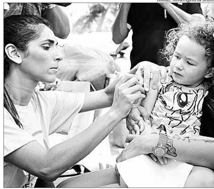
Governo pede que a população procure os postos de vacinação

O público-alvo para vacinação são pessoas a partir de nove meses de vida e 59 anos de idade que não tenham comprovação de vacinação. Em 2020, as crianças passaram a ter um reforço aos qua-