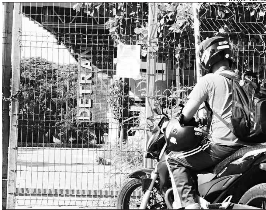
Quem procurou o Detran de Neves para algum serviço encontrou o portão fechado ontem

Devido ao problema, a unidade não ofereceu atendimento nesta quarta-feira e remanejou as pessoas que estavam agendadas para diversos serviços. Quem precisou ser atendido pelo órgão, os funcionários instruíram a procurar a unidade do Detran