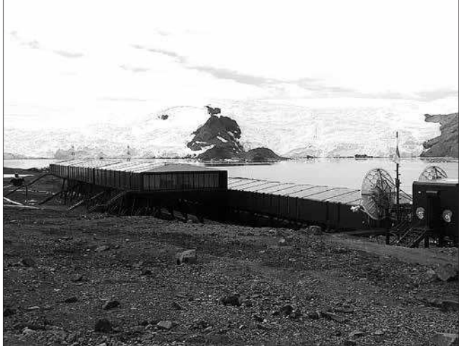
Estação Comandante Ferraz, base de pesquisa do Brasil na Antártica