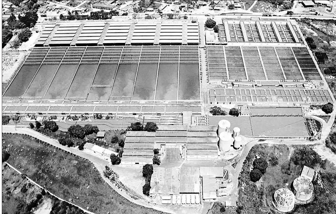
O governador Wilson Witzel determinou uma apuração rigorosa com relação à qualidade da água que vem sendo fornecida

nhia informou, na segunda-feira (13), que o carvão ativado pulverizado que será aplicado no início do tratamento da água distribuída pelo Reservatório do Guandu passará a ser empregado a partir da próxima semana, e será em caráter