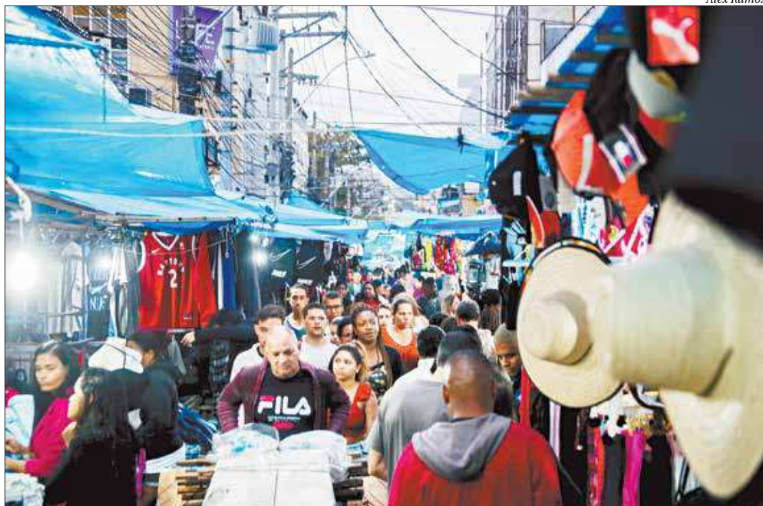
Alcântara e Centro de São Gonçalo serão as áreas cobertas pelo programa Segurança Presente

“Uma boa parte dos municípios do Rio de Janeiro já tinha o ‘Segurança Presente’. Essa é uma reivindicação nossa já antiga, que o programa fosse implementado também em São Gonçalo. Um município carente, de uma série de outras demandas, mas principalmente de segurança pública”, destacou o deputado Capitão