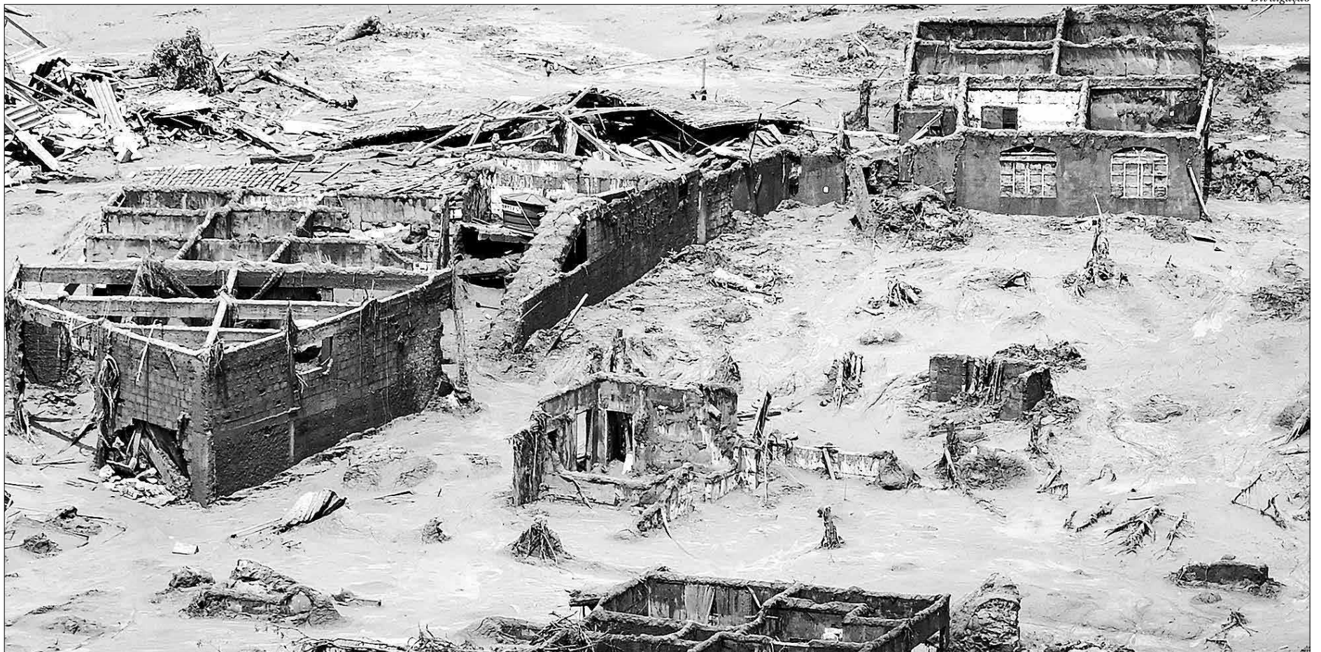
Os estados que foram duramente atingidos pela intensidade das chuvas seguem atentos ao céu e aos efeitos das águas dentro dos seus domínios, como monitoramento de rios e barragens

O risco de rompimento da estrutura devido à elevação do nível de água em função das fortes chuvas que atingem parte da Região Sudeste desde o último dia 17 motivou a empresa e a prefeitura de Alegre a acionarem o plano de emergência. O alerta vermelho foi acionado na tarde do último sábado, quando a prefeitura divulgou pelas redes sociais mensagens para que os moradores das áreas