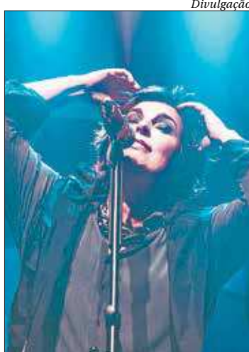
Cantora apresenta um show especial regatando seus maiores sucessos

No repertório, músicas como 'O farol', 'Recado do tempo', 'Foto Polaroid', 'Diga sim' e 'Luxúria'. Além de sua versão de 'Se fiquei esperando meu amor passar', o tributo aos Carpenters e um single inédito, recém-lançado, a vida vive sem você também farão parte da noite. ■