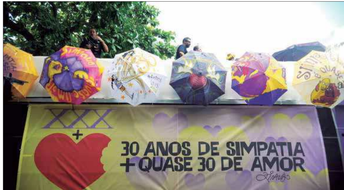
O Simpatia é Quase Amor desfila 15 e 23 de fevereiro, às 16h, e a Banda de Ipanema 8, 22 e 25 de fevereiro, às 17h

Segundo o secretário, foram recebidas 350 ligações telefônicas na pesquisa realizada no fim de semana, sendo que 95% dos comerciantes e 65% dos moradores de Ipanema se manifestaram favoráveis à