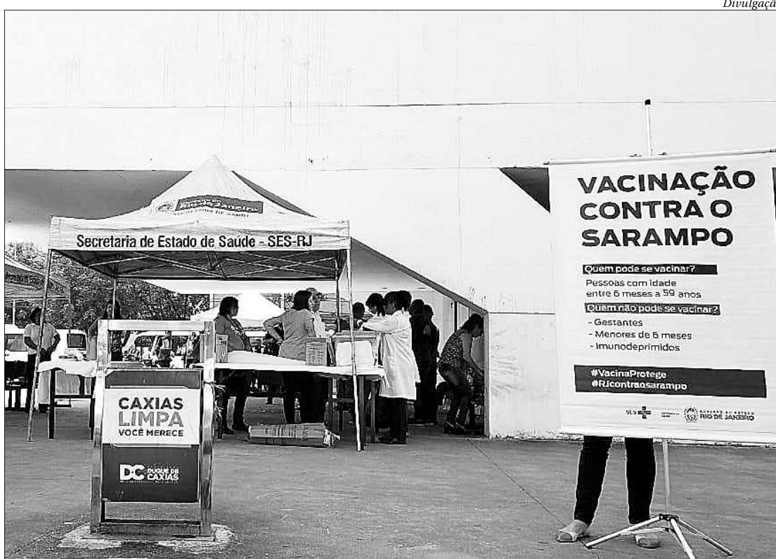
Duque de Caxias foi a cidade do estado do Rio mais afetada pelo sarampo no ano passado, com 133 casos

Duque de Caxias foi a cidade do estado do Rio mais afetada pelo sarampo no ano passado. Dos 333 casos registrados, 133 ocorreram no município da Baixada Fluminense. Neste primeiro momento, o distrito de Xerém foi escolhido pela equipe de vigilância do município por não ter ainda realizado uma campanha de intensificação no local. Espera-se que, com