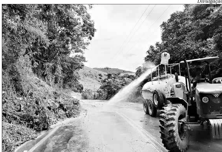
DER atua no Norte e Noroeste do estado após fortes chuvas na região

Para segurança dos usuários, o local está devidamente