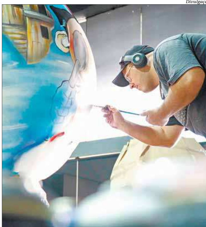
Artistas renomados foram convidados a utilizar os globos como suporte

A exposição apresenta 17 globos terrestres, com 1,8m de altura cada, utilizados como suporte tridimensional para a criação artística. Tendo como disparador o plano global da ONU, um seleto grupo de artistas se apropriou da superfície dos globos para suscitar questões sociais, ambientais e econômicas, pautadas pelos 17 ODS. Entre as temáticas abordadas, estão educação