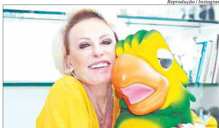
Ana Maria Braga agradeceu o carinho do público pelas redes sociais

Com as férias já marcadas anteriormente, Ana Maria deve deixar de apresentar seu programa a partir de 7