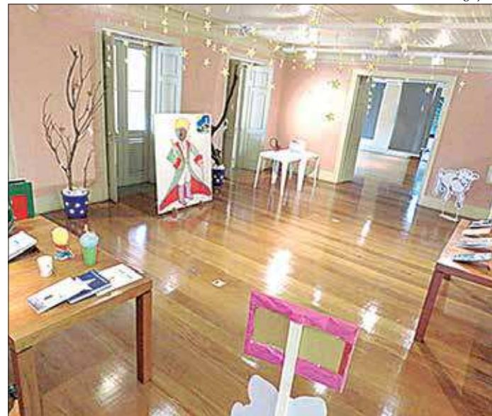
O clássico infantil 'O Pequeno Príncipe' é tema de exposição em Petrópolis

A visitação pode ser feita de terça a sexta-feira, das 8h30 às 16h30, e aos sábados, das 9h às 16h. A exposição, que tem entrada gratuita, fica em cartaz até o dia 29 de maio. ■