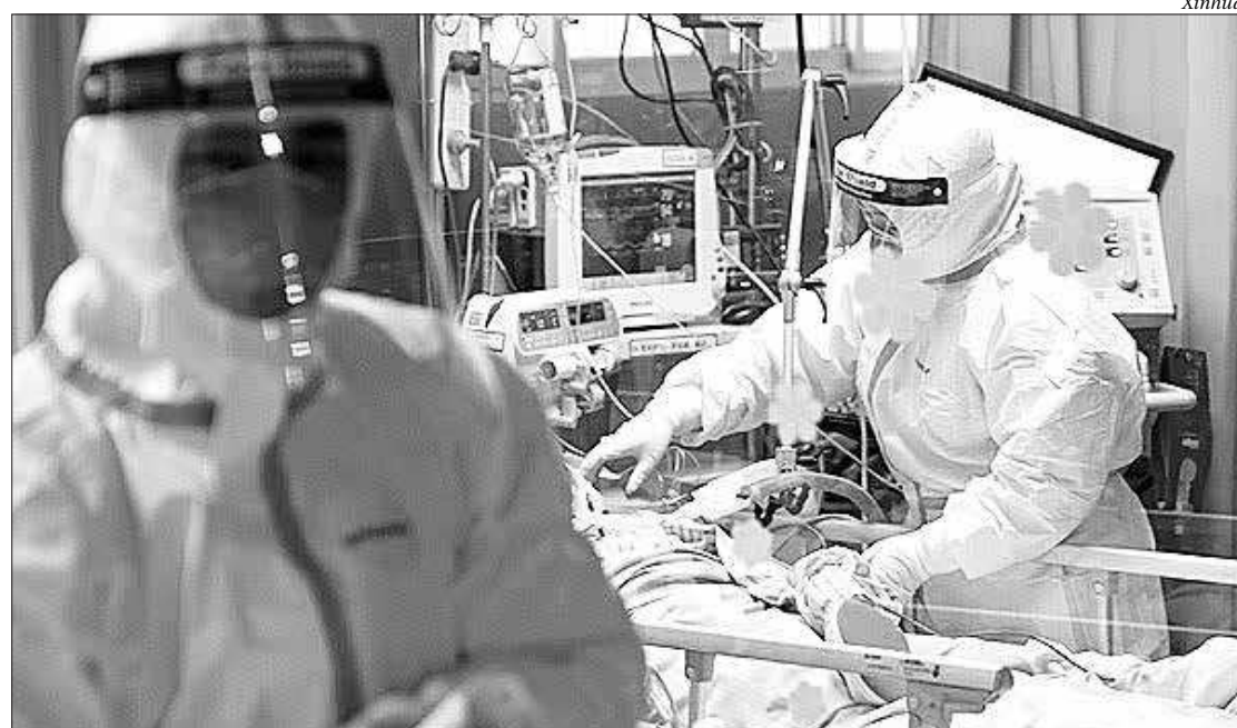
Médicos fazem tratamento médico na UTI do Hospital Zhongnan da Universidade de Wuhan em Wuhan, na China

Pequim também está tomando outras medidas para restringir a movimentação de pessoas. Desde esta segunda