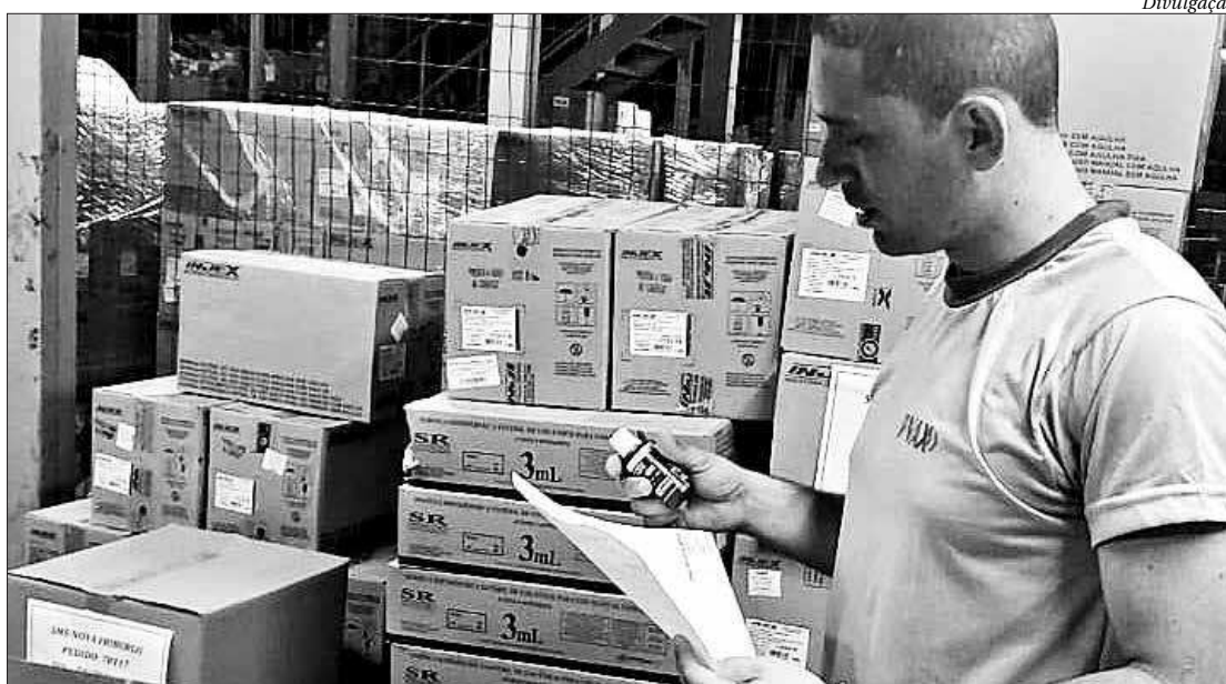
A SES abre as portas de nove das suas unidades para receber donativos para as vítimas das chuvas no Norte e Noroeste

Em outra frente de atuação, a SES abre as portas de nove das suas unidades para receber donativos para as vítimas das chuvas no Norte e Noroeste. Itens como água mineral, alimentos não perecíveis, roupas, material de higiene, roupa de cama,