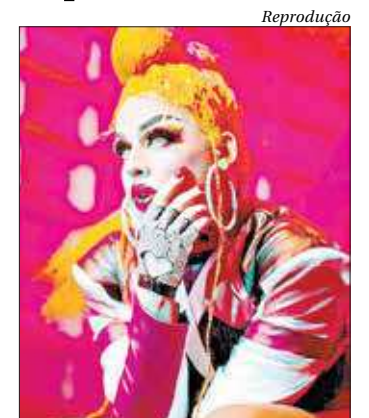
Na Avenida Vieira Souto. Posto 10, em frente à Rua Paul Redfern, Ipanema, Rio de Janeiro. Sábado (1), a partir das 17h. Entrada franca. Classificação: livre.

E o encerramento fica por conta de Festa da Raça.■