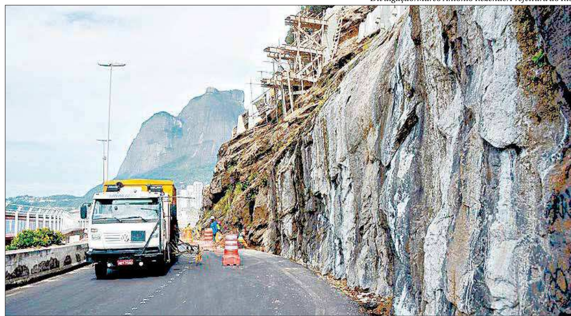
Crivella explicou que foram estipulados novos protocolos de fechamento que oferecem total segurança

Crivella explicou que foram estipulados novos protocolos de fechamento que oferecem total segurança para reabertura da via. A avenida será constantemente monitorada e fechada preventivamente, em caso