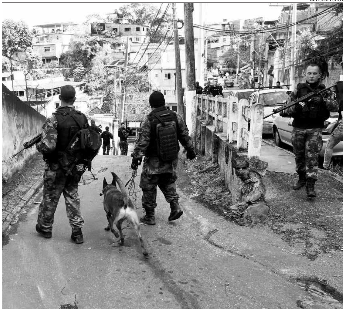
No Morro do Estado, na Região Central de Niterói, não houve registro de confrontos com os traficantes de drogas

Nas paredes de comércios e residências da comunidade, a disputa é ilustrada por uma "guerra de pichações". Quando uma facção expulsa a outra, as siglas da rival são apagadas dos muros ou riscadas e substituídas pela