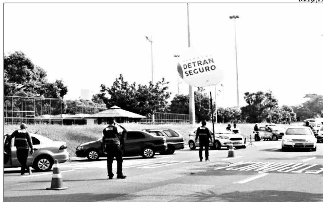
Equipe atuará em outros blocos no pré-carnaval e durante os dias da folia para ajudar a prevenir acidentes

“Estamos iniciando uma série de ações para informar os foliões sobre a importância de não beber e dirigir. É nosso papel promover a