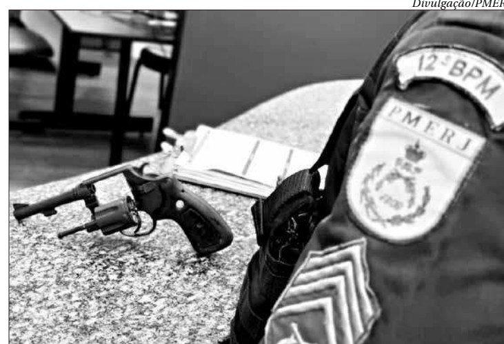
Arma foi apreendida com o homem preso em flagrante pela polícia

Houve troca de tiros e o motorista do caminhão, que estava sendo feito refém, se jogou do veículo que, sem ninguém no controle, desceu de ré e se chocou com a