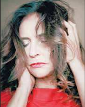
Fafá apresenta o repertório de seu novo álbum, o aclamado 'Humana'