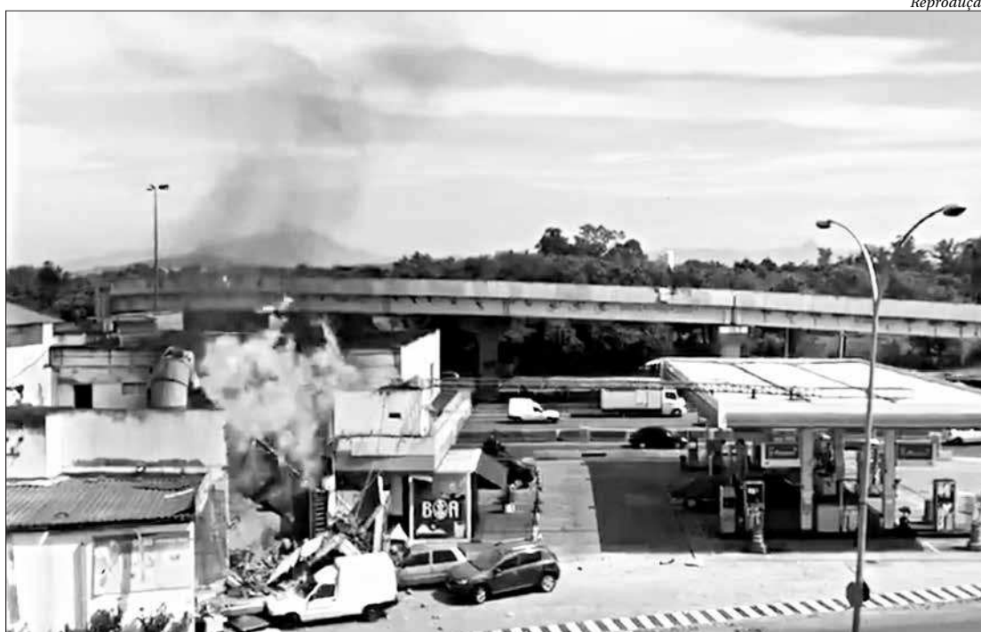
Chamas no posto de combustíveis na Rua Hanibal Pôrto foram controladas por bombeiros do Quartel de Irajá

De acordo com o Centro de Operações Rio, o tráfego ficou lento na Avenida Brasil, no trecho de Irajá, devido a bloqueios na Rua Hanibal Pôrto, para trabalho dos bombeiros. ■