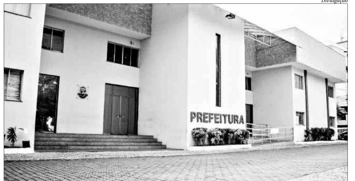
Estão convocados pela prefeitura, os candidatos que concorreram ao processo n.º 065/2018

Os servidores temporários que atuaram no ano letivo de 2019 não precisarão passar pela fase de apresentação de documentos, estando aprovados para a fase de escolha de lotação, conforme a classificação. É