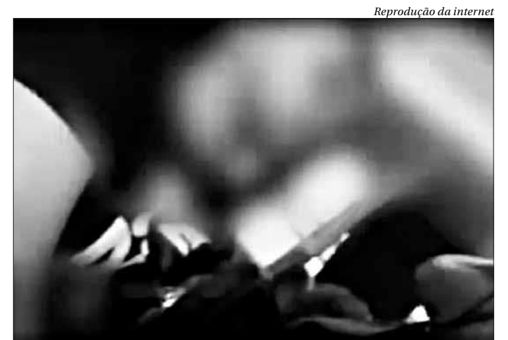
Imagens foram postadas pela vítima em sua rede social

Antes disso, em resposta a internautas, ela afirmou que registraria a ocorrência em uma delegacia da cidade. A Viação Araçatuba foi procurada, mas até o fechamento desta edição não respondeu ao contato. ■