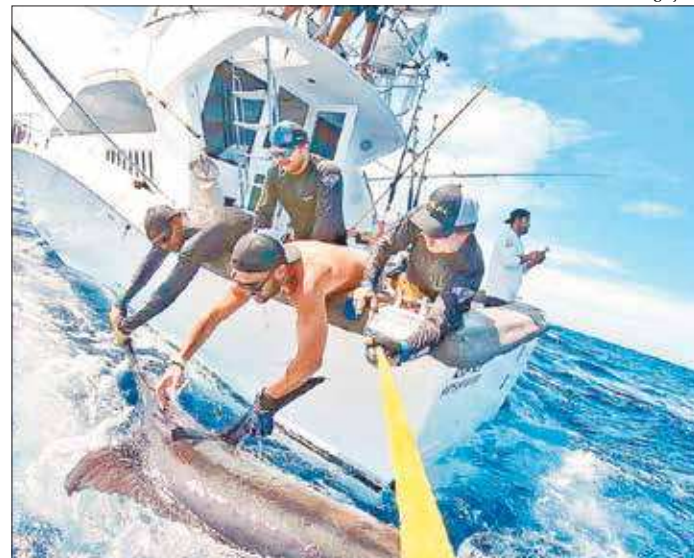
Neste sábado começa o XXII Marlin Invitational na Região dos Lagos