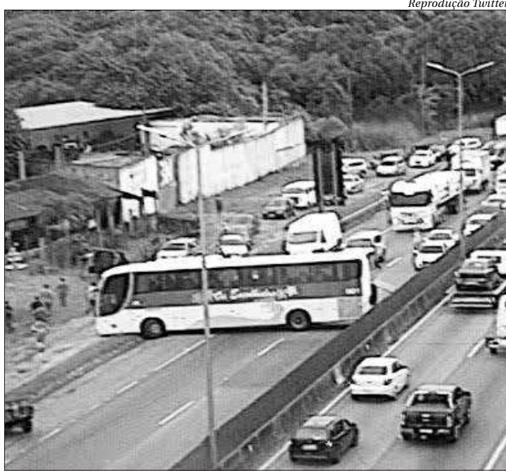
O intenso fluxo da via foi desviado para a margem da rodovia, em Itaboraí

O trânsito teve que ser desviado para a margem da rodovia. A Arteris Fluminense, concessionária que administra a via, recomendou para os motoristas a saída do km 293, sentido