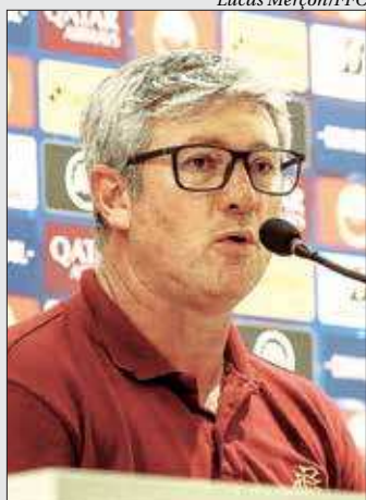
Técnico vive seu pior momento no ano