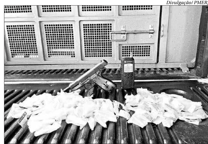
A PM apreendeu uma pistola nos Marítimos, além de drogas e um rádio comunicador

Durante as incursões da equipe do 12º BPM (Niterói), em ação para reprimir o crime organizado, duas pistolas calibre 9mm, drogas e um rádio comunicador foram apreendidos.■