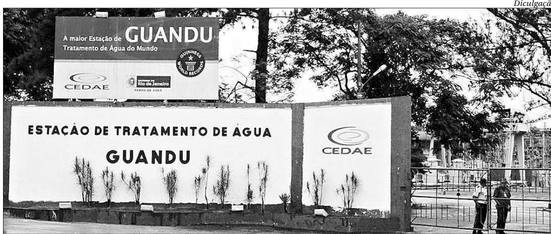
Segundo a Agerensa, a Cedae tem até amanhã para publicar seus relatórios no site e enviar cópias para a agência

Segundo a Agerensa, a Cedae tem até sexta-feira (7) para publicar seus relatórios no site e enviar cópias para