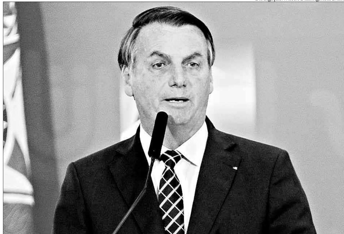
O presidente Jair Bolsonaro vem defendendo uma mudança na forma de cobrança do ICMS sobre os combustíveis

“Dificilmente tem [espaço fiscal] nos estados. Pergunte aos governadores cuja situação fiscal impede que paguem salários, que paguem despesas de saúde e educação, de fornecedores. É visível que vários governos estaduais não têm condição e não têm espaço para isso. É preciso ter compreensão também da própria realidade, o que não impede a conveniência do diálogo de todos os governadores”,