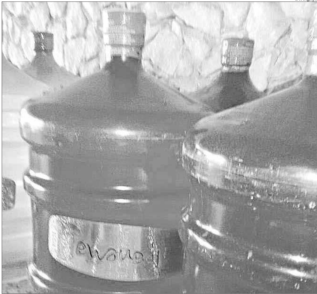
A medida foi adotada a partir dos resultados das análises do produto feitas pelo Lasp, que encontraram a presença de bactérias

A ação foi organizada a partir de denúncia recebida na Central 1746 sobre galões de 20 litros da marca adqui-