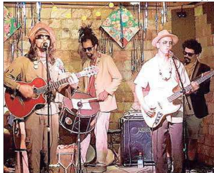
O grupo Cangaço Carioca faz show em homenagem ao cantor Lenine

Os ingressos custam R$ 20 (inteira) e R$ 10 (meia entrada e antecipados). ■