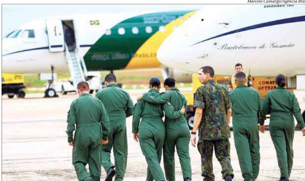
Dois aeronaves da FAB deixaram Brasília ontem, a caminho da China, para resgatar brasileiros que querem fugir do coronavírus

Caiu para onze o número de pessoas que ainda estão com suspeita de infecção pelo coronavírus no Brasil, de acordo com o último boletim divulgado ontem pelo Ministério da Saúde. O ministro da Saúde, Luiz Henrique Mandetta, deve mandar ao Congresso, até o início da próxima semana, um texto mais detalhado com regras gerais para casos de epidemias e vigilância sanitária.