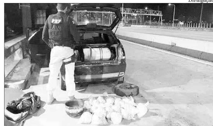
Homem saiu de São Gonçalo e seguia em direção ao Complexo do Alemão

A ocorrência foi encaminhada para a 19ª DP (Tijuca).■