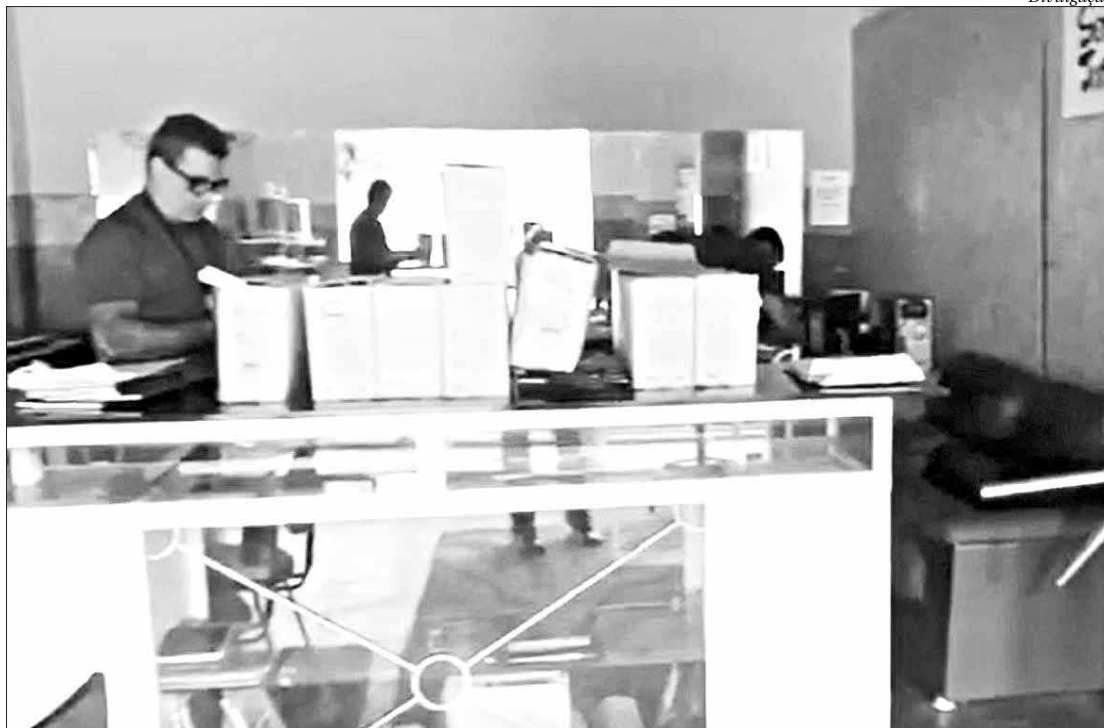
Segundo a Polícia Civil, a proprietária do falso cartório foi autuada em flagrante por associação criminosa

De acordo com os agentes da unidade, após três meses de investigações foi apurado que os criminosos cobravam R$ 600 pela cerimônia e seus efeitos civis, o que inclui a habilitação no cartório para validar o casamento civil. Eles realizavam apenas a cerimônia religiosa e entregavam uma falsa certidão de casamento, usando o brasão da República. A certidão de habilitação é o documento emitido pelo cartório que registra que os noivos estão livres para se casarem. Após a cerimônia, os noivos devem juntar a docu-