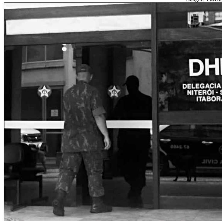
Militares estiveram na DH de Niterói para se inteirar sobre as investigações