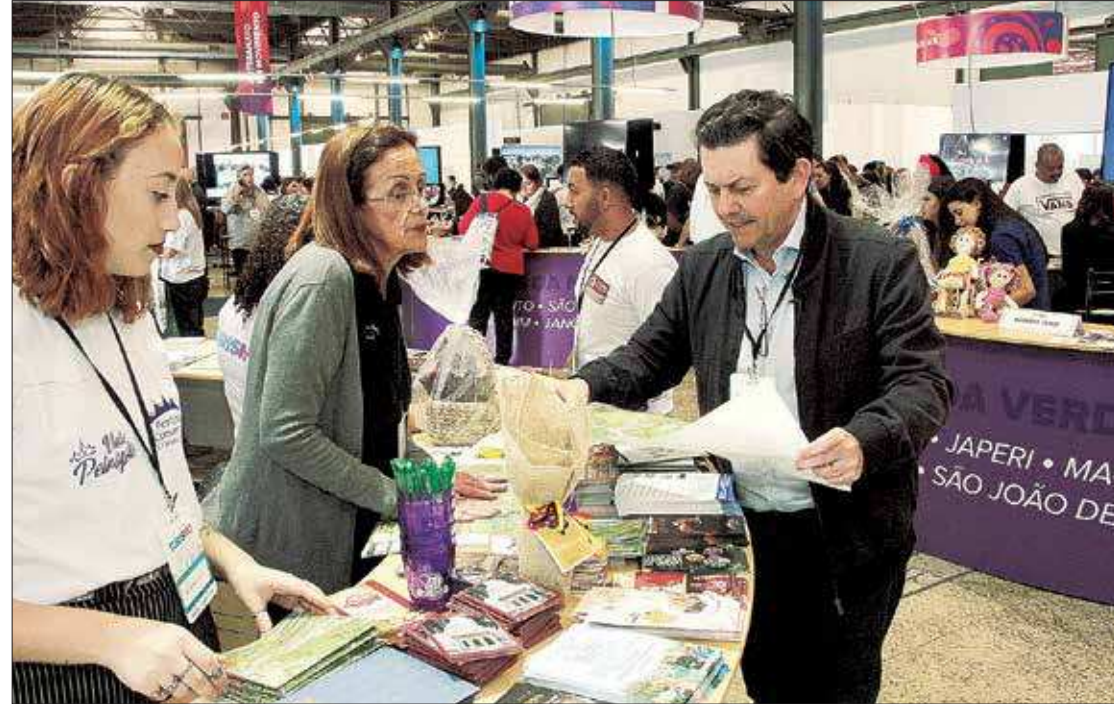
Otávio Leite, secretário estadual de Turismo, conversa com expositores durante o Salão Estadual de Turismo

Otávio Leite também afirmou que irá acompanhar, detalhadamente, o andamento das apurações. Para ele, o Rio de Janeiro vive um novo momento de "soerguimento do turismo, com expectativas muito promissoras nessa