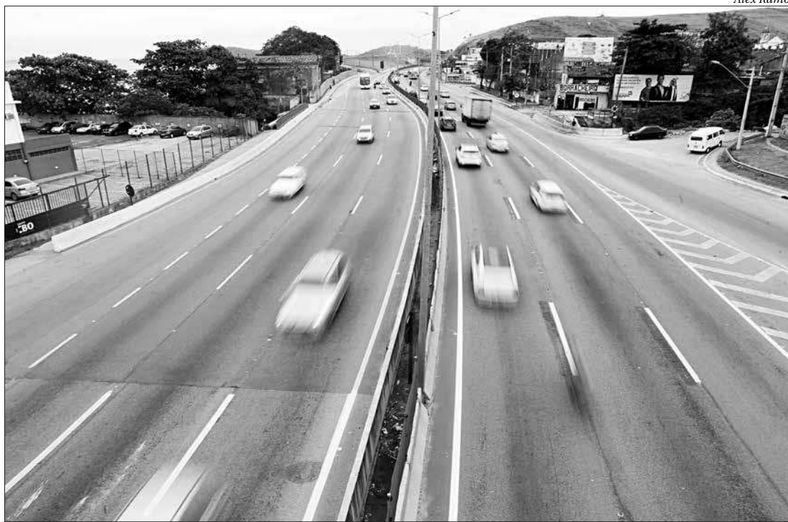
O crime aconteceu nas primeiras horas desta quarta-feira. Uma das linhas de investigação é latrocínio (roubo seguido de morte)

A especializada irá investigar o caso para apurar as circunstâncias da morte do militar. O corpo de Davidson foi removido ao Instituto Médico Legal (IML), que