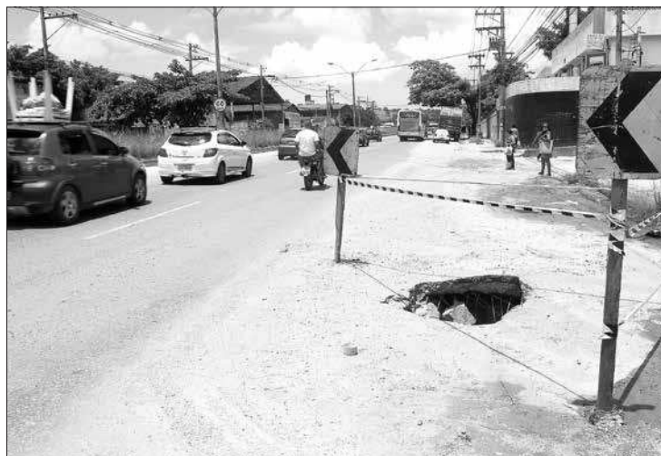
Enquanto na altura do Arsenal, a RJ-106 carece de cuidados, com buracos que podem gerar um grave acidente, em Maricá a via já recebe melhorias