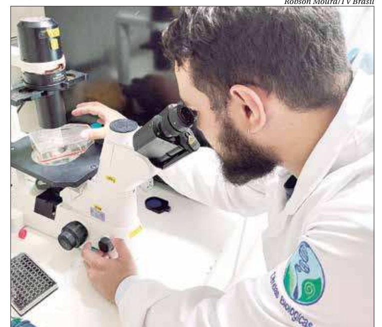
Os especialistas da UnB realizaram várias pesquisas com o ômega-3

Saúde, “a melhor forma de prevenção, e a mais eficaz, é evitar a proliferação do mosquito Aedes Aegypti, eliminando água armazenada que pode se tornar um possível criadouro, como em vasos de plantas, lagões de água, pneus, garrafas plásticas, piscinas sem uso e manutenção, e até mesmo em recipientes pequenos, como tampas de garrafas e pratos de plantas”.