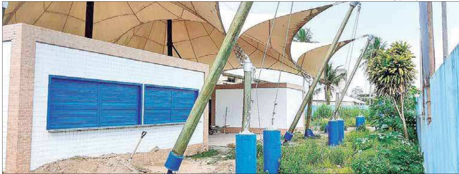
O polo, na Avenida Wilson Mendes, passará por obras estimadas em R$ 116.280,60; Expectativa é que capacitações comecem em março deste ano

O município de Cabo Frio, na Região dos Lagos fluminense, vai oferecer cursos gratuitos de formação e qualificação profissional para jovens e adultos, em parceria com o Sistema Firjan, com início previsto para o mês de março. A assinatura do convênio, celebrando a parceria, acontece nesta terça (11), no gabinete do prefeito Dr. Adriano Moreno.