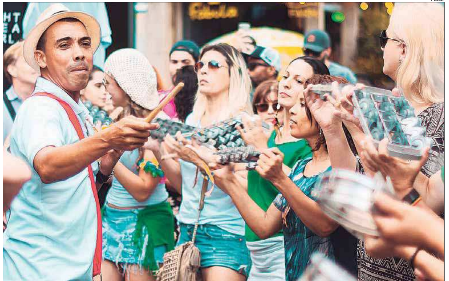
Folia pede hidratação e cuidados com a pele, por causa do excesso de exposição à luz solar, falta de hidratação adequada e poucas horas de sono

Antes da festa, previna-se com protetor solar, item imprescindível em qualquer dia do ano, independente do sol estar brilhando ou não, e durante o Carnaval, o produto não pode ser esquecido. O fator de proteção solar deve ser de, no mínimo, 30, mas, se a diversão for ao ar livre, convém aumentar. Escolha entre o FPS 60 ou 70 para evitar possíveis queimaduras provocados pela exposição solar, e reaplique o produto a cada duas horas para manter sua eficácia. Vale apostar também em um hidratante labial para evitar o ressecamento dos lábios.