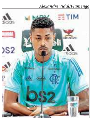
Atacante falou sobre sua permanência

“Recebi propostas para sair, melhores do que ficar, e conversei com minha família. Optamos ficar, estamos super à vontade aqui. Muitos dos clubes europeus não tem essa estrutura que temos. Jogando aqui, você se sente melhor, pe-