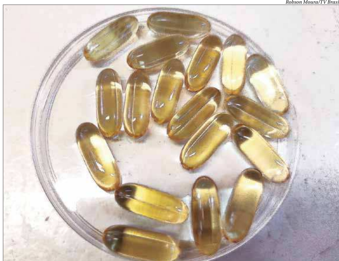
Estudo realizados pela Universidade de Brasília (UnB) descobre que ômega-3 é nova arma contra o vírus Zika

As medidas de controle são semelhantes às da dengue e do chikungunya. Conforme o Ministério da