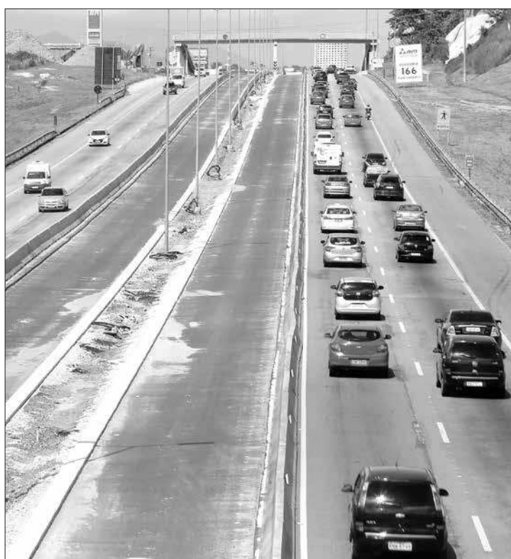
Os serviços devem ser concluídos em abril de 2021, e a liberação será feita em lotes

nária previa a liberação do trecho em Itaboraí, da Praça do Pedágio até o trevo de Manilha, para fevereiro, porém não apresentou nova informação.