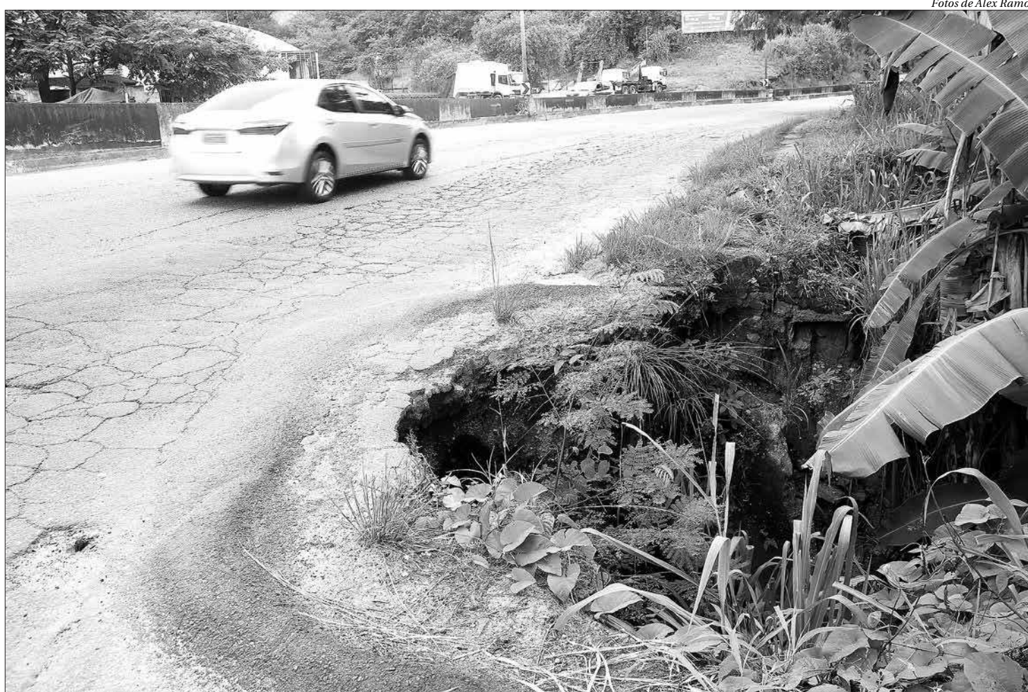
Um enorme cratera na RJ-104, na altura de Maria Paula, na pista sentido Fonseca, preocupa há tempos quem passa diariamente pelo local

Até o momento, já foram realizados, no trecho do Km 110 ao Km 127 (São Pedro da Aldeia a Niterói): 5,6 km de