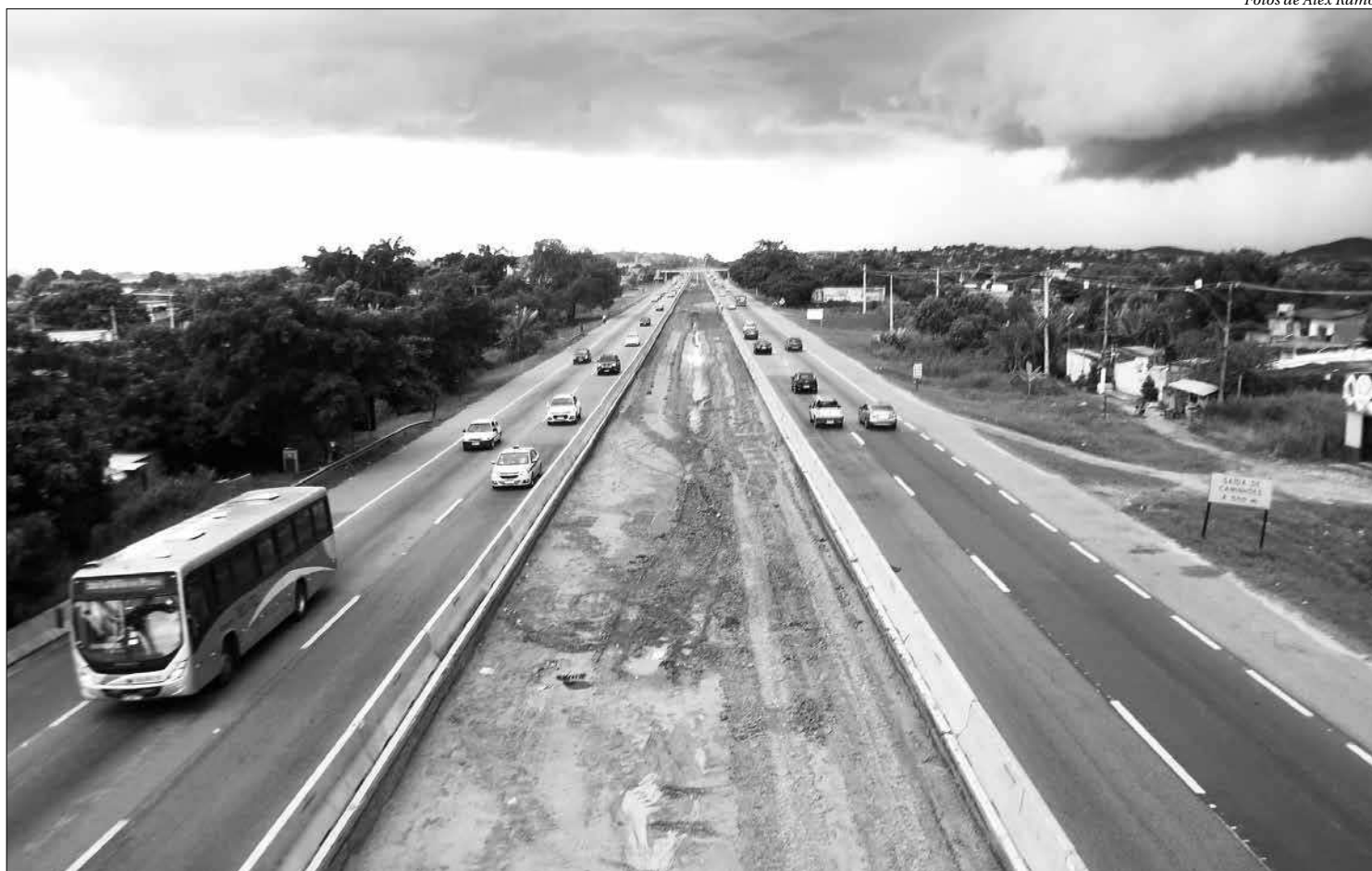
A BR-101 no trecho do viaduto do Barreto, em Niterói, até o trevo de Manilha, em Itaboraí, receberá uma terceira faixa para suportar mais veículos e diminuir os engarrafamentos

A BR-101 no trecho do viaduto do Barreto, em Niterói, até o trevo de Manilha, em Itaboraí, receberá uma terceira faixa para suportar mais veículos e diminuir os constantes engarrafamentos. A concessionária Arteris Fluminense prevê a conclusão dos serviços em abril de 2021, e fará a liberação dos segmentos ao tráfego de veículos em lotes, porém não informou datas. A concessio-