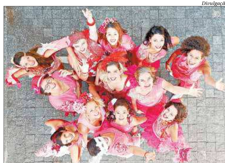
Mulheres de Chico se apresentam gratuitamente em Niterói neste domingo

Além do show o evento oferece outras atividades. A programação completa do dia pode ser consultada no site www.sescverao.com.br . ■