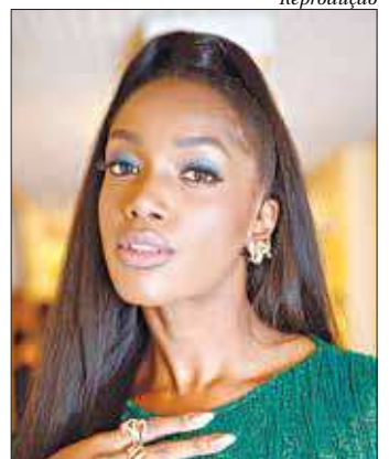
Iza e Samba que elas querem se apresentam na Praia de Ipanema

Serão distribuídas taquagens temporárias com o