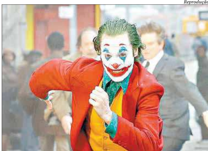
Coringa, do diretor Todd Phillips, é o grande indicado, concorrendo a 11 prêmios no total

Coringa, de Todd Phillips, lidera as indicações, concorrendo a 11 estatuetas, seguido por O Irlandês, de Martin Scorsese, Era Uma Vez... Em Hollywood, de Quentin Tarantino e 1917, de Sam Mendes, que disputam em dez categorias. A chegada dos astros e estrelas ao tapete vermelho começa a ser transmitida a partir das 20h. O canal a cabo TNT exibirá a premiação ao vivo. Neste ano, o filme brasileiro "Democracia em Vertigem" está na lista de indicados ao Oscar 2020 na categoria melhor documentário. Dirigido pela mineira Petra Costa, a produção aborda o Impeachment da então presidente da Repúbli-