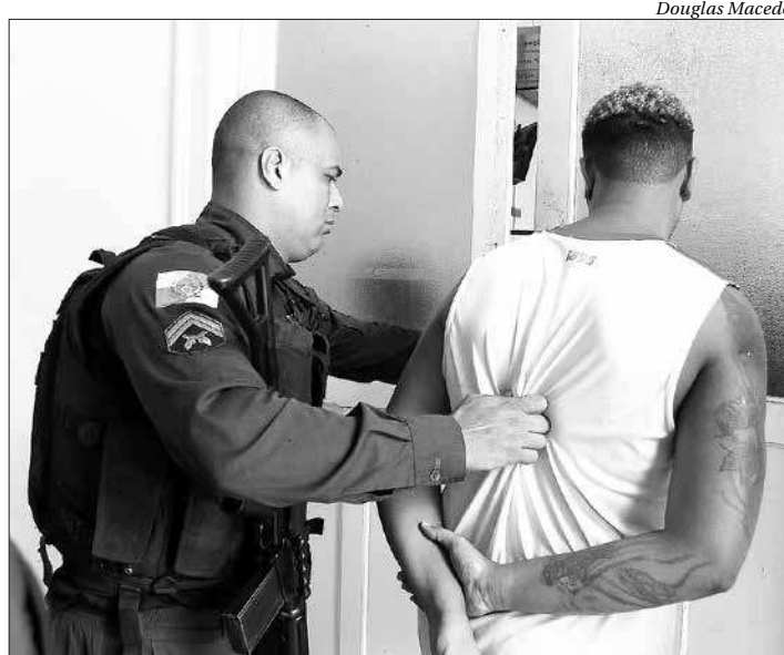
O homem foi detido e conduzido à 76ª DP (Niterói), que registrou o caso

FB foi localizado em uma casa e, durante averiguação, ficou comprovado que ele é evadido do sistema prisional e possuía mandado de prisão em aberto. Próximo ao esconderijo, outros criminosos