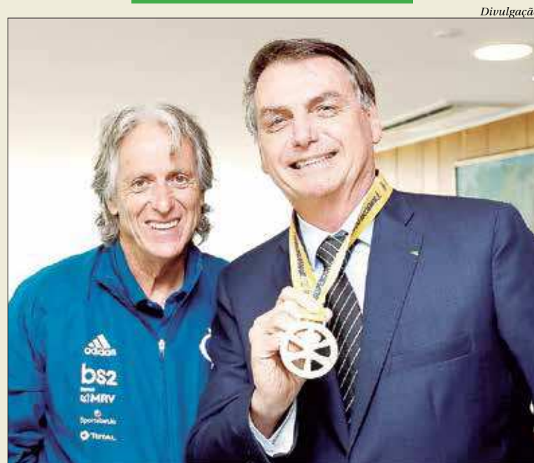
O técnico do Flamengo, Jorge Jesus, com o presidente Jair Bolsonaro, em Brasília