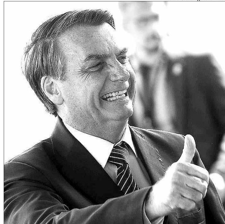
O presidente Jair Bolsonaro conversa com turistas no Palácio da Alvorada

Pela manhã, o presidente havia dito que a reforma administrativa está “madura” para ser apresentada e ne-