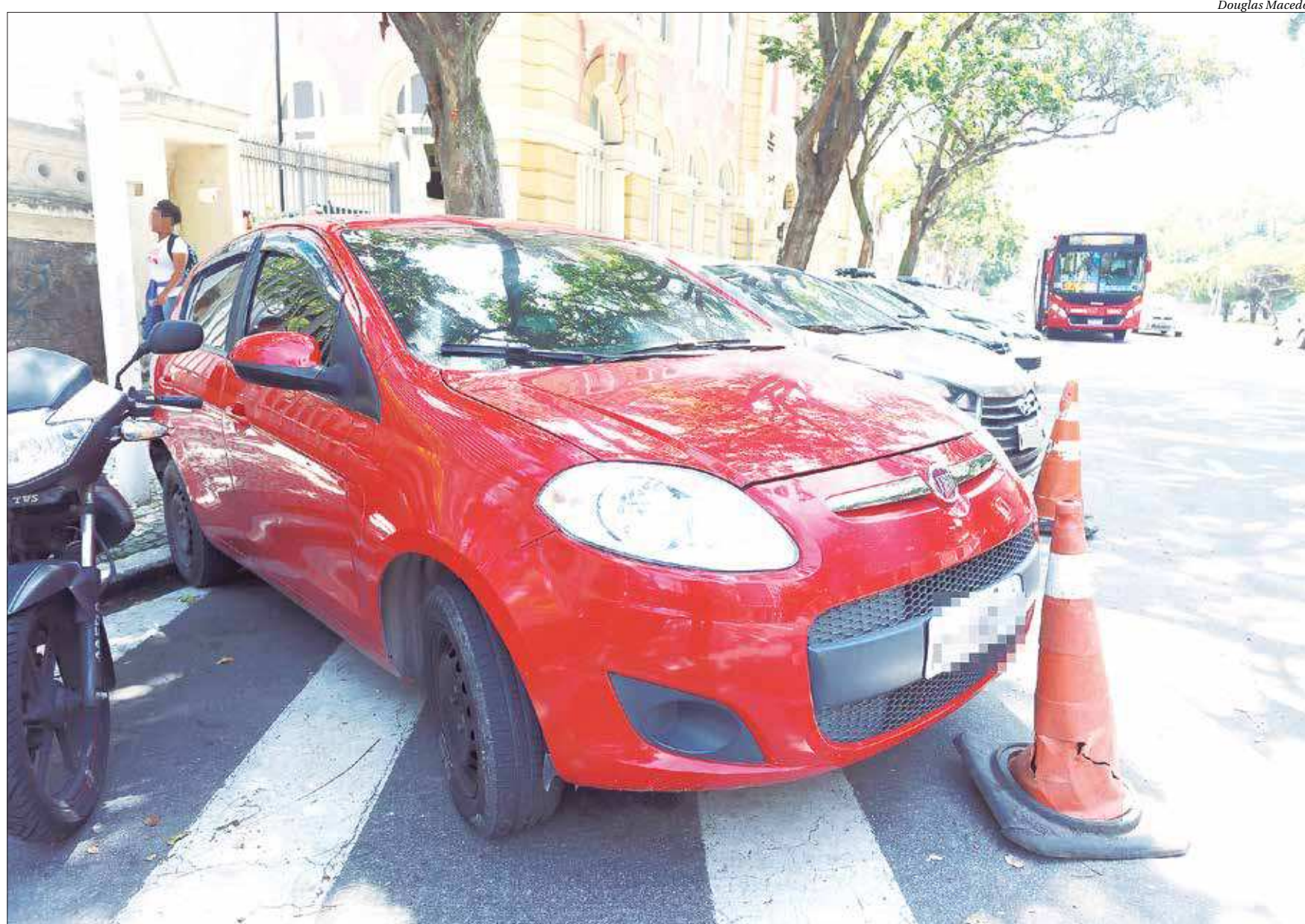
O carro havia sido roubado no último sábado (15), no Fonseca, Zona Norte de Niterói, e foi recuperado ontem por agentes do programa Niterói Presente, em Santa Rosa, com apoio do Cisp