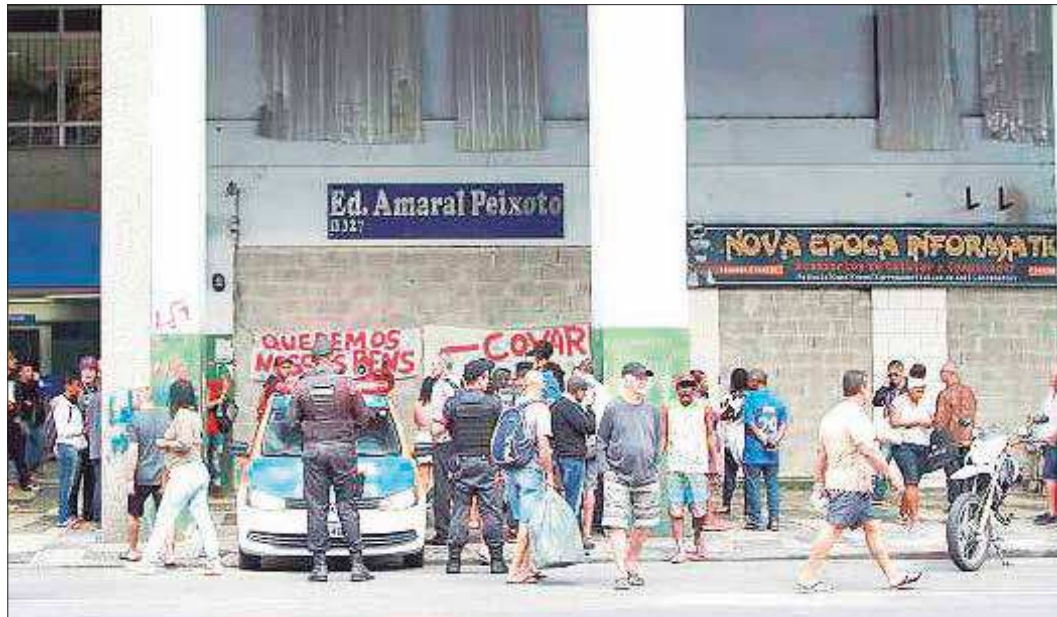
O prédio foi desocupado em junho do ano passado e desde então está lacrado pela Justiça

A Prefeitura de Niterói vai desapropriar o Edifício Nossa Senhora da Conceição, que fica no número 327 da Avenida Amaral Peixoto, desocupado em junho do ano passado por uma decisão da Justiça. A informação foi dada pelo prefeito Rodrigo Neves durante a sessão de abertura dos trabalhos Legislativos da Câmara Municipal. Segundo ele, o processo de desapropriação será iniciado no primeiro semestre deste ano.