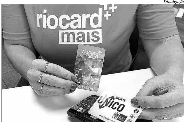
Novo Cartão Riocard Mais está mais acessível na Região Metropolitana

Até o momento, há mais de 900 mil cartões Vale-Transporte do novo modelo Riocard Mais em uso. Os atendimentos acontecem de segunda a sexta, das 7h às 19h. É possível conferir os locais no sistema-