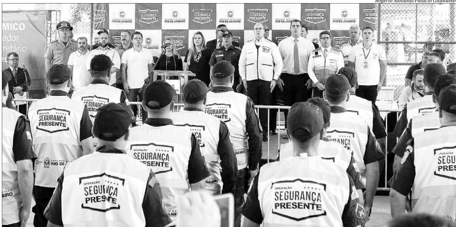
Governador Wilson Witzel participou nesta segunda-feira do lançamento do Segurança Presente em Irajá, o 26º núcleo do programa que visa ampliar a segurança

Segundo o Governo do Estado, a iniciativa no bairro terá duas bases, uma na Praça Nossa Senhora da Apresentação e outra na rua Severiano Monteiro. Com o novo núcleo de atuação,