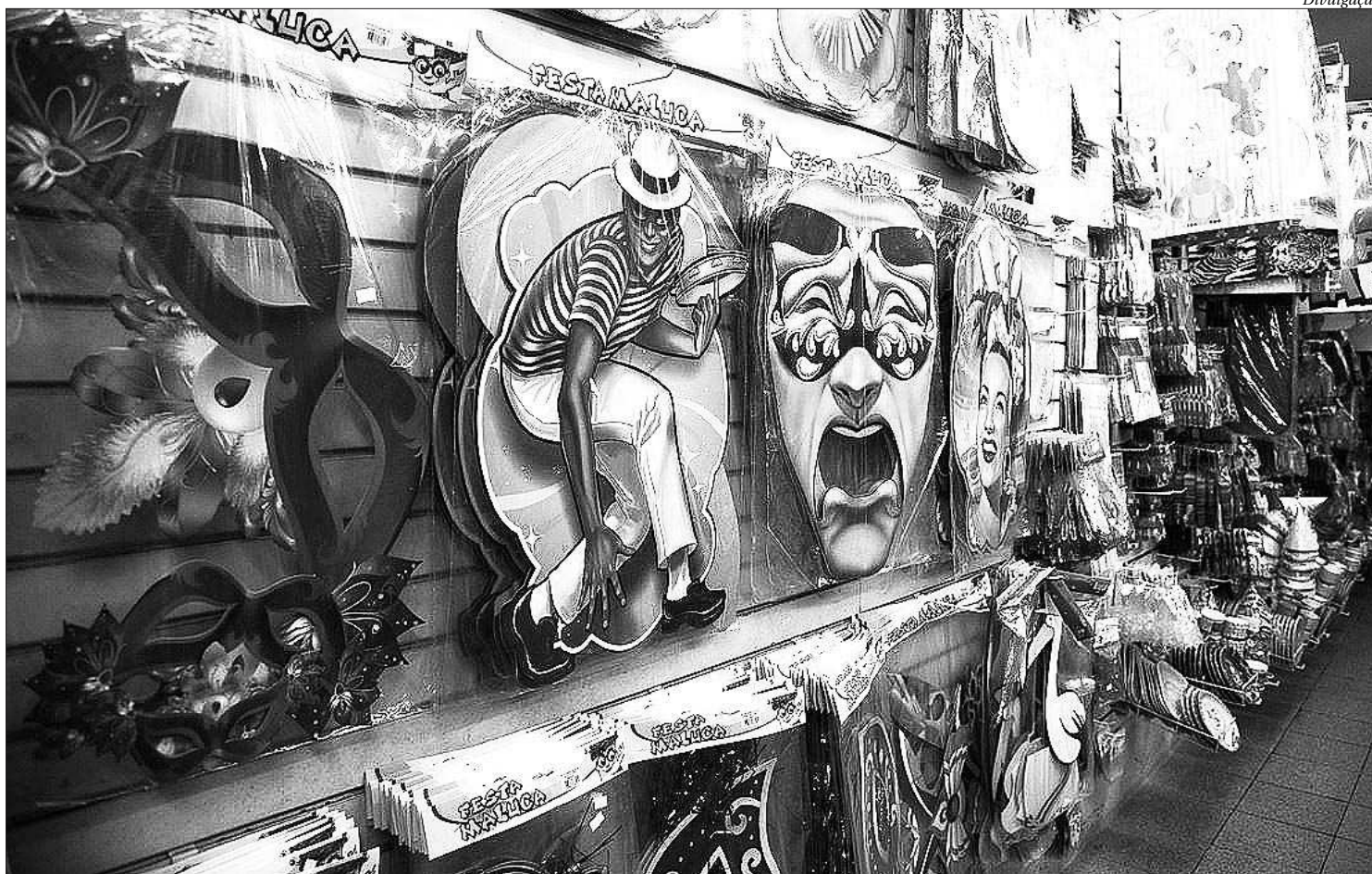
A compra de fantasias e adereços deve representar em média 2,6% do valor destinado para os dias de folia. No Rio, são esperados cerca de 7 milhões de foliões

Ainda conforme o estudo do IFec RJ, os moradores da cidade do Rio de Janeiro elencaram quais serão os principais gastos no período. O consumo de alimentação e bebidas foi o mais elevado, 44,6%; seguido de viagens/passeios para fora da cidade do Rio, 17,2%; uso de aplicativos de transporte/táxi,