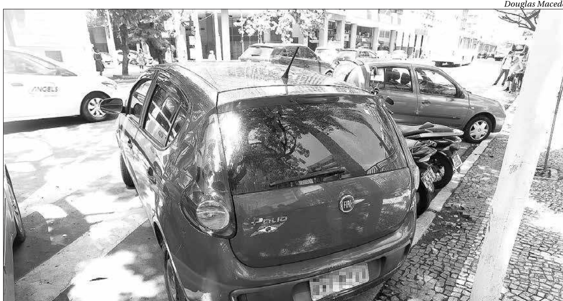
Roubado na Desembargador Lima Castro, no Fonseca, o veículo foi recuperado no bairro de Santa Rosa

Por volta de 7h20, os agentes foram informados pelo Cisp que um carro modelo Fiat Pálio, que constava como roubado, estava trafegando pela região. Um cerco foi montado e o veículo foi