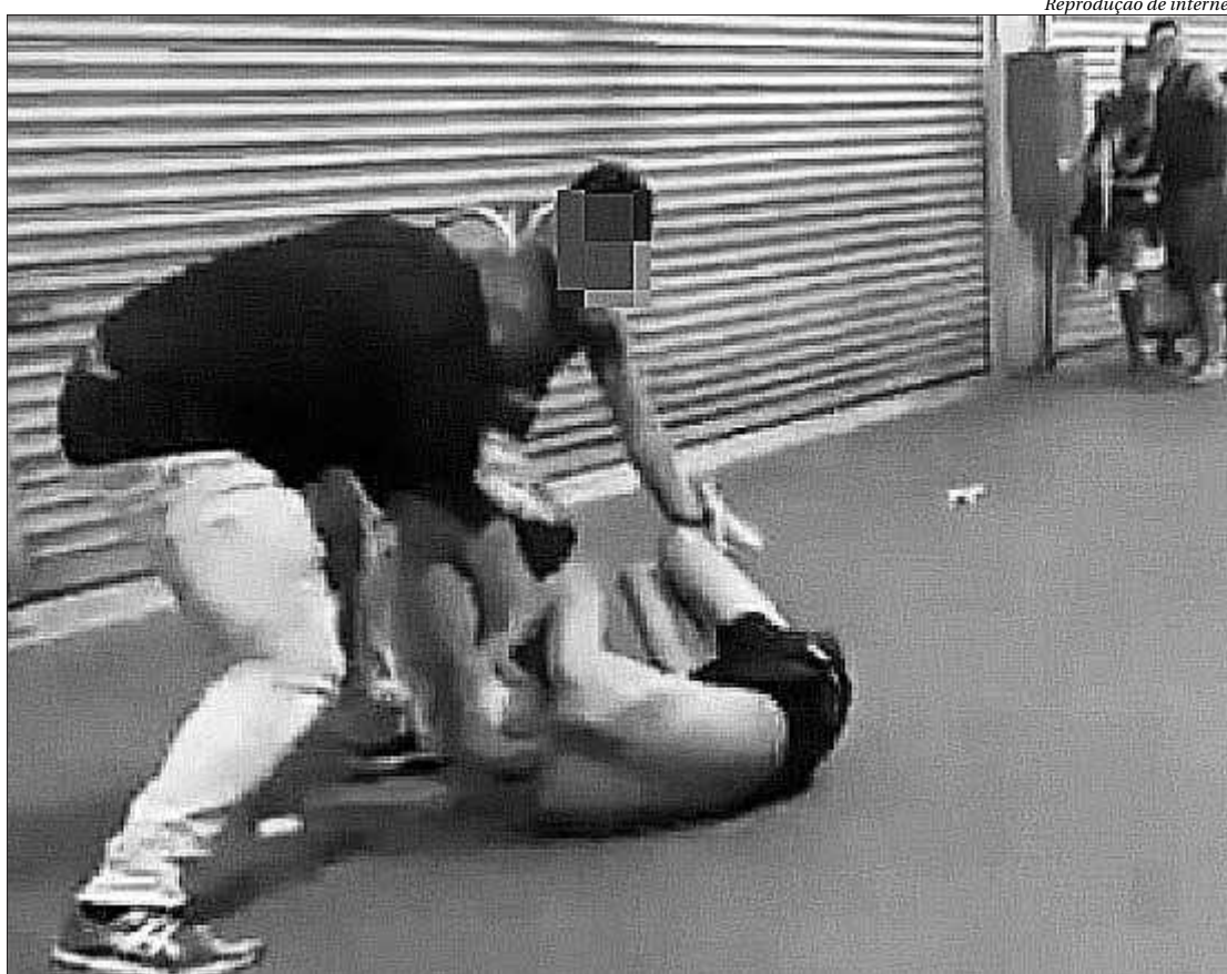
Homens foram flagrados brigando no Terminal Rodoviário Presidente João Goulart após o bloco Banda do Ingá

brigas em outros locais nos arredores do trajeto do bloco, que, neste ano, teve concentração na Praça César Tinoco, no Ingá, indo até o Caminho Niemeyer, no Centro. De acordo com internautas, houve confusão em frente a Estação das Barcas e em vias do Centro da cidade.