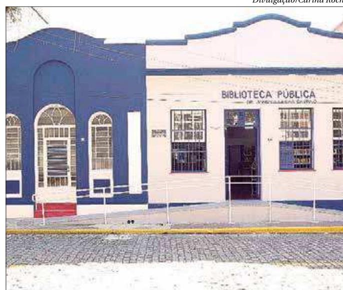
A Biblioteca Jandyr Cesar Sampaio receberá a "Folia na Biblioteca"

Em 1936, foi eleito "Cidadão Samba", num concurso promovido pelas escolas de samba brasileiras.