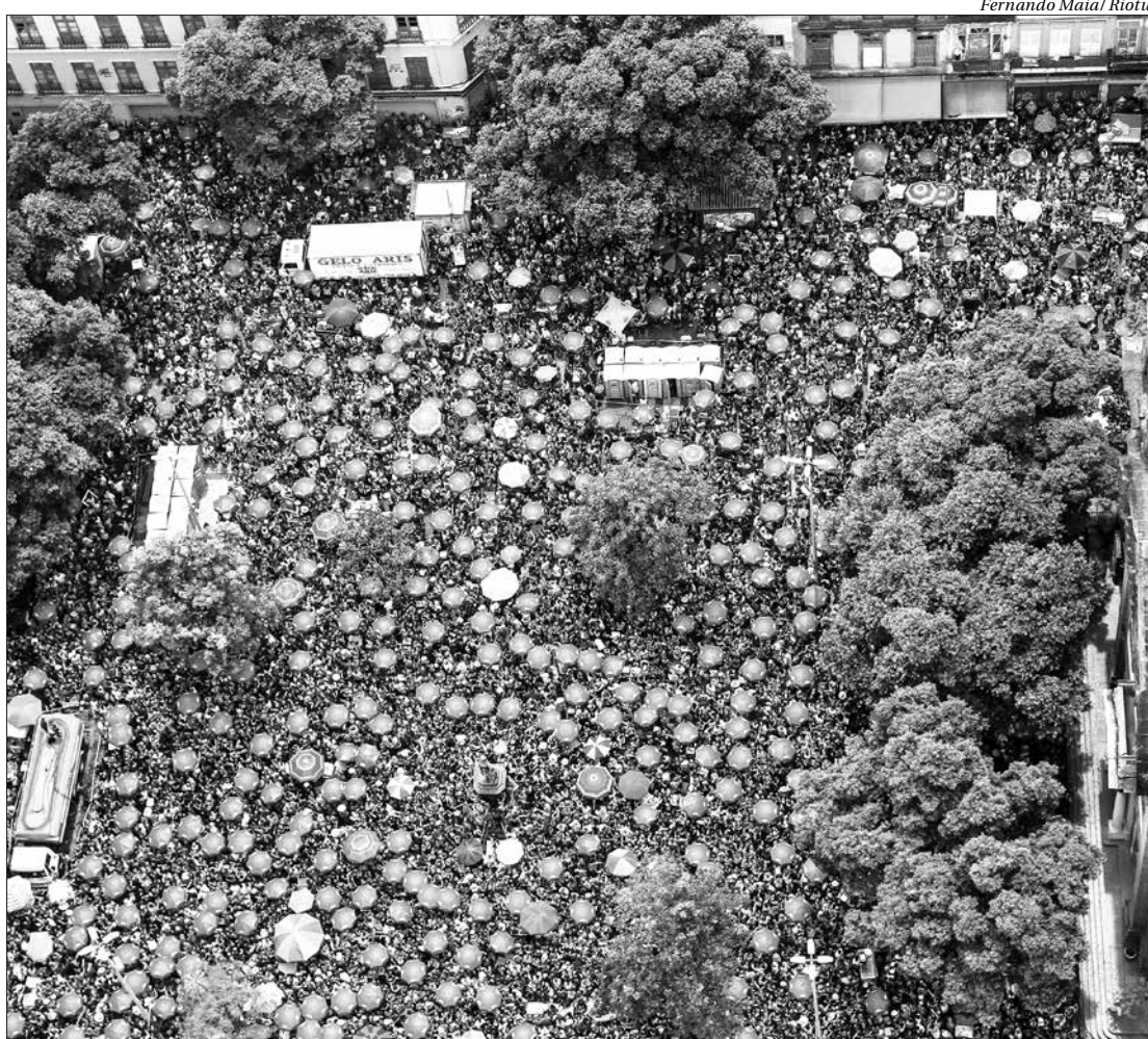
Um dos mais tradicionais blocos do Rio, "Fogo e Paixão", levou uma verdadeira multidão para o centro da capital

No sábado, a folia começou cedo no centro, com o bloco Céu na Terra em Santa Teresa, mas os campeões de público foram o Simpatia é Quase Amor, que reuniu 150 mil pessoas pela tarde em Ipanema, e o Chora Me Liga, com 110 mil pessoas pela