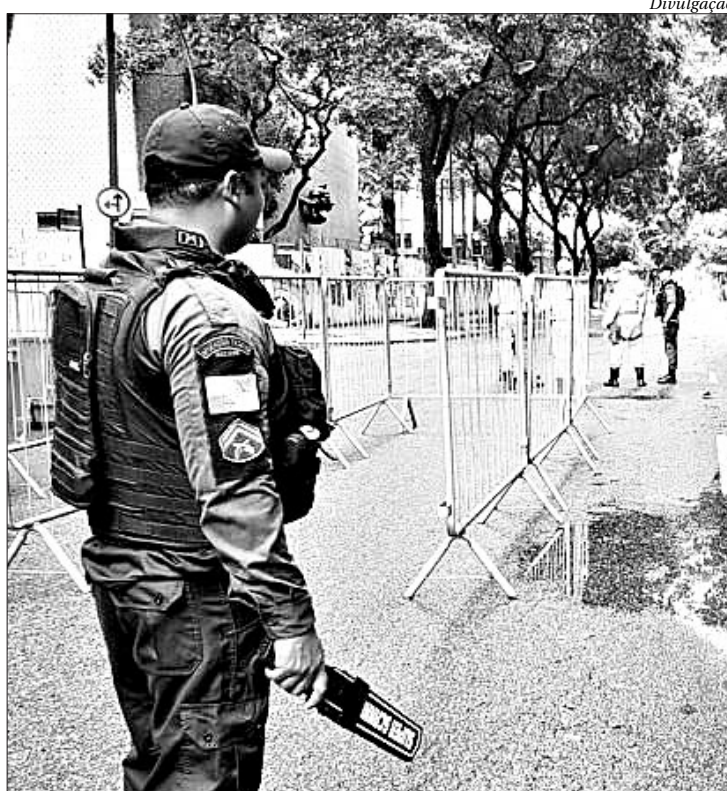
Policiais em pontos de bloqueio reduzem crimes nos megablocos

A expectativa do Governo é que o planejamento de segurança contribua de forma significativa para a queda dos indicadores criminais de fevereiro de 2020. A estimativa é de que em fevereiro deste ano, em comparação com o mesmo mês do ano passado, o índice de homicídio doloso