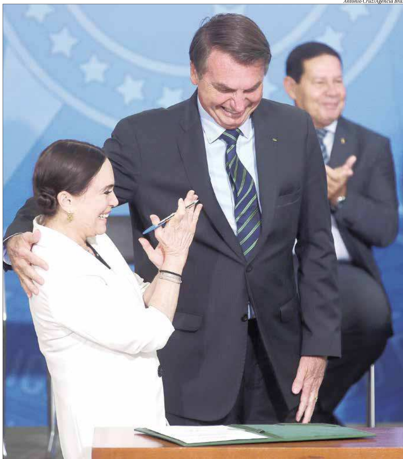
Antonio Cruz/Agência Brasil