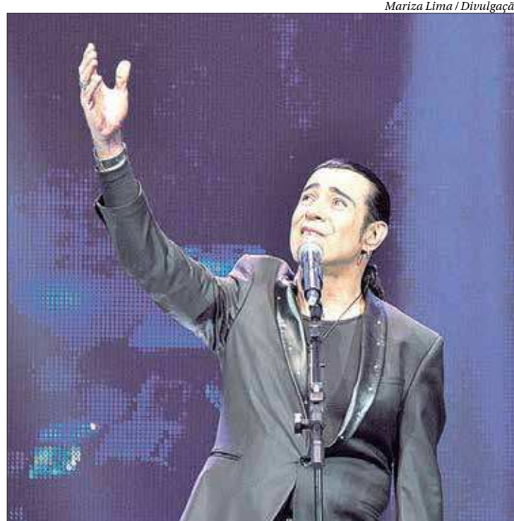
Show 'Elymar 30 anos' comemora a trajetória do cantor relembando sucessos

Elymar tinha um público cativo. Vendeu então 2 mil ingressos. Em 12 de novembro