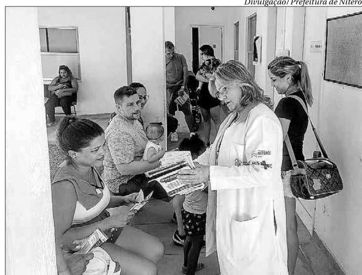
Oportunidades são para Programa Médico de Família e rede de Saúde Mental

As inscrições podem ser feitas pela internet ( www.co-seac.uff.br/concursos/fesau-de/2020 ) até às 12h do dia 26 de março. A taxa de inscrição tem valor diferenciado de acordo com o grau de escolaridade, sendo R$ 50 para Nível Fundamental e Agente Comunitário de Saúde, R$ 70 para Nível Fundamental e