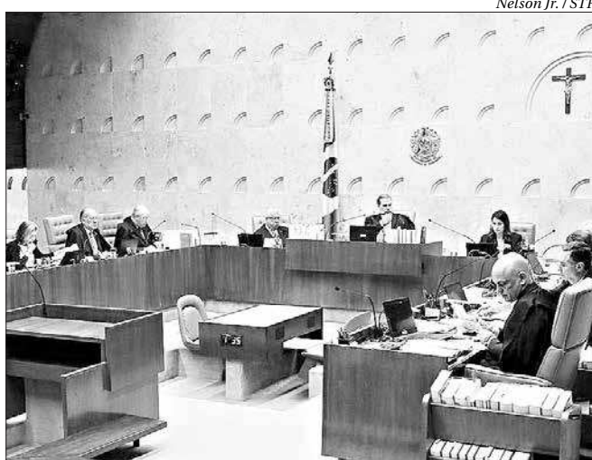
Nelson Jr. / STF

O Supremo Tribunal Federal (STF) confirmou nesta quarta (4) que novos partidos políticos precisam comprovar as assinaturas de eleitores não filiados a outras legendas para serem registrados na Justiça Eleitoral e participar das eleições. As assinaturas são usadas nas fichas de apoio que fazem parte dos documentos necessários para obtenção do registro. A decisão da Corte confirma as alterações realizadas pela minirreforma eleitoral de 2015, por meio da Lei nº 13.165/2015, que exige o apoio apenas de pessoas não filiadas a outro partido político para a criação de uma nova legenda.