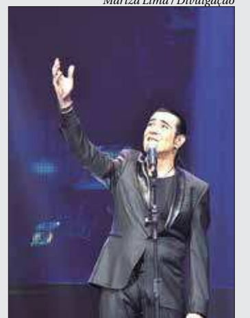
Cantor apresenta a turnê em que comemora 30 anos de sucesso