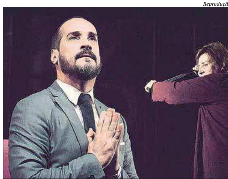
Armazém Cia de Teatro apresenta versão para a obra-prima de Shakespeare

Partindo da obra fundamental de Shakespeare, a ideia geral da companhia é encontrar um Hamlet do nosso tempo. Um Hamlet cheio de som e fúria. Não numa atualidade forçada, mas ressaltando aspectos da obra que dialogam com esse coquetel de conflitos contemporâneos que vemos todos os dias jorrando nas grandes cidades do mundo.