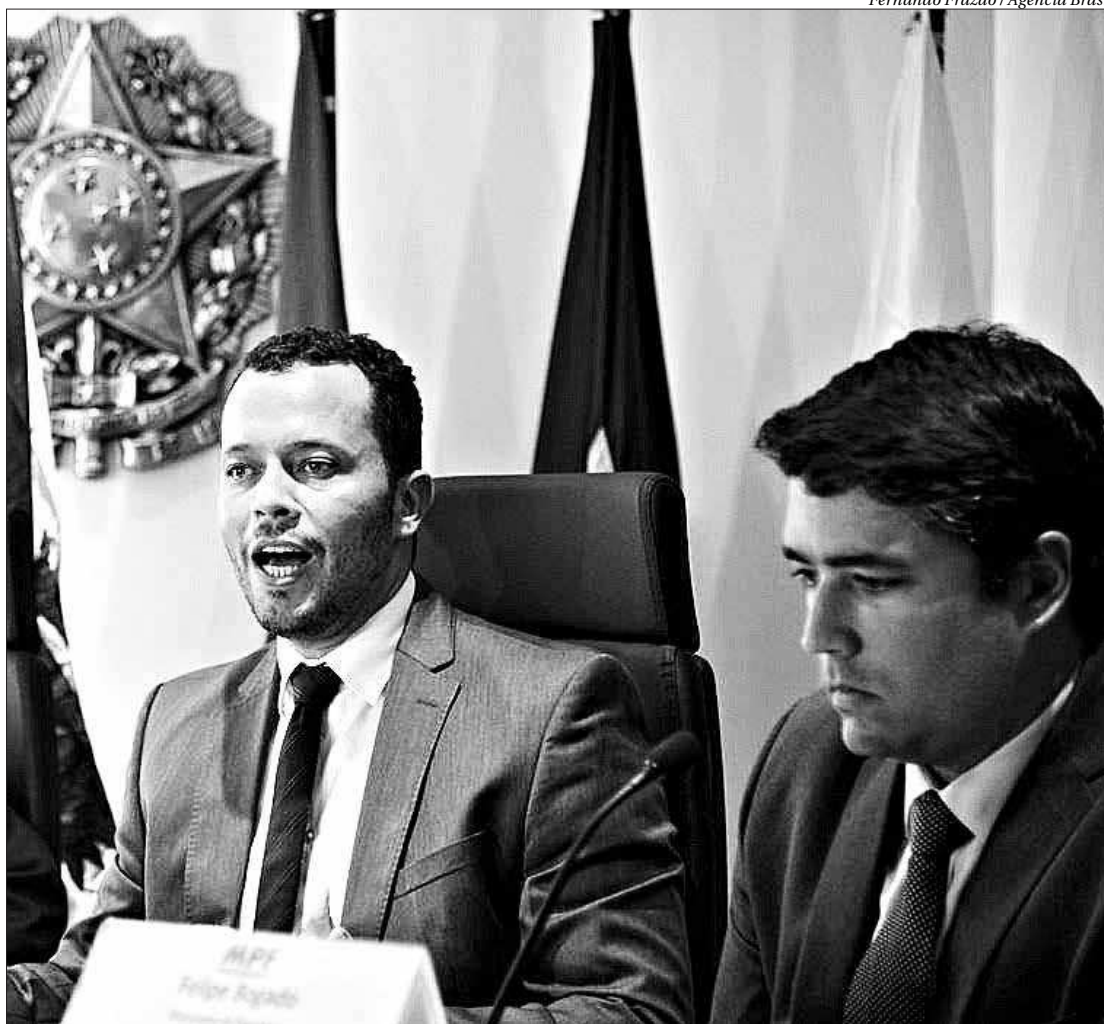
Procuradores falam sobre desdobramento da Operação Titeiro, que terminou com nove pessoas presas

O valor da propina, segundo a denúncia do MPF, chegava a 15% dos recebíveis pelas empresas. O grupo, que fazia parte da organização criminosa comandada