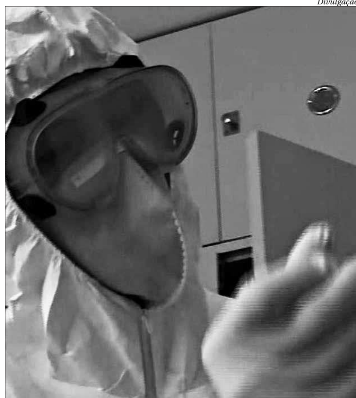
Apesar das confirmações, Governo diz que não é preciso usar máscaras

Existe um caso atípico em São Paulo, também dentre os confirmados. Uma jovem de 13 anos retornou da Itália, não apresentou sintomas, mas teve a presença do vírus confirmada no organismo. Ela procurou atendimento médico por outro motivo, ter rompido um tendão. E, durante os procedimentos médicos, os exames detectaram o vírus, mas isso não significa que a jovem pode