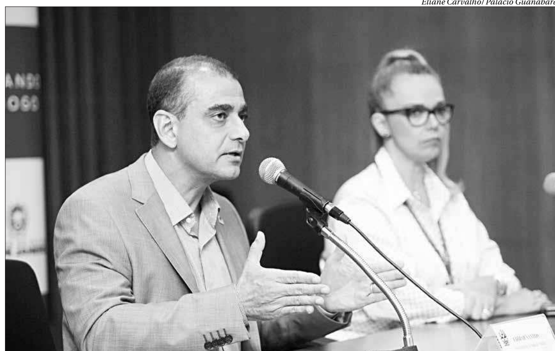
Secretário estadual de Saúde, Edmar Santos concedeu entrevista coletiva para falar sobre o primeiro caso confirmado no RJ

O voo que a trouxe ao país já foi identificado, e o Centro de Informação Estratégica em Vigilância e Saúde (Cievs) da SES já entrou em contato