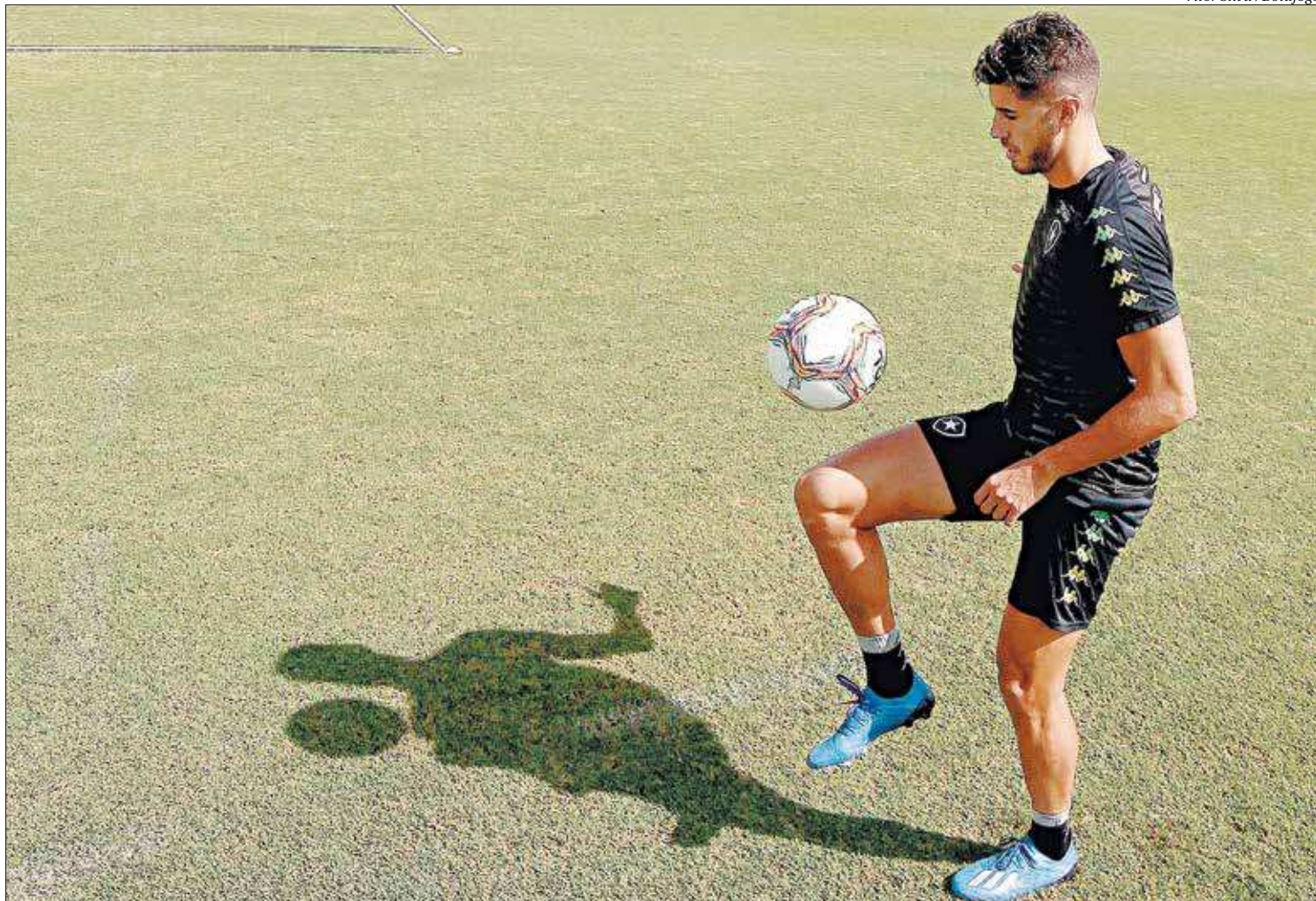
Vitor Silva / Botafogo

“O Pedro Raul é um jogador muito importante, sabe se posicionar bem na área, participa o tempo todo da partida e com certeza pode nos ajudar muito nesta