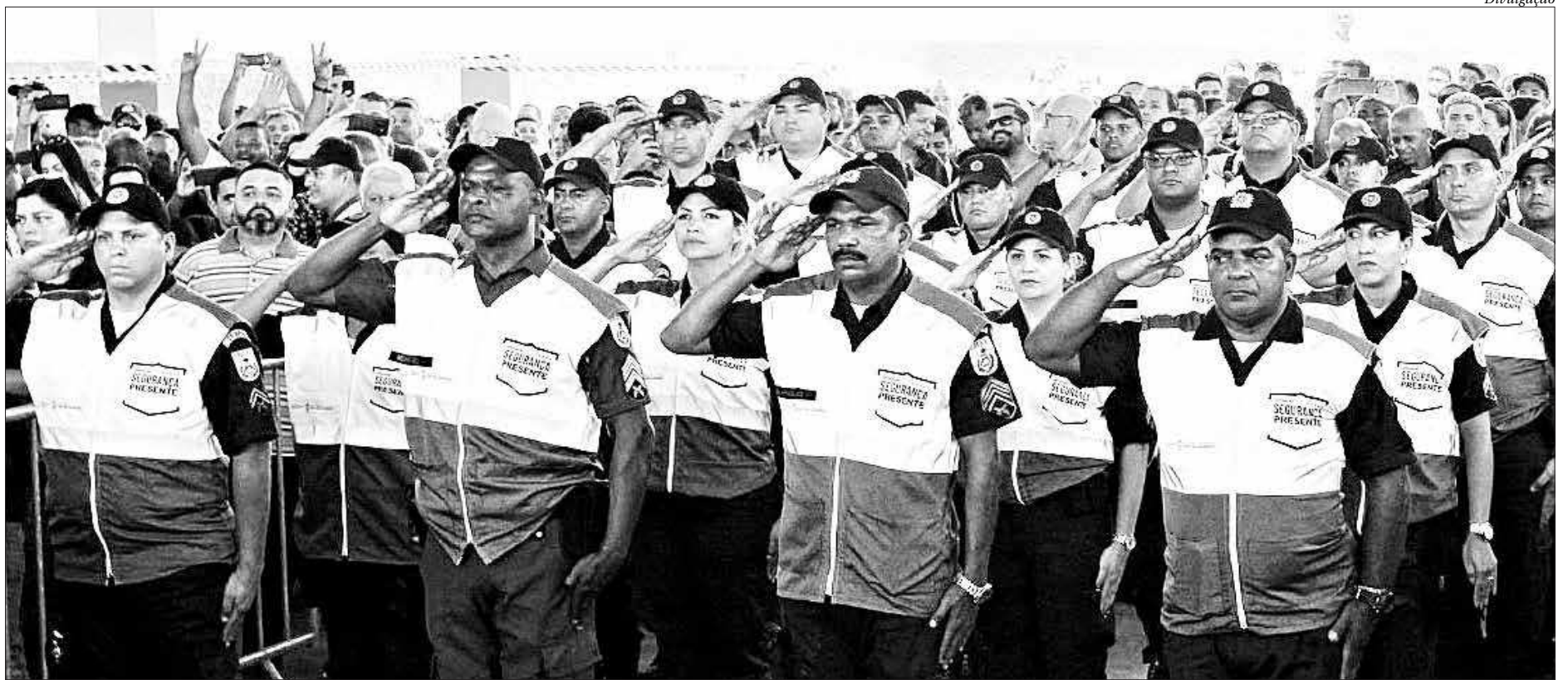
A Operação funcionará diariamente, das 6h às 22h. O governador também anunciou a abertura de licitação para a construção do Hospital Geral de São João de Meriti

“Meu compromisso com a saúde do estado é tão grande como o que tenho com a segurança pública. O Governo do Estado já havia destinado R$ 20 milhões para o financiamento da Saúde em São João de Meriti. Além disso, já