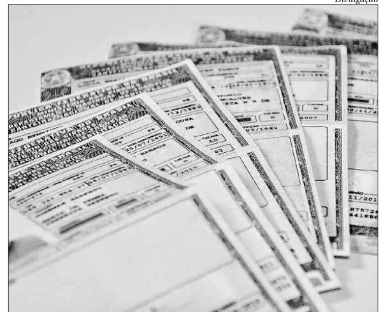
A demanda pelo serviço fez com que o departamento montasse outras estruturas