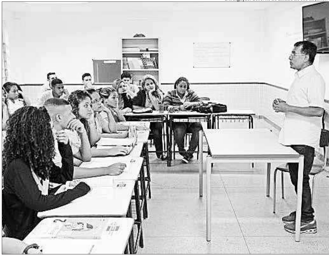
Professores interessados em participar do processo seletivo podem se inscrever no site da Seeduc até dia 15 de março

A seleção dos candidatos será realizada em etapa única, de caráter eliminatório e classificatório, composta por análise de títulos. No ato da inscrição, o sistema pontuará as titulações e experiências informadas pelos