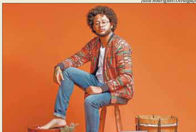
Emicia apresenta 'AmarElo' na Sala Nelson Pereira dos Santos