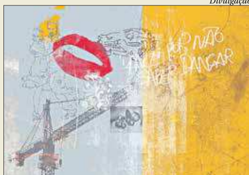
"Lugar de afetos" reúne mais de 30 artistas plásticos