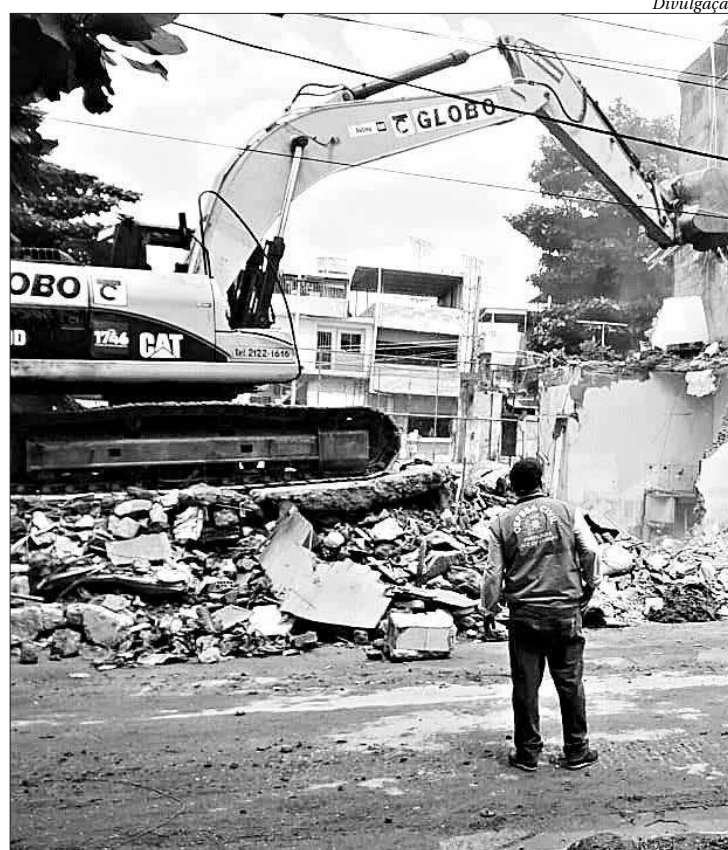
Máquinas seguem com o trabalho pesado no Jardim América

A Defesa Civil municipal atua no Jardim América desde a manhã da última terça-feira, após o desabamento de três sobrados (de dois e três andares). Um deles - um imóvel de dois andares no número 91 da via - já estava interditado por apresentar risco estrutural e encontrava-se desocupado. Os agentes isolaram preventivamente a área do desabamento e iniciaram as vistorias em imóveis vizinhos. ■