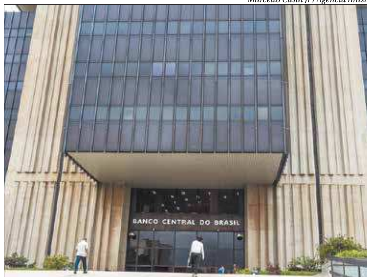
BC acertou a prorrogação da alíquota reduzida para depósitos compulsório a prazo

Os depósitos compulsórios a prazo representam a fatia do dinheiro aplicado por clientes de uma instituição financeira em modalidades como poupança e certificados