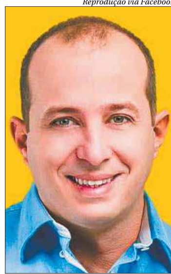
Delaroli aparece em 2º com 11%