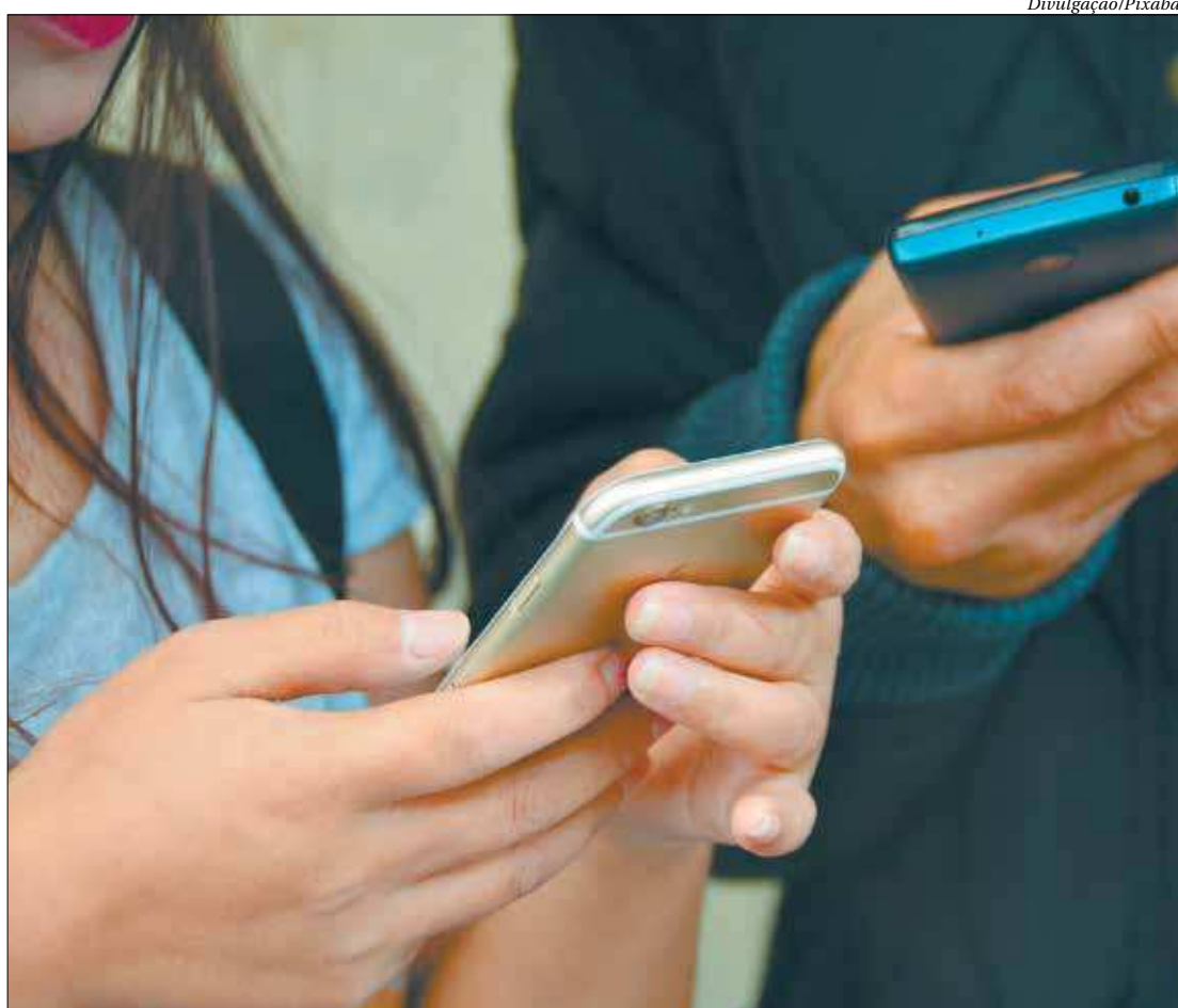
Em apenas duas horas de funcionamento do Pix em sua fase de testes, mais de 200 mil chaves foram cadastradas

"É uma espécie de apelido para facilitar o envio de Pix", disse. "Não é necessária a chave para fazer o Pix, mas sim para ter uma experiência fluida e facilitada. É um instrumento de conveniência. E se não tiver chave? A pessoa vai ter mais trabalho, porque