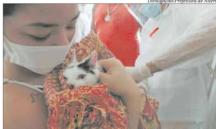
Campanha de vacinação antirrábica acontece aos sábados, por região

A pessoa que for conduzir um animal para vacinar deve saber fazer a contenção e ter autoridade sobre ele, pois isso é responsabilidade do condutor. ■