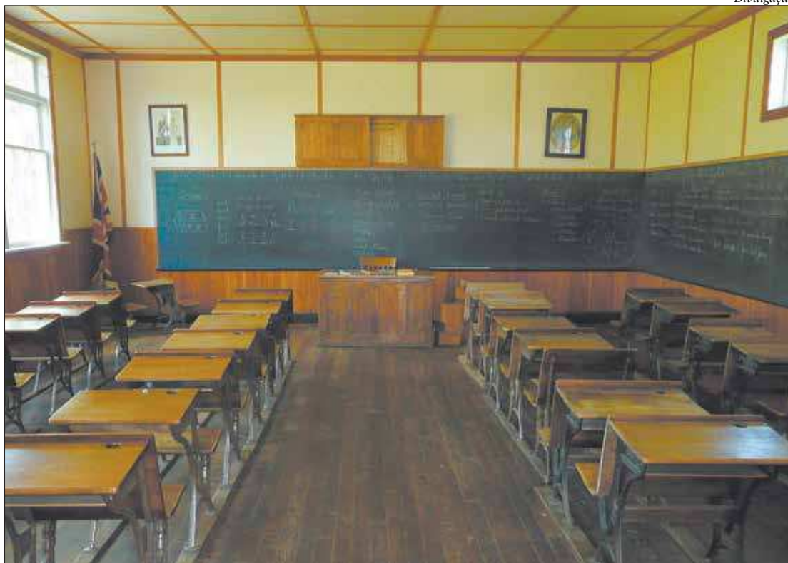
Escolas estão adequando seus espaços para garantir o distanciamento e adquirindo equipamentos de proteção