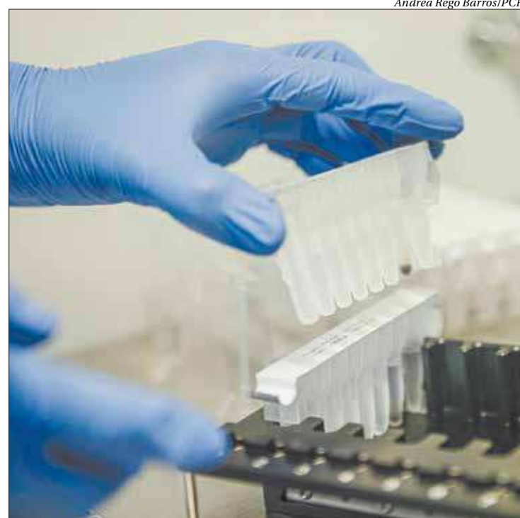
Andréa Rêgo Barros/PCBR

Rio - Em 24 horas, o estado do Rio de Janeiro computou 141 novas mortes e 2.705 novos casos do novo coronavírus. Com isso, o Rio de Janeiro já soma, desde o início