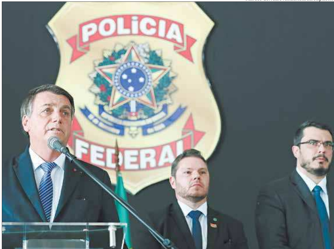
Bolsonaro participou ontem da cerimônia de encerramento dos cursos de formação profissional da Polícia Federal

“Um dos efeitos do profícuo trabalho de vocês foi a mudança do status quo da política brasileira. Vocês ajudaram a mudar paradigmas, a mostrar para todos no Brasil que nós temos como ser um país melhor e diferente”, disse aos formandos. “Eu