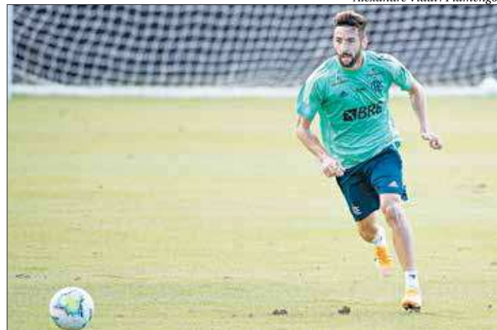
Recuperado da covid-19, lateral se apresentou ontem à seleção chilena