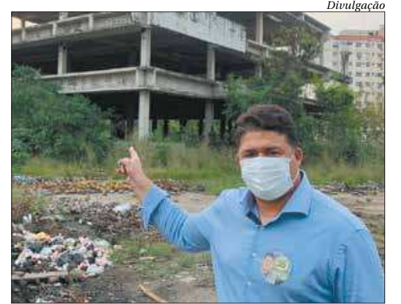
Segundo Roberto Sales, a saúde será uma das prioridades

postas para um segundo governo até os moradores e comerciantes do bairro Venda da Cruz. À noite, o candidato participou de três reuniões com apoiadores e lideranças políticas. ■