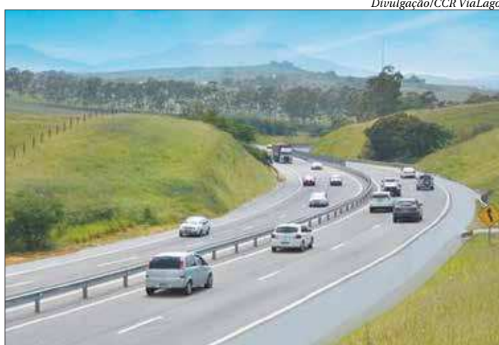
ViaLagos fará operação especial para o feriadão de Nossa Senhora Aparecida

Informações sobre o tráfego estão disponíveis 24 horas em www.grupoccr.com.br/vialagos ou no Disque CCR ViaLagos (0800 7020124), que conta também com Central de Atendimento ao Deficiente