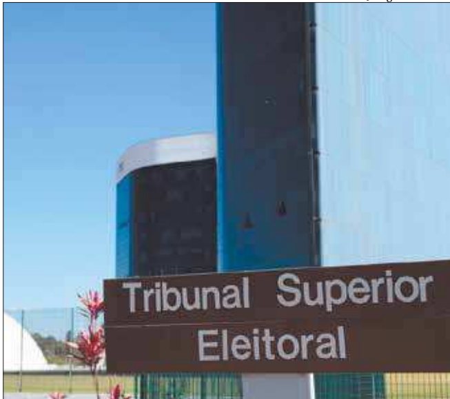
Decisão de ontem do TSE reverteu entendimento e multa anterior