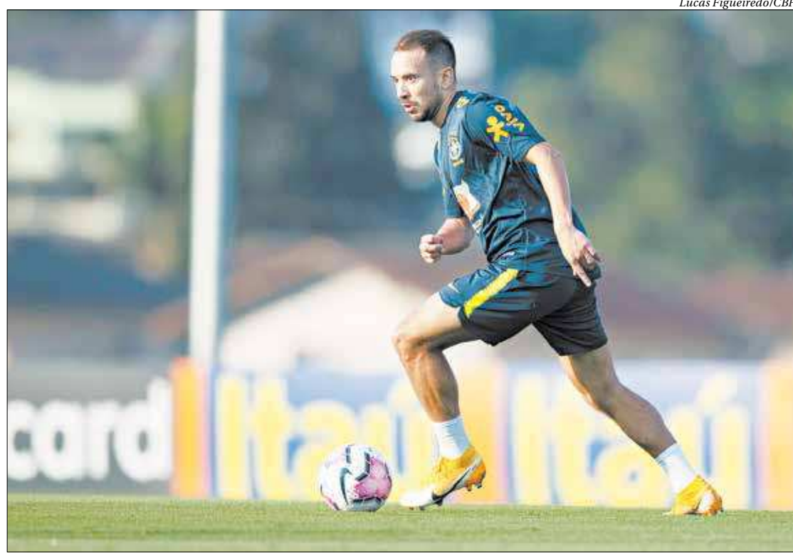
Caso Neymar não se recupere das dores, Éverton Ribeiro, do Fla, será titular na estreia da Seleção nas Eliminatórias

Titular absoluto da posição, Alisson sofreu uma lesão no ombro e não estará à disposição. Com isso, Weverton assumirá o posto. No