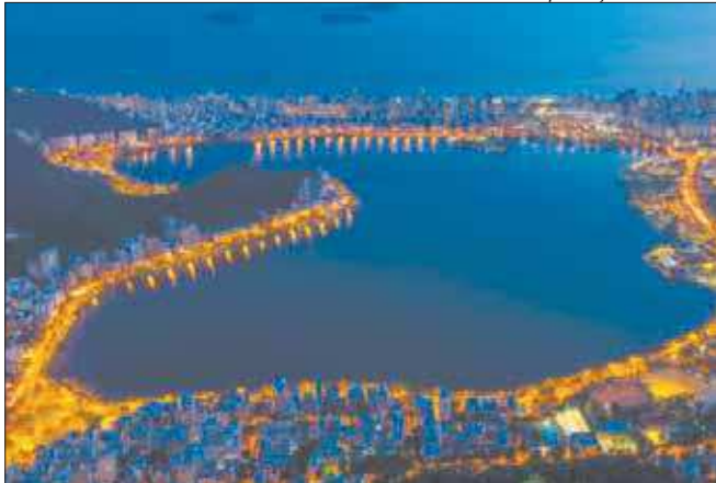
Lagoa Rodrigo de Freitas ficará sem o brilho da Árvore de Natal