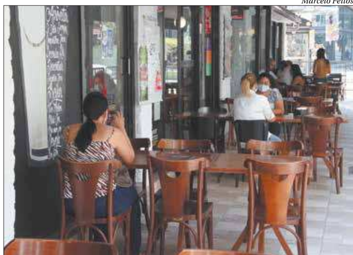
Estabelecimentos de Niterói agora vão poder fechar mais tarde