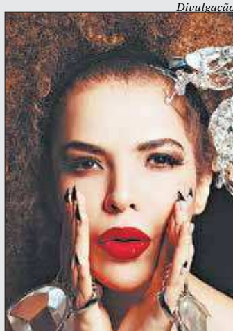
Cantora vai reunir antigos e novos hits na transmissão deste sábado