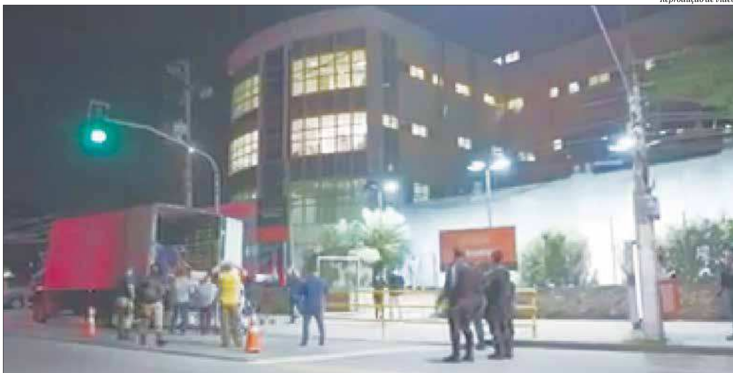
A Prefeitura de Niterói investiu cerca de R$ 10 milhões na compra dos respiradores. Equipamentos abasteceram o Hospital Oceânico, especializado em covid-19

“Por ser portátil, respirador de ambulância, ele não podia segurar por pelo menos 48 horas para o paciente de covid-19. Fiz essa denúncia para averiguar possíveis irregularidades na compra”, afirmou.