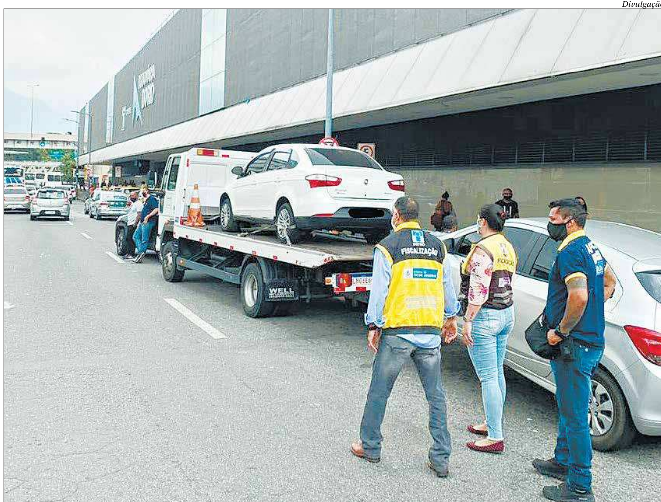
Agentes do Detro realizaram, ontem, uma operação para coibir o transporte irregular de passageiros no entorno da Rodoviária do Rio

(21) 2621-9955 comercial@ofluminense.com.br