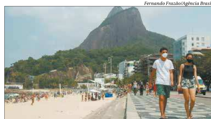
Ao lado de Ipanema, Leblon lidera a lista de bairros mais procurados

Descontos - Para ajudar na retomada do turismo do Rio de Janeiro, o Sindicato dos Meios de Hospedagem do Rio de Janeiro (Hotéis Rio) e a Associação Brasileira da Indústria de Hotéis do Estado do Rio de Janeiro (ABIH-RJ) criaram a campanha promocional Mais Rio por Menos,