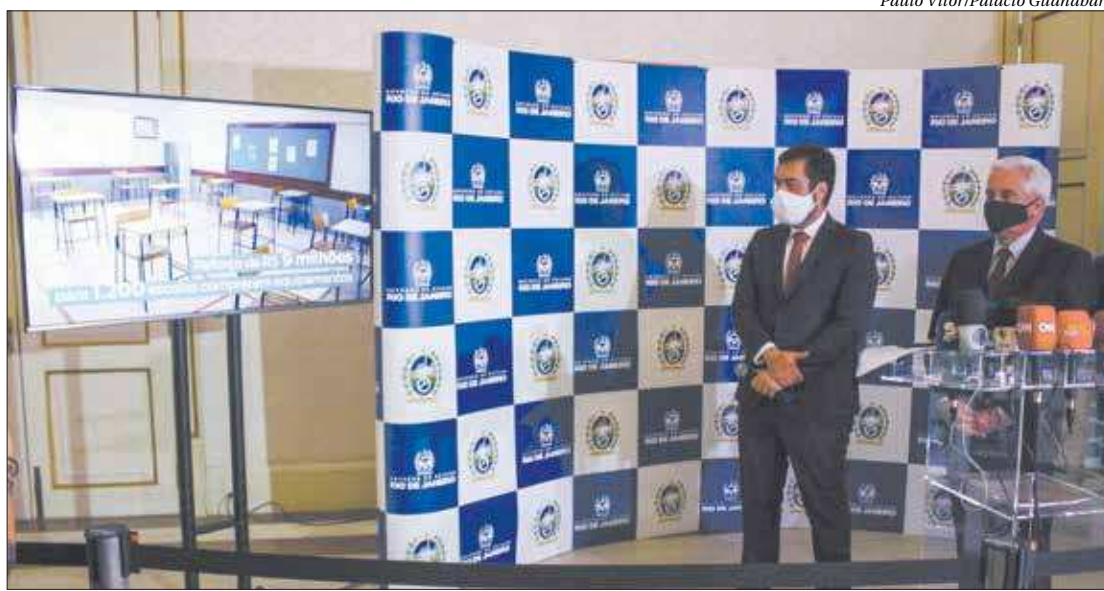
Governador em exercício Cláudio Castro, e secretário de Educação, Comte Bittencourt, anunciam retorno às aulas

De acordo com ele, em 2021, será feito um diagnóstico individual com cada