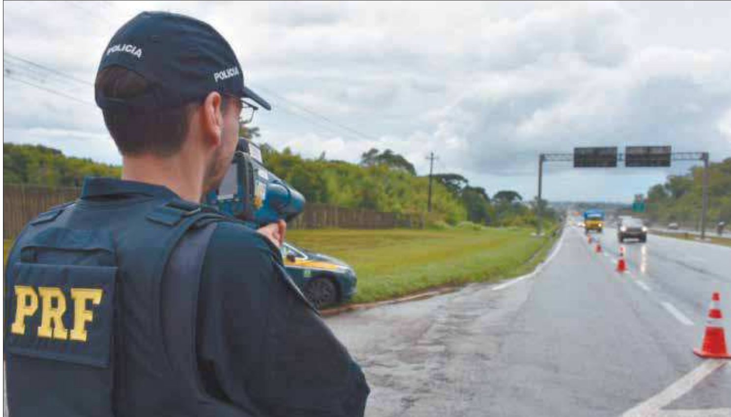
Policiais vão trabalhar em regime de plantão nos três dias de feriado nas principais estradas que cortam o estado, visando a segurança dos motoristas

As equipes de SOS Usuário Médico, Mecânico e de Arrecadação da Concessionária estarão reforçadas,