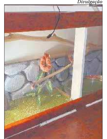
Os animais estavam em um aquário de 1,5 metro em uma casa no Anil