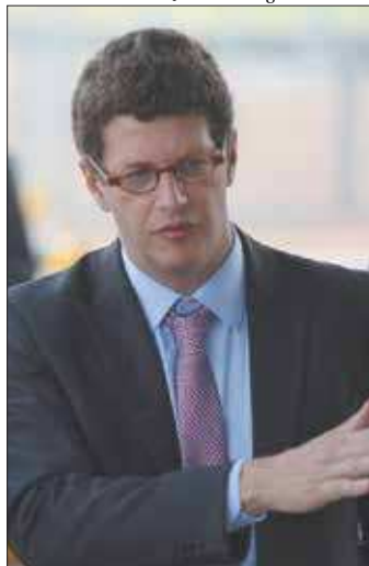
Ministro Ricardo Salles falou ao Senado

temporária externa do Senado para acompanhar as ações de combate ao fogo na região.