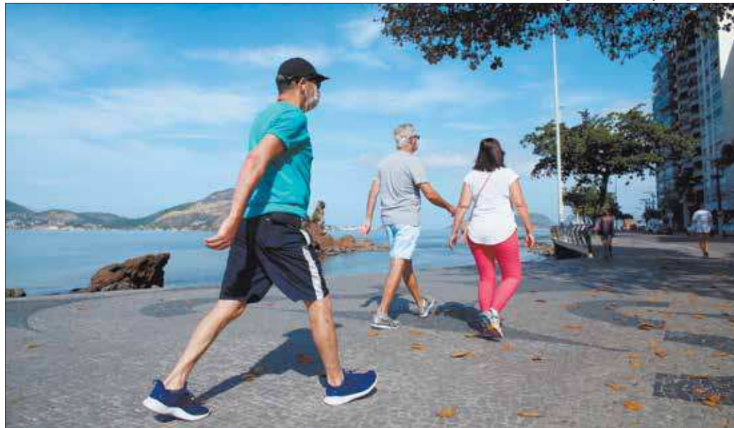
Douglas Macedo / Prefeitura de Niterói

O IDL é um estudo elaborado pelo Instituto de Longevidade Mongeral Aegon e com metodologia da Fundação Getúlio Vargas (FGV) que levanta os pontos positivos e negativos das cidades avaliadas para servir de embasamento a ações para a promoção da longevidade com qualidade de vida. No IDL 2020, foram analisados 50 indicadores divididos em sete variáveis: Cuidados de Saúde; Bem-Estar; Finanças; Habitação; Cultura e Engajamento; Educação e Trabalho; e Indicadores Gerais.