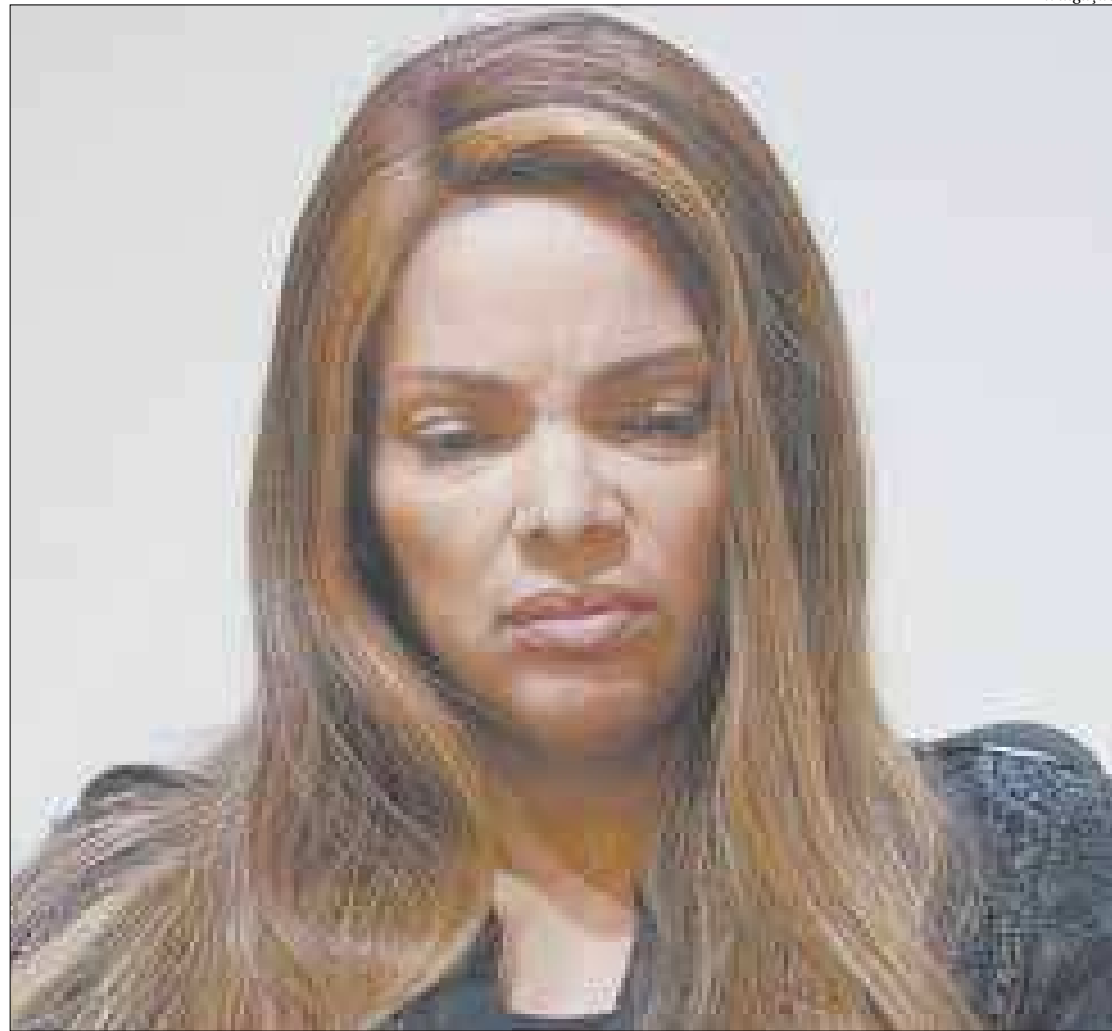
A deputada federal Flordelis é acusada do assassinado do marido, o pastor Anderson do Carmo

Na decisão, a ministra argumenta que o STF não é a instância competente “para conhecer e julgar habeas corpus, quando for paciente autoridade com prerrogativa de foro, nos casos em que aquela condição processual não a qualifique para ser julgada, diretamente, nesta