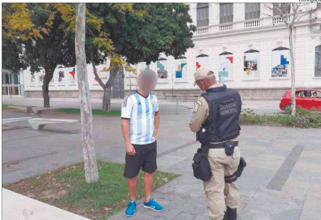
Durante ação, guardas também multaram quem estava sem máscara de proteção nas ruas da cidade

Houve atuação em toda a cidade, guardas municipais realizaram patrulhamento em áreas de lazer como o Aterro do Flamengo, Parque Madureira e Quinta da Boa Vista, orientando a população e coibindo irregularidades. A Guarda fez patrulhamento em toda a cidade, incluindo a orla. Durante as abordagens, guardas orientam sobre as restrições, fiscalizam as posturas e as infrações sanitárias (como a falta do uso de máscaras), coíbem o estacionamento irregular e conscientizam em relação às medidas para