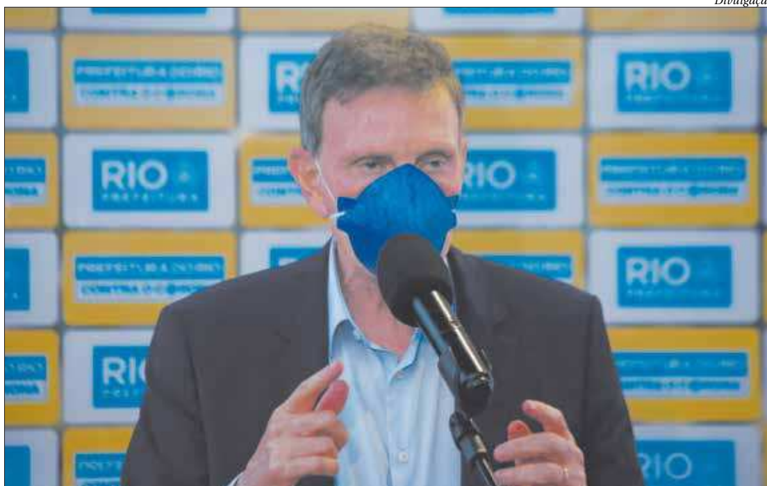
O prefeito do Rio de Janeiro Marcelo Crivella agradeceu a Deus, a seu advogado e disse que foi feita justiça

“Estou tão feliz. No fundo eu senti que o TRE-RJ resolveu pegar o prefeito como exemplo. Não pode ter bagunça. Há dois anos eu fui a uma reunião do meu filho, com 50 pessoas, que já foi investigada pela CPI da Câmara, e fui inocentado, mas tinha me dado uma inelegibilidade. Uma medida pesada, dura, duríssima, só por ir a uma