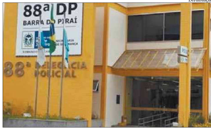
Acusado foi preso por agentes 88ª DP (Barra do Piraí) quase 20 anos após crime

Os crimes causaram grande comoção na região, pois foram praticados contra uma criança de 11 anos de idade e uma adolescente de 12 anos de idade. Os filhos adolescentes