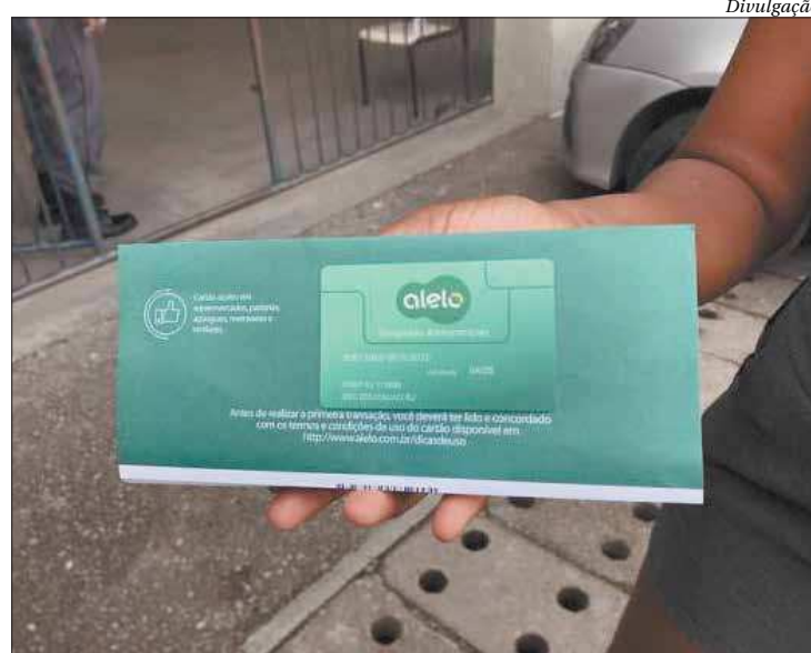
Prefeitura do Rio faz recarga nos cartões de kit merenda da rede de ensino

O cartão do kit merenda está carregado com créditos referentes aos 22 dias letivos de um mês. O valor é destinado para a compra de gêneros a serem destinados à alimentação dos alunos, conforme determina a legislação. De acordo com a SME, o valor é compatível para a compra de alimentos que atendem às porções que uma criança dentro da faixa etária escolar consome nas refeições oferecidas na unidade, que são desjejum e almoço. ■