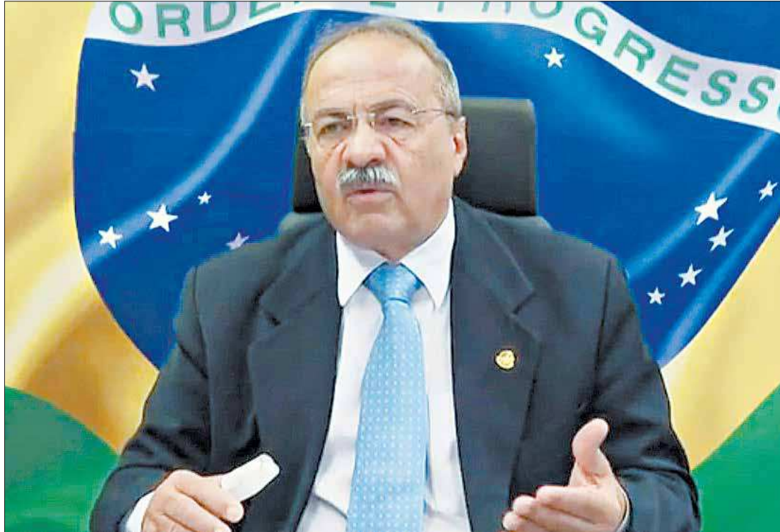
O senador Chico Rodrigues foi destituído do cargo de vice-líder do Governo pelo presidente Jair Bolsonaro

Mais cedo, o presidente Jair Bolsonaro (Sem Partido) comunicou o Senado da destituição de Chico Rodrigues (DEM-RR) da vice-liderança do Governo Federal na casa. O despacho foi publicado em edição extraordinária do Diá-