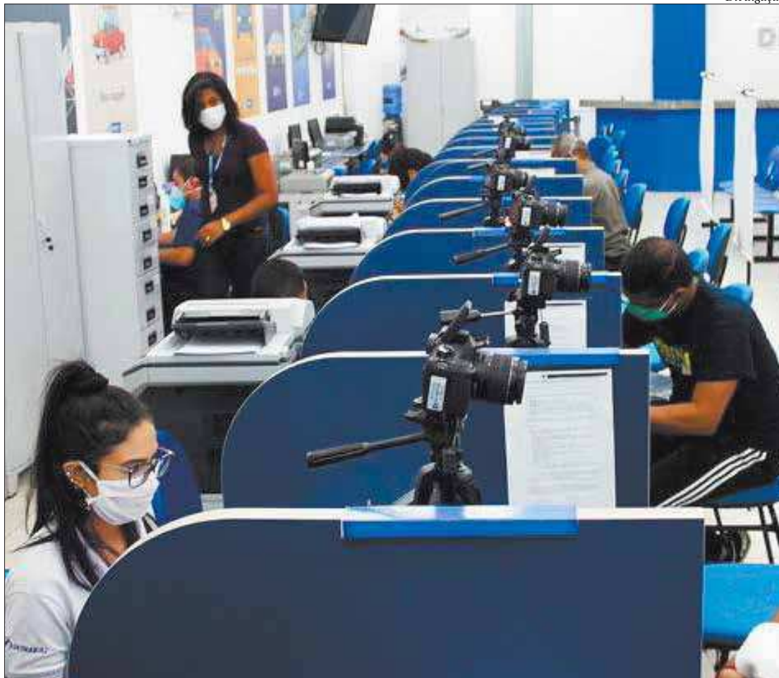
Serviços do mutirão do Detran vão ser oferecidos à população em sete cidades neste sábado

Para este sábado, o departamento aumentou o número de vagas e postos em comparação ao mutirão anterior. No último fim de semana, 684 pessoas foram atendidas na sede do departamento, no Centro do Rio, e nos municípios de Mendes, Pinheiral e Porto Real. O novo presidente do Detran, Adolfo Konder, determinou as ações em todos os sábados até o fim de novembro. Ao atender a população também aos sábados, o departamento pretende reduzir com mais rapidez a demanda represada durante a pandemia.