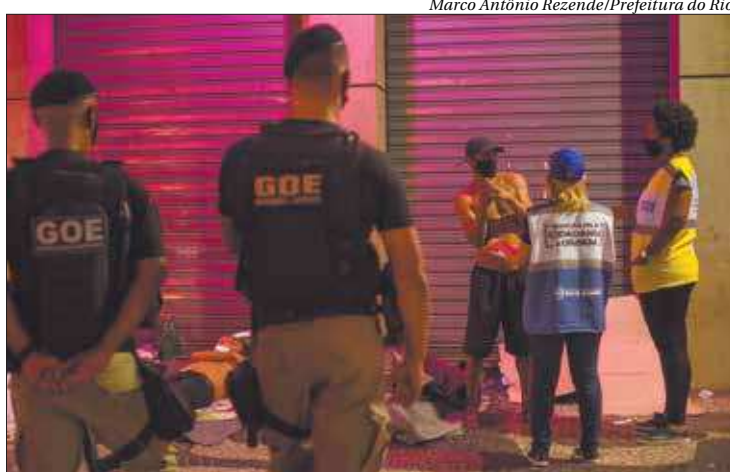
Também foram realizados três encaminhamentos para retirada de documentos

Com planejamento da Subsecretaria de Operações (Subop) da Seop, a megaoperação contou com cerca de