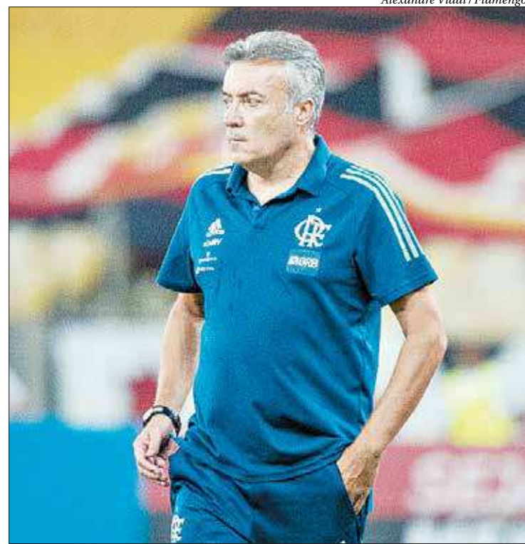
O Fla, do técnico espanhol Domènec Torrent, empatou pela 4ª vez no Brasileirão

Só que após o empate, o Flamengo voltou a ter dificuldade na criação das jogadas. O panorama do jogo seguiu até os minutos finais. O Bragantino conseguiu segurar o ímpeto dos cariocas para garantir um ponto no Maracanã. ■