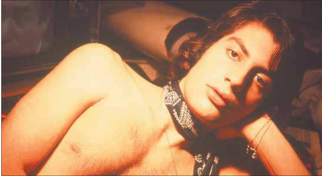
Exposição no MAM inclui imagens de "Cosmococa" e outros experimentos como slides da série "Neyrótika"

O Museu de Arte Moderna (MAM) do Rio, no Aterro do Flamengo, abre amanhã (17) a exposição "Cosmococa" - programa in progress: núcleo poético de Quasi Cinema", com cinco imagens fotográficas oferecidas em doação pelo Projeto Hélio Oiticica e pelo cineasta Neville Dalmeida. Com curadoria de Fernando Cocchiarale e Fernanda Lopes, a seleção envolve imagens originalmente feitas em slide para serem projetadas nos ambientes dos "Bloco-Experiências in Cosmococa" - programa in progress", criados em 1973, em Nova York, pelo artista carioca Hélio Oiticica (1937-1980) em parceria com o cineasta mineiro Neville Dalmeida.