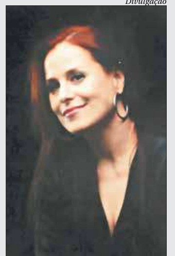
Cantora se apresenta hoje em transmissão pelo Facebook