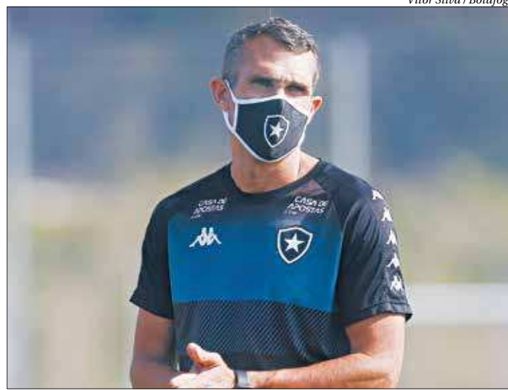
Lazaroni perdeu a invencibilidade no comando do Botafogo contra o Grêmio