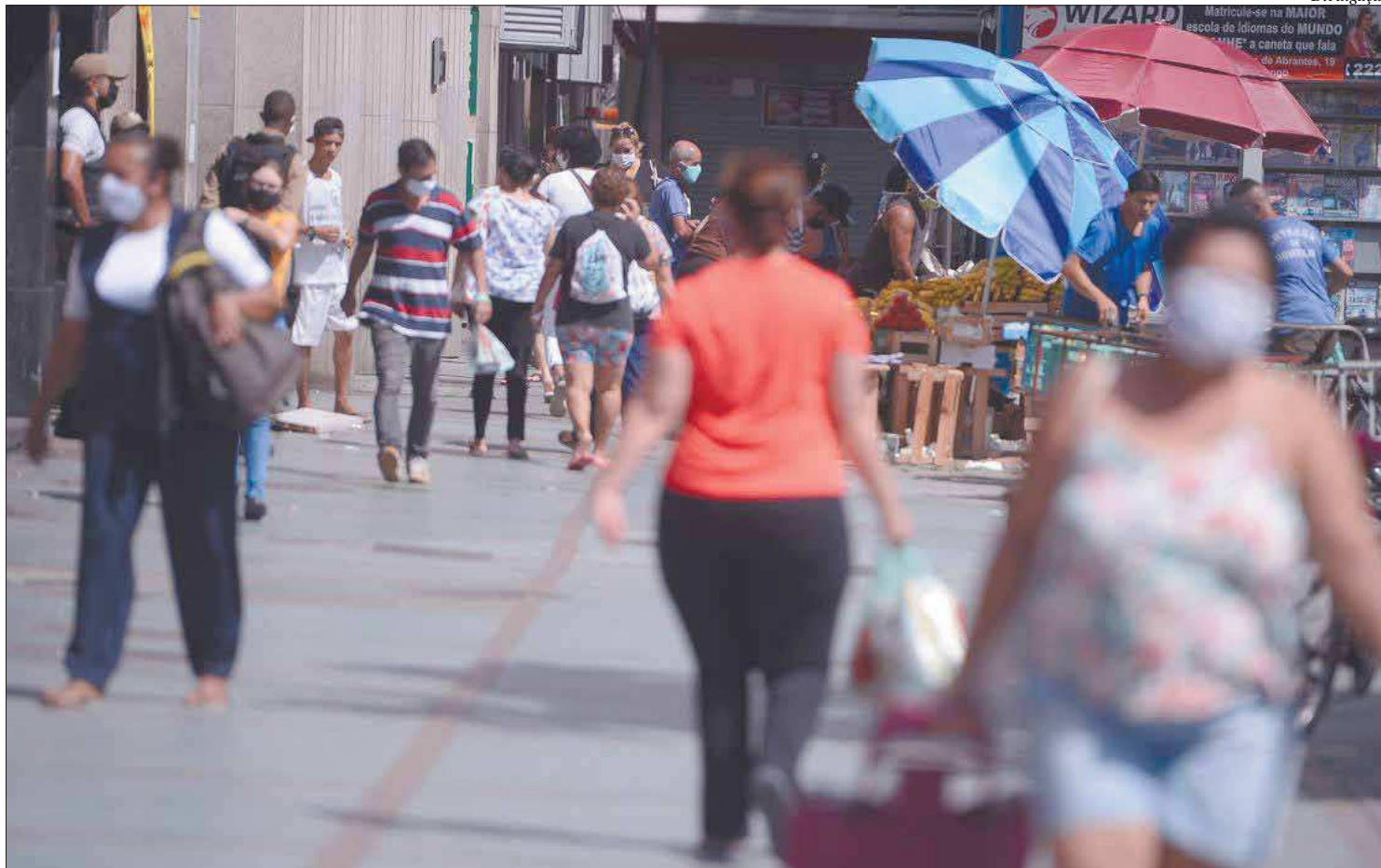
Segundo última avaliação divulgada pelo Governo, as sete regiões onde o risco de contrair a covid-19 é baixo concentram 92,55% da população do estado

Já os eventos de caráter social - como casamentos, bodas, aniversários, forma-