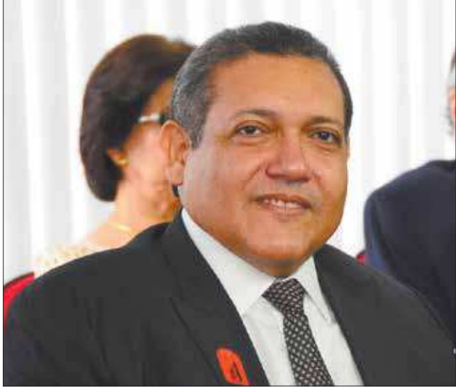
Desembargador respondeu sobre vários assuntos em mais de 10 horas