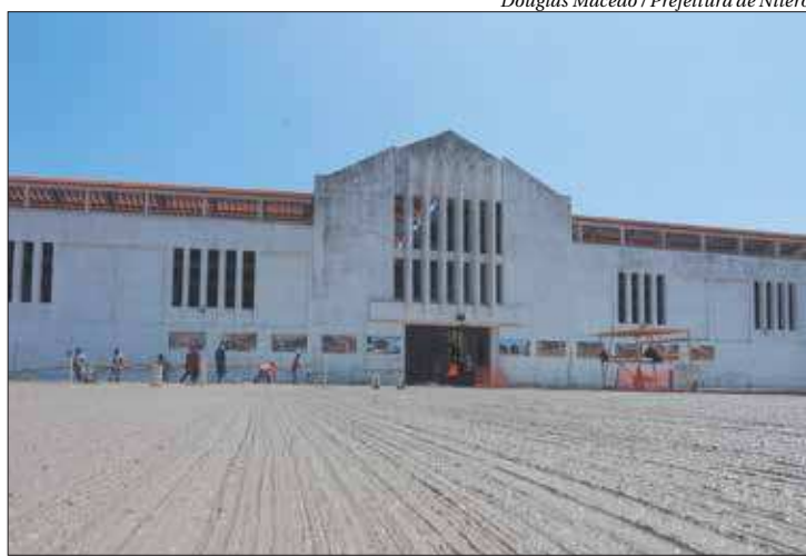
Obras avançam no Mercado Municipal, que será entregue no dia 22 de novembro

Restauração - O edifício da Avenida Feliciano Sodré está recebendo um trabalho metódico e feito com cuidado