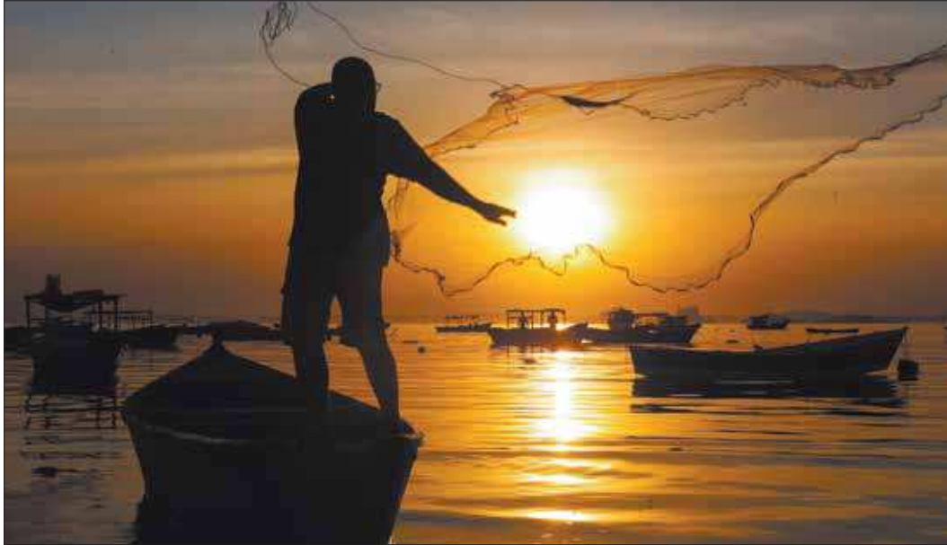
Prefeitura é acusada de exigir título de eleitor para fazer cadastro que garante benefício, que não foi pago