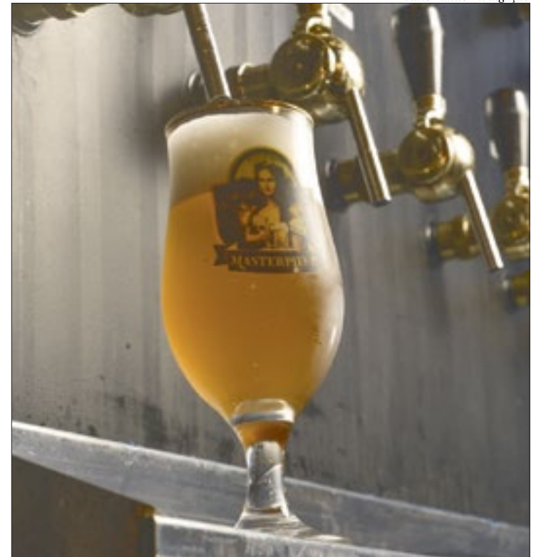
Bar da Fábrica oferece opções exclusivas de cervejas e boa música

“Entendemos que com o novo túnel, a região se tornou bem atraente para quem vem das demais regiões da cidade. Nosso público-alvo são os consumidores de cerveja artesanal, que buscam alta qualidade e preço justo, além da experiência proporcionada pelo Bar da Fábrica, que replica um galpão in-