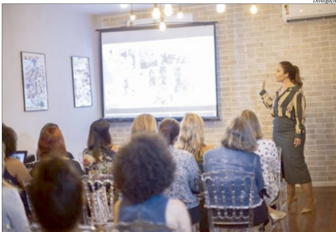
Curso de Mesa Posta profissional gratuito é oportunidade de profissionalizar sem sair de casa

Os profissionais que desejam se reposicionar no mercado ou transformar uma paixão em trabalho devem levar em consideração as projeções do mercado pretendido para aumentar suas chances de êxito. Tendo em vista o crescimento exponencial da ordem de 30% nos últimos anos para o mercado de mesa posta, a ABCASA, responsável pela maior feira do setor na América Latina, disponibiliza uma plataforma de educação, a ABCASA.developolvimento, com objetivo de fomentar a formação de seus associa-