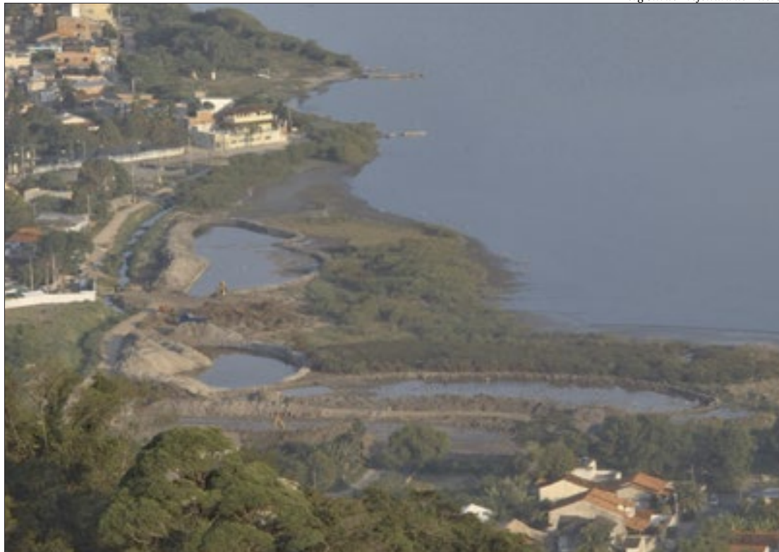
Trabalho de revitalização do entorno da Lagoa de Piratininga deve contribuir para atrair ainda mais negócios para o bairro

“O espaço iria ser apenas um estacionamento. Peguei o terreno completamente abandonado. Durante a pandemia, dentro de casa, com muito tempo para pensar, resolvi fazer mais. O trevo de Piratininga há muito tempo é referência de entretenimento e gastronomia. O bairro como um todo vem se consolidando com uma concentração de bares, food parks e alguns dos restaurantes famosos da região. Já