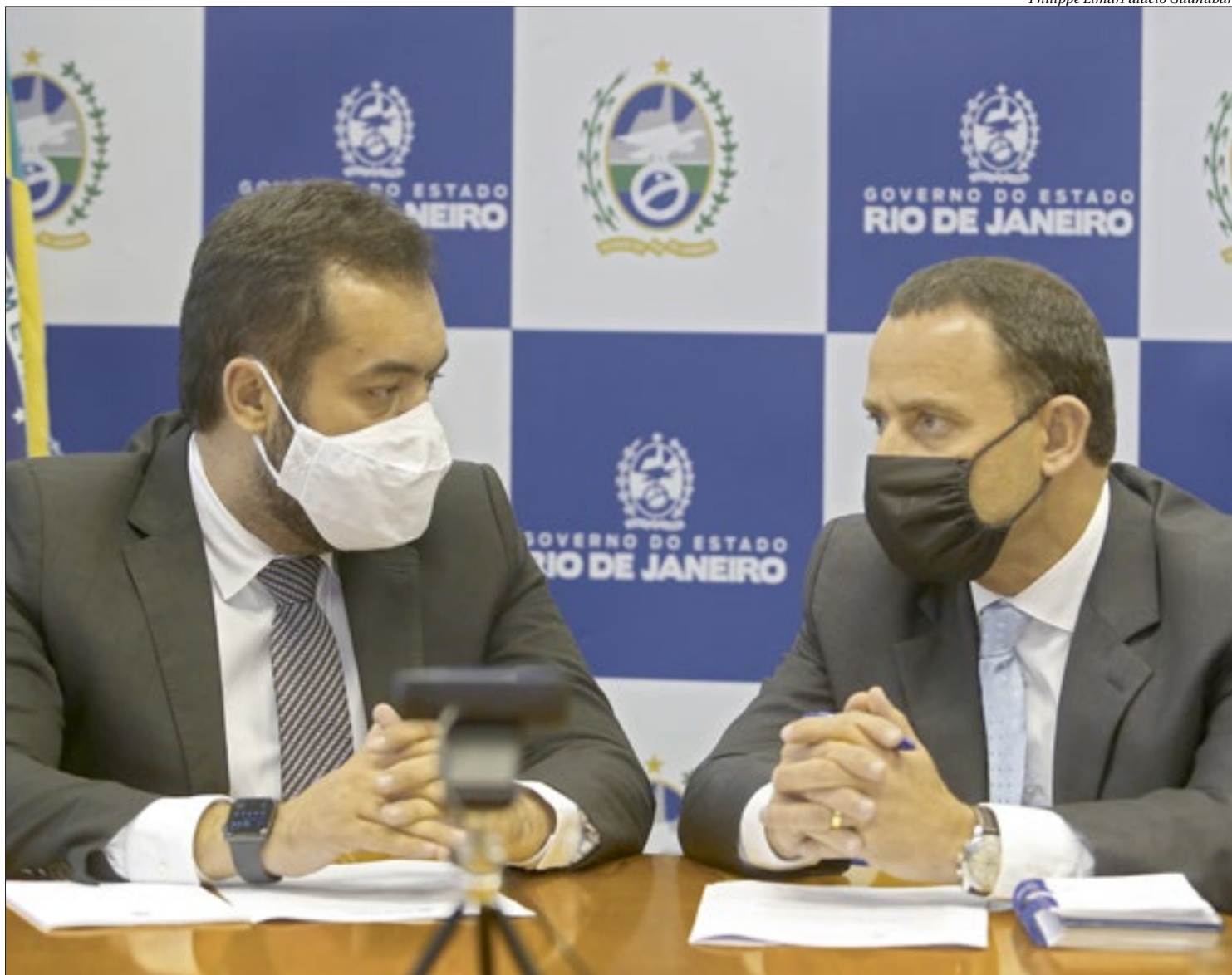
Governador em exercício, Claudio Castro, e secretário de Polícia Civil, Allan Turnowski, anunciaram a abertura do concurso durante uma live ontem à tarde