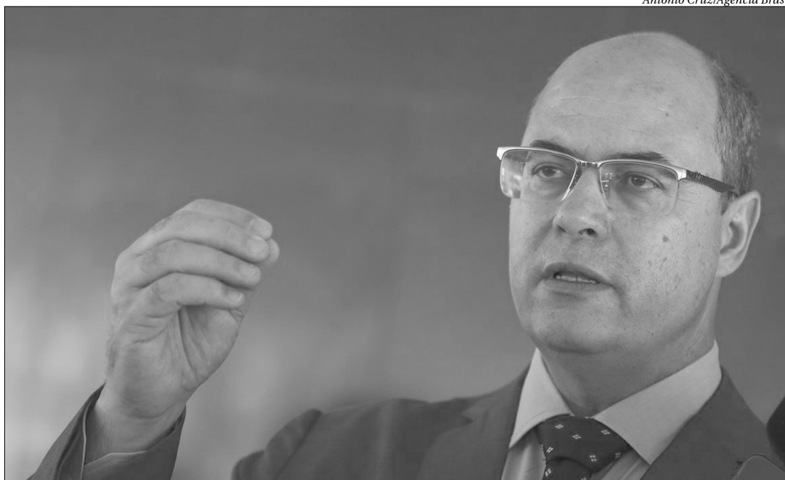
O governador afastado do Rio de Janeiro, Wilson Witzel, segue em difícil situação para tentar se manter no cargo

Aras afirmou que os Códigos de Processo Penal não permitem essa interpretação. ■