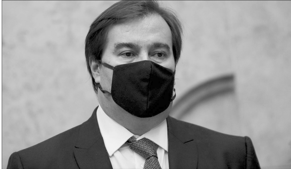
Presidente da Câmara, Rodrigo Maia, abriu reunião de comissão que investiga morte de negro por espancamento

Ao discursar, o deputado afirmou que o racismo é estrutural no Brasil e que o combate à discriminação racial deve ser uma pauta prioritária do Parlamento e da sociedade. “Infelizmente a gente sabe que o racismo no Brasil é uma questão estrutural, não vem de hoje, vem de longe. Acho que nós precisamos de forma definitiva aproveitar este momento e esse grupo para que possamos fazer um debate com apoio da sociedade, e introduzir de forma definitiva, na pauta da Câmara, essa questão e as soluções que a política