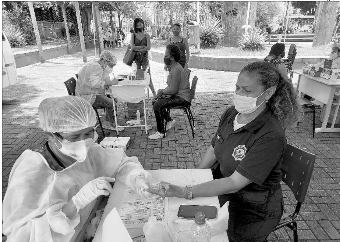
A semana foi de centenas de testagens na Praça Zé Garoto, no centro de São Gonçalo, para tentar conter uma segunda onda

Com uma estrutura ampla e instalada em local aberto e sem aglomeração, a unidade de atendimento a partir de hoje será responsável pela realização dos testes rápidos deixando, assim, o Centro de Triagem ao Coronavírus, ao lado da praça, exclusivamente para os testes de sorologia e swab e atendimento