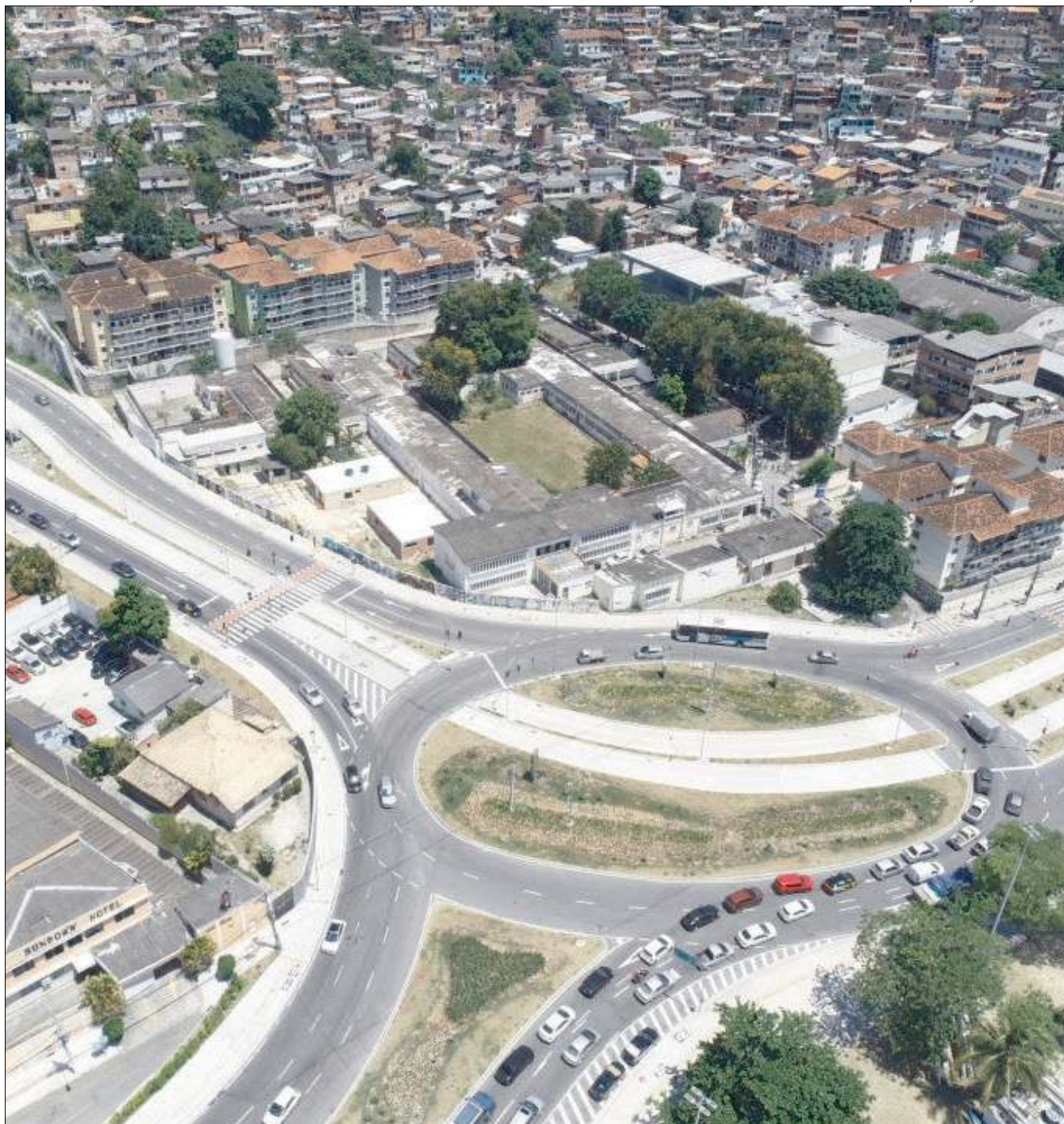
Com importantes avanços no campo da mobilidade urbana, a cidade de Niterói segue com projetos no setor para os próximos anos