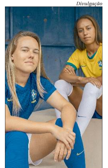
A Seleção Brasileira feminina agora possui uniforme próprio

Segundo estimativas de especialistas, o patrimônio do campeão do mundo com a seleção argentina em 1986 seria composto por propriedades, veículos de luxo, investimentos e joias espalhadas pelos países nos quais jogou e treinou durante a carreira: Argentina, Espanha, Itália, Emirados Árabes Unidos, Belarus e México. ■