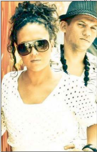
Grupo Sandália de Prata faz uma live cheia de swing, às 19h