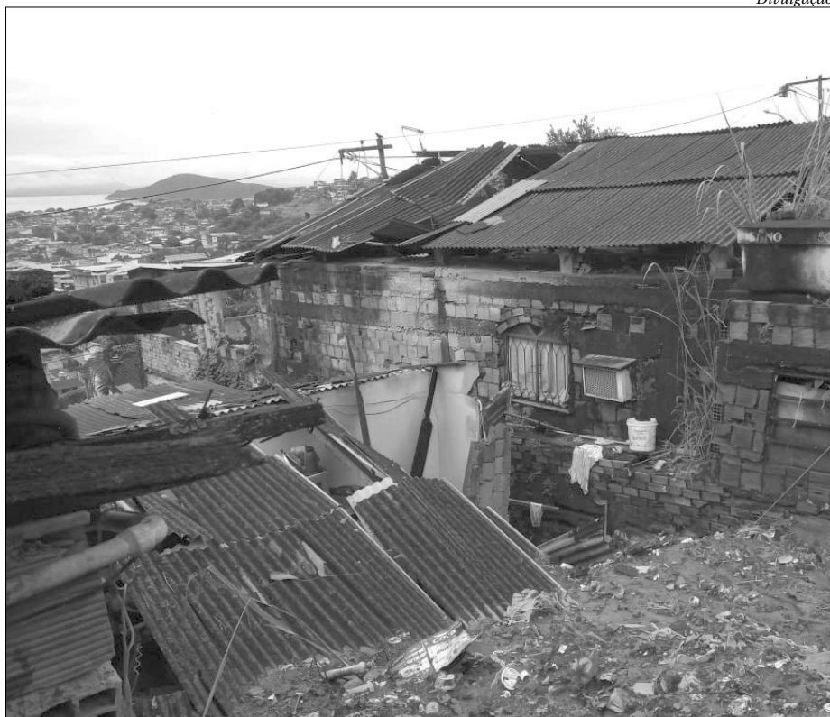
Acidente causado pelas chuvas ocorreu no morro do Feijão, no bairro Paraíso

A chuva começou a cair na cidade na noite de quarta-feira (9), permanecendo durante quase toda a madrugada de quinta. Na parte da manhã ainda era possível notar pontos de alagamento. Um dos bairros atingidos foi o Paraíso, onde fica o morro do Feijão,