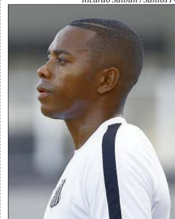
O atacante Robinho foi condenado por estupro coletivo em 2013 na Itália