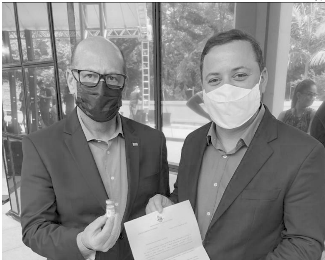
O presidente do Instituto Butantan, Dimas Covas, e o prefeito de Niterói, Rodrigo Neves, fechando acordo em São Paulo

A Prefeitura de Niterói fará o investimento de R$ 57 milhões no projeto de imunização, ao custo de 10 dólares por dose. Com recursos próprios para a aquisição da vacina, Niterói é a única cidade do estado do Rio, entre as 12 do país, a testar a fase 3 da vacina Coronavac, em parceria com o Instituto Butantan e a Fiocruz. Além disso, segundo o prefeito Rodrigo Neves, Niterói tem a maior cobertura de atenção básica da saúde