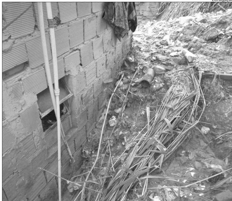
Várias casas desabaram na comunidade, deixando famílias desabrigadas

em casa por conta do volume das enchentes e, além dos bairros já citados, pontos do Porto Novo também ficaram debaixo d'água após a cheia do Rio Marimbondo. ■