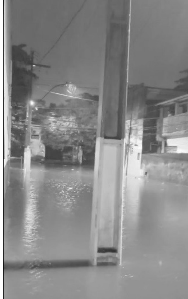
O bairro do Barreto foi um dos mais castigados pelo volume de água

Em São João de Meriti, as ruas ficaram inundadas com a grande quantidade de chuva e a cidade está em estado de mobilização, pois a previsão do tempo indica que ainda pode chover forte na região, situação equivalente a Belford Roxo, onde as ruas também alagaram e, segundo moradores, o problema acontece todas as vezes que chove forte na cidade. (Com Agência Brasil). ■