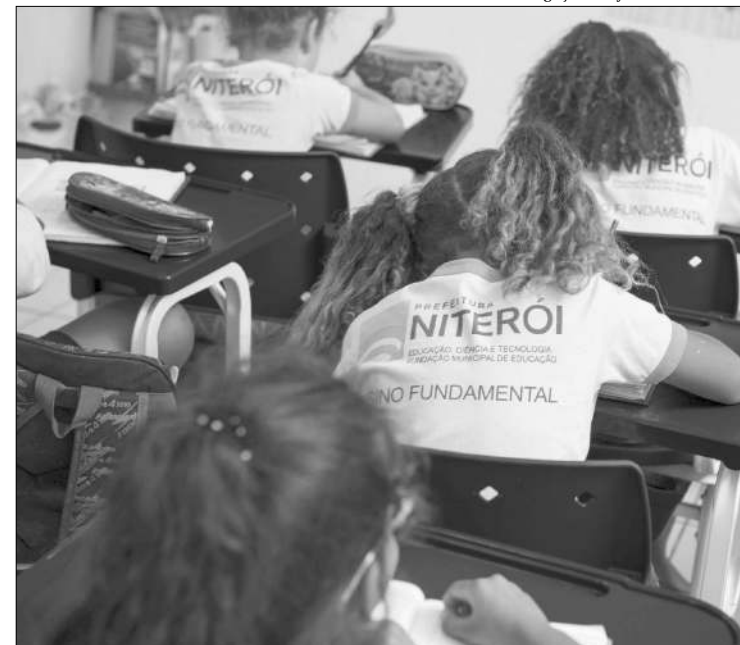
Educação espera recuperar o tempo perdido com a pandemia em 2020

O processo de matrícula se dá em três etapas: a primeira é destinada aos candidatos para vagas de todos os anos de escolaridade do ensino fundamental, depois vêm os candidatos para vagas na educação infantil e, por último, os candidatos para vagas remanescentes de todos os anos ofertados pela rede municipal. Essa terceira etapa está prevista para 18 a 24 de fevereiro de 2021. ■