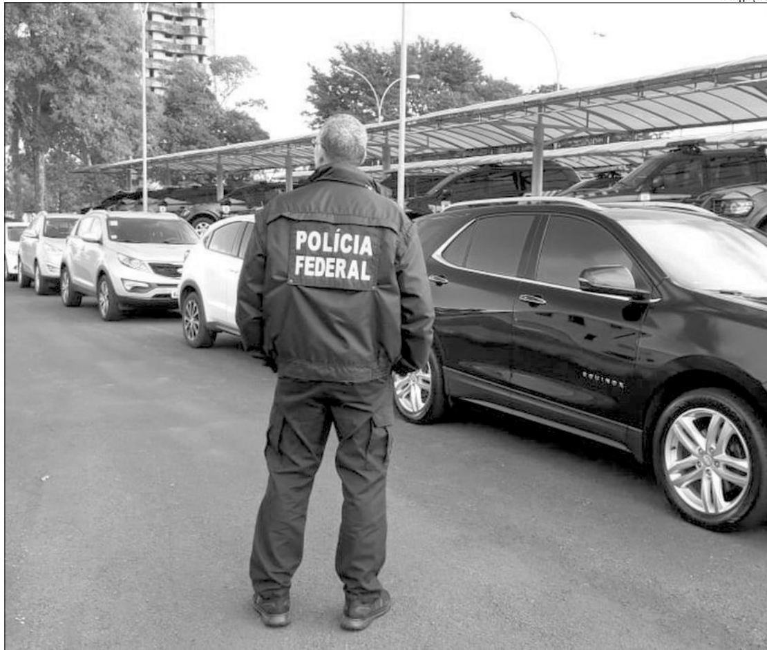
Segundo a PF, a estratégia coordenada já detectou o cadastramento de mais de 3,82 milhões de pedidos irregulares

Investigação abrange 14 estados. Há 42 mandados de busca e apreensão