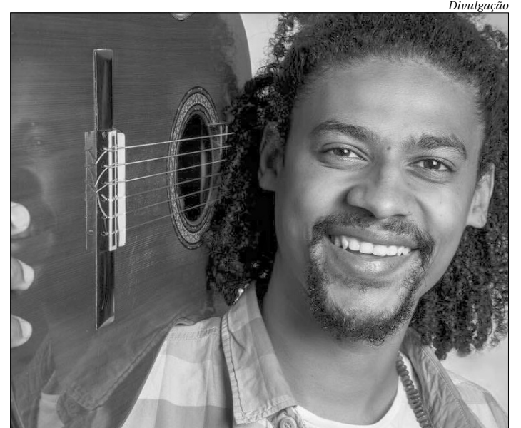
Músico apresenta canções autorias e de outros artistas no Municipal

O teatro funcionará com 30% da capacidade. Os assentos das cadeiras ficarão isolados para que haja o distanciamento de 2 metros entre cada espectador, entre outras medidas. O valor arrecadado com a bilheteria é revertido ao artista. Ingressos poderão ser comprados somente online, no site de vendas da Sympla. R$ 30 (inteira).