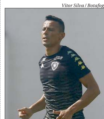
Vitor Silva / Botafogo