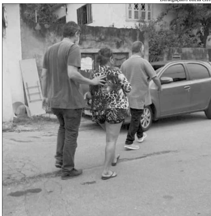
Mulher era investigada por crimes na capital, Nova Iguaçu e Caxias