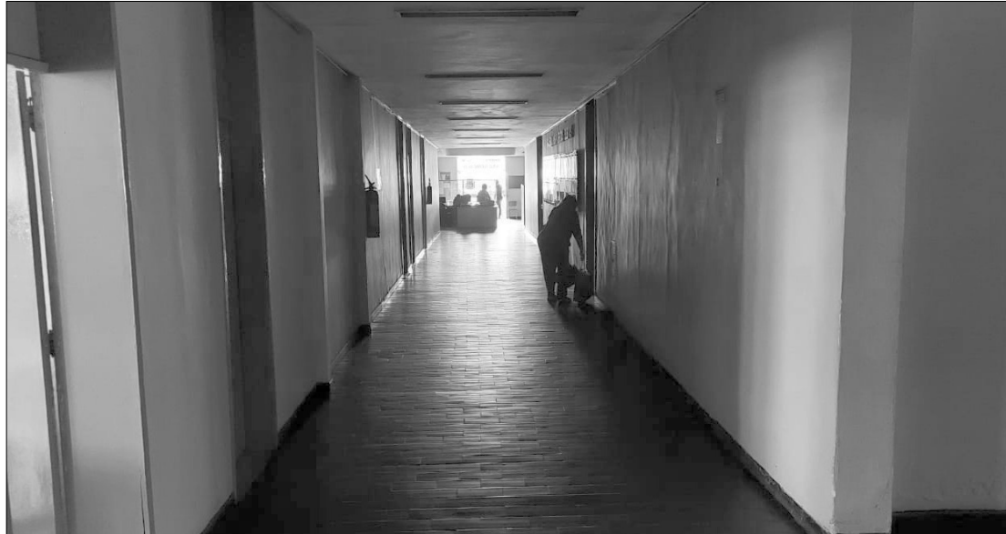
A ausência de energia comprometeu ontem o trabalho em alguns setores da Prefeitura de São Gonçalo

De acordo com a funcionária, a suspensão do expediente ocorreu por volta das 10h, uma hora após seu início, devido a impossibilidade de trabalho sem ener-