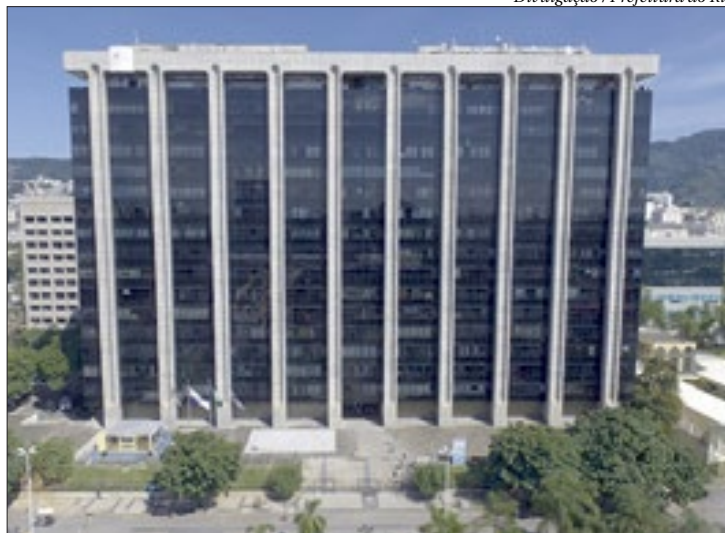
Se não cumprir determinações, multa diária da Prefeitura será de R$ 50 mil

A prefeitura comunicou, em nota, que vem monitorando os casos de coronavírus e que cancelou o