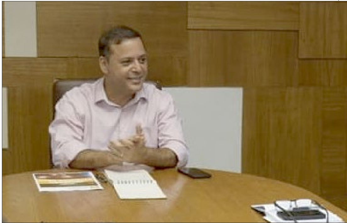
Prefeito de Niterói foi denunciado com mais oito pessoas por suspeita de participação em esquema de corrupção

O MPF também observou que houve pagamentos indevidos a conselheiros