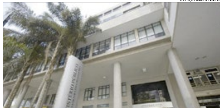
MPRJ investiga quadrilha que comercializa irregularmente combustível