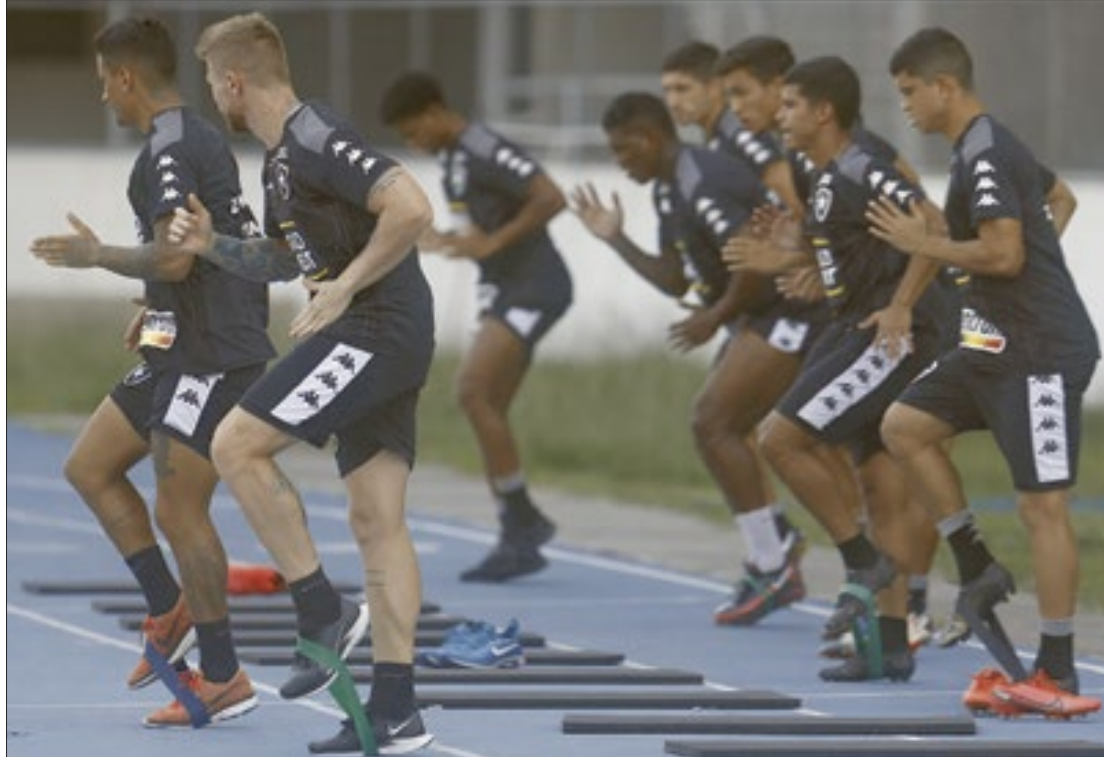
Jogadores do Botafogo treinaram forte durante a semana para o importante jogo desta noite no Couto Pereira