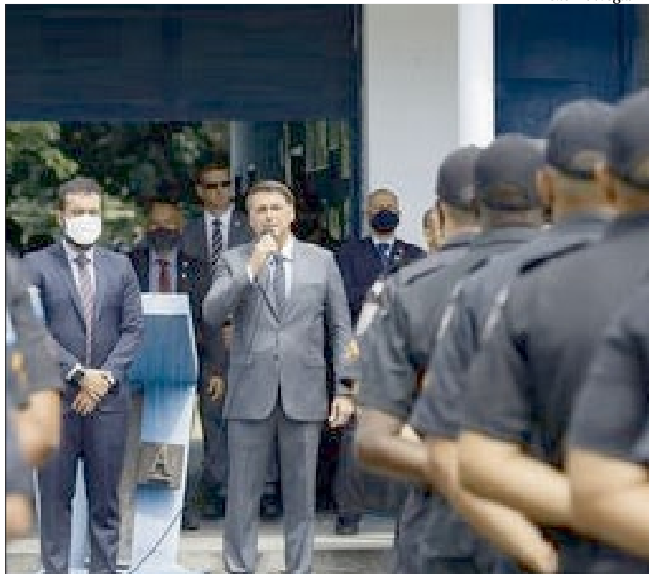
Jair Bolsonaro, ao lado do governador em exercício, discursou na cerimônia

Estiveram presentes o governador do Rio de Janeiro, Cláudio Castro; o ministro-chefe da Casa Civil, general Braga Neto; o ministro do Meio Ambiente, Ricardo Salles; e o senador Flávio Bolso-