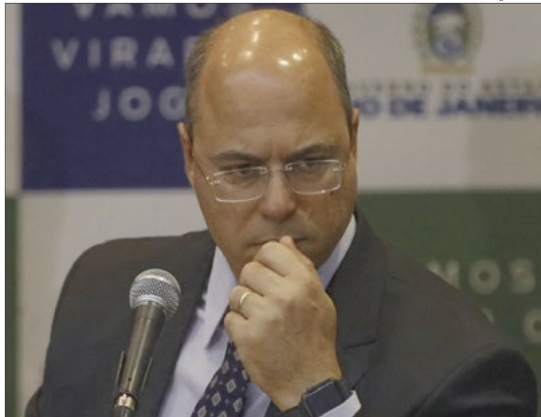
Governador afastado ganhou mais tempo para enfrentar o interrogatório no Tribunal Especial Misto, no fim do mês