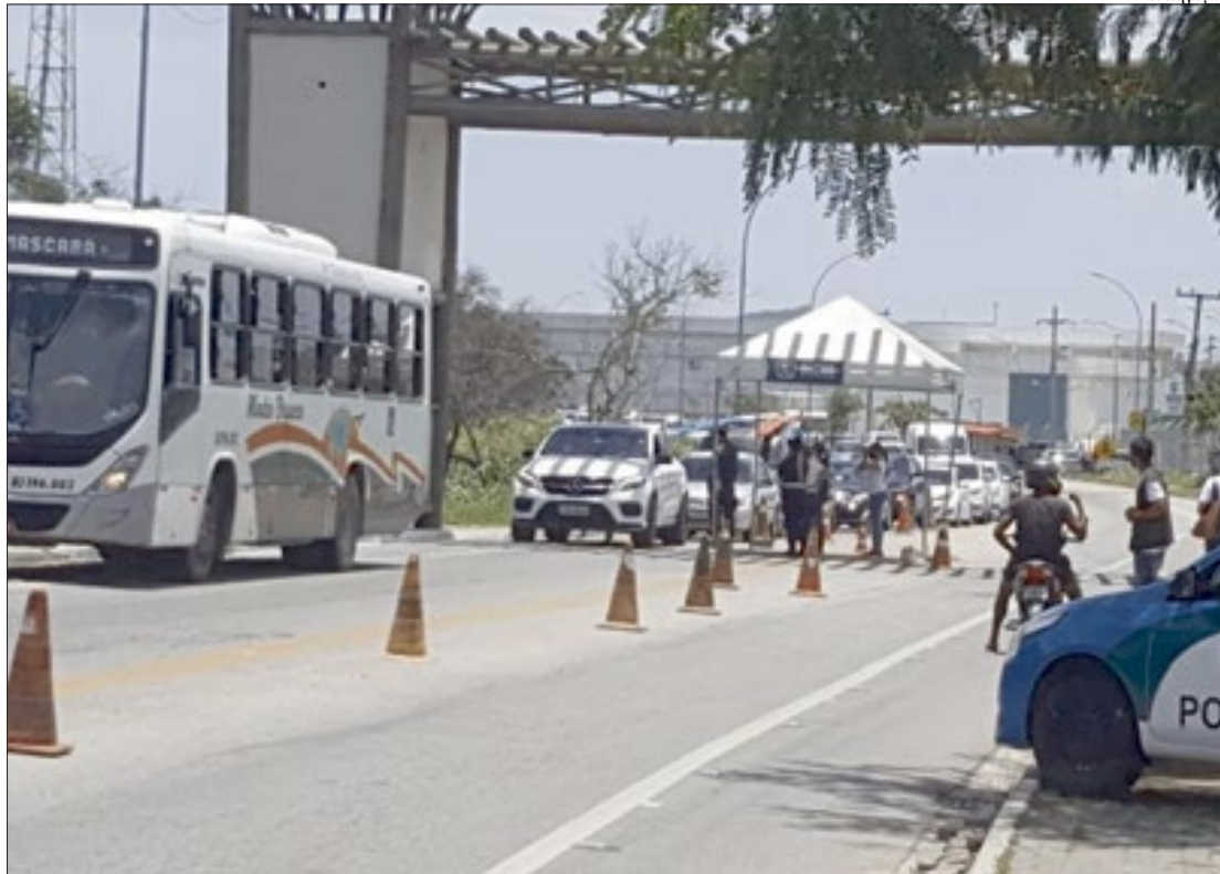
Na manhã de ontem, ainda houve confusão. Tribunal de Justiça reverteu fechamento total do turismo na cidade