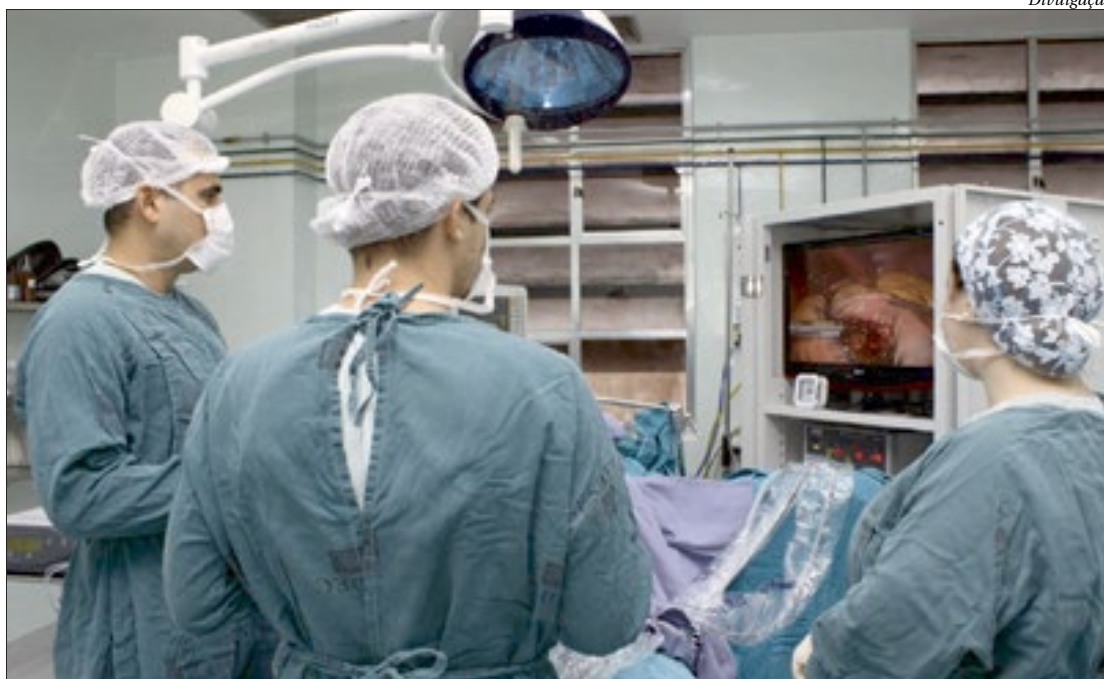
Objetivo é redirecionar profissionais de saúde, leitos e insumos para o combate à pandemia de covid-19

Apenas as oncológicas e cardiovasculares, de urgência, poderão ser realizadas