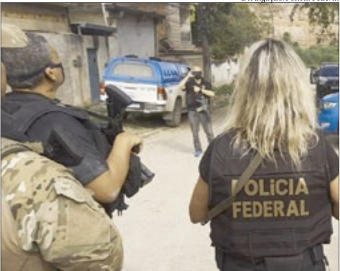
Operação Luxúria caçou suspeitos de usar imagens de abuso sexual de crianças