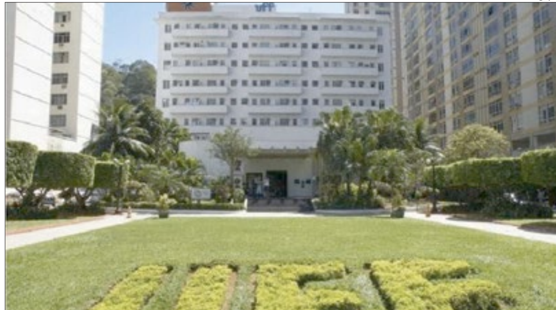
Recursos serão investidos em projetos em várias áreas, apresentados por grupo de pesquisadores e estudantes