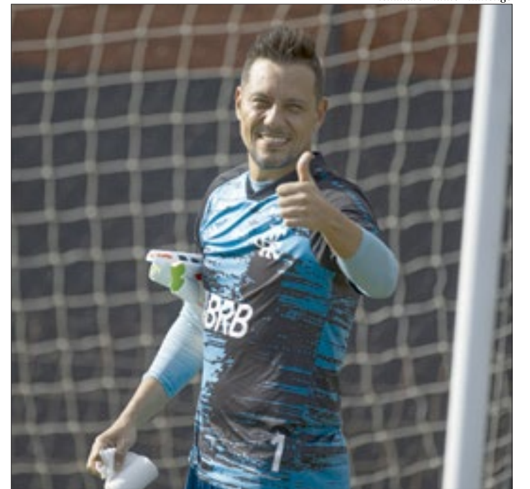
Diego Alves assinou ontem à tarde seu novo contrato com o Flamengo