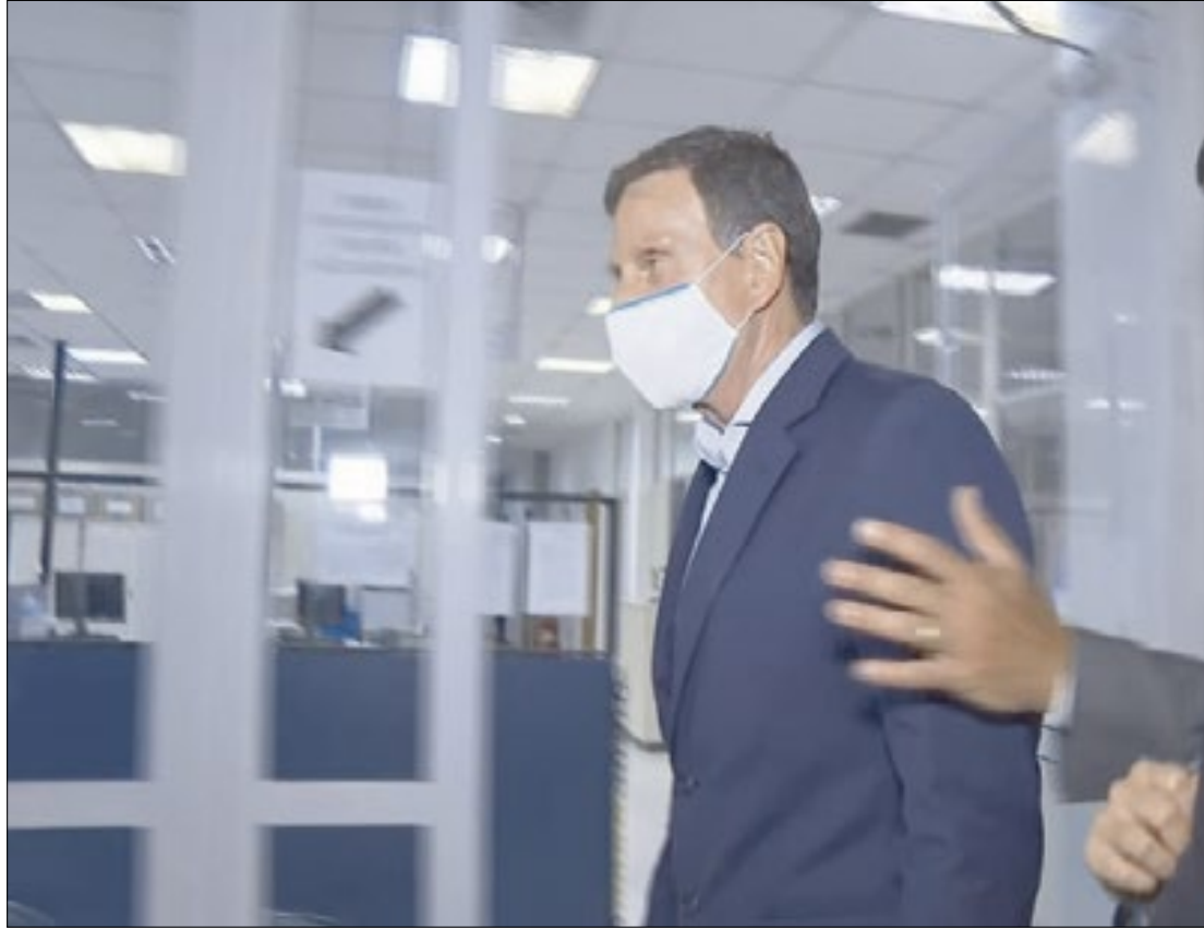
Na chegada à Cidade da Polícia, Marcelo Crivella declarou que está sendo vítima de perseguição política

Além deles, o ex-senador Eduardo Lopes também é um dos alvos da operação, mas não foi encontrado em sua casa no Rio. O político deverá se apresentar à polícia em Belém, para onde