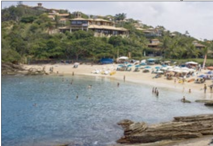
Lockdown em Búzios foi substituído por restrições não tão radicais

A prefeitura Búzios proibiu a realização de festas, shows e eventos privados com a cobrança de ingressos. Em função do aumento do número de pessoas infectadas pelo coronavírus, a prefeitura publicou o Decreto 1.536, que mantém o estado de calamidade pública e proíbe a realização de eventos públicos e privados na cidade.