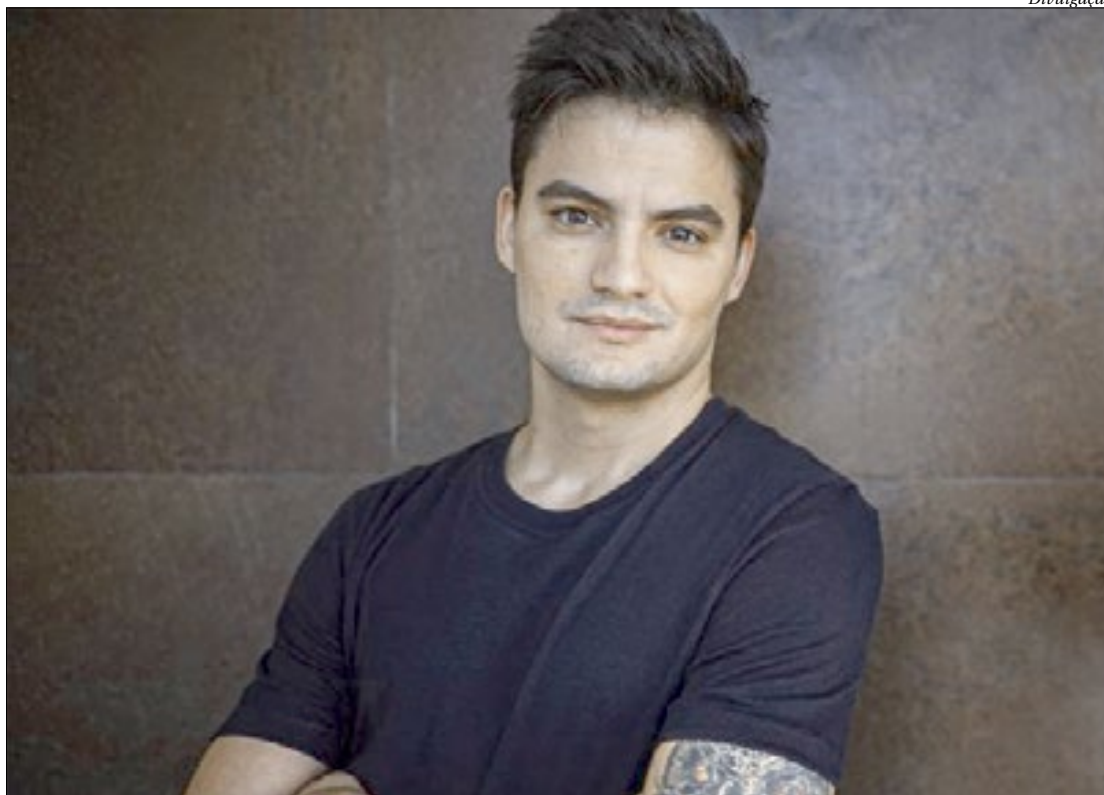
Youtuber irá gravar vídeos em seu canal sobre classificação indicativa no acesso à internet para crianças e adolescentes

comprometeu a participar de reuniões e audiências públicas organizadas pelo MPRJ para viabilizar a implementação de mecanismos de controle e de autoclassificação indicativa por parte de produtores de conteúdo e providências de nesse sentido, por parte dos provedores de aplicativos, para que os vídeos sejam disponibilizados em suas respectivas plataformas.