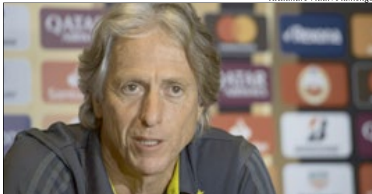
Benfica, de Jorge Jesus, joga hoje a final da Supertaça de Portugal contra o Porto

Na entrevista coletiva concedida ontem, visando a decisão da Supertaça de Portugal, contra o Porto, o técnico Jorge Jesus, do Benfica, declarou que o futebol brasileiro é o mais evoluído do mundo, comparando até mesmo o Brasileiro com o Campeonato Inglês.