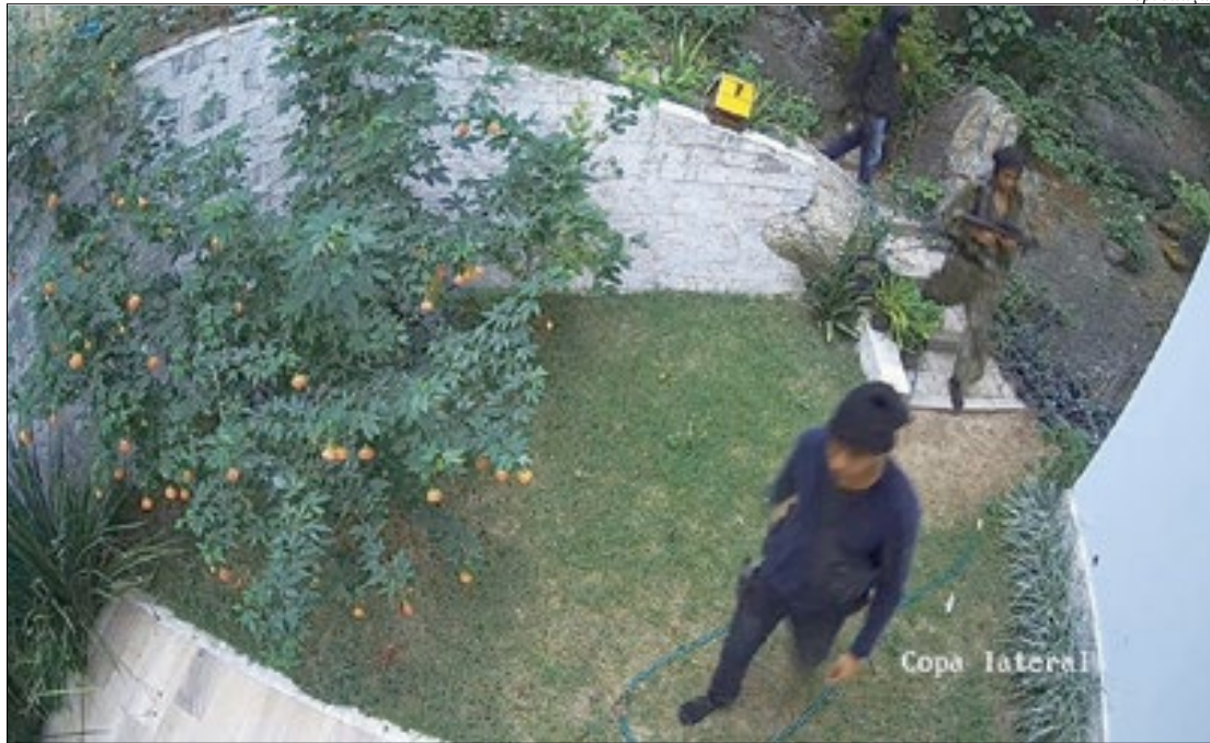
Foram expedidos mais de 60 mandados de prisão e mais de 50 de busca e apreensão em Niterói, SG e Saquarema

Foram expedidos para a ação, mais de 60 mandados de prisão e mais de 50 de busca e apreensão em 13 comunidades nas cidades de Niterói, São Gonçalo e Saquarema. Entre os que tiveram a prisão decretada, mais de 20 suspeitos de integrar a quadrilha já haviam sido presos em outras operações. Até o fechamento desta edição, seis pessoas foram presas.