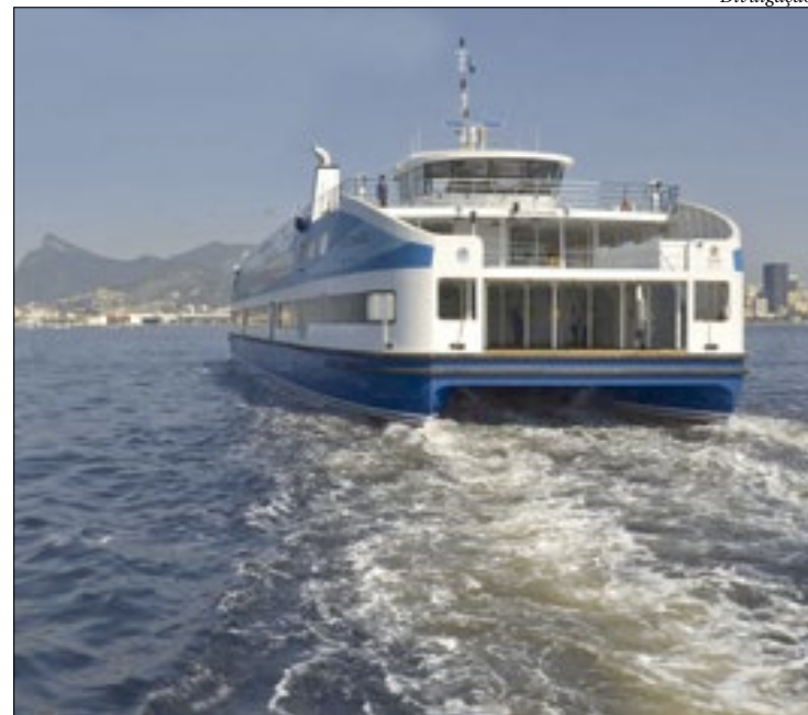
Para evitar aglomerações, o número de passageiros será limitado

Desde o início da pandemia, a empresa adotou procedimentos operacionais e de informação, além de intensificar a limpeza e a higienização das embarcações e estações. Sendo assim, a concessionária vem promovendo a desinfecção diária e constante de suas dependências. A fim de evitar a propagação do vírus no transporte aquaviário, colabo-