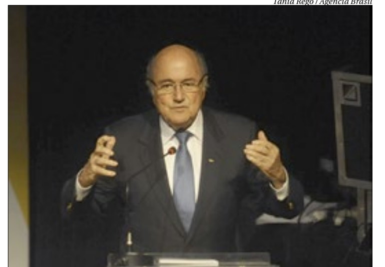
Segundo a Fifa, Blatter gastou quantia milionária em prédio não construído

“Isso é meio bilhão de francos suíços que poderiam, e