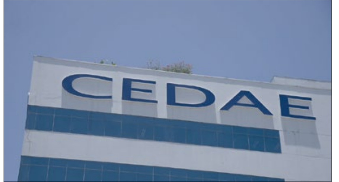
Cedae: problema na elevatória do Rio Comprido afetou abastecimento em várias regiões do Rio e da Baixada

Ao todo, 25 empregados da companhia participaram da operação. O motor de 35 toneladas foi instalado na galeria de bombas da elevatória, localizada a 64 metros de profundidade. A unidade tem a função de bombear água a uma altura de até 120 metros (equivalente a um prédio de