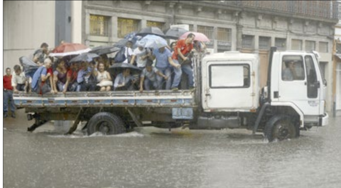
MPRJ cobra do Estado e da capital ações de combate ao aquecimento global e suas consequências

Para o MPRJ, esses riscos se tornam ainda mais preocupantes em áreas que não possuem infraestrutura e serviços básicos adequados, como no caso das comunidades na cidade do Rio, visto que eventos climáticos podem danificar estruturas urbanas e causar desastres diversos. No documento divulgado pelo MPRJ, consta que as cidades brasileiras não possuem, atualmente,