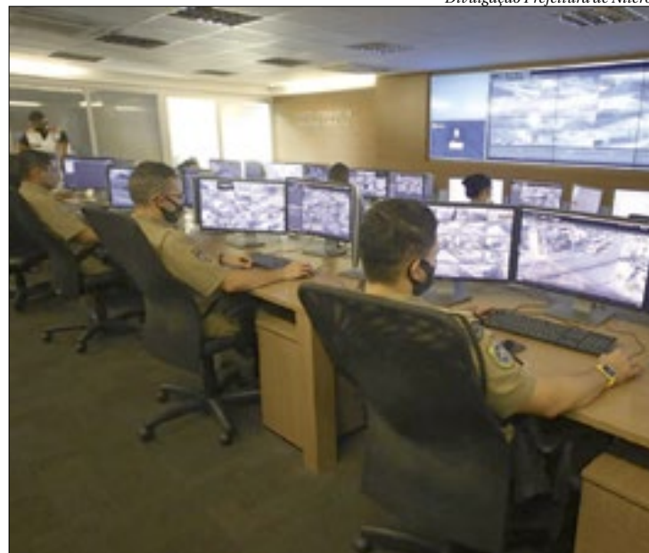
O Cisp tem desempenhado um trabalho fundamental no combate à criminalidade

Através do Centro Integrado de Segurança Pública (Cisp), Niterói tem hoje monitoramento durante 24 horas integrando as forças de segurança em tempo real. A Prefeitura de Niterói disponibiliza 522 câmeras de monitoramento, além de 10 portais de segurança e das 70 câmeras de inteligência artificial que fazem o cercamento eletrônico. Cada vez que um veículo em situação irregular é identificado pelas câmeras inteligentes do Portal de Segurança, um alerta soa no Cisp.