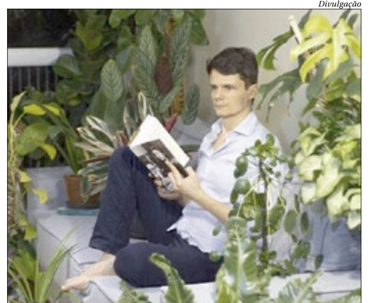
Espectáculo, ao vivo, retoma temporada digital neste sábado, às 20h

A temporada vai até 31 de janeiro. Haverá ainda palestras, bate-papos e sessões em Libras. Ingressos gratuitos pelo site: https://www.sympla.com.br .