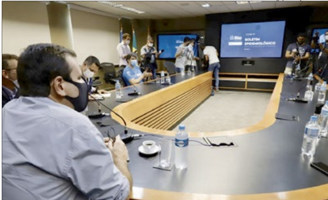
O prefeito Eduardo Paes apresentou ontem o mapa de risco da cidade. Divulgação acontecerá toda sexta-feira

“A cidade não é uma coisa só, não dá para imaginar que a realidade de Santa Cruz é a mesma realidade do Leblon”, defendeu o prefeito, que pediu que a população nas áreas de risco alto colabore para que a situação não se agrave. “A última coisa que eu quero é meter na vida dos indivíduos,