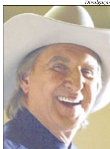
O cantor e compositor sertanejo é uma das atrações da “Virada SP”

O cantor e compositor sertanejo Sérgio Reis é uma das atrações da “Virada SP Online” que acontece neste sábado, a partir das 12h, gratuitamente pela plataforma #CulturaEmCasa. Clássicos como “O Menino da Porteira”, “Panela Velha” e “Deus e Eu no Sertão” devem estar presentes no repertório do artista. Também está programado na “Virada” um sarau com a autora Aline Bei e uma apresentação do grupo Teatro Mágico.