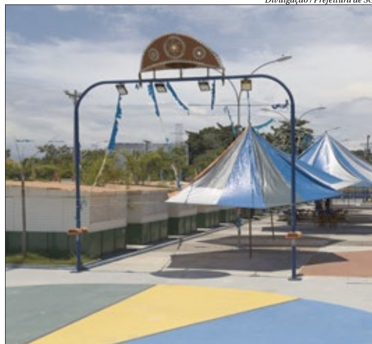
Tótons de álcool em gel foram disponibilizados pelo Centro de Tradições

Obedecendo aos protocolos de segurança para evitar contágio da Covid-19, será obrigatório o uso de máscaras e distanciamento social. Tótons de álcool em gel estão