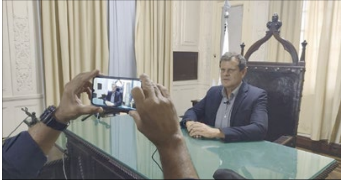
Coronel Salema: emendas do deputado destinaram R$ 300 mil para área de segurança pública do município

Uma das emendas de prioridade pede o reforço de investimentos para tornar realidade a implantação da linha aquaviária São Gonçalo x Praça XV, enquanto outra sugere a criação de uma Unidade de Pronto Atendimento (UPA) 24 horas