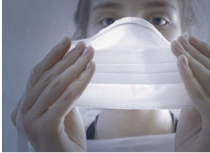
Uso de máscara para proteção é indispensável contra o novo coronavírus

casos ativos em acompanhamento por profissionais de saúde, e 7.114.474 pessoas já se recuperaram da doença.