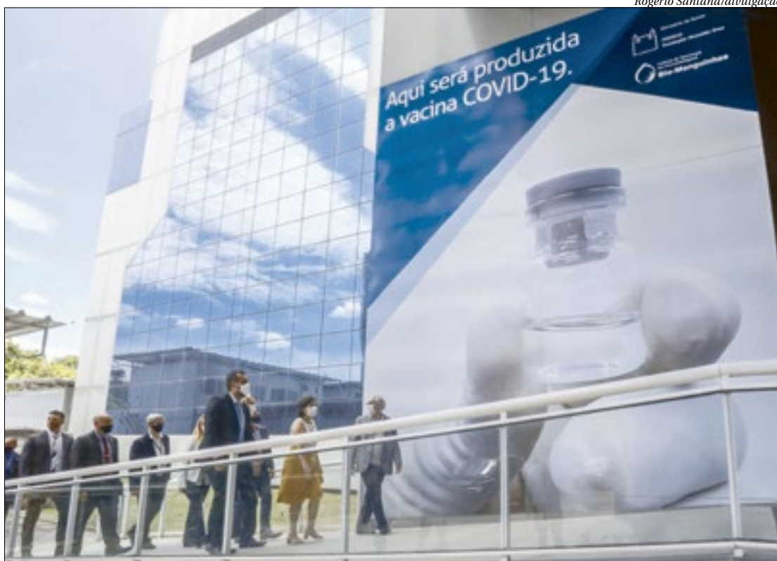
Governador em exercício, Cláudio Castro, visita ao centro de diagnóstico de Covid e Bio-Manguinhos - Fiocruz

“Essa visita vem coroar nossa parceria. Estamos muito perto da população fluminense começar a ser vacinada. Fizemos nosso papel e estamos abastecendo de seringa, agulhas e locais para armazenamento aguardando a chegada da vacina. Como anunciado pelo Ministério da Saúde, há uma possibilidade de isso acontecer no próximo