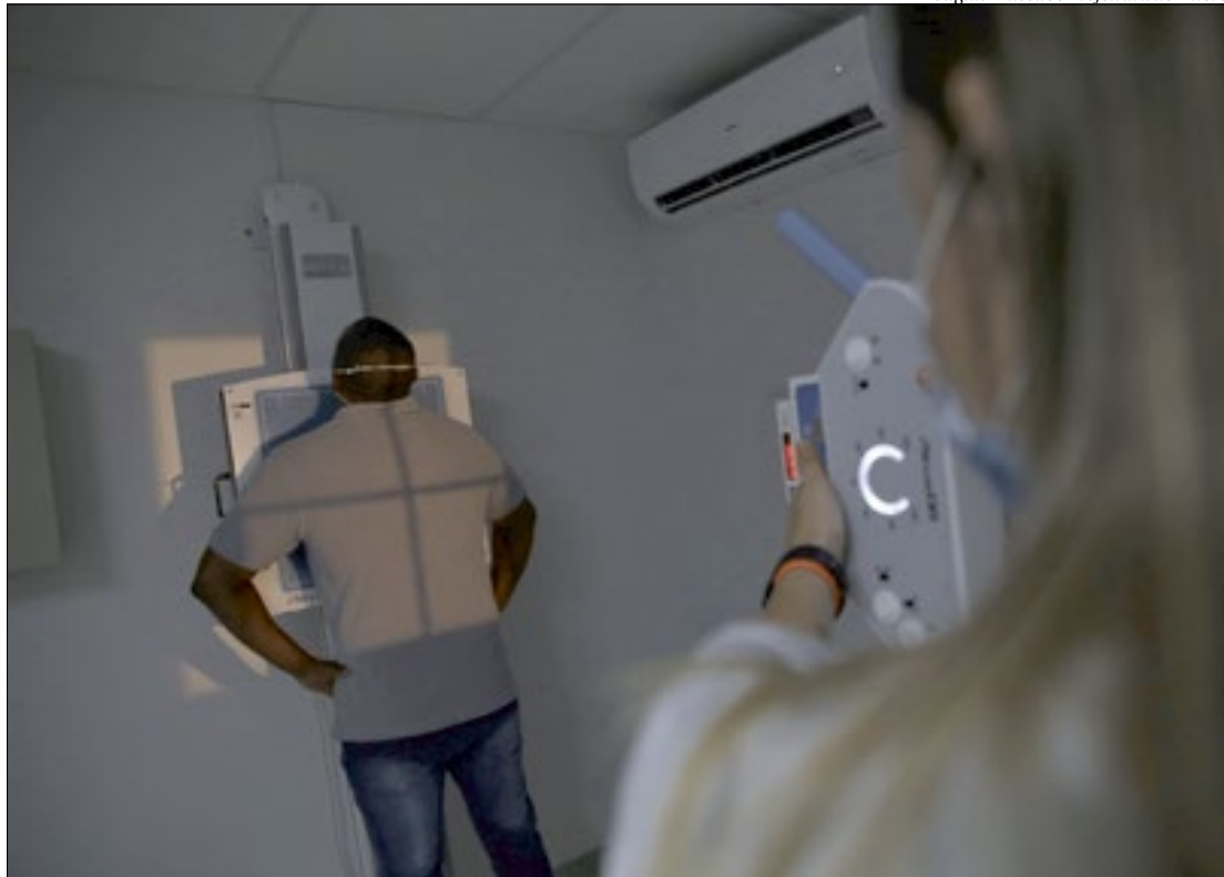
O CDI possui aparelhos como tomografia, ultrassonografia, ecocardiografia, colonoscopia e raio-x digital

“A abertura deste Centro de Imagens público reforçou a retaguarda de exames e o atendimento à população. Conseguimos ampliar a oferta, garantindo maior rapidez ao diagnóstico e, consequentemente, um tratamento muito mais adequado ao paciente. Hoje o espaço é referência