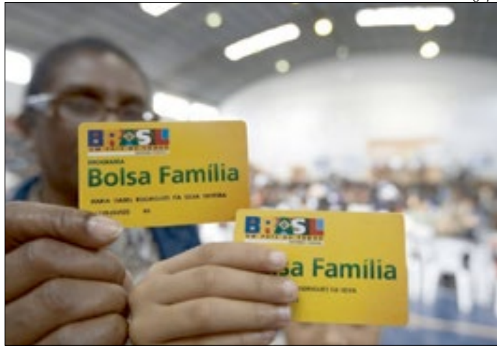
Uma análise do TSE apontou que mais de 31 mil pessoas estão nesta situação

Já as famílias que tiverem integrante identificado como doador de recursos financeiros a campanhas eleitorais em montante per capita mensal superior a meio salário mínimo e inferior a dois salários mínimos ou que tenham