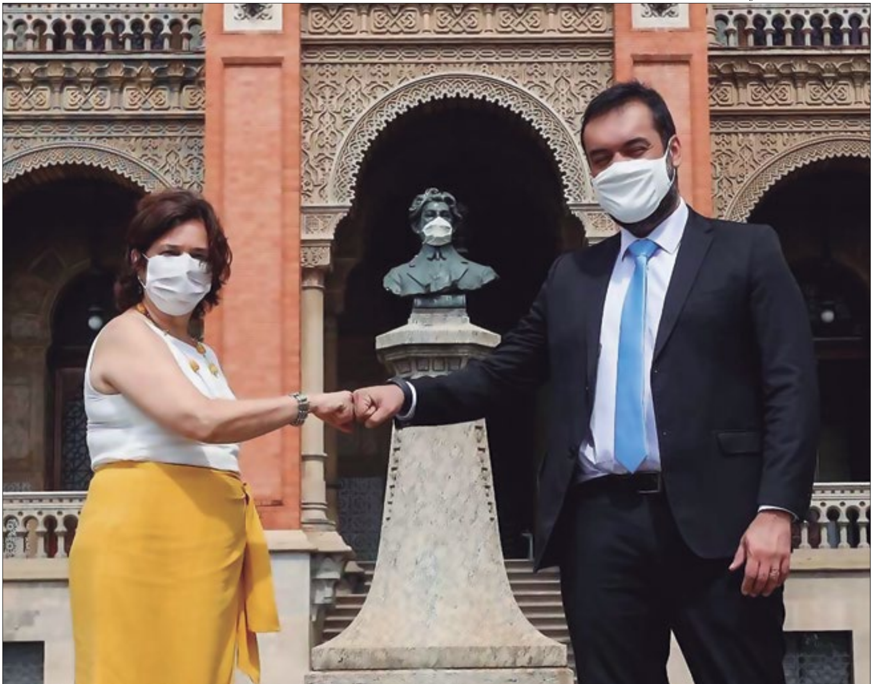
A presidente da Fiocruz, Nísia Trindade, e o governador em exercício, Cláudio Castro, celebram a parceria em prol da saúde e da vida. Ontem, ele visitou o centro de produção de vacinas