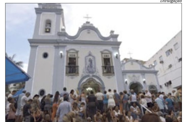
Capela Nossa Senhora da Conceição de Niterói completa 350 anos em 2021