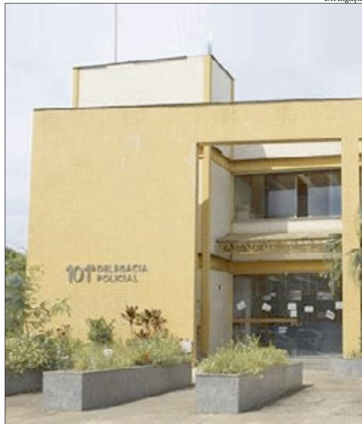
A ocorrência foi registrada na 101ª DP (Pinheiral), onde o caso será investigado

De imediato, os agentes realizaram diversas diligências e a mãe das crianças foi identificada e capturada algumas horas depois. Em sede policial, a indicada alegou que durante a noite havia saído para passear com seus três filhos e por volta das 23h, os deixou na praça, sob a supervisão de uma mulher desconhecida que lá esta-