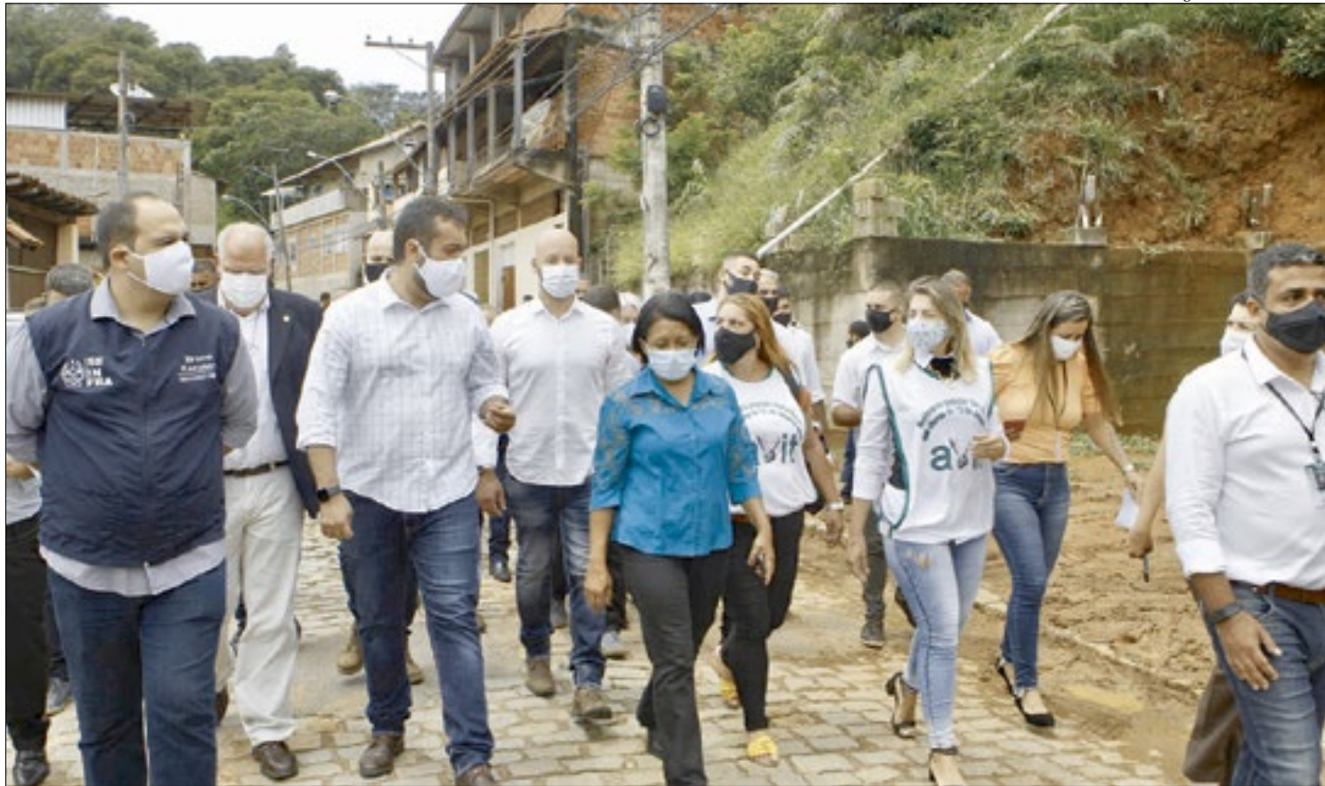
Ao lado de seus secretários, o governador visitou obras e lançou programa de limpeza de três rios em Teresópolis: Paquequer, Príncipe e Córrego Imbuí

“Estamos prevenindo novos desastres e garantindo a segurança dos moradores da Serra com obras em locais onde há risco de desmoronamento. Outras intervenções serão reforçadas por meio do Plano de Contingência para as Chuvas de Verão, que aten-