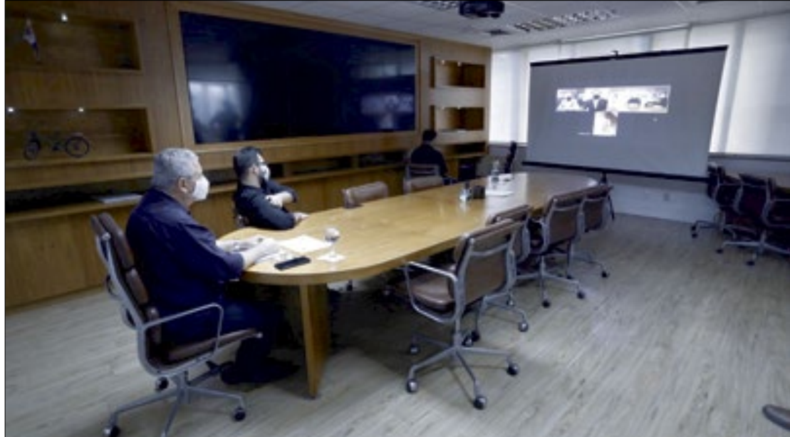
O prefeito de Niterói, Axel Graef, conversou por videoconferência com o governador de São Paulo, João Doria

O governador de São Paulo informou que a compra da Coronavac não será possível, uma vez que foi assinado contrato de exclusividade entre o Instituto Butantan e o Ministério da Saúde. Com isso, o prefeito Axel Graef informou que Niterói vai integrar o plano de imunização do Governo Federal, que promete vacinação simultânea em todo o País.