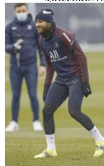
Neymar fez ontem seu primeiro treino sob o comando de Pochettino

Amanhã, ainda sem Neymar, o PSG disputa o Troféu dos Campeões (Supercopa Francesa) contra o Olympique de Marseille, no Estádio Bollaert-Delelis, na cidade de Lens, às 17h (horá-