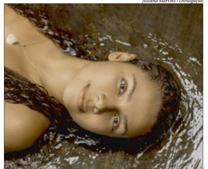
Clipe estreia no canal da artista capixaba: inspiração num amor de verão