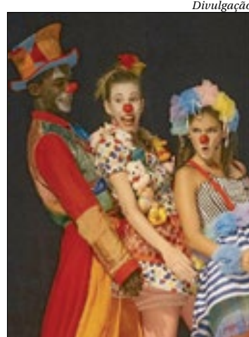
"Lili, Uma História de Circo" é um dos espetáculos em cartaz

Termina na quarta, a apresentação online e gratuita do Teatro On Demand para as crianças. Os espetáculos infantis "Lili, Uma História de Circo", "O Mundo Encantado Buarque de Holanda", "Nós de Borboletas" e "Pedro Malazarte e a Arara Gigante", que foram sucesso de público no palco do Teatro do Oi Futuro, podem ser assistidas através da plataforma digital do Oi Futuro ( https://oifuturo.org.br/teatro-on-demand/ ).