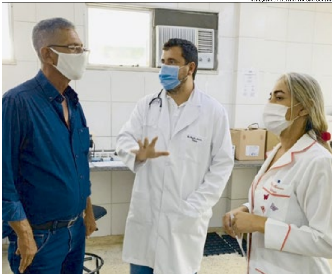
O prefeito Capitão Nelson reafirmou o seu compromisso com a saúde em visita ao Pronto-Socorro de São Gonçalo

“No PSC tivemos a oportunidade de entregar cinco cadeiras de transporte de pacientes de emergência para a melhoria do atendimento. Além disso, entregamos uma peça nova para a volta do