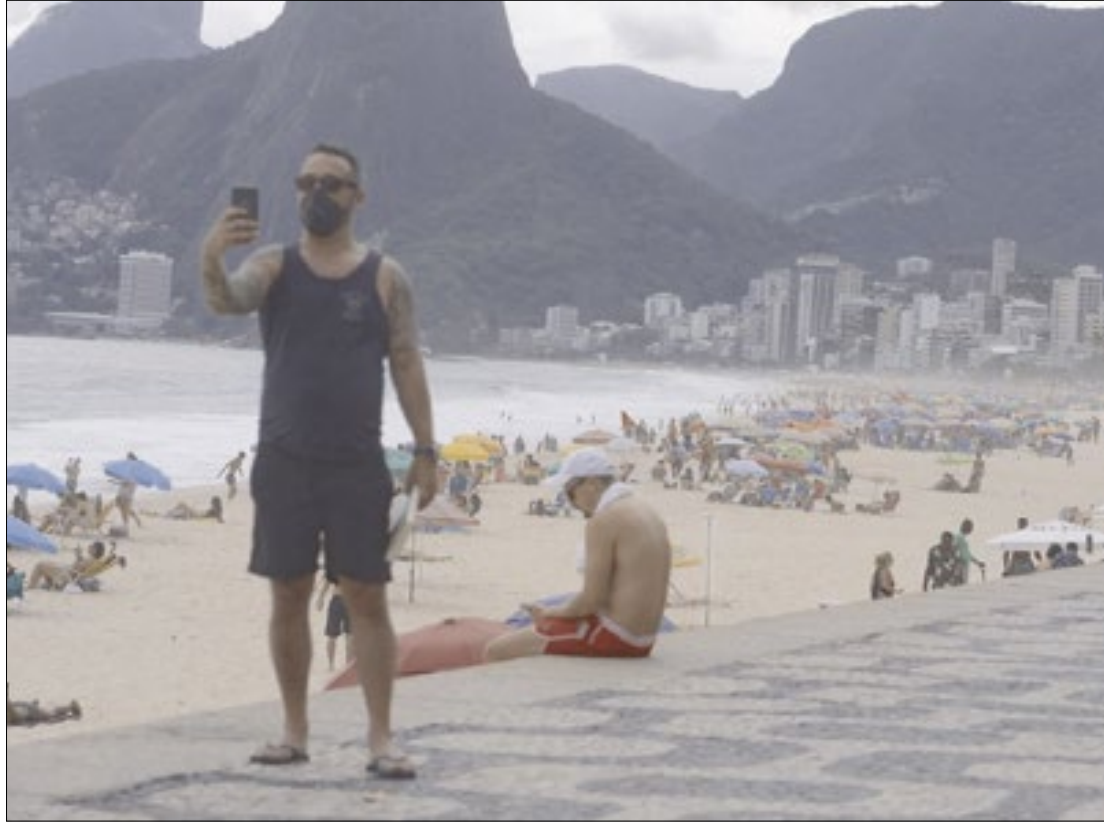
Praias em plena pandemia: os dias quentes no Rio são convite à aglomeração de pessoas, afirmam especialistas

Em geral, os registros de casos e mortes são menores aos domingos e nas segundas-feiras em razão da dificuldade de alimentação de dados pelas secretarias de Saúde aos fins de semana. Já às terças-feiras os totais tendem a ser maiores pelo acúmulo das informações de fim de semana que são enviadas