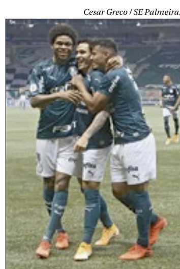
Cesar Greco / SE Palmeiras

Palmeiras está nas finais da Taça Libertadores e Copa do Brasil