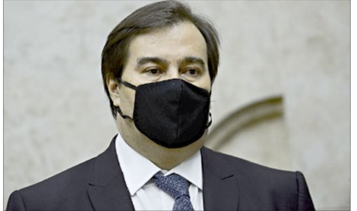
Rodrigo Maia afirmou que atraso se deve a razões técnicas. Ele diz que chineses querem atender os brasileiros

"O governo chinês vai trabalhar para acelerar a chegada desses insumos. O diálogo com o governo de São Paulo e o Instituto Butantan vai fazer com que a gente consiga avançar o mais rapidamente possível. A decisão do governo chinês é atender a população brasileira", destacou.