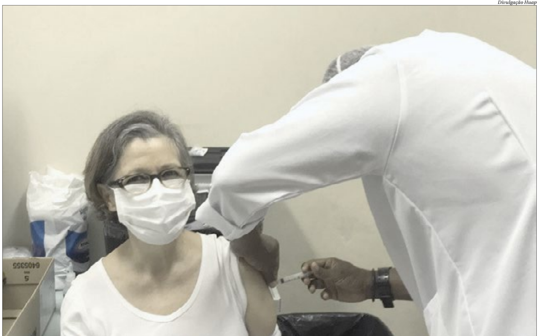
Primeira pessoa vacinada no Hospital Universitário Antônio Pedro é enfermeira da unidade há 38 anos. Unidade irá vacinar nesta etapa apenas os profissionais que atuam na linha de frente

(21) 2621-9955 comercial@ofluminense.com.br