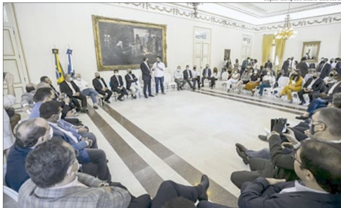
Estranho no ninho: candidato à presidência da Câmara Federal marca presença no evento realizado no Rio

“Tenho ampliado minhas idas à Brasília para viabilizar uma série de projetos de interesse do nosso estado junto ao Governo Federal, que tem sido um grande parceiro do Rio de Janeiro. E o apoio da nossa bancada tem sido fundamental. Foram importantes no apoio financeiro aos estados durante a pandemia e nas aprovações da Lei Aldir Blanc e do PLP