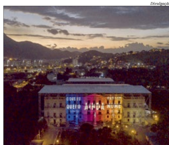
Festival Multiplicidade apresenta exibição de artista japonês na fachada

O evento será 100% digital e será transmitido pelo Youtube.