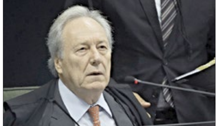
Ministro Lewandowski aguarda dados de vacina russa para tomar uma decisão

e está sendo utilizada em países como Argentina, Bolívia, Paraguai e Venezuela, argumentou o governo da Bahia. No Brasil, representantes da empresa União Química têm se reunido com técnicos da Anvisa para tentar dar prosseguimento ao processo de aprovação.