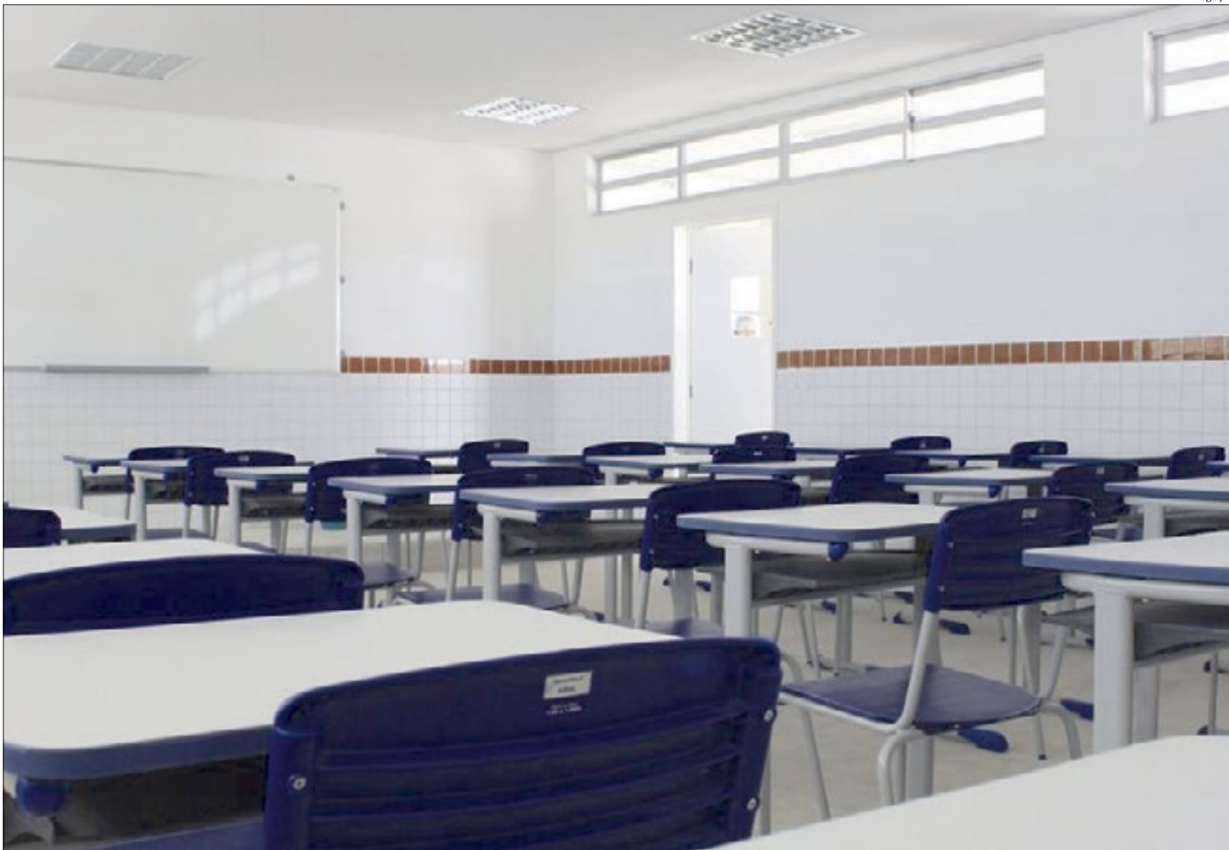
Escolas deverão funcionar de acordo com modelo de ensino híbrido, seguindo esquema de bandeiras e cumprindo todos os protocolos determinados pela Vigilância Sanitária