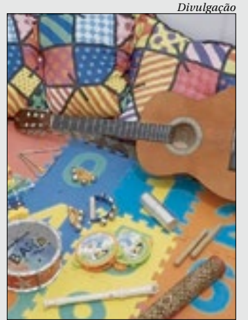
Projeto "O Azul Pintou a Arte" está com inscrições abertas