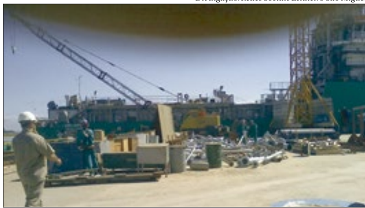
Reaquecimento do setor pode gerar empregos e melhorar a economia

Estrategicamente posicionado, São Gonçalo tem grande representatividade para o desenvolvimento econômico do Leste Fluminense. Para o Conleste, o reaquecimento dos estaleiros é um dos temas que o consórcio pretende potencializar, como forma de gerar empregos e melhorar a economia de toda a região. O tema que já