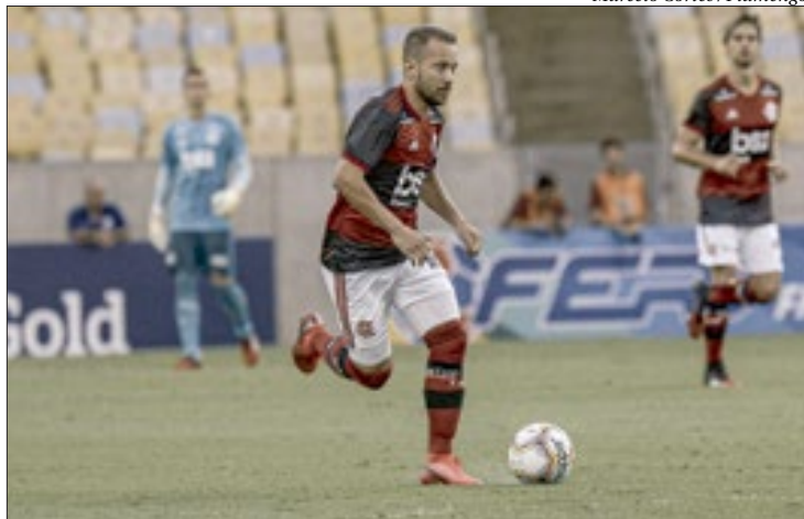
Éverton Ribeiro vem sendo criticado pelas suas últimas atuações no Flamengo

Éverton Ribeiro tem contrato com o Flamengo até o final de 2023. O meia chegou em 2017 e disputou 207 jogos, com marcou 32 gols.