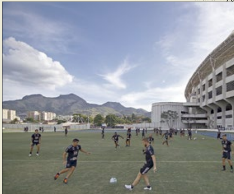
Elenco tenta esquecer os problemas financeiros e trabalha para tentar salvar o time