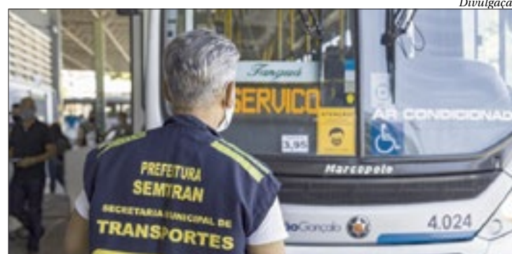
Itens essenciais e de segurança foram verificados na ação de fiscalização

O trabalho de vistoria avalia itens de segurança e itens necessários ao bom funcionamento do veículo, tais como