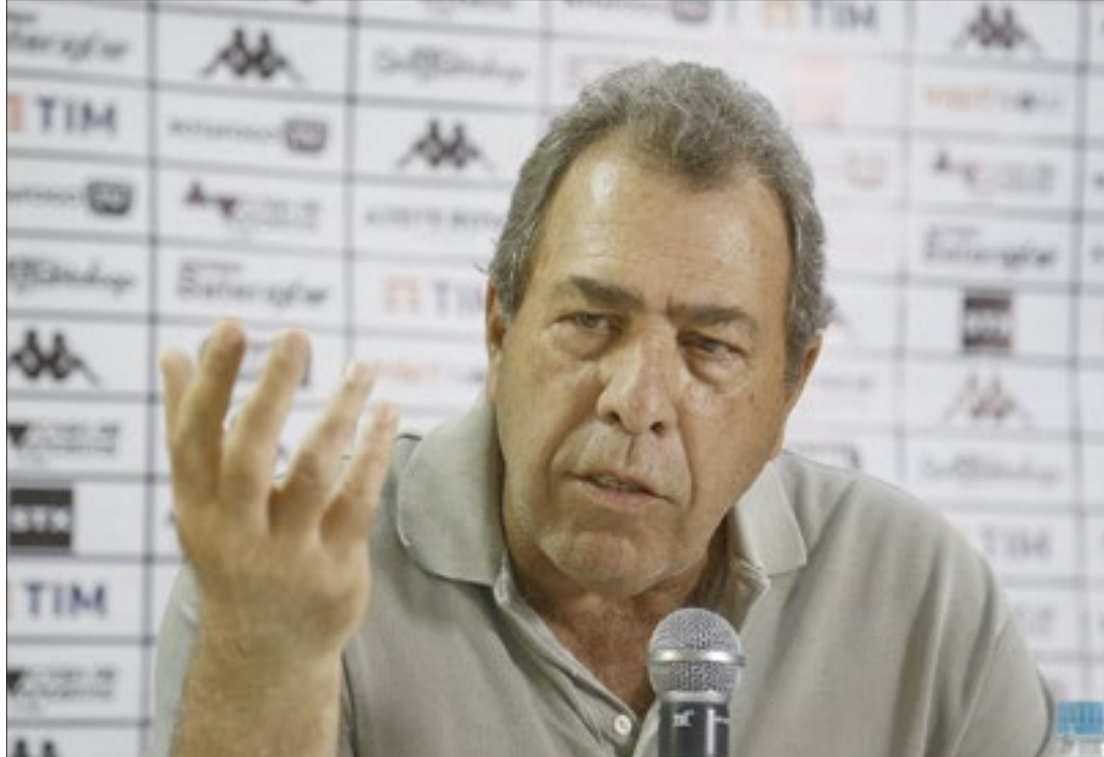
Montenegro participou da administração do futebol do Botafogo em 2020, sendo membro do extinto comitê executivo

A principal consequência do virtual rebaixamento da equipe será uma reformulação do futebol. Jogadores com salários mais altos, portanto, devem deixar o clube. No-