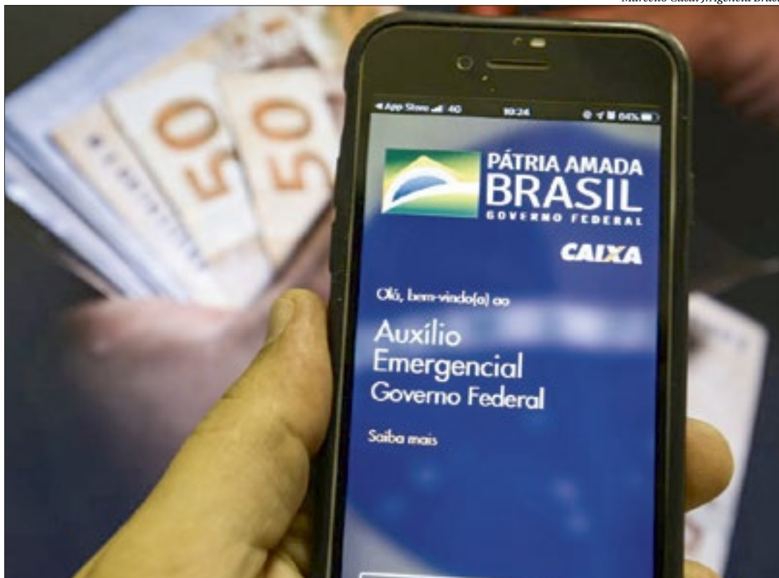
Os recursos serão depositados na poupança social digital da Caixa e já estarão disponíveis amanhã, dia 28

Os recursos serão depositados na poupança social digital da Caixa e já estarão