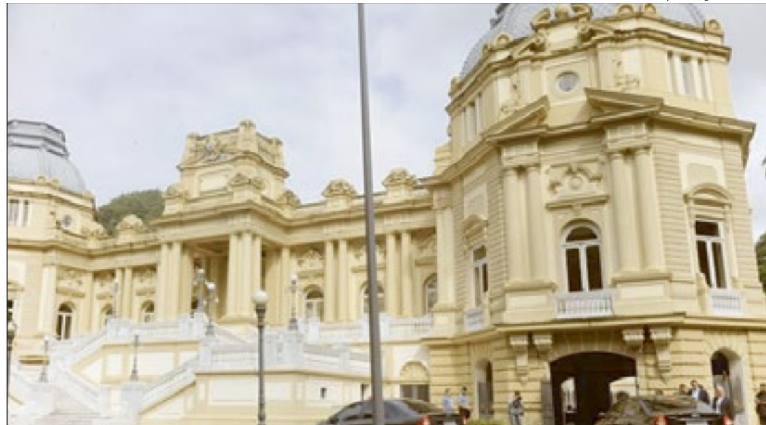
Oi corta internet do Palácio Guanabara alegando dívida de R$ 300 mil, mas a Justiça manda religar

Um contrato emergencial com a operadora de telefonia foi firmado em junho do ano passado, e tinha validade até o dia 14 de dezembro de 2020. Mas segundo a PGE, uma sindicância interna teria identificado in-