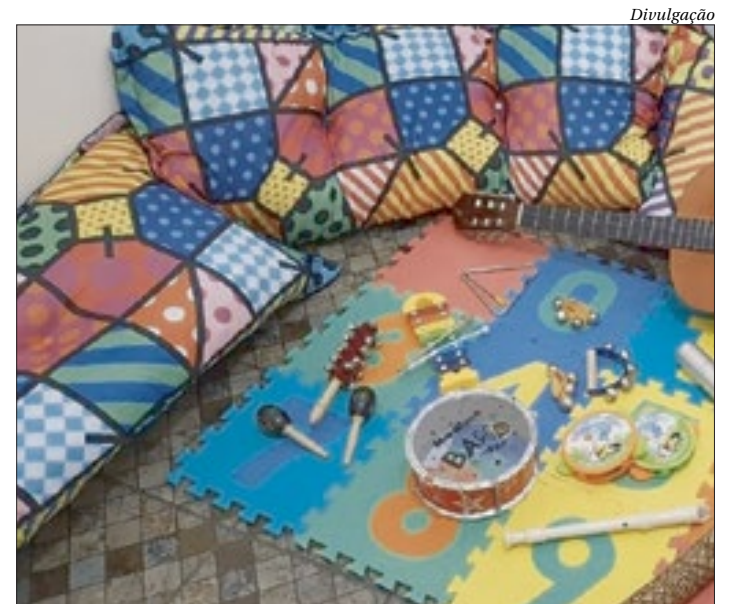
"O Azul Pintou a Arte", do Espaço do Autista, está com inscrições abertas

O projeto tem o objetivo de oferecer um local para que os autistas possam se expressar artisticamente e se divertir. Além da parte terapêutica, a conclusão das oficinas culminará em uma exposição de artes, apresentação de dança e concerto, tudo direcionado para promover a conscientização sobre o transtorno do espectro do autismo (TEA). Informações pelo número 98698-0719.