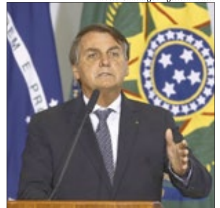
Presidente diz que empresas pretendem comprar 33 milhões de doses