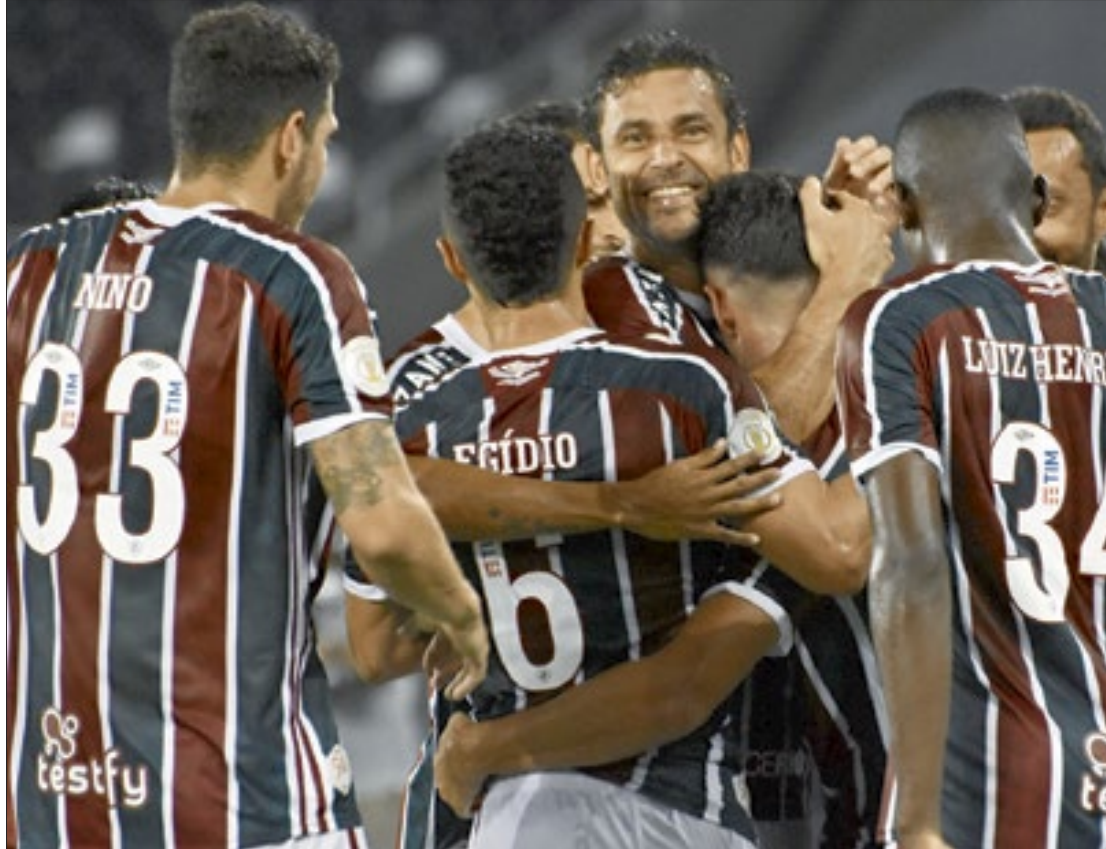
Vindo de uma grande vitória na última rodada, Flu quer hoje, contra o Bahia, dar mais um passo rumo à Libertadores