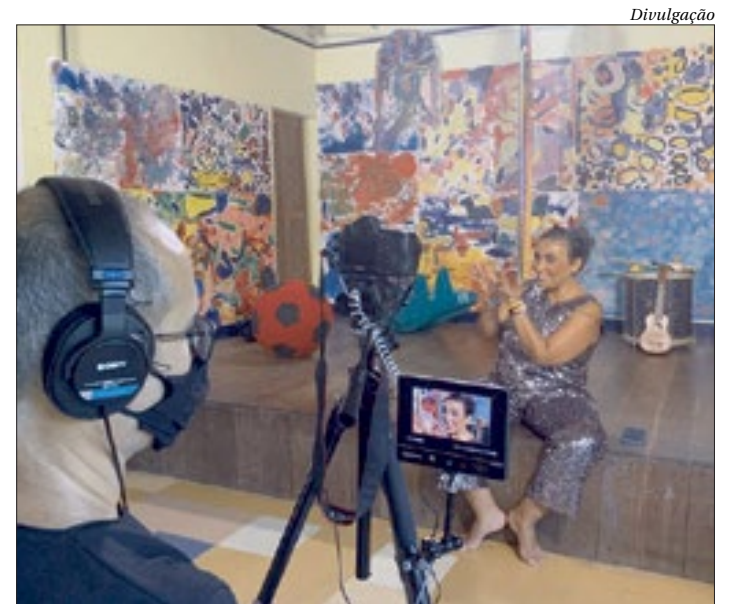
Bloco infantil carioca terá edições virtuais com oficinas de musicalização

Em vez de ganhar as ruas, o Bloco da Pracinha on-line será dividido em programas, com 10 minutos de duração cada, tendo como público alvo crianças até 10 anos que curtem carnaval, com seus pais. O primeiro estreia no YouTube, quarta (3), às 16h, e funcionará como um “esquenta”. Programação também terá momentos de interação com oficinas.