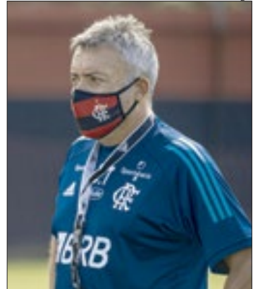
Domènec Torrent ficou apenas três meses no comando do Flamengo

“Acho que o problema do Flamengo está dentro do Fla-