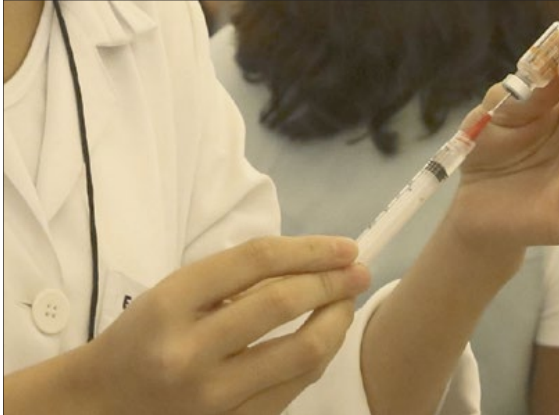
Niterói segue avançando na imunização da população, seguindo a oferta de doses disponibilizadas para o município

A Secretária Municipal de Saúde de Niterói informa que, em cada local de vacinação, há uma equipe da área do idoso para receber e encaminhar a pessoa ao local de vacinação, verificando a necessidade de