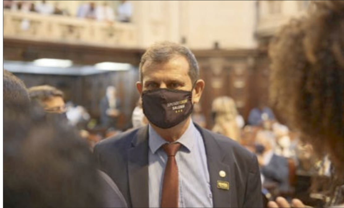
Salema apresentou projeto de lei dispondo sobre a obrigatoriedade de afixação de cartazes de combate à pedofilia

De acordo com dados emitidos pela Organização