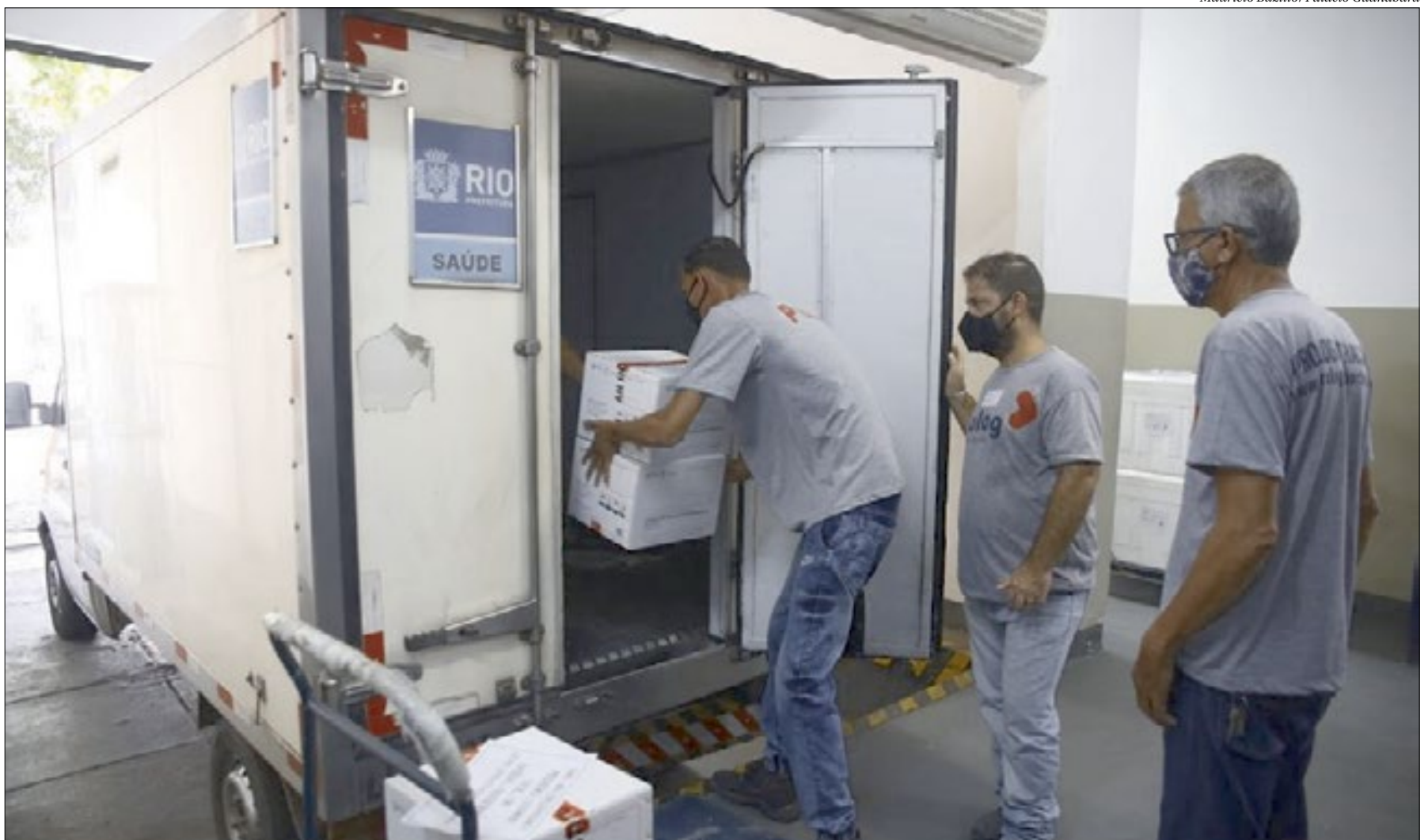
Caminhões saíram ontem pela manhã da Coordenadoria Geral de Armazenagem, em Niterói, carregados com a segunda dose da CoronaVac. Hoje, entrega vai continuar, por via aérea