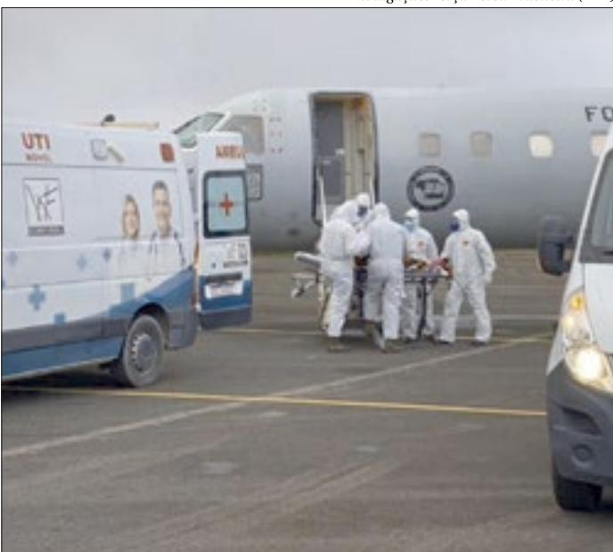
Segundo o governo, 424 pacientes foram transferidos para outros estados