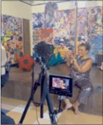
Bloco da Pracinha faz festa adaptada