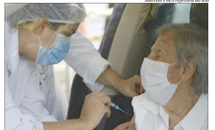
Idosos a partir de 75 anos podem ser vacinados até o final de fevereiro