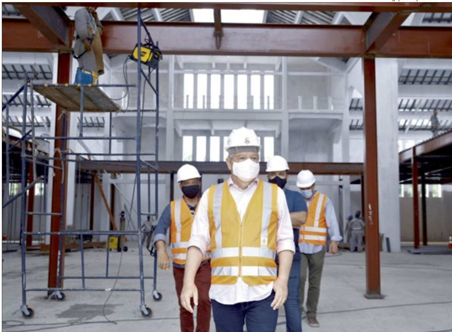
O prefeito de Niterói, Axel Graef, vistoriou as obras na sexta-feira e falou sobre o cronograma das intervenções. Em março deve ser concluída a recuperação do entorno

“As obras seguem avançando. O novo Mercado Municipal é umas das frentes de trabalho para a retomada da economia da nossa cidade. A revitalização do Mercado Municipal vai consolidar a centralidade de Niterói na Região Metropolitana e no interior do Estado. O Mercado ficou degradado por mais de 40 anos e está numa região