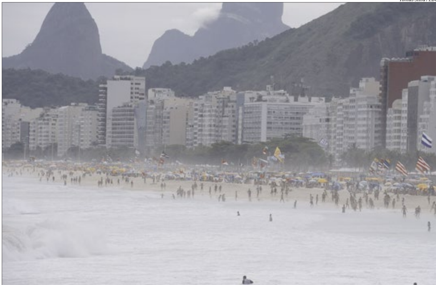
As 33 regiões administrativas da cidade do Rio seguem com risco alto para covid-19, segundo o quinto boletim epidemiológico da Prefeitura

De acordo com a Prefeitura do Rio, as medidas de proteção à vida não mudam, como a limitação da capacidade de lotação de estabelecimentos, com distanciamen-