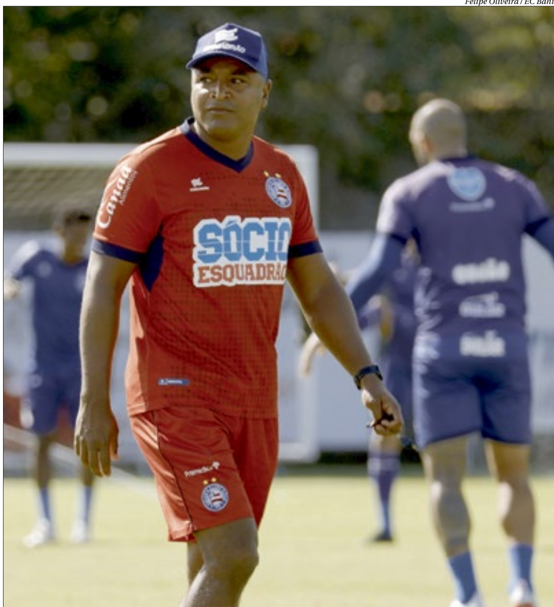
Último time treinado por Roger Machado foi o Bahia, de onde saiu em setembro de 2020 e ficou por um ano e cinco meses

Foco no Libertadores - O Fluminense ficou próximo de garantir uma vaga na próxima Libertadores. Os tricolores estão na quinta posição e já sonham com o G-4 do Campeonato Brasileiro.