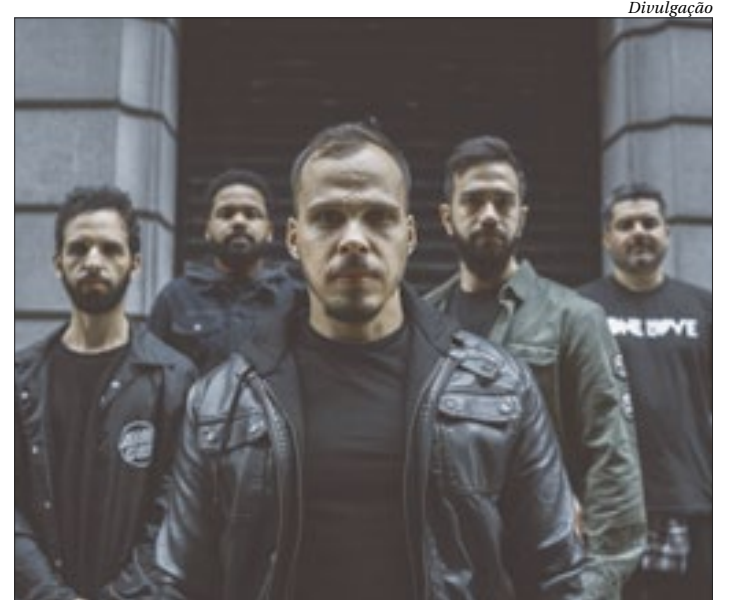
Strada Streita, de São Gonçalo, é finalista em concurso de Dinho Ouro Preto

O vencedor vai gravar uma canção no estúdio do artista. Para votar, o público deve acessar o canal do Dinho no Youtube, e clicar na aba 'Comunidade'.