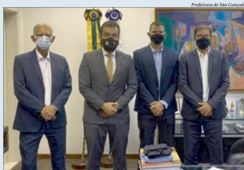
Prefeitura de São Gonçalo