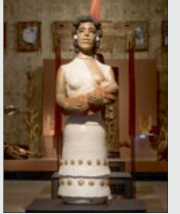
'Entre Fragmentos e Frestas' em cartaz no Museu Janete Costa