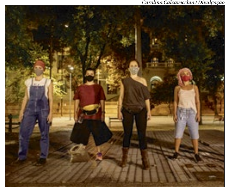
Cia Teatro Caminho levará espectadores para viver um thriller itinerante

Transmissão ao vivo no canal Teatro Caminho no Youtube.