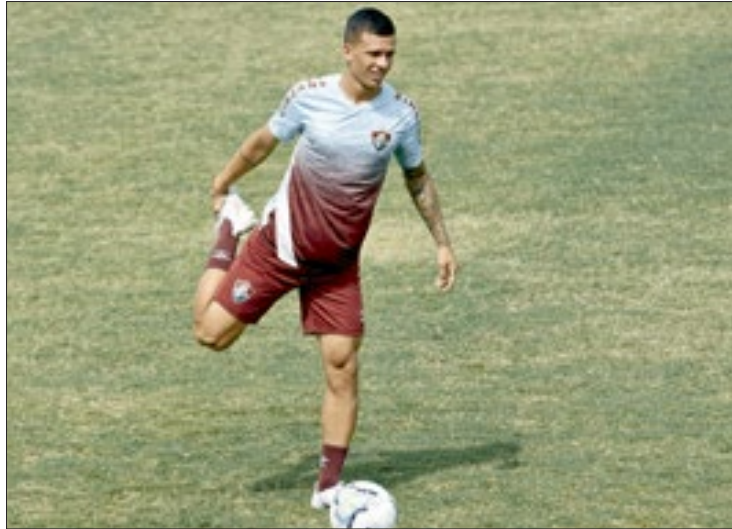
Perto de completar 19 anos, Calegari é um destaque da nova geração tricolor

“Foi uma temporada muito diferente das outras. Nós co-