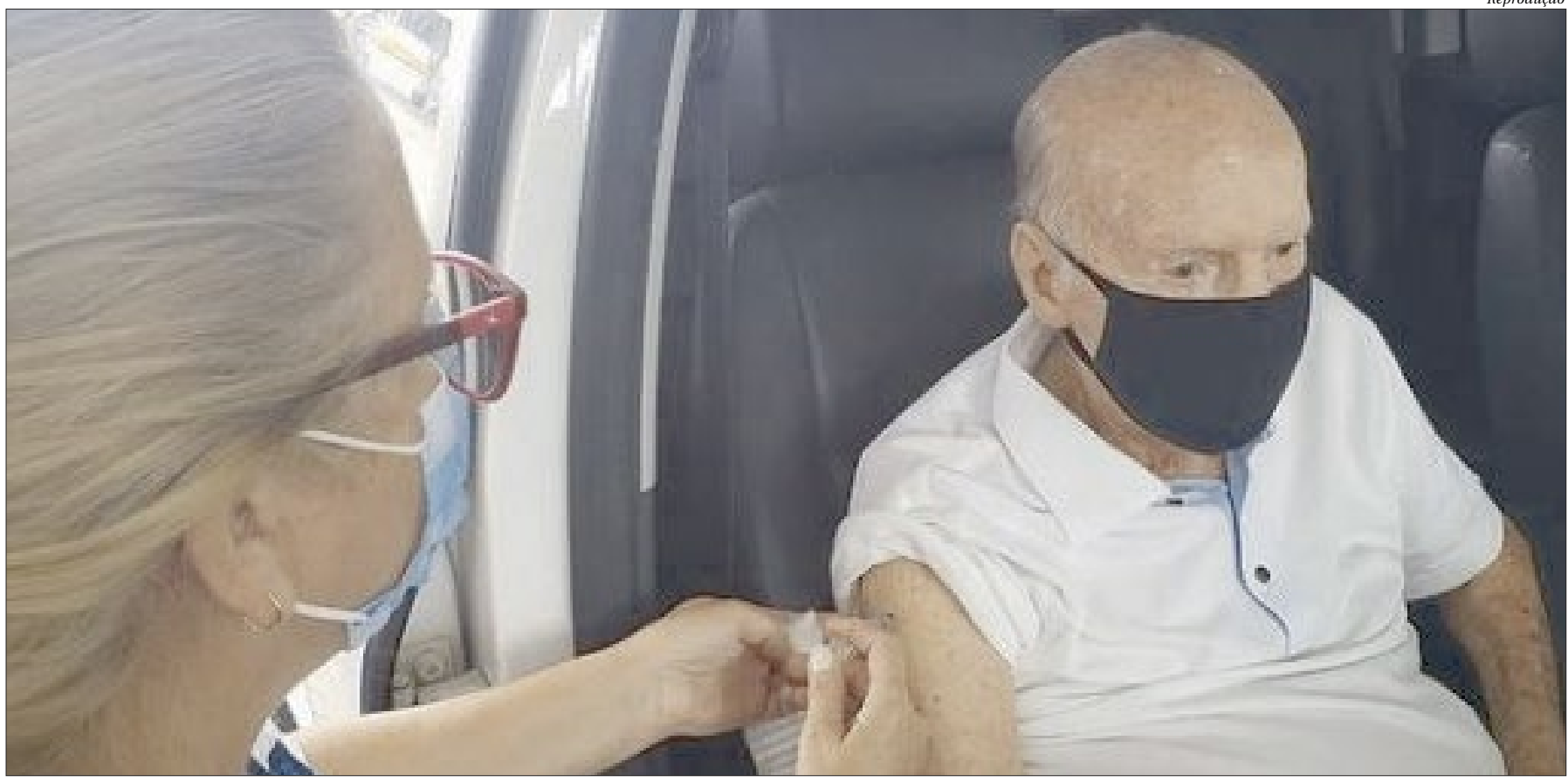
No Rio, porém, não há falta de doses e novo posto de vacinação começou a funcionar ontem, no Planetário. Aos 89 anos, Zagallo foi imunizado nesta segunda, no drive-thru a Vila Olímpica, na Barra

Municípios dizem que Governo do Estado não deu previsão para nova remessa de doses