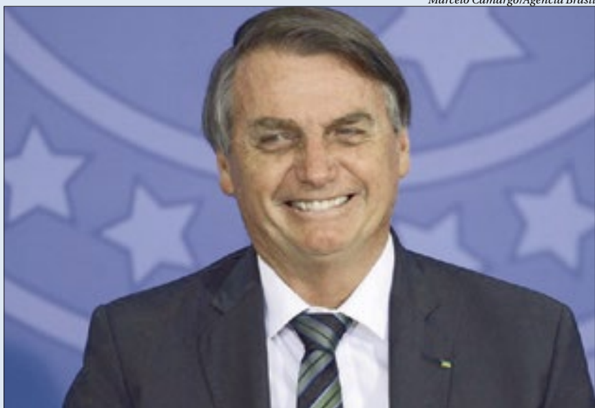
o presidente Jair Bolsonaro determinou apoio aos estados no combate à pandemia