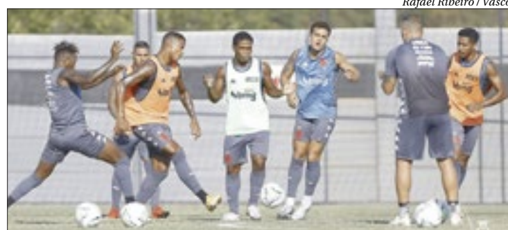
Jogadores do Vasco seguem preparação para enfrentar o Fortaleza amanhã

O Vasco tem uma decisão pela frente na briga para escapar do rebaixamento. E o duelo com o Fortaleza, no Castelão, ganhou ainda mais importância, pois o time carioca voltou para o Z-4.