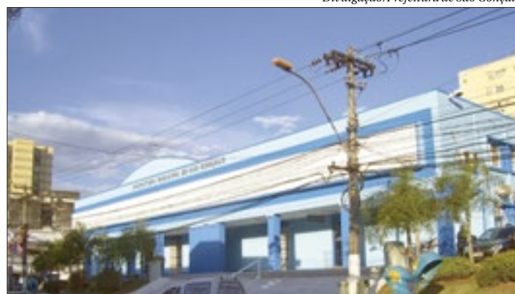
Apenas serviços essenciais continuarão funcionando no dia 15 deste mês

A medida vale para espaços públicos a partir de meia-noite desta sexta-feira, dia 12 de fevereiro, às 6h da manhã do dia 22 de fevereiro. O decreto também proíbe a realização de eventos em casas de fes-