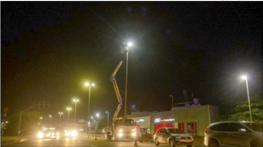
Todos os 450 mil pontos de luz da cidade passarão a contar com luminárias de LED até 2022: 60% de economia

“O Luz Maravilha está alinhado ao conceito de cidades inteligentes e vai permitir que o Rio alcance indicadores de conectividade em