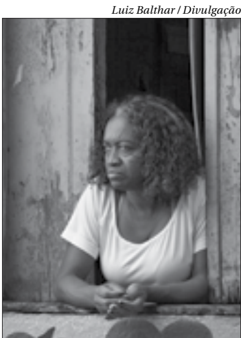
Série ‘Favelicidade’, de Luiz Baltar, terá menção honrosa nesta edição

O primeiro colocado vai ganhar uma viagem a Paris com direito a acompanhante. Inscrições abertas até 10 de abril, pelo site www.prixphotoaf.com.br.