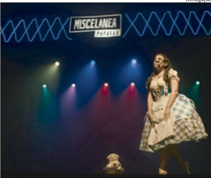
‘Miscelânea Popular’ fará apresentações em Niterói, Itaboraí e São Gonçalo

auxiliar na retomada das atividades culturais e proporcionar momentos de arte e entretenimento ao público. Os espetáculos serão apresentados de forma presencial, seguindo os protocolos sanitários e também transmitidos em vídeo pelas redes sociais do Miscelânea. Dúvidas podem ser esclarecidas pelo telefone/ whatsapp (21) 97043-4634 ou pelo e-mail contato@miscelaneapopular.com.br.