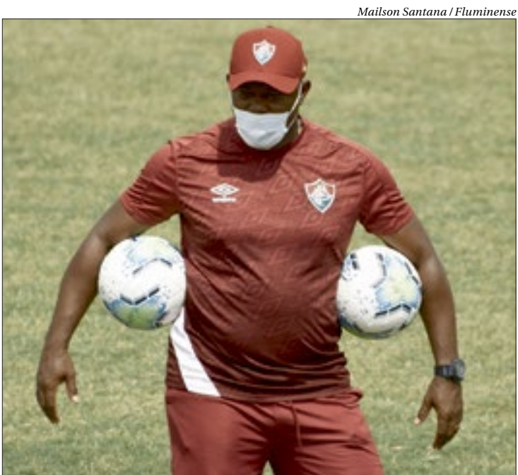
Marcão quer garantir vaga na pré-Libertadores no próximo jogo, contra o Ceará

O Fluminense terá a chance de conquistar seu objetivo na próxima segunda-feira, contra o Ceará, no Castelão. ■