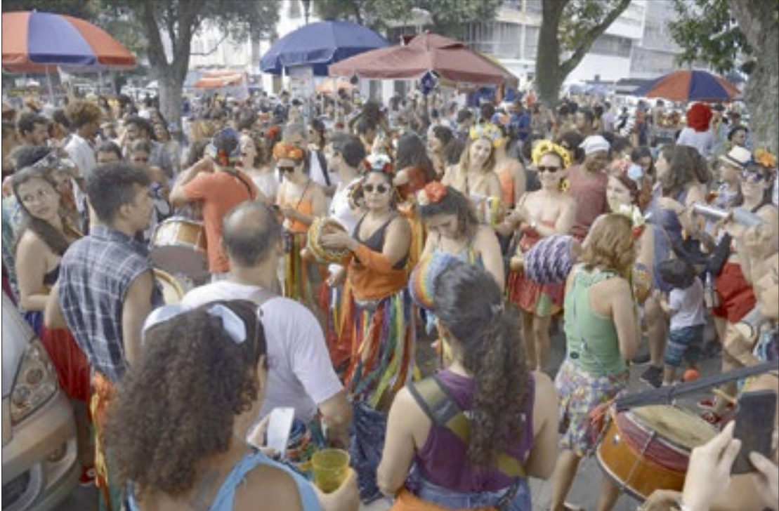
O Corpo de Bombeiros, por sua vez, vai reforçar as ações de fiscalização em eventos de reunião de público

Além de garantir a segurança pública, o planejamento da Secretaria de Estado de Polícia Militar para o feriado prolongado a partir do fim de semana terá um desafio a mais: coibir grandes aglomerações de público e, assim, evitar propagação da Covid-19. Elaborado pela Subsecretaria de Gestão Operacional, o plano prevê o emprego de 13.828 policiais militares, entre sábado (13) e terça (16), e de duas mil viaturas circulando diariamente em todo o estado. O Corpo de Bombeiros, por sua vez, vai reforçar as ações de fiscalização em eventos de reunião de público. As vistas noturnas, que já acontecem de quarta a domingo, serão estendidas para a segunda e a terça. Os militares de todos os quartéis estarão de sobrevisão para atender os chamados via denúncia da população. De acordo com o decreto 47.345 de 5 de novembro de 2020, os produtores de eventos devem garantir o distanciamento social, o uso de máscara facial, a utilização de álcool 70% e a lotação máxima de 50% da capacidade total. Na capital, cujas regras para o feriado prolongado foram estabelecidas pelo Decreto Municipal 48.500, os policiais militares atuarão