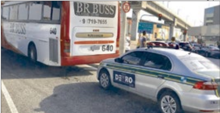
Neste primeiro dia, um ônibus foi flagrado realizando transporte irregular

O Departamento de Transportes Rodoviários do Estado do Rio de Janeiro (Detrol-RJ) iniciou, na quinta-feira (11), a operação "Carnaval". A ação visa coibir o transporte de passageiros sem autorização do poder concedente, além da verificação em terminais rodoviários. A ação continuará ocorrendo ao longo de todo o feriado prolongado e conta com o apoio da Polícia Militar. Neste primeiro dia, um ônibus foi flagrado realizando transporte irregular próximo à Rodoviária do Rio. A atividade remunerada sem autorização do poder conce-