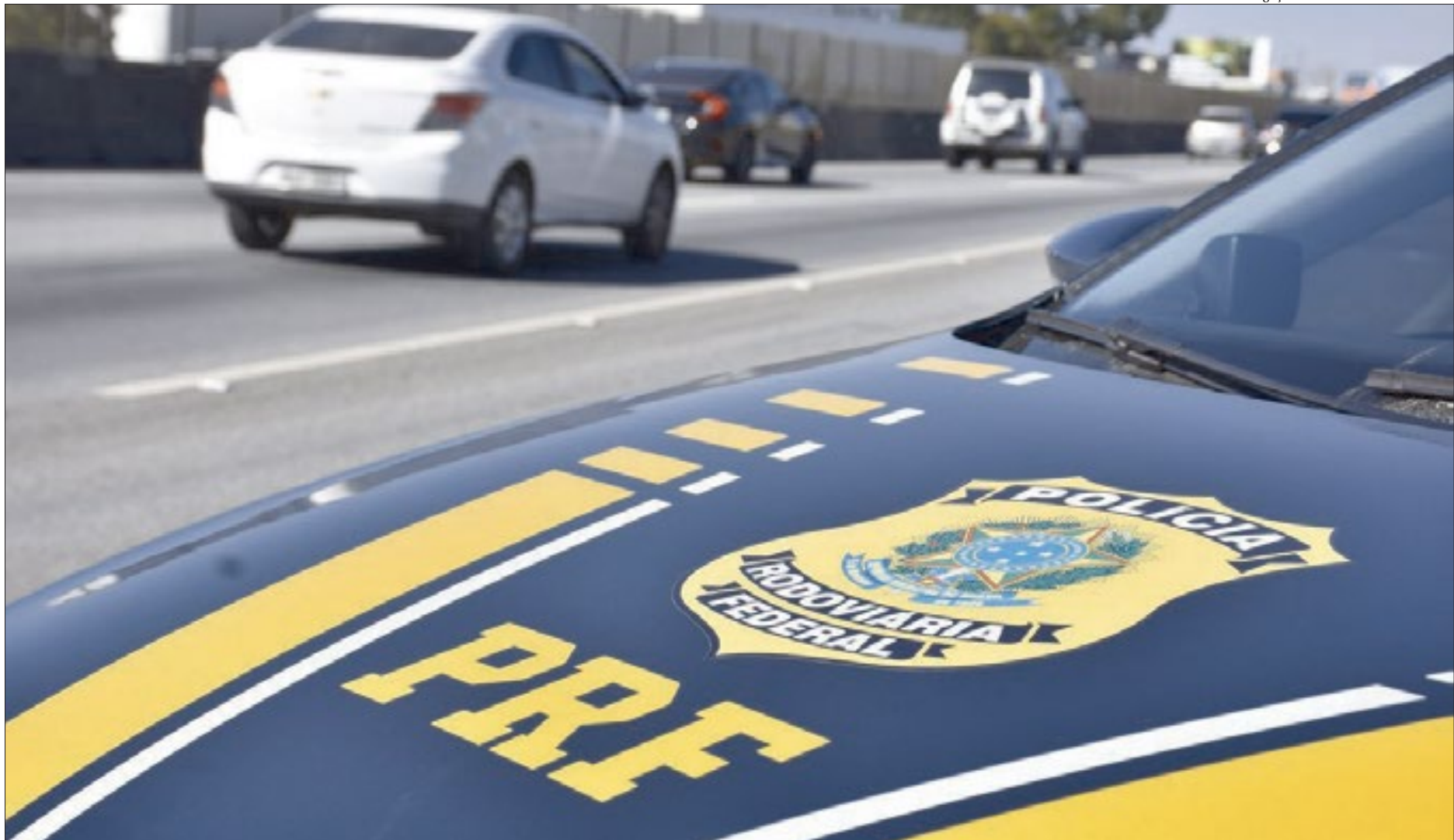
Mesmo com a pandemia, a PRF tem a expectativa de aumento no fluxo rodoviário em comparação aos dias comuns. Objetivo da ação é prevenir acidentes e evitar mortes nas estradas

Além disso, a polícia lembra que também é necessário respeitar os limites de velocidade e a sinalização das rodovias, evitar a ingestão de bebidas alcoólicas e manter distância de segurança em