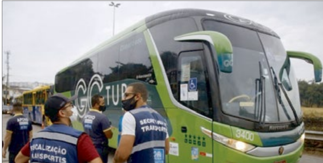
Os bloqueios são para coibir aglomerações durante o período de carnaval e, assim, evitar a disseminação da covid-19

A exceção é para veículos que prestem serviços regulares para funcionários de empresas ou para hotéis, cujos passageiros comprovem, neste caso, reserva de hospedagem. ■