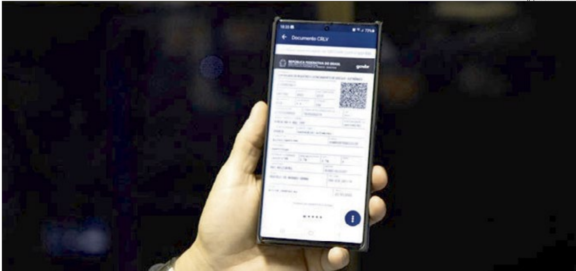
Após a compensação das taxas, o usuário estará apto a usar o documento digital, chamado de CRLVe. O acesso pode ser feito pelo aplicativo Carteira Digital de Trânsito ou pelo site do Denatran

- Final de placa 7, 8 e 9 => Até 30/04/2021