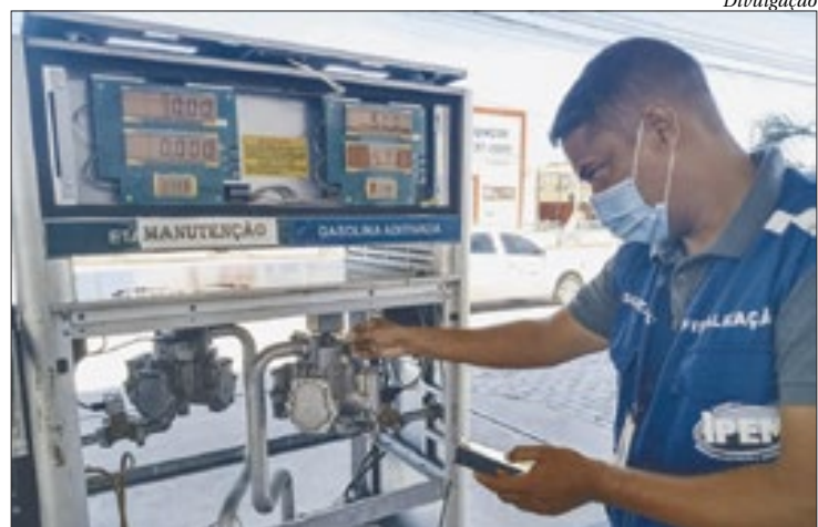
Ao todo, 491 instrumentos entre bombas e balanças foram aferidos pelo órgão

A perícia de produtos será realizada no Laboratório Pré-Medidos do Instituto. Segundo o órgão, produtos pré-medidos são todos aqueles produtos embalados