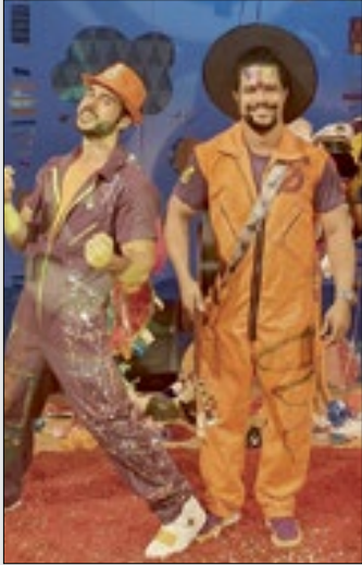
Violúdico faz show infantil de carnaval hoje, na TV Brasil