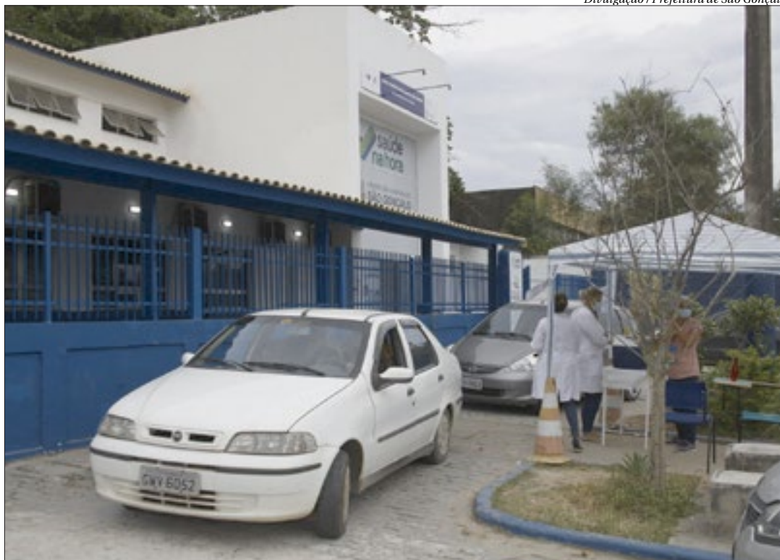
Postos de vacinação em São Gonçalo vão funcionar durante o carnaval e contarão com atendimento drive-thru

"Devido à emergência da vacinação, a quantidade de doses recebidas e a procura nas unidades de saúde no primeiro dia de retorno da vacinação para os profissio-